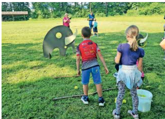
V športnem parku Kokrica so za otroke pripravili mamutove igre.