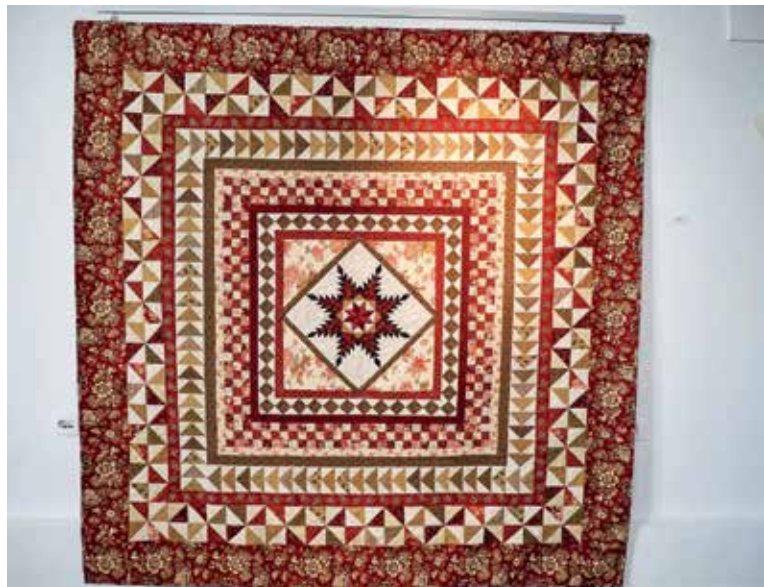
Krpanka Marjetke Gale, ki jo je poimenovala Za kralja. Uporabna je kot posteljno pregrinjalo.

Razstava krpank je prikazovala čudovite uporabne in dekorativne tekstilne izdelke, med njimi prvič tudi ob-