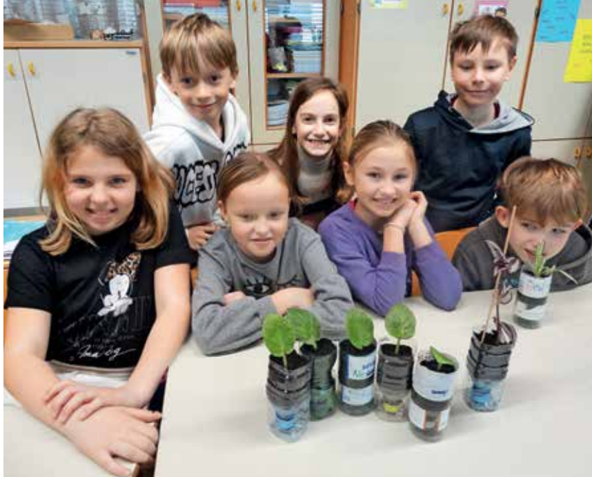
Učenci so spoznali tudi, kako razmnoževati okrasne rastline, nato pa posadili potaknjence sobnih rastlin.

»S sodelovanjem v projektu smo pridobili dragocene izkušnje za delo z učenci naše šole,« sta poudarili