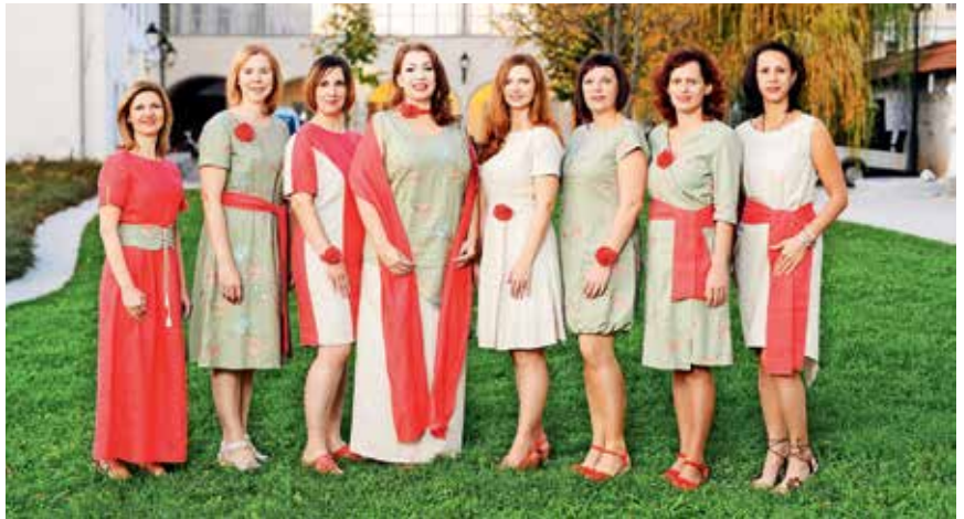
Dečve ob petindvajsetletnici vabijo na prav posebno doživetje Kresne noči.