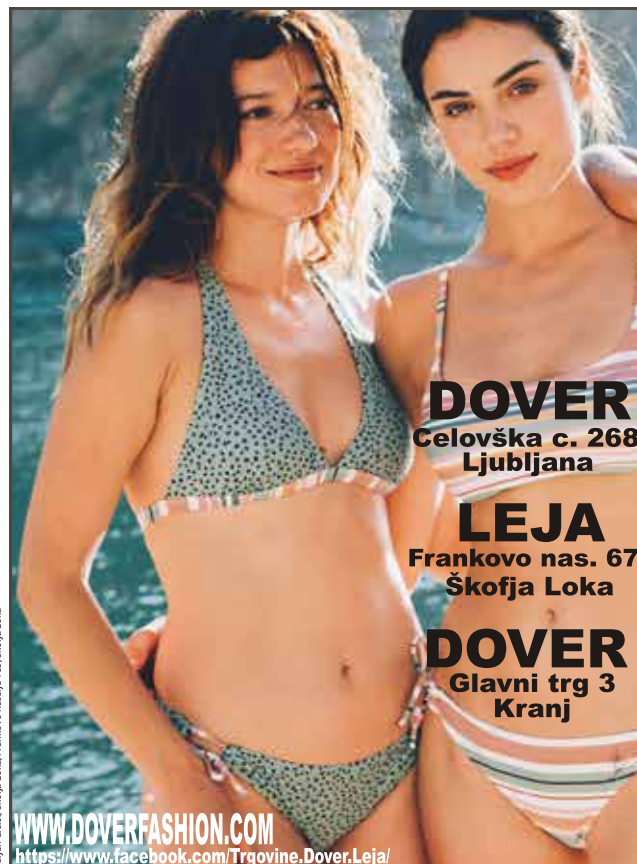
Hajnen d.o.o. Škofja Loka, Frankovo naselje 165, Škofja Loka