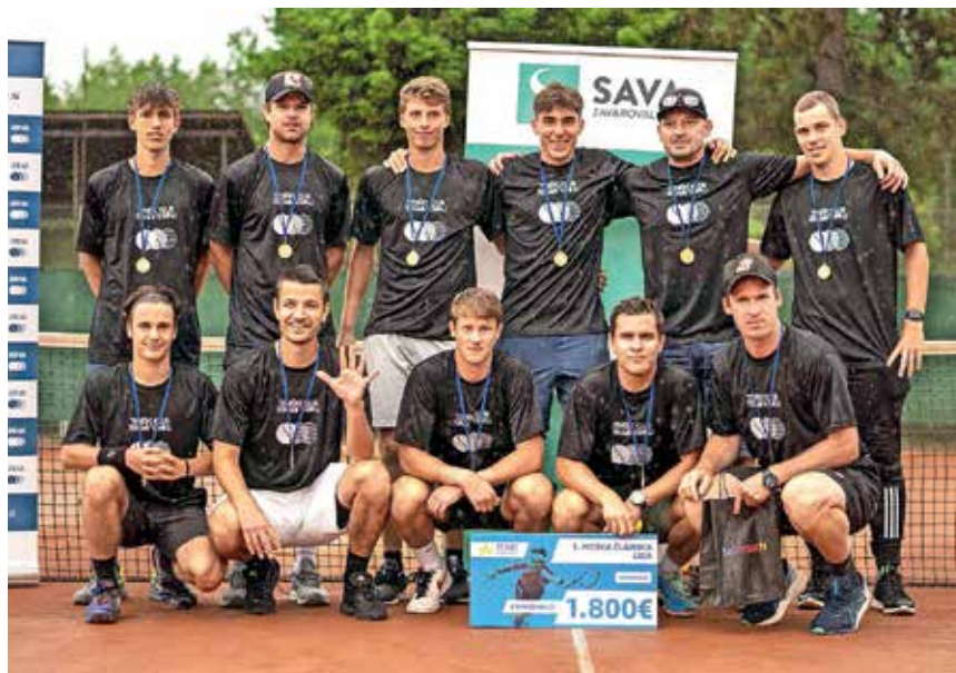
Zmagovalci Telemach 1. moške članske teniške lige 2023

Dekleta bodo nastope v prvi slovenski ligi začela konec meseca.