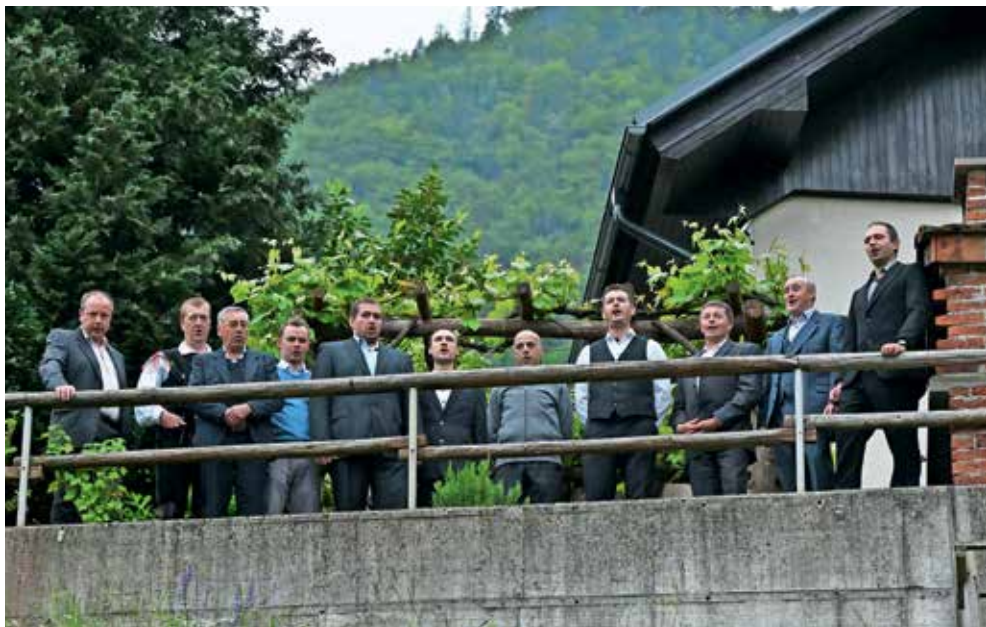
Murnovi godci Pri Murnu

Začeli so Murnovi godci, nastopili so člani FS Mali Vrh Nemilje - Podblica. Potem so se od Skalarja ob ljudski glasbi nastopajoči in gledalci