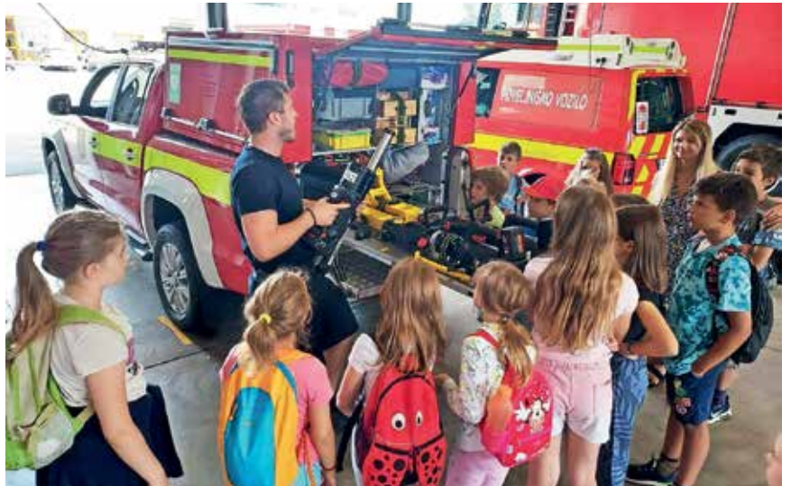
Utrinek z lanskimi počitniškimi aktivnostmi

Počitniške aktivnosti so namenjene otrokom od 6. do 12. leta starosti, potekajo pa od 8. do 16. ure in vključujejo kosilo. Na vsaki lokaciji bodo v posameznem tednu sprejeli do 15 otrok. Prispevek staršev znaša