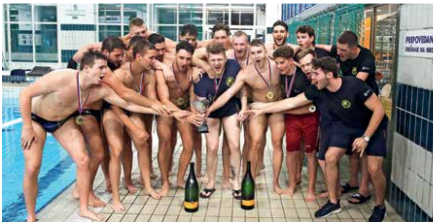
Najboljši v državi so že osemnajstič. / Foto: Gorazd Kavčič

Nekaj dni po koncu državnega prvenstva se je v Kranju že zbrala reprezentanca. Pod vodstvom Štromajerja se pripravlja na kvalifikacije za evropsko prvenstvo 2024, ki bodo