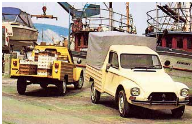
Tovorno različico – diano DAK (diana avto kombi), so izdelovali v koprskem Cimosu.

Tudi novi in moderni C3 posebejla svoboden duh in edinstven stil majhnih limuzin tipa »spačka« in diane.