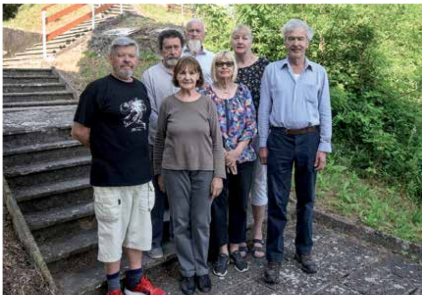
Likovniki Jasne so že večkrat ustvarjali v Strunjanu.

Likovna dela nastala v Strunjanu bodo razstavljena na več razstaviščih v letu 2024, ko bo na sporedu tudi jubilejno, dvajseto likovno srečanje Jasna.