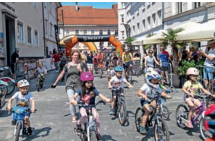
Kolesarili so tudi najmlajši.

Zadnjo nedeljo v maju je v Kranju potekal Scottov kolesarski dan v organizaciji Kolesarskega kluba Kranj in Prologo Trade. Letošnji je bil že sedmi po vrsti. Prvi so se na kilometer dolgo progo otroškega maratona podali najmlajši, nato pa so startali še udeleženci družinskega maratona, ki so prevozili 12, 21 ali 30 kilometrov. Potekal je tudi pester spremljevalni program. Kranj bo znova v znamenju kolesarstva 22. in 23. julija, ko bo Velika nagrada Kranja. M. B.