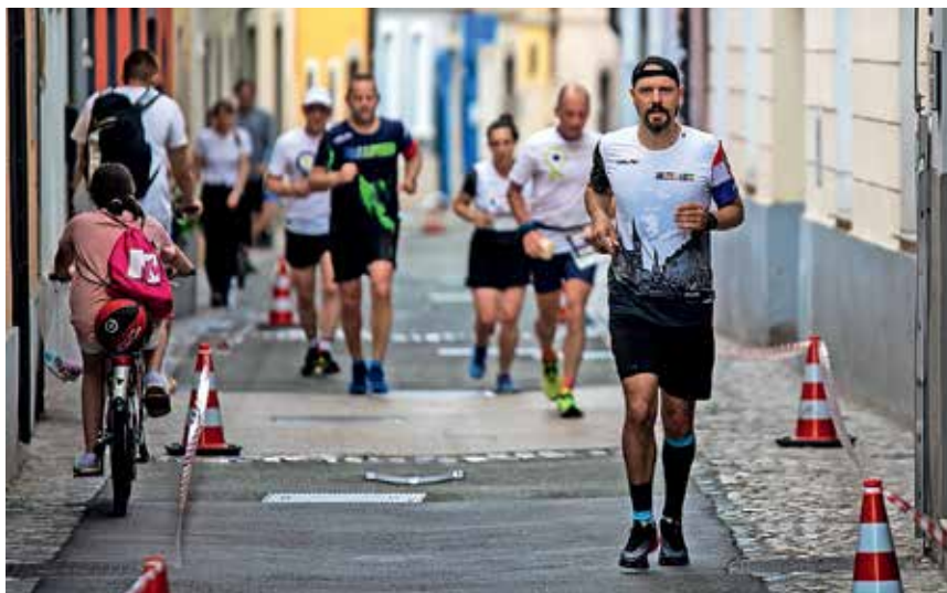
Pol dneva so krožili po ulicah Kranja.