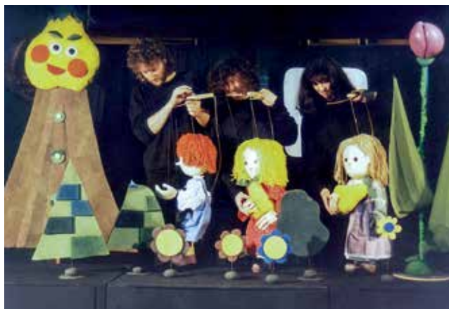
Tridesetletna Hruška je še vedno nagajiva.

Predstava je še danes zelo aktualna, saj gre v veliki meri za prebujanje otrokovega odnosa do okolja. V one-