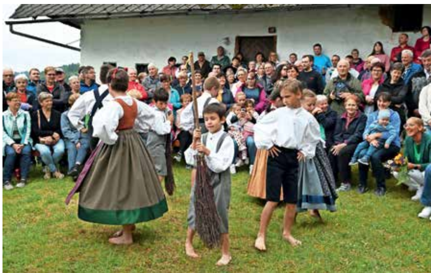
Otroške igre in plesi Pri Medvedu

Sklepno dejanje celotne prireditve je bilo na dvorišču Pri Murnu. Murnovi godci so zapeli, folklorniki zaplesali, iz kotla pa je zadišal domači pasulj. Zbrana družčina je pela, plesala in se veselila še dolgo v noč.