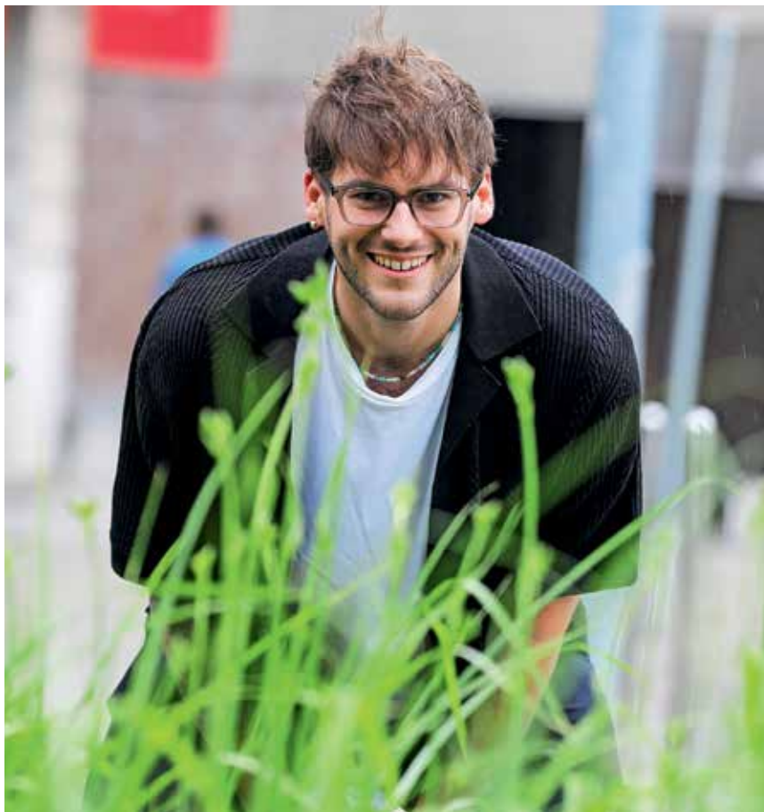
... pozitivne energije ima več kot dovolj. / Foto: Tina Dokl

Ko sem prišel v skupino, smo se s fanti takoj začeli pogovarjati, ali bi šli na letošnjo Emo. Odločili smo se, da gremo. Vedeli smo, da bi bili zagotovo med favoriti, ker imamo res veliko in izjemno zvesto občinstvo. No, potem Eme ni bilo. Strokovna komisija se je namreč odločila, da