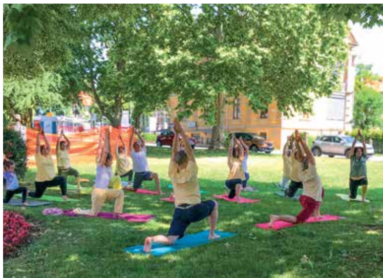
Brezplačna vadbe joga v parku La Ciotat v Kranju bo v sredo, 21. junija, ob 17.30.

P raznovanju 9. mednarodnega dneva joga, ki bo v sredo, 21. junija, se bo pridružilo tudi Društvo Joga v vsakdanjem življenju Kranj, in sicer z organizacijo brezplačne vadbe joga v parku La Ciotat z začetkom ob 17.30. V primeru dežja bo vadba v prostorih društva (Maistrov trg 11). »Vadba bo vodena in je namenjena vsem. Predhodno znanje ni potrebno. S sabo prinesite le vadbena podlago in bodite oblečeni v udobna oblačila,« so sporočili iz društva. Vadba v parku, na katero vabijo že od leta 2015, je vedno dobro obiskana. »Mlajši, starejši in tudi otroci na zelenici pod senco velikega drevesa izvajajo jogijske vaje, ki med vadečimi ustvarijo prijetno sproščeno vzdušje. Udeležijo se je naši redni člani in tudi drugi,« so pojasnili in poudarili, da je vadba joga preprosta, praktična, pa vendar zelo učinkovita metoda,