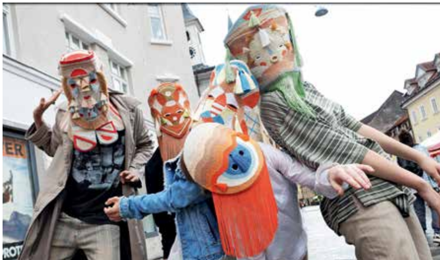
Na ulicah starega kranjskega mestnega jedra je potekal Maskenbal – iskrivo, živahno, navihano ...

Nedavni festival Kalejdoskop v organizaciji Kulturnega društva Qulenium je znova ponudil pisano paleto sodobne odrske ustvarjalnosti ter v gorenjsko prestolnico prinesel pridih poletja.