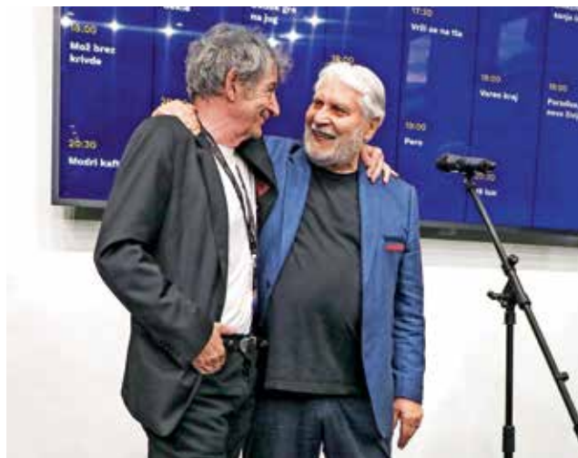
Prijatelja in igralski legendi: Miki Manojlović in Boris Cavazza