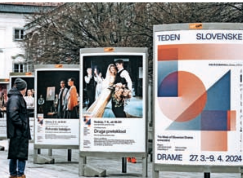
Še malo in v Kranju bosta na sporedu dva najbolj gledališka tedna v letu.

Čez teden dni pa se gledališko vzdušje seli v Kranj. Med 27. marcem in 9. aprilom bo v Prešernovem gledališču in na drugih prizoriščih v Kranju potekal 54. Teden slovenske drame. V tekmovalnem in spremljevalnem programu se bo zvrstilo 12 predstav, v dodatnem programu pa 14 dogodkov, med njimi tri predstave, namenjene mlademu občinstvu, ekskluzivni festivalski preddogodek, filmska projekcija, koncert, dnevi nominirancev in bralne uprizoritve ter tematski pogovori, poleg teh pa še premiera nove uprizoritve v letošnji sezoni Prešernovega gledališča Kranj. Podelili bodo tudi strokovne nagrade in nagrade Tedna slovenske drame.