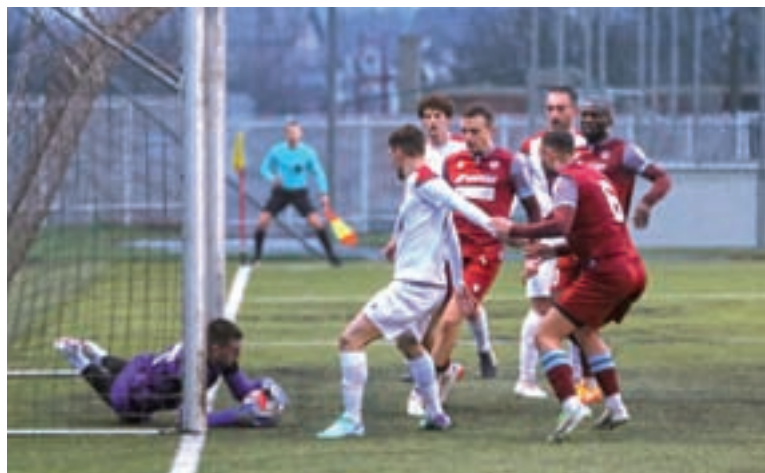
Nogometaši Triglava so na prvi domači tekmi pomladnega dela sezone premagali ekipo Tolmina.

Čeprav so Kranjčani prvo tekmo pomladnega dela pri Krki izgubili, pa so nato doma z 2 : 0 premagali moštvo Tolmina. Prav tako so se veselili uvrstitve v četrtfinale pokalnega tekmovanja, saj so v osmini finala v gosteh premagali ekipo Podvincev. Četrtfinalno tekmo pokala z Rogaško bodo igrali doma v torek, 2. aprila.