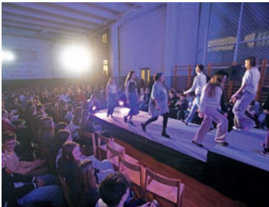
Dobrodelna modna revija Gimnazije Kranj

še sporočilo Hospica: da nikomur ni treba biti sam, ko se počuti povsem izgubljeno in strto. Strokovna sode-