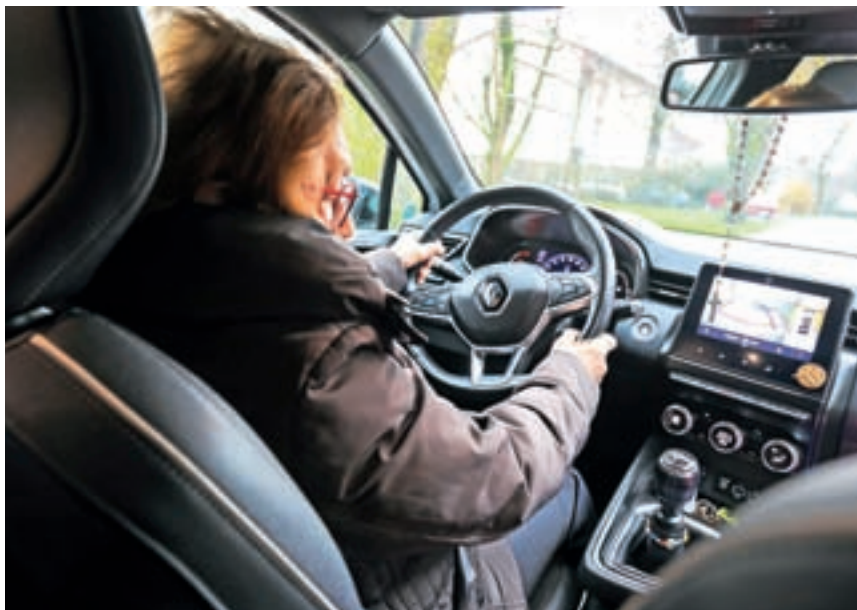
Vožnja naj bo varna tudi v zrelejših letih življenja. Fotografija je simbolična.

V AMZS sicer pri večini kandidatov, ki prihajajo v njihov Center varne vožnje na Vranskem po napotilu zdravnika, zaznavajo pešanje tako fizičnih kot kognitivnih sposobnos-