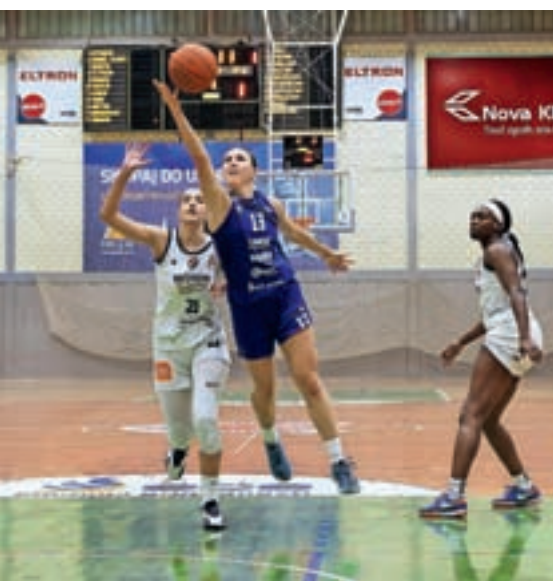
Članice so si v Kranju priborile finale v pokalu Alpe Adria.

trtina je bila precej izenačena, v drugo četrtino so ilirjanke vstopile bolj razigrane in si vsako četrtino priborile večjo prednost. Na koncu so državne prvakinje postale košarkarice Akson Ilirije, ekipa Triglava pa je osvojila drugo mesto in si zaslužila srebrna odličja.