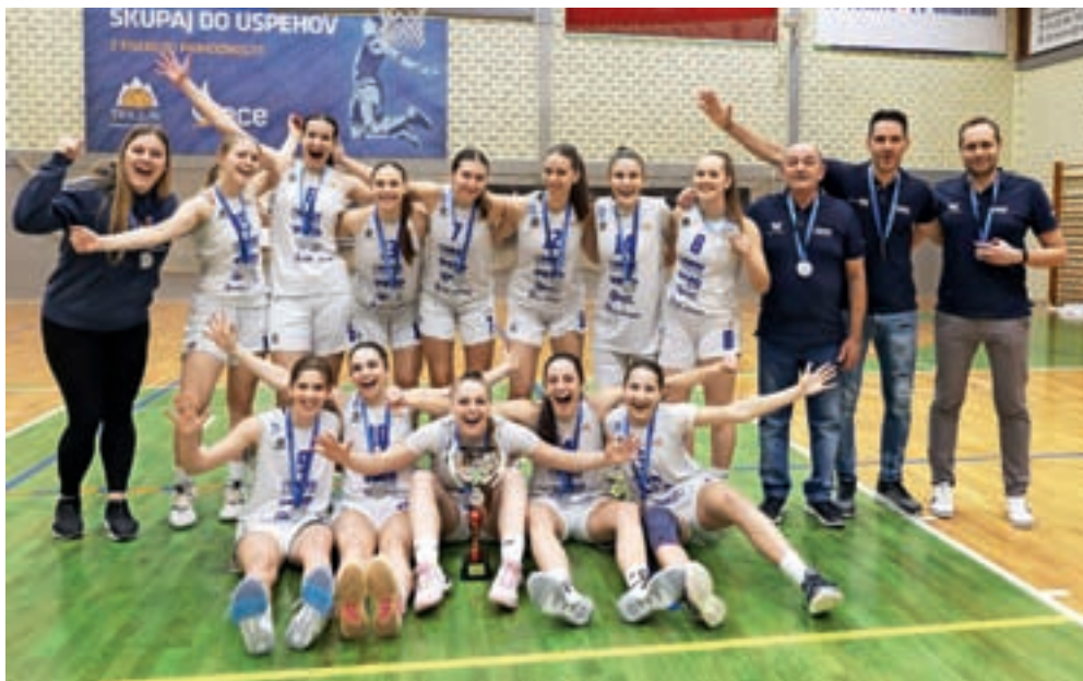
Ekipa košarkaric Triglava do 20 let se je v domači dvorani veselila drugega mesta.

Vrhunec košarkarskega konca tedna je bila finalna tekma med ekipo Triglava in Akson Ilirijo. Prva če-