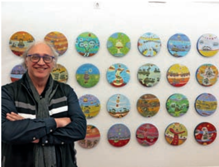
Klavdij Tutta ob delih iz cikla Prebujanje dneva

stajanja likovnih del, hkrati pa tudi prisluhnejo njihovim mnenjem in komentarjem na temo razstavljenih del.