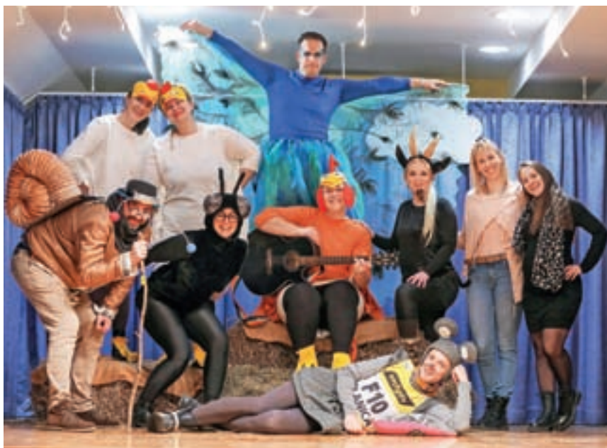
Teater za starše iz enote Kranjskih vrtcev Ježek na Trsteniku je pripravil avtorsko predstavo Poletimo skupaj.