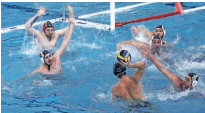
Ekipa Triglava si je zagotovila gol prednosti.

la z izidom 2 : 2. Izenačena je bila tudi tretja četrtina. Slabe štiri minute pred koncem tekme so Kranjčani vodili z 10 : 7, toda prednosti treh golov niso ubranili. Dvanajst sekund pred koncem tekme je prednost igralca več izkoristil tudi Nikola Rajlić, namesto da bi Kranjčani v Švicco odšli s prednostjo vsaj