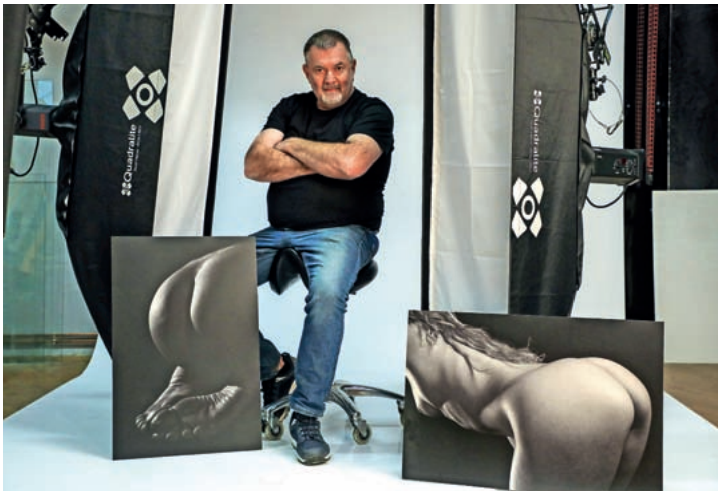
Mojster ženskega akta / Foto: Tina Dokl