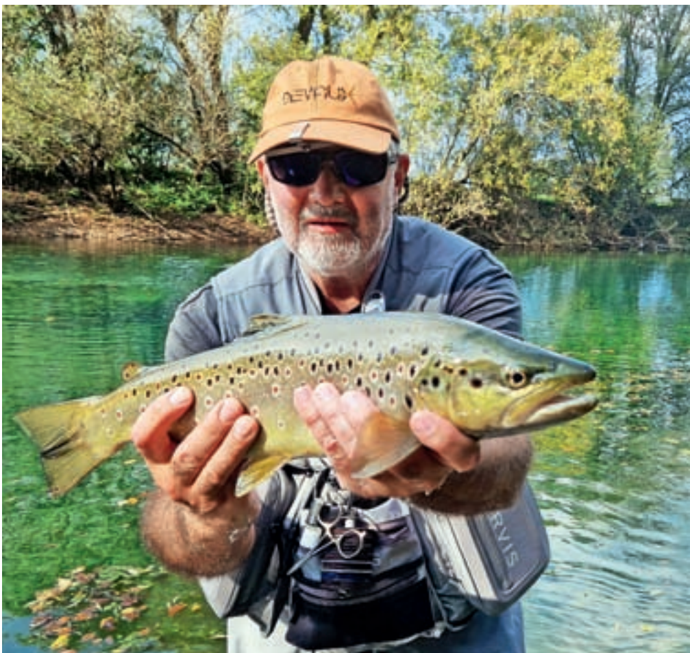
Ribolov je njegova velika strast.

V »Jugi« se je takrat živelo »bogovsko«, tudi danes v Sloveniji se v primerjavi z drugimi deli Evrope živi dobro.