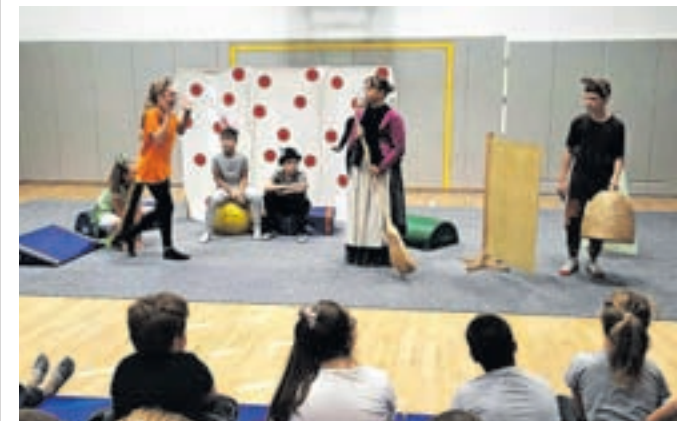
Gledališka skupina je navdušila.

drugem nadstropju razredne stopnje so učenci preživljali aktivne odmore z različnimi talnimi igrami, kot so ristanc, križci in krožci, spomin, poligon nogic ... Prvi razredi so se preizkusili v plezanju na plezalni steni na Stari Savi, učenci drugih razredov so si ogledali predstavo Mojca Pokrajculja, učenci tretjih razredov so dobili dodatno uro športa s peštrim poligonom. Učence četrtilnih razredov je obiskal predstavnik društva Bioexo,