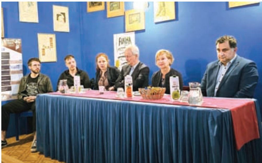
Na novinarski konferenci so predstavili letošnje Čufarjeve dneve in domačo premiero komedije Finida.

Na uvodni večer so občinstvo že navdušili domači gledališčniki z uspešnico Kajmak in marmelada, sredin večer je zaznamovala izvrstna komedija v izvedbi Loškega odra Škofja Loka Predstava Hamleta v vasi Spodnja Mrduša, četrtkovega pa satira Salto mortale v izvedbi Kulturno-umetni-