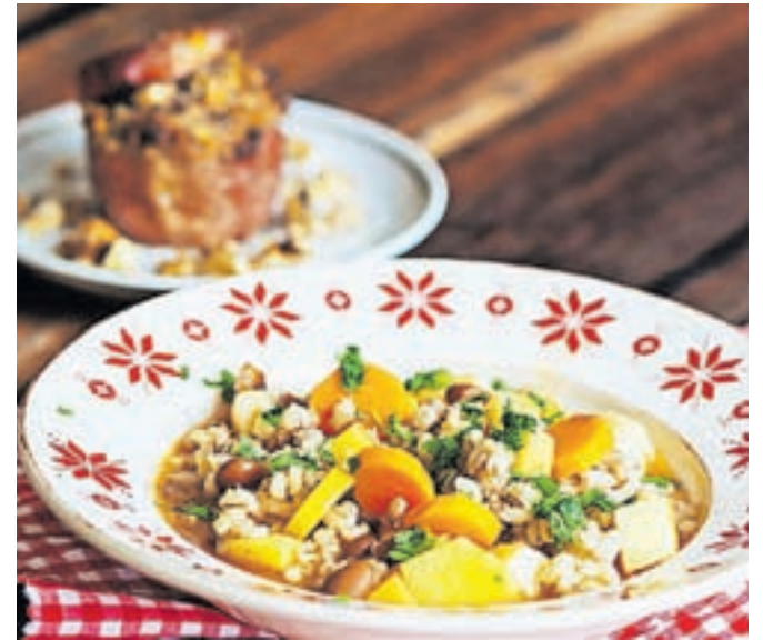
Zelenjavni ješprenj in pečena jabolka z orehi in medom

Sestavine: 4 jabolka, 8 žlic sesekljanih ali grobo mletih orehov, 2–3 žlice medu, 4 žlice suhih brusnic ali drugega suhega sadja, zvrhana žlička mletega cimeta Priprava: Pečico vključimo na 200 stopinj. V posodi zmešamo mlete orehe, med, cimet in brusnice. Jabolkom odrežemo pokrov in jih previdno izdobljemo z žlico. Pazimo, da ne izdobljemo preveč, stena jabolk naj bo