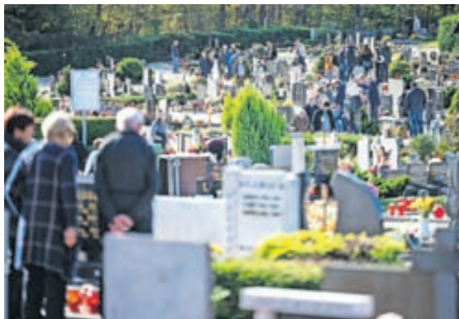
Pokopališče na Blejski Dobravi ob prvem novembru

sveče. Potekalo pa je tudi več spominskih slovesnosti, ki jih je pripravilo Združenje borcev za vrednote NOB Jesenice. Potekale so v Spominskem parku na Plavžu, v Parku talcev na Koroški Beli, v Brezovem gaju na pokopališču na Blejski Dobravi in pri spomeniku v Planini pod Golico.