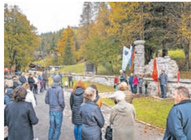
Komemoracija v Planini pod Golico