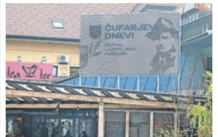
Prikazovalnik na Čufarjevem trgu

ma sodoben digitalni zaslon. Na njem vabijo na Čufarjeve dneve, v prihodnje pa bo omogočal objave aktualnih dogodkov in celo prenose.