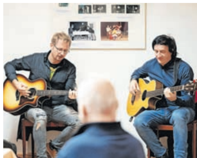
V kulturnem programu so obiskovalci prisluhnili Francijevi poeziji v glasbi in besedi.

skih predstav, predvsem komedij. Pomembno sled je pustil kot pesnik z več samostojnimi pesniškimi zbirkami in proznimi deli. Na razstavi je bilo veliko fotografskega gradiva o njegovih vlogah na odru, režijah in priznanjih, ki jih je prejel. Njegovo delo so prepoznali širše, pred leti je prejel Linhartovo plaketo, najvišje priznanje Javnega sklada Republike Slovenije za kulturne dejavnosti na področju ljubiteljske gledališke dejavnosti. Na odprtju so prebrali več njegovih pesmi in skupaj z jubilarantom obujali spomine na njegovo dolgoletno udejstvovanje v kulturi.