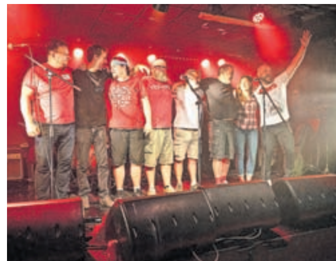
Jeseniška zasedba Guni se bo tokrat predstavila v akustični verziji.