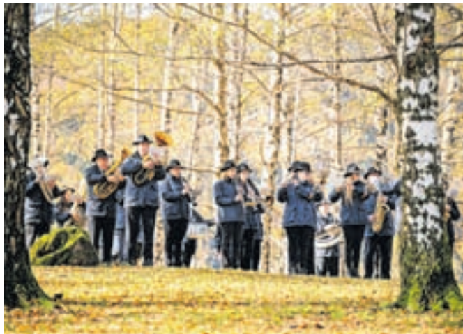
V Brezovem gaju je zaigral Pihalni orkester Jesenice - Kranjska Gora.