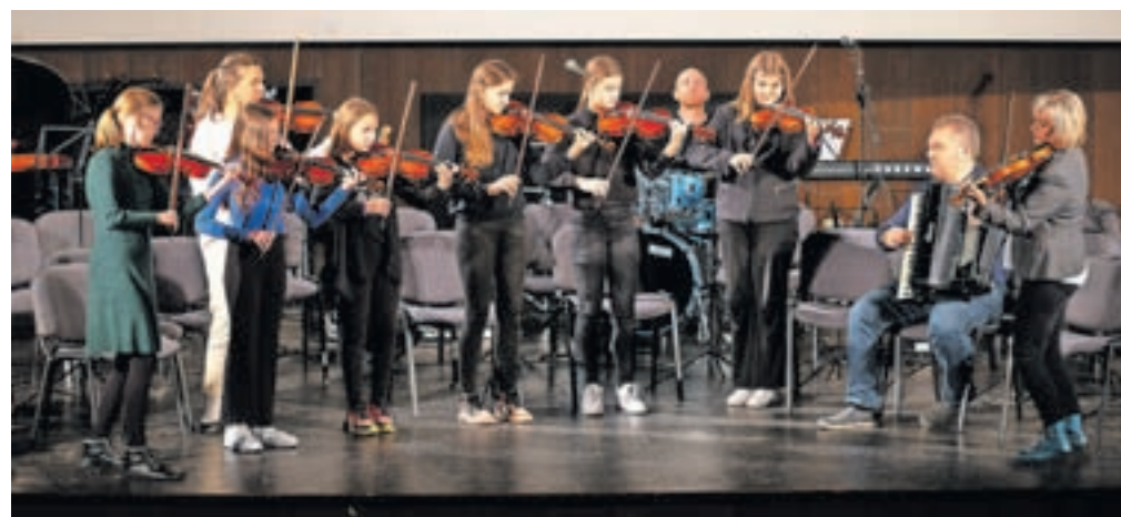
Petelinje kolo – Petlič kolo