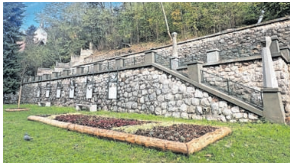
Pred kratkim so v parku posadili trajnice in grmovnice, ki bodo polepšale ta del mesta.

in življenju na Jesenicah pod skupnim nazivom Spomini starih Jesenic med Kosovo graščino in nekdanjim hotelom Korotan ter vse do Hrenovce. Še pred tem so