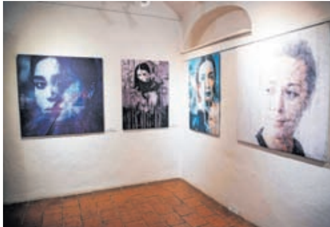
Na razstavi so med drugim na ogled dela iz starejših serij, katerih osnova so predvsem portreti.

talno grafiko, v tokratno razstavo pa je vključil nekatera dela iz starejših serij, katerih osnova so predvsem portreti, z najnovejšimi deli pa se s serijo Fruits of passion posveča nekakšnim sodobnim tihožitjem.