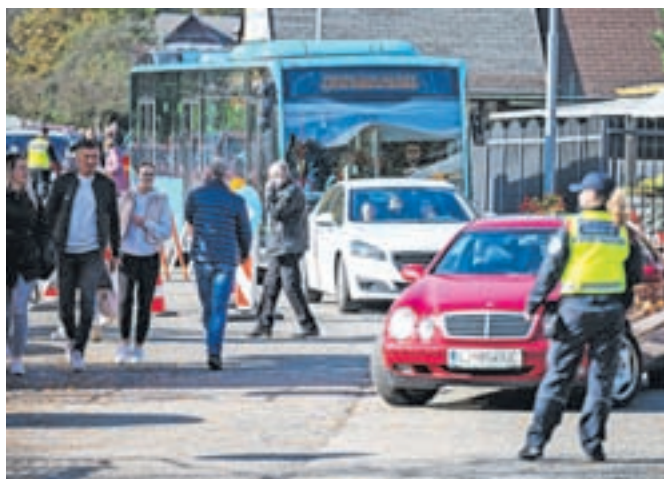
Občina Jesenice je poskrbela za dodatne avtobusne prevoze do pokopališča.