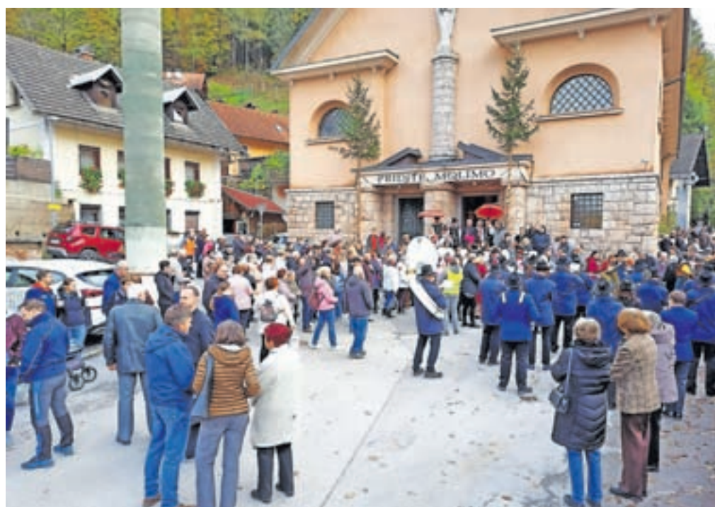
Z zahvalno sveto mašo so v soboto, 4. novembra, v cerkvi svetega Lenarta na Jesenicah zaokrožili praznovanje 500-letnice župnije.