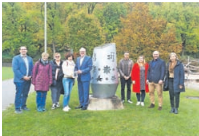
Ob skulpturi plavža v Nagoldu, pri izdelavi katere so sodelovali tudi dijaki Srednje šole Jesenice

so sodelovali tudi dijaki Srednje šole Jesenice. Kot načrtujejo, bo aprila prihodnje leto Jesenice obiskala skupina učiteljev Annemarie-Lindner-Schule iz Nagolda.