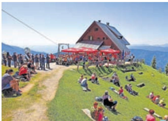
Letošnje poletje v Koči na Golici

zmogljivosti. Zaradi težav z zagotavljanjem osebja in obilice dela z oskrbovanjem so tri kočice, Tičarjev dom in Erjavčeva kočica na Vršiču ter