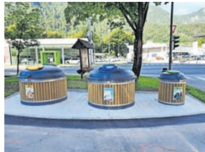
Občina Jesenice ureja sodobnejše potopne ekološke otoke.

na Občini Jesenice, gre za preureditev obstoječih ekoloških otokov, na katerih so bili doslej postavljeni zabojniki za papir, steklo in embalažo. Na novo urejeni ekološki otoki bodo potopni, posode za steklo, papir in embalažo bodo v zemlji oz. urejenih ugreznjenih mestih.