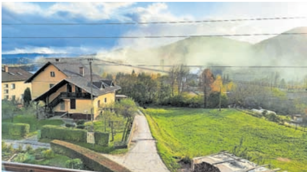
Oblak prahu iz podjetja SIJ Acroni

V Skupini SIJ so potrdili, da so v ponedeljek, 6. novembra, okoli 15.30 v družbi SIJ Acroni zaznali enkratni izredni dogodek, in sicer okvaro na odpraševalni napravi, kar je povzročilo zadimljenost jeklarne in njene bližnje okolice.