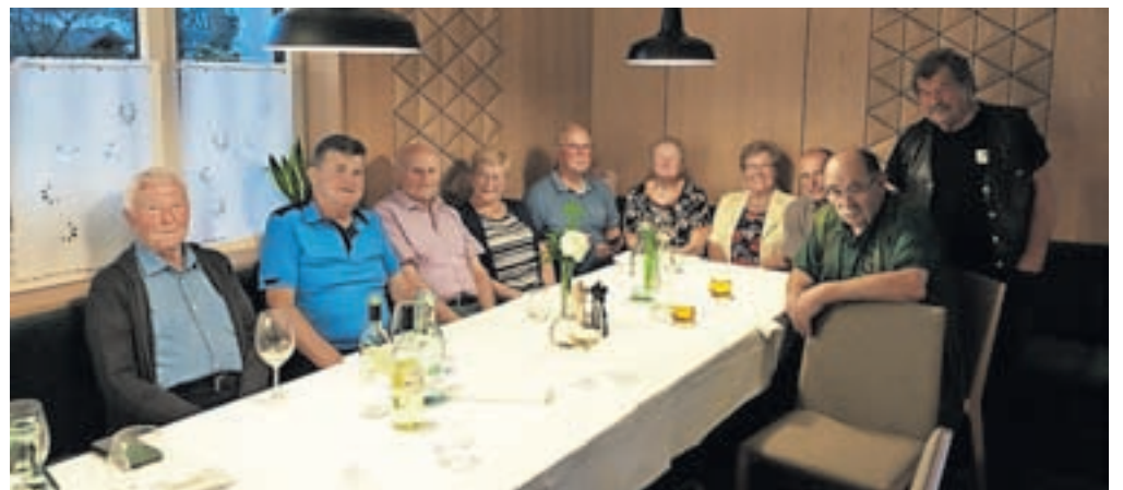
Na praznovanju častiljive obletnice

Vrhpolje – V nekoliko okrnjenem številu smo se v petek, 22. septembra, zbrali v gostišču Repnik na Vrhopolju nekdanji sošolci in sošolke, ki smo leta 1953 prestopili prag neveljske osnovne šole. Letos namreč obhajamo častljivo obletnico – 70 let, odkar smo začeli nabirati znanje v radožive otroške glave. Ob snidenju smo se kar malo spogledovali, saj nam je zob časa krepko spremenil zunanji videz. Žal se je kar nekaj sošolk in sošolcev zaradi boleznih moralo prezgodaj posloviti s tega sveta. V spomin nanje in na pokojne učitelje smo jim naklonili trenutek tišine, zanje bo darovana tudi spominska maša v neveljski cerkvi. V sproščenem pogovoru ob prigrizku in pijači smo obujali spomine na tiste čase. Ugotavljali smo, da nam je