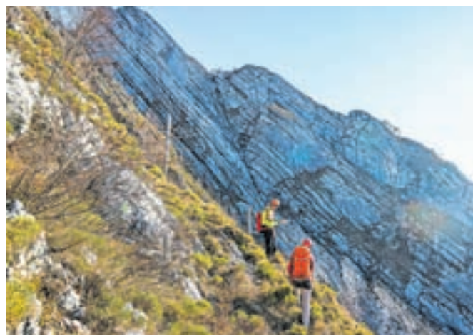
V gorah Karnijskih Alp