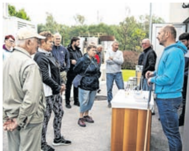
Dneva odprtih vrat se je udeležilo okoli dvesto obiskovalcev.

Sodelovanje s čistilno napravo so predstavili tudi predstavniki Agencije RS za okolje, Nacionalnega inštituta za biologijo in domžalskega Javnega komunalnega podjetja Prodnik, ogledali pa so si jo tudi predstavniki nekaterih občin lastnic.