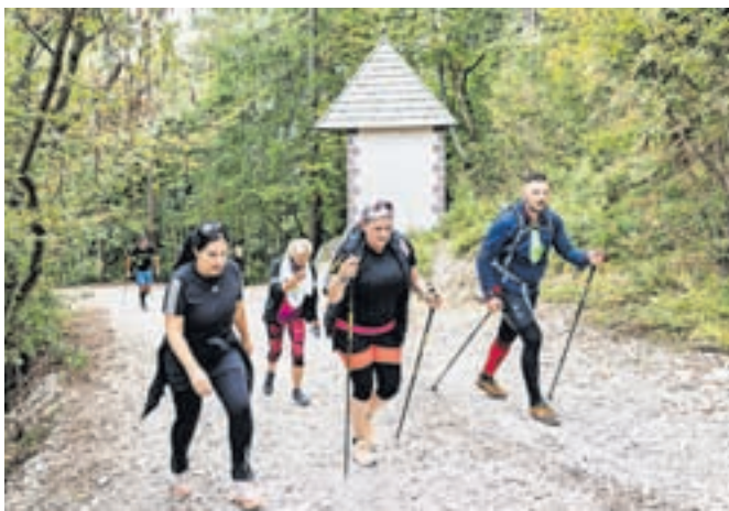
Na dobrodelnem pohodu so tokrat zbirali sredstva za družine, prizadete v avgustovskih poplavah.

deset tisoč evrov, ki jih bodo s pomočjo Zveze prijateljev mladine Slovenije razdelili družinam, prizadetim v avgustovski ujmi. Dobrodelni pohod na sv. Primoža so pri Modrih novicah pred desetimi leti osnovali