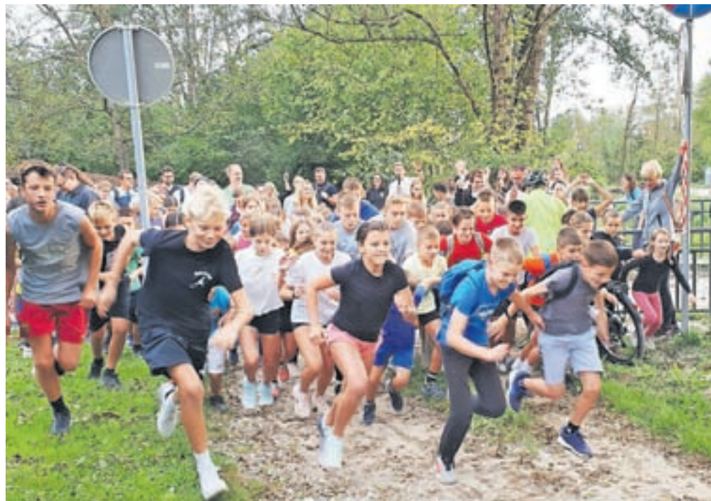
Okoli tristo tekačev in pohodnikov se je podalo po obnovljeni sprehajalni poti.

Tekače in pohodnike je ob poti tokrat pričakal duet Mark in Nace, ki sta dobro voljo in energijo delila s harmoniko in kitaro, ko smo se približevali cilju, pa so nam dodatno energijo dajali takti poskočnih melodij Mestne godbe Kamnik. V cilju je vsak udeleženec prejel zaslužno nagrado za premagano pot – vrhunske tekaške nogavice priznanega proizvajalca športne opreme. Za dogodek, ki spodbuja gibanje in medgeneracijsko druženje, so učenci pod mentorstvom učiteljice Teje pripravili predstavitvene plakate, zdrave prigrizke in sveže sadje za vse udeležence. S tem smo poča-