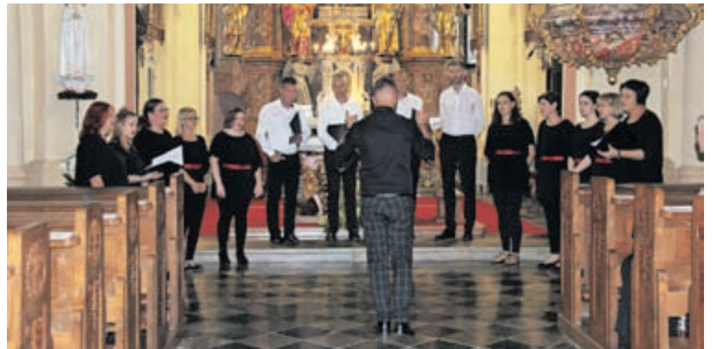
V cerkvi sv. Ane v Tunjicah so se na prireditvi Večer glasbe, spomina in zahvale poklonili več častivrednim obletnicam, ki so jih letos zaznamovali v kraju.