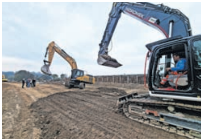
Na območju Šmarce gradijo nasip v dolžini tristo metrov.

Kot so ob tem sporočili s kamniške občinske uprave, nasip gradijo iz gramoznega materiala in tesnijo z glinenim jedrom. »Centralno glinasto jedro je širine en meter na koti krone in globine približno 1,5 metra oziroma do kote talne vode. Vgradnja glinice se izvaja v plasteh z ustreznim komprimiranjem,« so še sporočili. Dela izvaja podjetje Hidrotehnik. Projektantska ocena stroškov intervencijskega nasipa znaša 672.179 evrov.