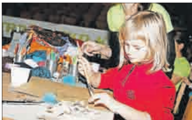
Organizatorji so poskrbeli za otroški kotichek, za katerega je bilo veliko zanimanja.