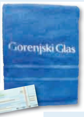
ali kopalna brisača s celodnevno vstopnico za Terme Snovik