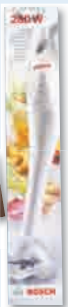
ali palični mešalnik BOSCH

Naročnina na Gorenjski glas je tudi lepo darilo!