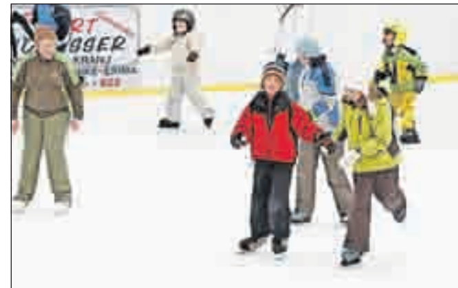
V Ledeni dvorani bo živahno tudi med božično-novoletnimi počitnicami.

12.00. V ponedeljek, 31. decembra, in v torek, 1. januarja 2013, bo dvorana zaprta. Brezplačno drsanje bo možno tudi na montažnem drsalnišču, ki bo postavljeno na Slovenskem trgu, in sicer od 24. decembra 2012 pa najmanj do konca februarja 2013 oziroma dokler bodo dopuščale vremenske razmere.