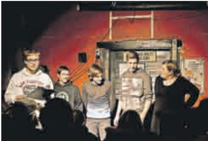
Za Maestra Down Towna so se verbalno spopadli kranjski srednješolci. Brez milosti.

nom Shod proti politični eliti in Kranjskemu županu 3. del je potekal 14. decembra, vendar se je tega shoda udeležilo le še okoli 70 protestnikov.