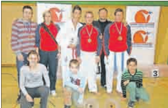
KK Shotokan Kranj je v skupnem seštevku osvojil odlično drugo mesto.