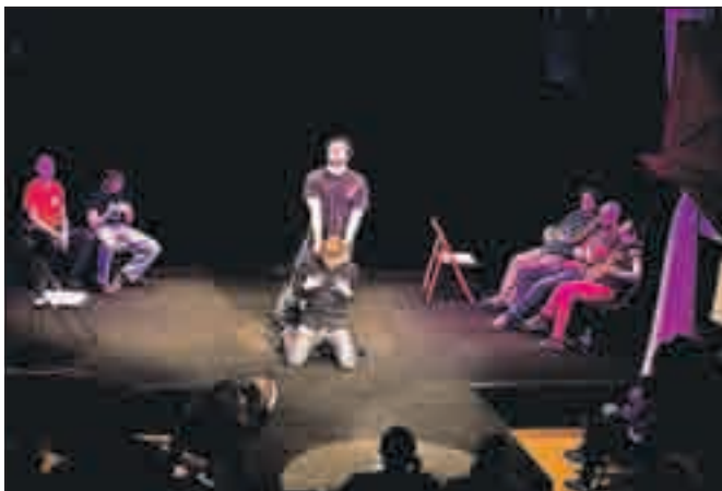
Ko scenarij nastaja sproti ... – Spopad mest je tudi tokrat poskrbel za smeh.