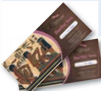
ali darilni bon za refleksoterapijo v vrednosti 20 EUR