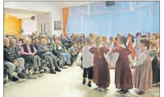
Prijetno popoldansko druženje več generacij