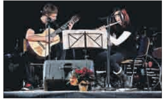
Na prireditvi so se družili ob glasbenih, plesnih in športnih nastopih.

Nadarjeni dijaki gimnazije ESIC Kranj so na Miklavžev dan predstavili svoje ustvarjalno delo in iskrive ideje. Na prireditvi v telovadnici šole so se družili ob glasbenih, plesnih in športnih nastopih. Med obiskovalci so bili tudi številni starši, pokrovitelji prireditve in drugi. "V okviru dobrodelne prireditve je nastal tudi koledar in voščilnice, ki so jih oblikovali dijaki. Pri nakupu teh izdelkov so nam pomagali številni pokrovitelji prireditve oziroma sponzorji, nekaj podjetij pa se je odločilo za donatorstvo. Ves izkupiček od prireditve, vključno z izdelki na šolskem bazarju je namenjen šolskemu skladu,« je strnila profesorica Marija Vreček Sajovic. S. K.