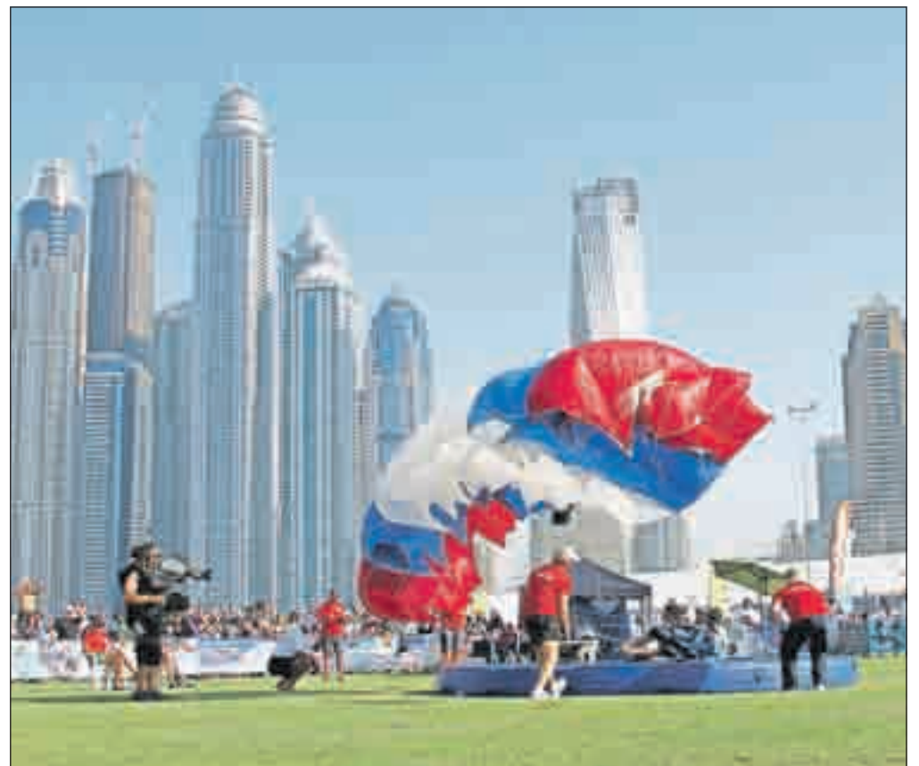
Vzdušje na doskočišču je bilo imenitno, Majo pa so najbolj spodbujali reprezentančni prijatelji.

stopnjevala v skladu z željami in na samo prvenstvo sem se odpravila samozavestna ter z željo po medalji.«