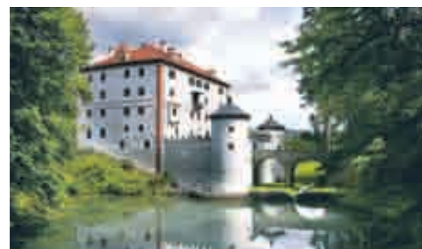
Grad Snežnik, lepo ohranjen baročni dvorec sredi snežniških gozdov