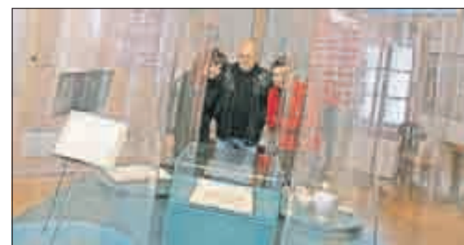
Razstava Prelepa Gorenjska je odprta.