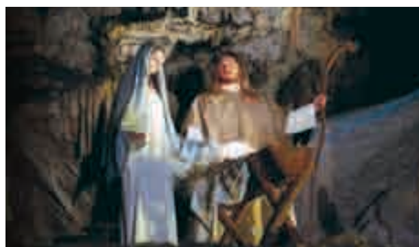
Jaslice v Postojnski jami že dobri dve desetletji bogatijo praznični čas.

stojijo na njegovih robovih. O burnem dogajanju v teh krajih zgovorno pričča več kot 700 let star Predjamski grad, v katerem je nekoč živel legendarni vitez Erazem Predjamski. Zanimiv srednjeveški grad, ki je zrasel na temeljih rimske utrdbe, je Grad Prem s stalno zbirko o gradovih in gradiščih porečja reke Reke. Čudovit, v belo odet grad Snežnik velja za enega najlepših in najbolje ohranjenih gradov na Slovenskem. Drobce vsakdanjika tukajšnjega prebivalstva zanimivo predstavi tudi Notranjski muzej v Postojni, spomine na polpreteklo zgodovino pa bo obudil sprehod po Parku vojaške zgodovine v Pivki.