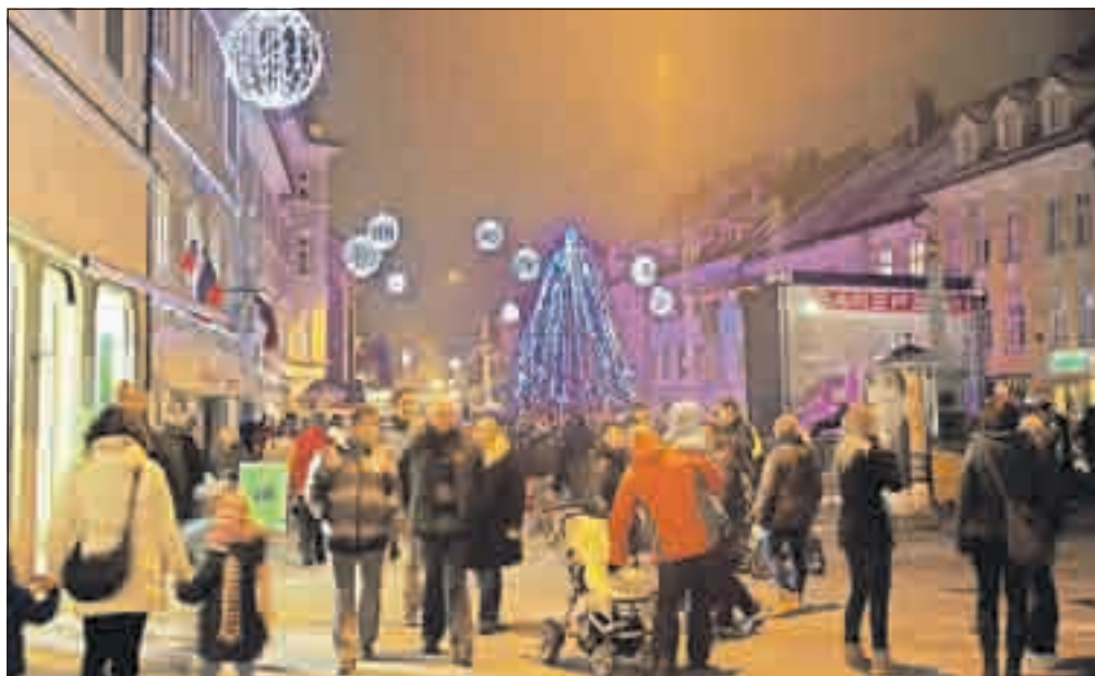
Kranj je v decembru zažarel v tisočeri lučkah, te dni pa se v mestu obetajo različne praznične prireditve.

Po sredinem božičnem voščilu Glasbene šole Kranj je na Glavnem trgu včeraj nastopila Alenka Godec, danes pa bodo ob 18. uri v rovih odprli razstavo jaslic, ki si jo bo moč ogledati vse do 12. januarja. Prireditve se bodo nadaljevale prihodnji teden, ko bodo v četrtek ob 13. uri na kranjsko občino prišli koledniki, na Glavnem trgu pa bo ob glasbi Jazz station ob 17. uri prvič sprevid dedka Mrza. Ob petek, 28. decembra, bo ob 19. uri na