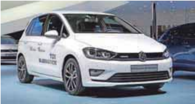
»Šparovček« na štirih kolesih

V Volkswagnu so naredili najvarčnejši družinski avto.