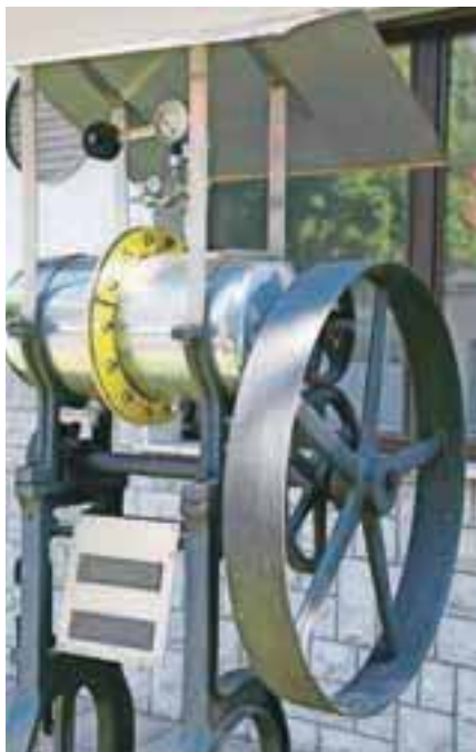
Prvi stroj za izdelovanje sodavice

sodelujemo pri izdelovanju ali polnjenju 75 raznih pijač, da smo znani po devetih izvirnih embalažah in da smo eni redkih, ki vztrajamo na povratni steklenici. Prepričani smo, da je steklenica najbolj čista embalaža, kar so spoznali v številnih evropskih državah, in najmanj obremenjujoča za okolje,« poudarja Vili Klanšek.