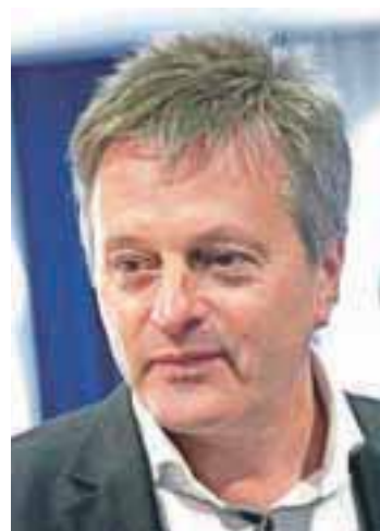
Ciril Globočnik, župan občine Radovljica