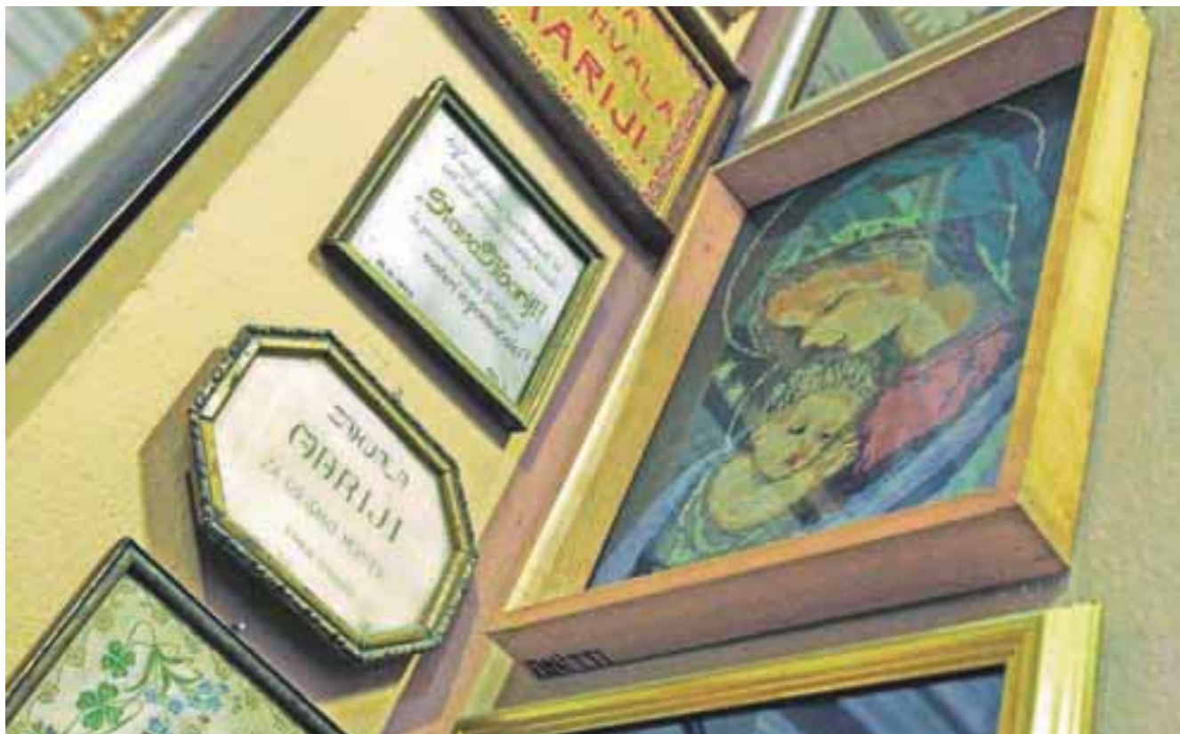
Romarji prinašajo na Brezje v zahvalo številne podobice in slike.

nizacij na Brezjah, ko pripovedujejo o zgle- dnem sodelovanju in o skupnih prizadevanjih, da bodo Brezje napreden, urejen in prijazen kraj, vreden slovesa največjega slovenskega romarskega središča. Novi gvardijan franči- škanskega samostana in rektor bazilike je takoj po prihodu v kraj naredil pomemben korak do predstavnikov kraja in krajanov, ki so njegovo dobro voljo in pripravljenost za sodelovanje sprejeli odprtih rok. Zagovornik in podpornik takega sodelovanja je tudi radovljiška občina.