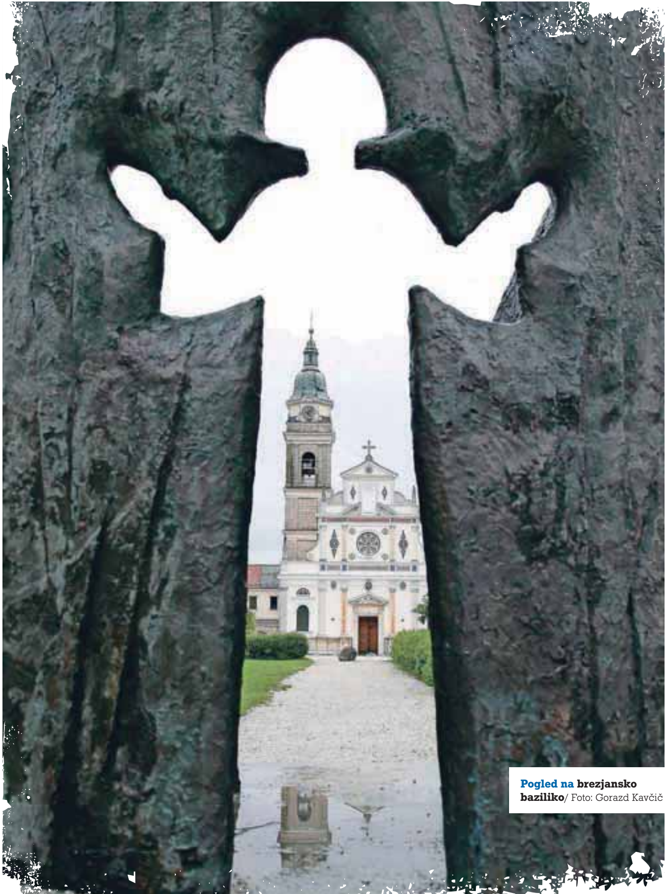
Pogled na brezjansko baziliko