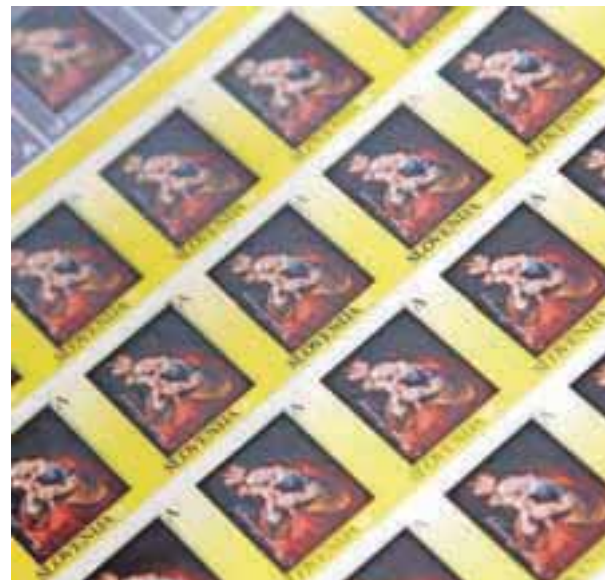
Poštna znamka v počastitev obletnice Marijine slike