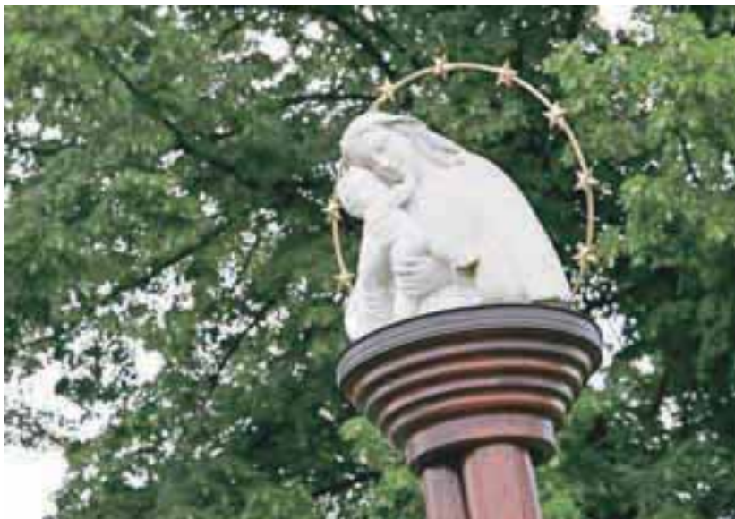
Marijin kip , ki ga je naredil Zdenko Kalin, na železniški postaji na Otočah.