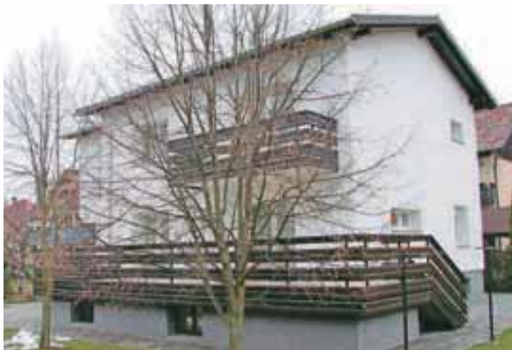
Hiša z novim Coolwex »srcem«

Kako prenoviti ogrevalni sistem v starejši zgradbi in znižati stroške? Ohraniti radiatorje? Izbrati toplotno črpalko tudi za primere dolgih in hladnih zim? Kako meriti učinke? Kako vzdrževati in upravljati nov sistem? Svoje izkušnje nam je zaupal Rok Herlec iz Kranja, ki s toplotno črpalko Coolwex na leto prihrani 2200 evrov!