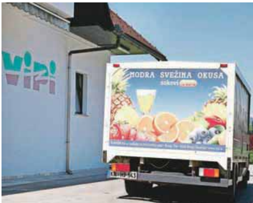
Vipi je znan zaradi prodaje ustekleničenih pijač na domu.