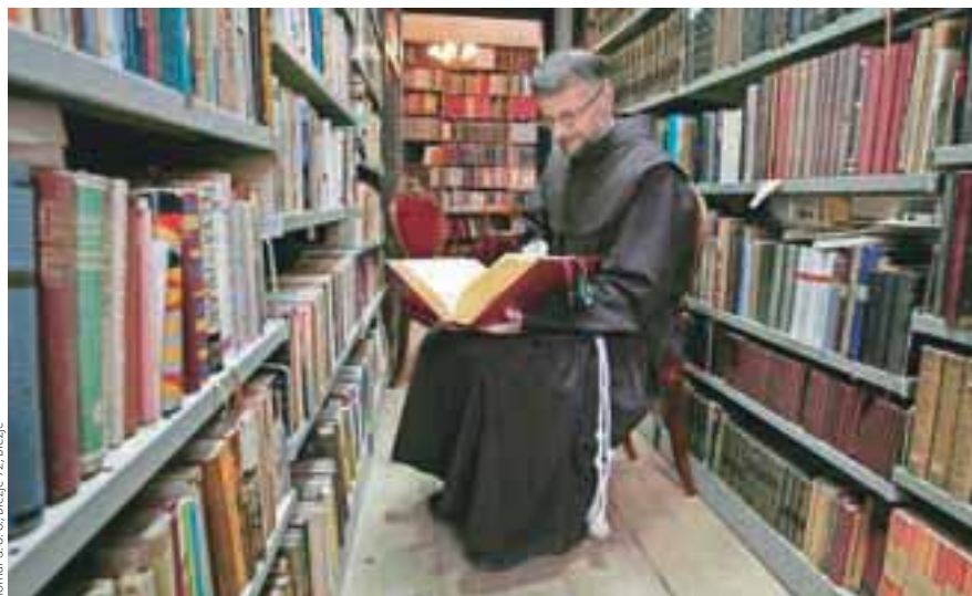
Romar d. o. Brezje 72, Brezje

Marija Pomagaj, stoj nam ob strani, hodi vedno z nami in nas vodi po poteh svojega sina Jezusa Kristusa. Izprosi nam zvestobo, mir in ljubezen.