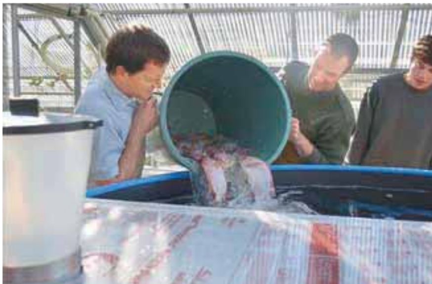
Vlaganje rib v akvaponično enoto

Akvaponika kot del urbanega kmetijstva omogoča oskrbo lokalnih trgov in kratke poti do končnega potrošnika.