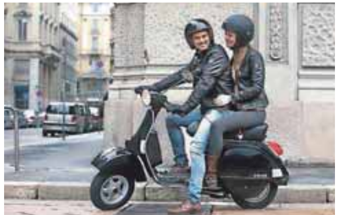
Še vedno najpriljubljenejši skuter