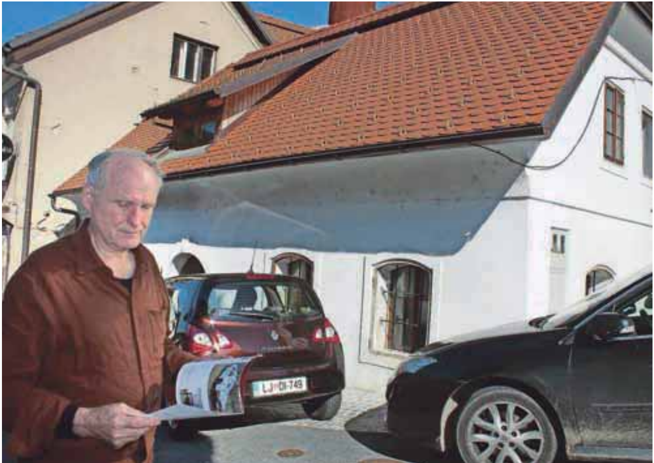
V Kranju je pred propadom rešil staro hišo in jo temeljito obnovil.

Švedskem najboljša zaklonišča, dobro živinorejo in odlično avtomobilsko industrijo. Pa to, da je pol leta tema in pol leta dan. To je bilo odlično sploh za mladoporočence ... Tako sem se jeseni leta 1965 odločil, da grem na Švedsko na izlet.« Zgolj na izlet je torej šel Jože, a ko je iskal kompanjona za potovanje, ta ni mogel zaradi punce, oni zaradi denarja, na koncu pa se je za pot odločil kar brat Janez.