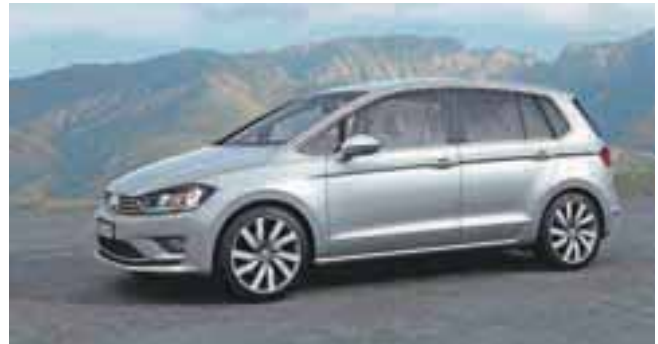
Vse, kar rabimo, da se vozimo dobro in varčno.