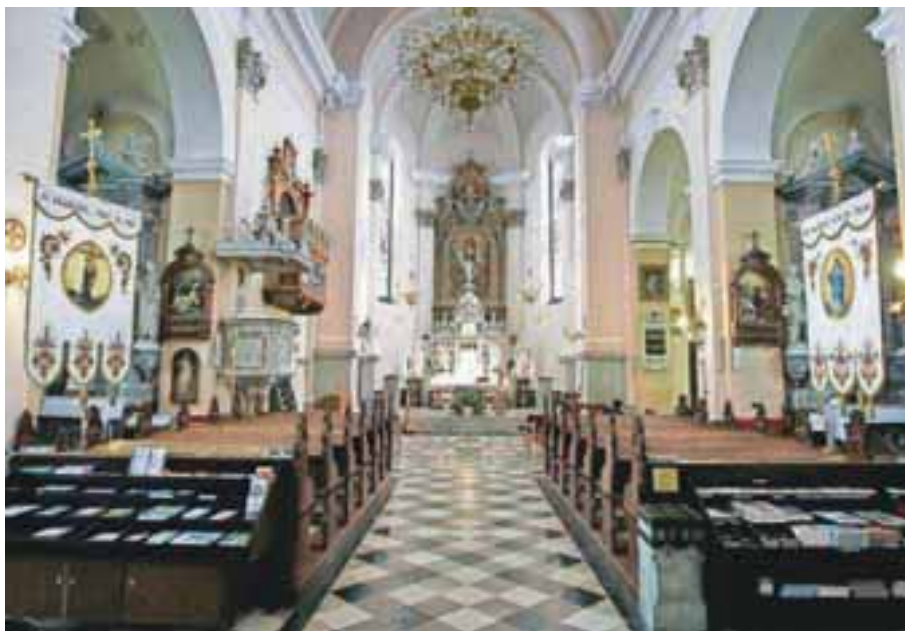
Notranjost bazilike na Brezjah

Če bo šlo tako naprej, bodo Brezje urejena vas, ki bo prijazna do domačinov in romarjev, in kraj, kjer bodo doma upanje, zahvale in mir. V tem članku sem opisal le majhen del zgodovine in veličine tega kraja. Če ga pa obiščeš, pa doživiš in začutiš še veliko več.