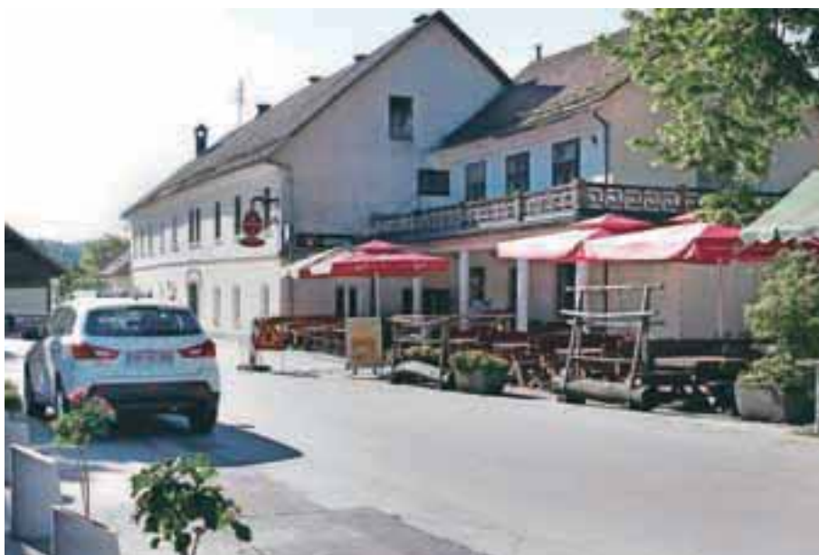
Znamenita Finžgarjeva gostilna na Brezjah, v kateri so romarji lahko tudi prenočevali.