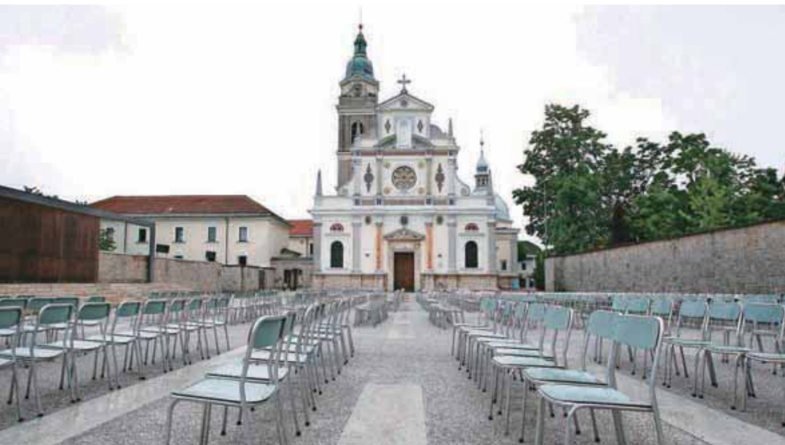
Bazilika Marije Pomagaj / Foto: Gorazd Kavčič

Po letu 1814, ko so v na novo poslikano kapelo Marije Pomočnice postavili Layerjevo sliko Marije Pomagaj, in po letu 1863, ko se je zgodila prva čudežna ozdravitev, se je začel silovit romarski vzpon Brezij, ki je vplival tudi na razvoj vasi.