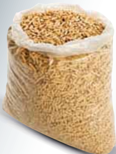
Slika je simbolična.

Gorenjske elektrarne, d.o.o. Stara cesta 3, 4000 Kranj e-naslov: lesni-peleti@gek.si telefon: 04/20 83 532 ali 20 83 549