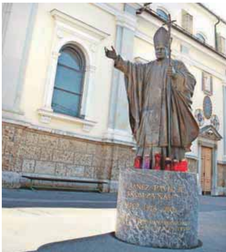
Kip papeža Janeza Pavla II., ki je Brezje obiskal leta 1996.

»Sedaj se pogovarjamo o podrobnem pro- storskem planu. Njegova izdelava je v primeru Brezij še zahtevnejša, saj gre za prepletanje vseh oblik prometa in pešcev, in to na zelo omejenem prostoru. Stvari se premikajo počasi, vendar upamo, da se bomo dogovorili za najboljšo rešitev, saj je pri vseh prizadetih,