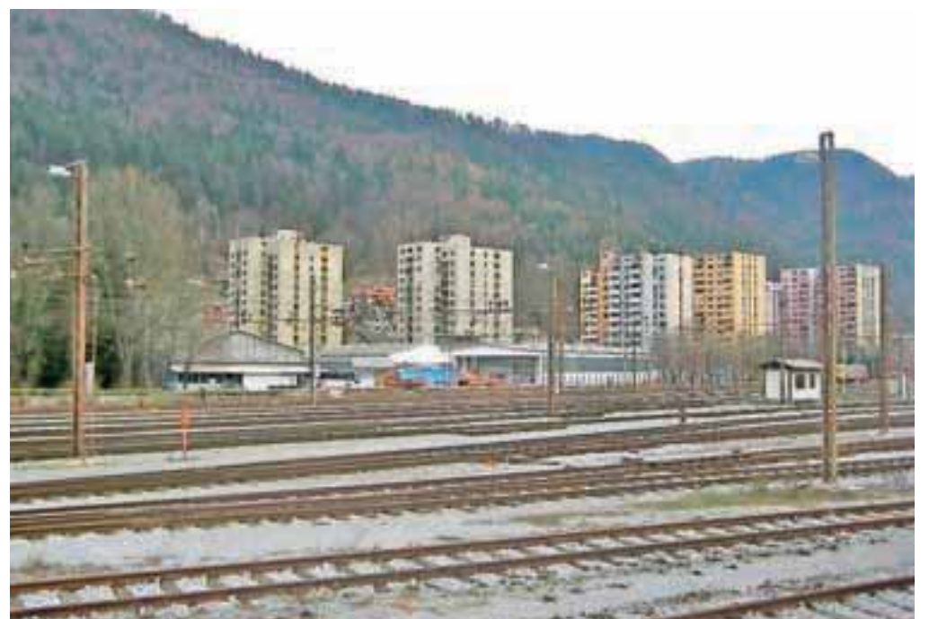
Jeseniška stvarnost: številni železniški tiri, industrijske dvorane in stanovanjske stolpnice

Revitalizacijo opuščanih industrijskih območij na območju Stare Save danes v slovenskem prostoru navaja kot primer uspešne oživitve mesta. Čeprav je historični del (Bucelleni-Ruardova graščina, cerkev Marijinega vnebovzetja in ostanki plavža in pudlovke) ostal nezaključen in je bila večina objektov obnovljena predvsem na račun novih trgovskih centrov, pa je Stara Sava na nek-