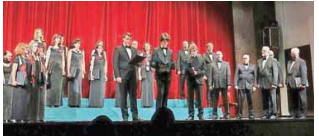
Odličen zbor Vox Carniola