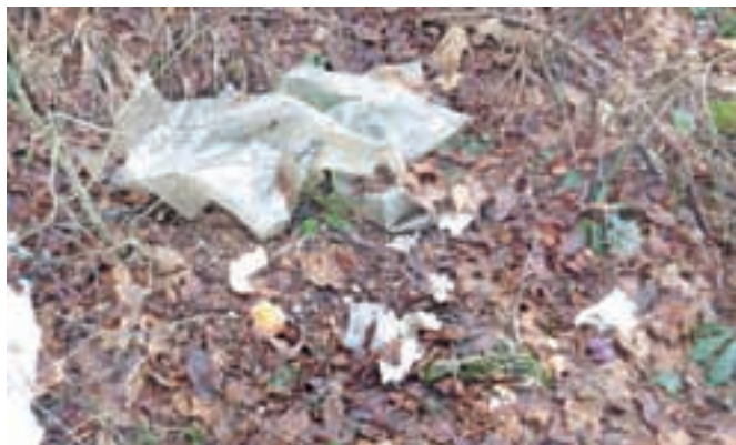
Za klopjo »Pri Micki« je kup smeti ... (trenutno pod snegom)

V okviru svoje preventivne dejavnosti je društvo GRS Kamnik v petek, 30., in soboto, 31. januarja letos, organiziralo in izvedlo osnovni tečaj za varnejšo hojo v gore in planine v snegu. Na tečaj je prišlo dvanajst udeleženk in udeležencev iz različnih krajev Slovenije, ki so morali pokazati že kar nekaj znanja in izkušenj, da so v slabem vremenu varno prišli v Domžalski dom, kjer so v petek zvečer