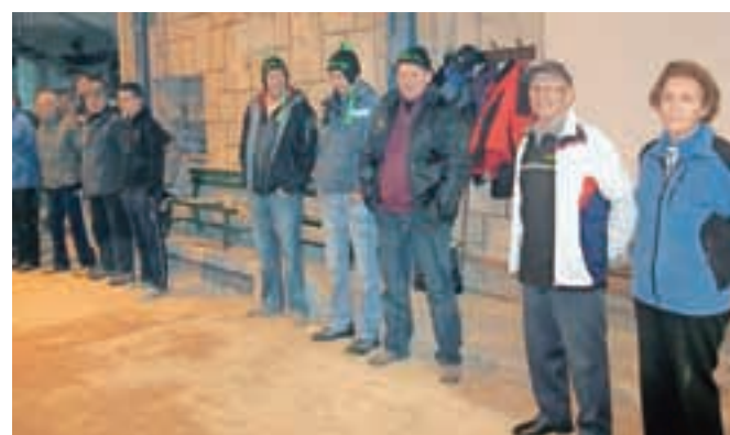
Člani ekipe Planinskega doma Komenda