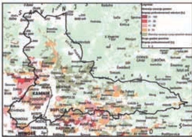
Stopnja poškodovanosti gozdnih površin v kamniški občini

Na območju krajevne enote Kamnik sta poškodovana dva odstotka lesne zaloge iglavcev, pet odstotkov lesne zaloge listavcev, skupaj štirje odstotki celotne lesne zaloge.