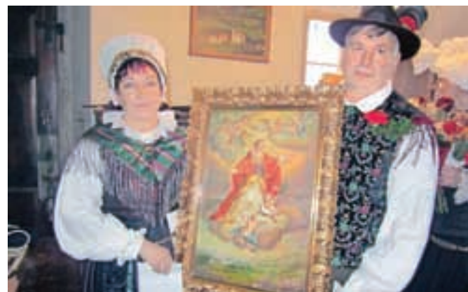
Selani so rojaku nadškofu podarili tudi sliko farne cerkve in zavetnice svete Neže.

»Nadškofa dojemam kot človeka širine, ki ga je prijetno poslušati, saj pove, kar tudi zares misli. Ko ti stisne roko, jo stisne krepko, te pogleda globoko v oči in to o človeku veliko pove. Misli, ki jo je danes namenil meni kot županu, ni kaj dodati. To je ena najlepših misli, kar sem jih slišal v zadnjem času in pove bistvo. Vsak naj stopi korak nazaj, vsak naj prizna drugega, pa bodo zadeve rešene. Za občino Kamnik je velika čast, da ima iz svoje srede nadškofa. Pri delu mu ne bo lahko, a ga bo zmož, ker je človek združevanja,« je povedal župan Marjan Šarec.