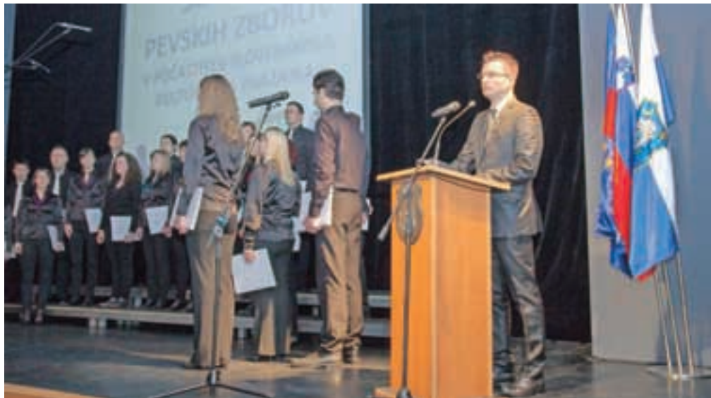
Slavnostni govornik 36. Območne revije pevskih zborov iz občin Kamnik in Komenda, kamniški župan Marjan Šarec se je vsem pevcem zahvalil za njihovo vztrajno delo in ohranjanje bogatega poslanstva.