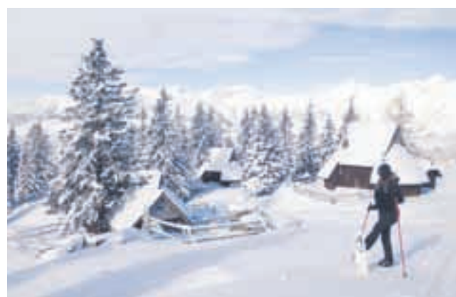
Krpljanje na Veliki Planini