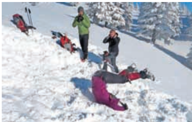
Vaja zaustavljanja zdrsa s pomočjo cepina