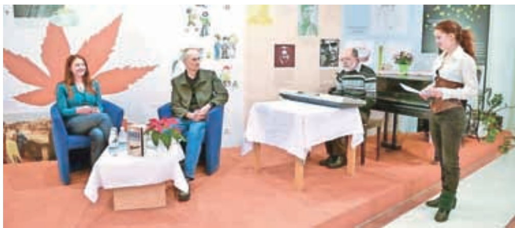
Dogodek so popestrile tudi Slomškove pesmi.

Kamnik – Osrednji prostor v knjigi je avtohtono slovensko podeželje: na pot vanj bralca pospremi na videz tipično slovenski liki, ki z nepričakovanimi preobrti domnevno tipičnost zmeraj znova problematizirajo in postavljajo pod vprašaj. Avtorica se suvereno giblje med fantastiko, satiro in detektivko, pri čemer vselej pušča dovolj prostora za razvoj vseh treh bralnih nivojev. Bralca skozi skrbno izdelano pripovedno atmosfero vodijo prepoznavni, predvsem pa plastično orisani značaji z odličnim smislom za humor, ki je nasploh ena največjih avtoričinih odlik. Naj izdamo le drobce, za kaj več si boste delo morali prebrati sami: v Šmihelski vasi umorijo župnika, s primerom pa se mora spopasti lokalni kriminalistični inšpektor, ki mu ne prizanašajo ne srednja leta ne z njimi povezana kriza. Bodo on in njegovo