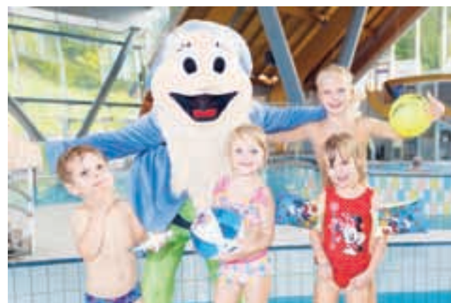
Zanimivi zimski paketi v Termah Snovik

Zimske vragolije lahko doživite na drsališču na prostem v starem mestnem jedru Kamnika, in sicer na parkirišču pri Franciškanskem samostanu. V času zimskih šolskih počitnic bo na voljo šola drsnja (od 23. do 28. februarja), vsak dan med 10. in 12. uro pa tudi pestra animacija . Prislunhite zgodbam, ki jih s svojo bogato dediščino pripoveduje srednjeveško jedro