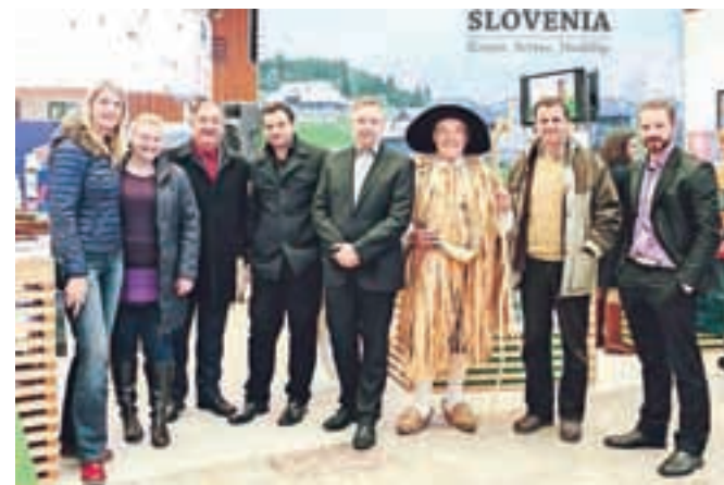
Predstavniki kamniške občine in turizma na sejmu Alpe Adria: Turizem in prosti čas