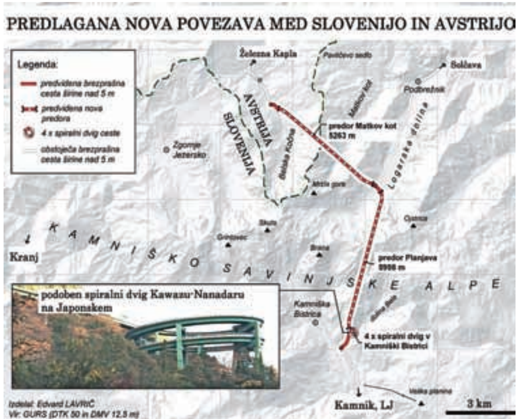
Grafični prikaz predlagane nove cestne povezave med Kamnikom in Avstrijo