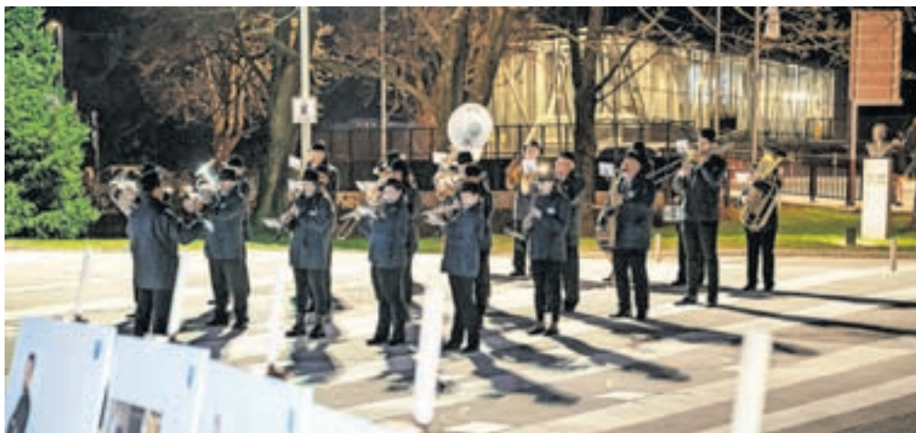
Pihalni orkester Jesenice - Kranjska Gora

podjetij na tem območju. Bliža se začetek gradnje neprofitnih stanovanj na območju TVD Partizan, porušitev dotrajane stavbe vrtca – Enote Julke Pibernik in investicija v nov objekt, nadaljuje se prenova komunalne infrastrukture v KS Sava. Začenja se tudi velik projekt obnove železniške postaje oziroma širšega območja ob