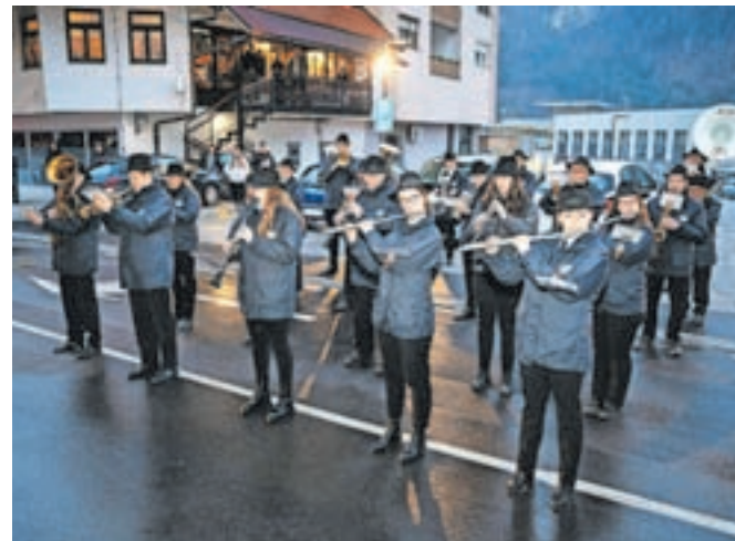
Za dobrodošlico obiskovalcem so pred Kosovo graščino s krajšim nastopom poskrbeli člani Pihalnega orkestra Jesenice - Kranjska Gora.