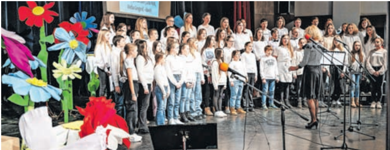
Da je glasba doma na Osnovni šoli Koroška Bela, je bilo kaj kmalu znano. Mladinski pevski zbor namreč šteje kar sedemdeset članov.