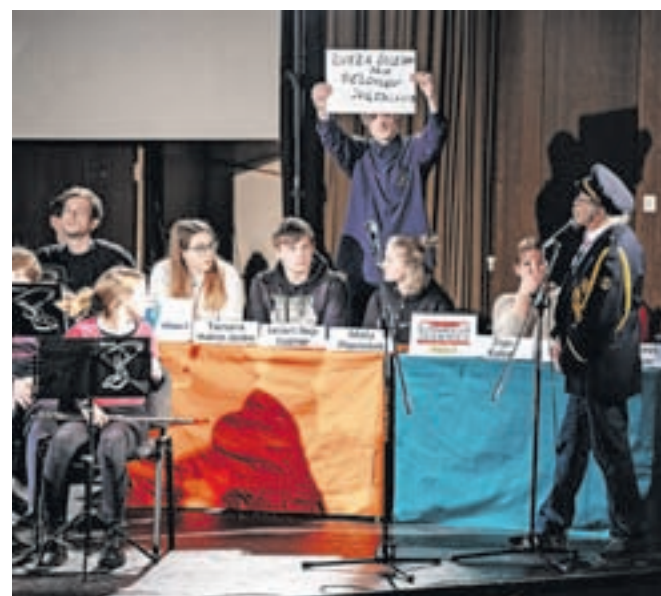
Utrinek s kviza: mladi so pokazali veliko znanja o zgodovini godbeniške dejavnosti in mesta.