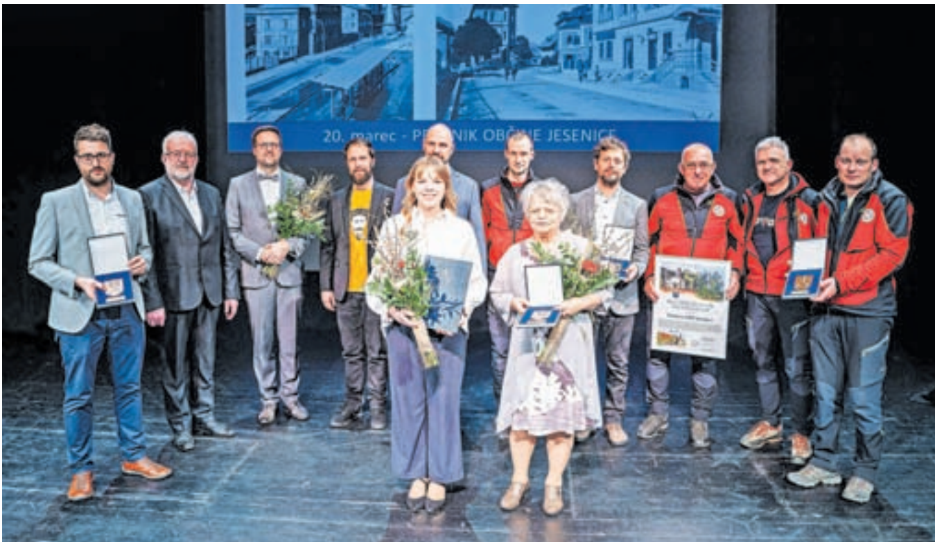
Letošnji občinski nagrajenci