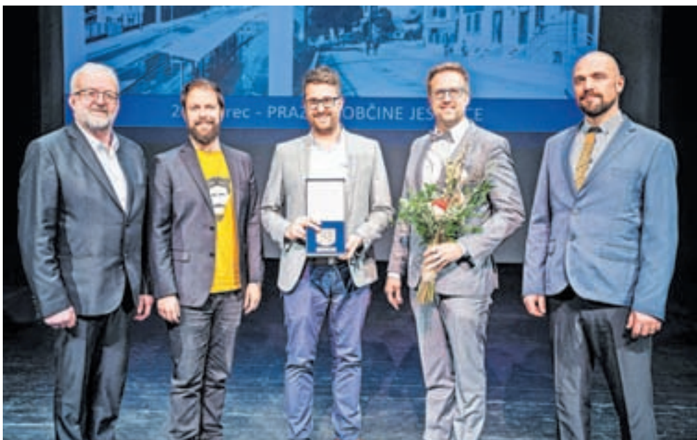
Kvintet Vintgar

Med projekti, ki bodo zaznamovali leto 2024, je urbanistična prenova mesta, ki jo bodo začeli z ureditvijo Trga prijateljstva na Plavžu. Začenja se tudi tretja faza prenove Poslovne cone Jesenice, s čimer bodo zagotovili še boljše pogoje za delo in razvoj