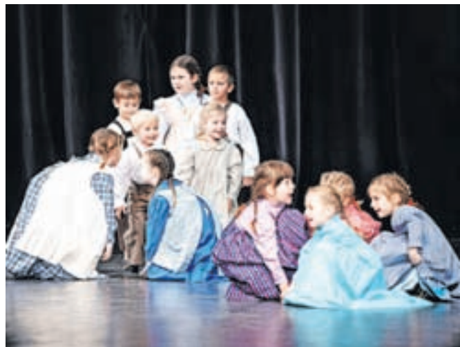
Na odru so se vrteli, igrali in peli tudi otroci folklorne skupine Jabčki.

Na prireditvi v organizaciji območne izpostave Javnega sklada za kulturne dejavnosti je na Slovenskem Javorniku potekala prireditev K'e ste deklíč, da b' rajal fantič. Predstavili so se otroška folklorna skupina Jabčki, folklorna skupina Juliana, pevska skupina Juliana in poustvarjalci glasbenega izročila Suhe hruške. Njihove nastope je ocenila strokovna ocenjevalka.