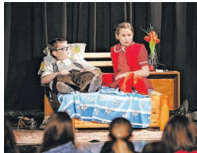
Predstava je dodobra nasmejala polno dvorano Farnega kulturnega društva Koroška Bela.