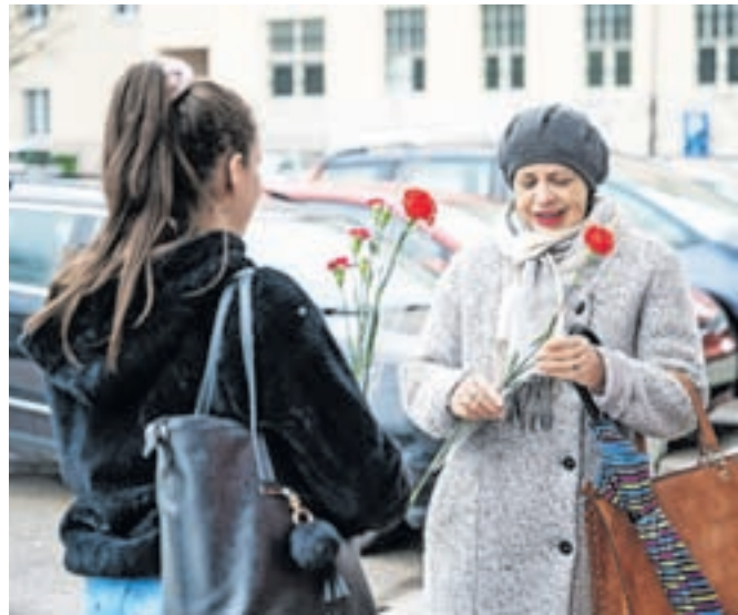
Mladi so v okviru ulične akcije ženskam na jeseniških ulicah delili nageljčke.

Na mednarodni dan žensk so mladi pod okriljem Mladinskega centra Jesenice tudi letos izvedli ulično akcijo in na ulicah Jesenic z majhno pozornostjo – rdečim nageljčkom – obdarili občanke. Ustavili so se tudi v nekaterih ustanovah, prodajalnah ... Kot so povedali, z akcijo želijo vsako leto spomniti na pomembno vlogo žensk v družbi.