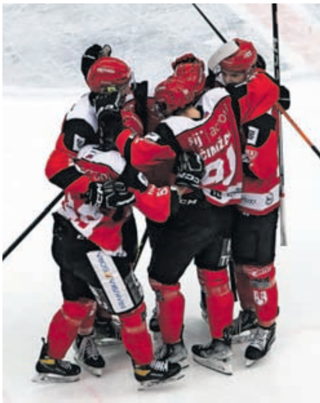
Članska ekipa HDD SIJ Acroni Jesenice je končala letošnjo hokejsko sezono.

Ponovitev lanske zmage v Alpski hokejski ligi je bilo letos težko pričakovati. Vodstvo kluba se je odločilo, da gre v sezono brez tujih okrepitev. Letošnji ekipi je bilo priključenih kar nekaj mladih igralcev, neizkušenih, brez tekem v Alpski ligi. Vodstvo kluba je pred sezono zastavilo realen cilj, uvrstitev v izločilne boje. Po polovici rednega dela je kazalo na gladko uvrstitev med prvih šest ekip, ki se neposredno uvrstijo v izločilne boje. V drugi polovici rednega dela so na štirih tekmah, ki se niso končale v rednem delu, osvojili le štiri točke. Skrb vzbujajoča poraza sta bila v 24. in 25. kolu. Najprej so doma kar s 6 : 1 izgubili proti Gardeni, na gostovanju v Celovcu pa proti mladi ekipi KAC-a s 5 : 2. Tri zaporedne zmage so nakazovale puščico navzgor, a od tega ni bilo nič. V predzadnjem kolu so izgubili v gosteh po podaljškem z ekipo Zell am See s 3 : 2. V zadnjem kolu so bili še vedno odvisni od sebe. Zmaga bi jih popeljala med najboljših šest, a so izgubili s Kitzbühelom z 2 : 1. Kljub vsemu so šli v kvalifi-