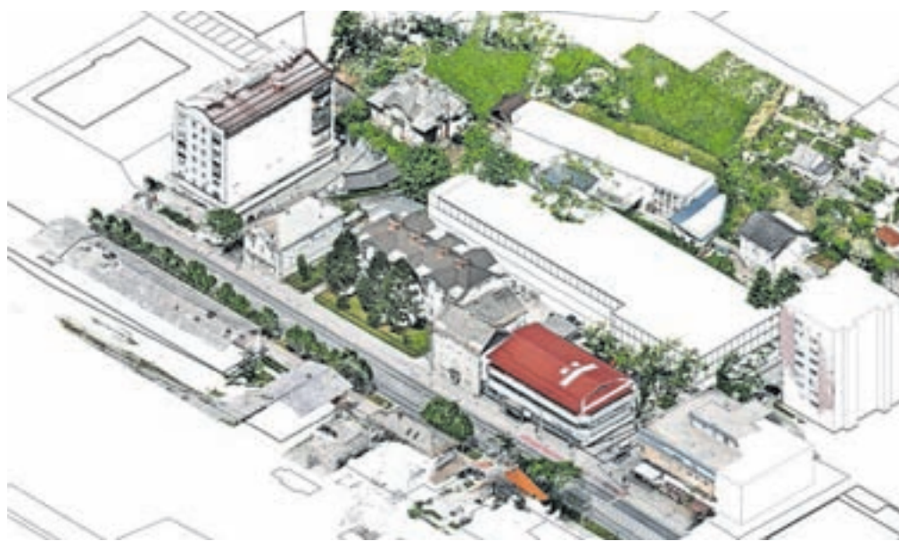
Idejna zasnova, kako naj bi bila v prostor umeščena nova garažna hiša / FOTO: IDEJNA ZASNOVA

objekt zgradil v sklopu javno-zasebnega partnerstva. To pomeni, da bi zasebni investitor financiral ali sofinanciral gradnjo in za določen čas garažne prostore dobil v upravljanje, pobiral bi tudi parkirno, občina pa bi poskrbela za javni del. Po predlogu naj bi objekt imel dve ali tri kletne etaže, pritličje in dve nadstropji. V kletnih etažah, pritličju in prvem nadstropju bi bila parkirišča in gostinski objekt, v drugem nadstropju pa bi uredili prostore za do-