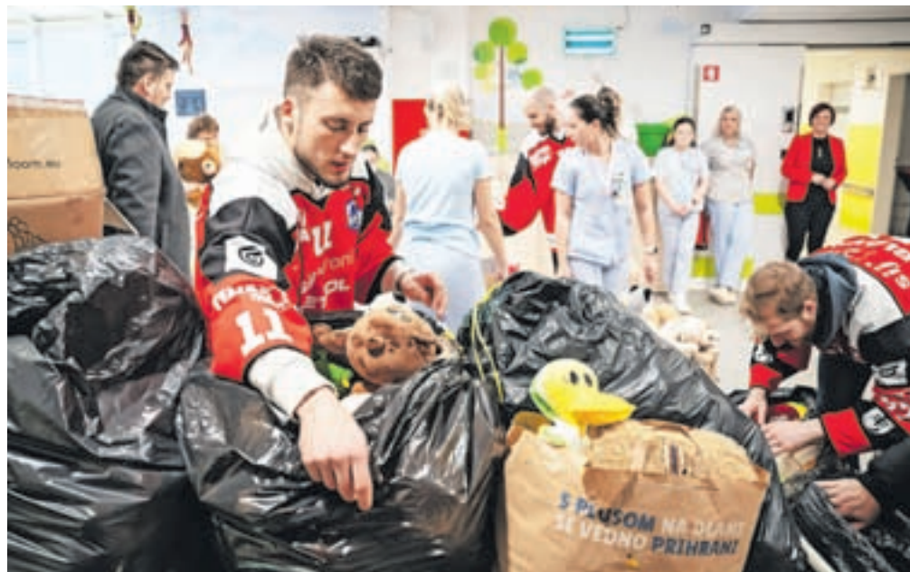
Kar nekaj pomoči je bilo potrebne, da so razpakirali vse igrače.