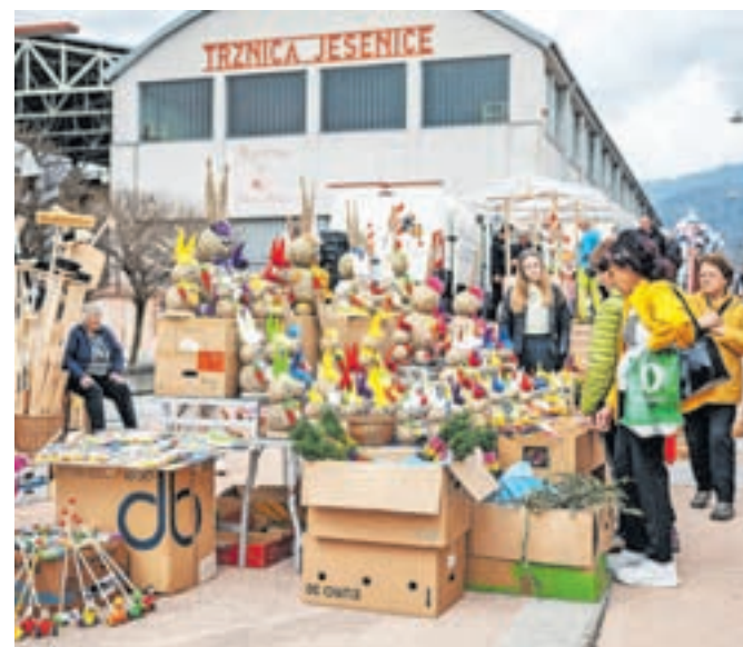
Jožefov sejem zadnja leta pripravljajo na Stari Savi. Ker poteka pred veliko nočjo, je po navadi na njem mogoče kupiti tudi velikonočne okraske.

Organizatorji so za popestritev sejmskih dni poskrbeli z glasbenim programom, otoci so uživali v zabaviščnem parku.