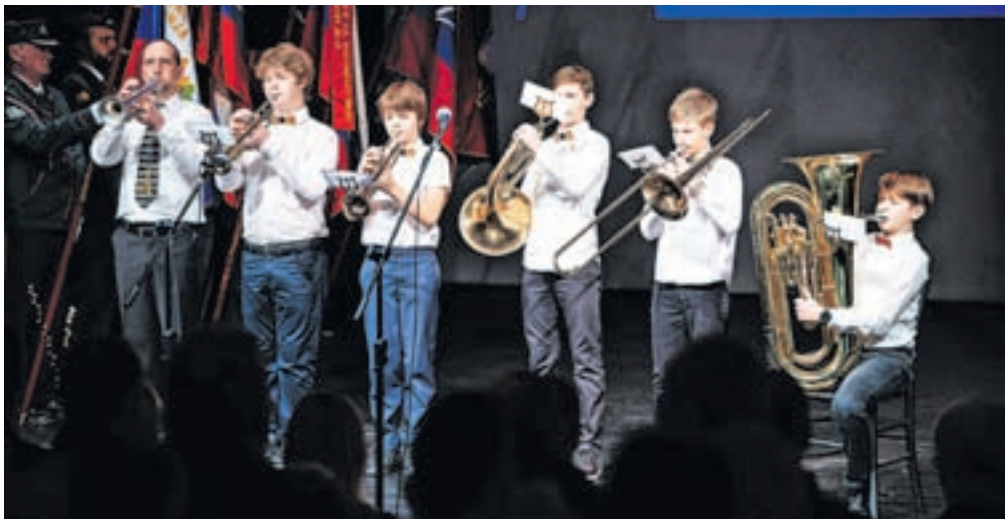
Trobilni kvintet Glasbene šole Jesenice

In ne nazadnje, Jesenice letos praznujejo 95 let, odkar so pridobile mestne pravi-