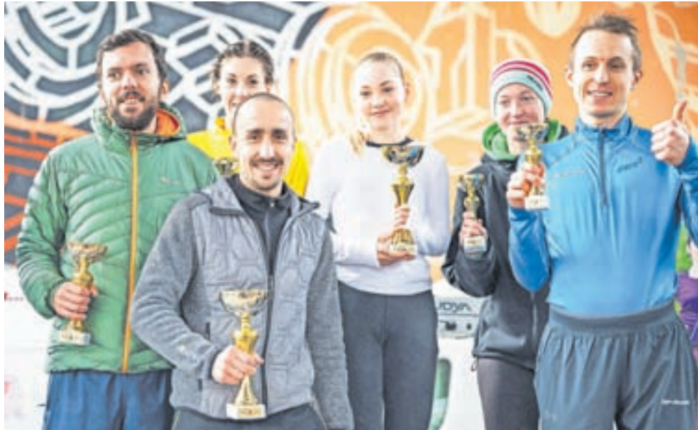
Najboljši v moški in ženski kategoriji

Najhitrejši trije v absolutni moški konkurenci na letošnjem teku so bili Grega