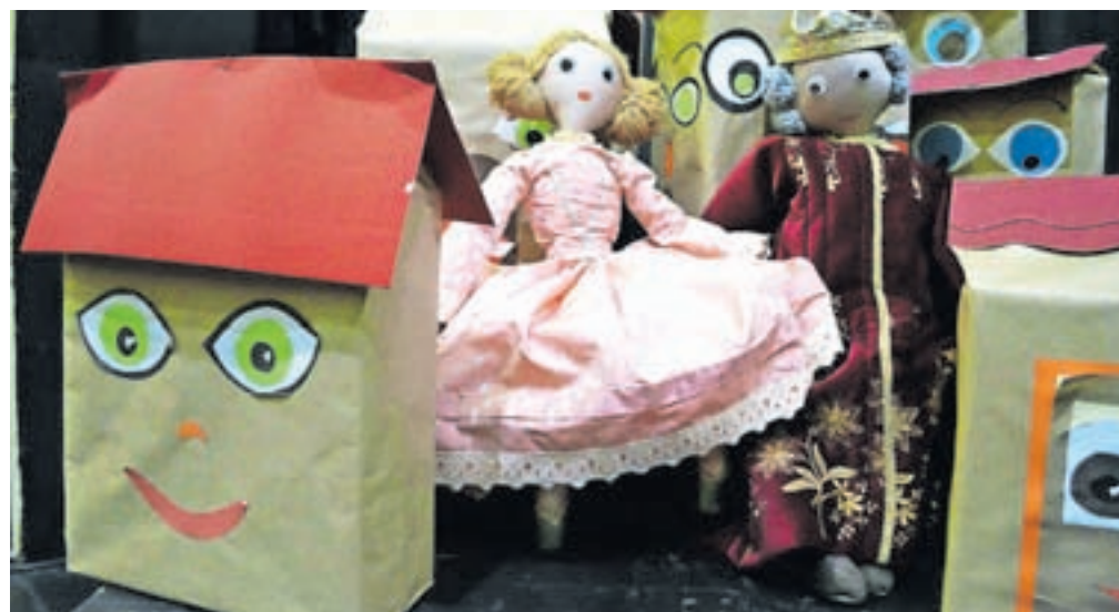
Lutke na jeseniškem odru živijo.

V tej uprizoritvi so igralci oziroma animatorji sami izbrali svoje like. Vsak od njih se preizkusi v več vlogah, pa tudi v različni tehnični lutke.