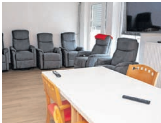
Dnevni center je urejen kot velika dnevna soba z mizo in stoli, udobnimi počivalniki, televizorjem, prirodno kuhinjo in sobo za odmik, ki je namenjena počitku.