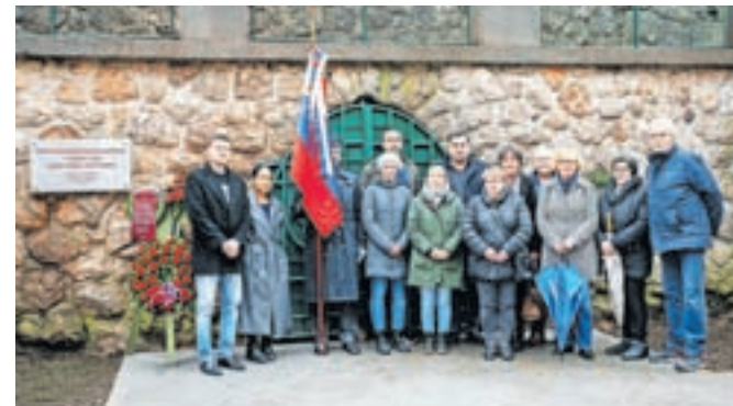
Sodelujoči pri polaganju vencev k spominski plošči v Kolarjevem parku

padlo na območje od nekdanje gostilne Peklar do jeseniške cerkve. Močno so poškodovale tudi železniško in drugo infrastrukturo in številne hiše. Kaj se je dogajalo med bombardiranjem in po njem, je dokumentirano