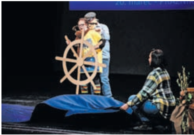
Učenci Osnovne šole Poldeta Stražišarja