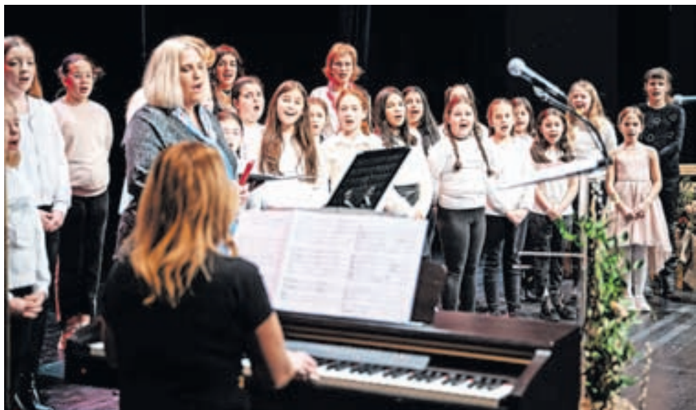
Pevski zbor učencev in učiteljica Osnovne šole Prežihovega Voranca / FOTO: NIK BERTONCELJ