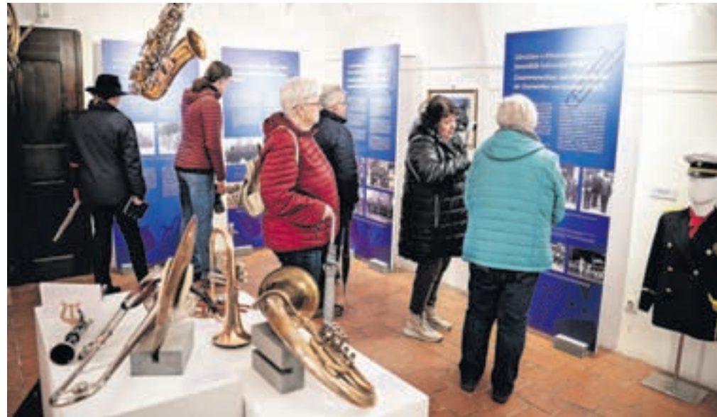
Poleg zgodovinskega pregleda delovanja godb so na ogled različna glasbila, na katera so včasih igrali, partiture, uniforme, izdane publikacije in priznanja.

Na ogled je film iz arhiva RTV Slovenija s posnetki orkestra na različnih nastopih.