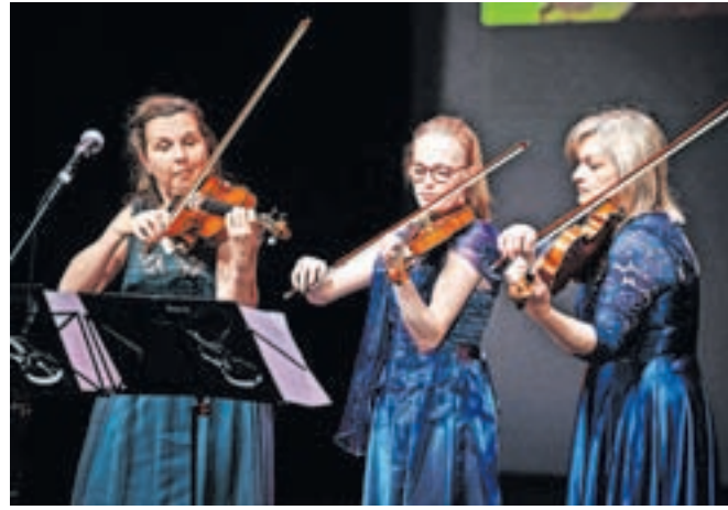
Godalni trio profesorice Glasbene šole Jesenice