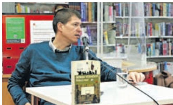
Goran Vojnovič v Občinski knjižnici Jesenice