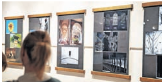
Prosta izbira teme je pokazala, kako različne so fotografkinje.