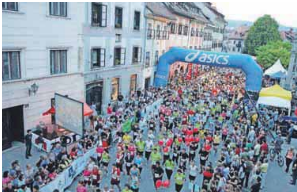
Škofja Loka je ves dan dihala s tekači, največ pa se jih je zbralo na Teku štirih mostov, ki se je začel in končal na Mestnem trgu.