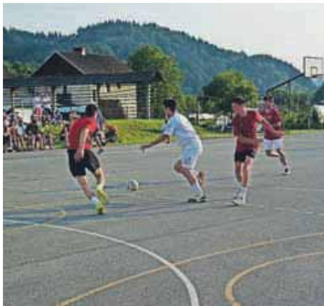
Nogometaši so se v hudi vročini na celodnevem turnirju dobro preznjili.