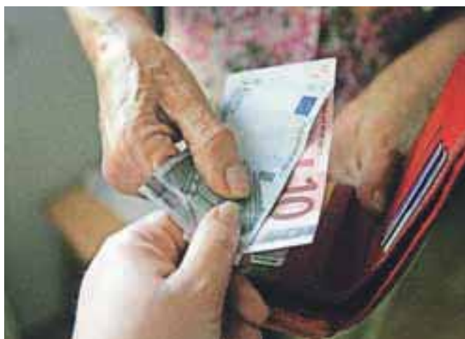
Vse več je ekonomskega nasilja nad starejšimi.

A nasilje nad starejšimi obstaja, kar dokazujejo podatki Centra za socialno delo Škofja Loka. Letos so namreč obravnavali že devet primerov nasilja nad starejšimi osebami. Podatki so konkretni in pretresljivi. V enem primeru je invaliden sin nasilen do mame. Mama se je na centru za socialno delo zglasila sama in spregovorila o dolgotrajnem psihičnem in tudi fizičnem nasilju s strani sina. Pomoč je bila usmerjena v to, da se nasilje ustavi, na dom je hodil tudi javni delavec. Na zdajnjem medinstitucionalnem timu, na katerega so poleg predstavnika policije povabili tudi osebnega zdravnika, so se dogovorili, da za sina uredijo namestitve v ustreznem socialnovarstveni zavod. Drugi primer: na centru pomagajo starejšima zakoncema, nad katerima izvaja nasilje sin. Prepo-veduje jima stike z domačimi, omejuje ju pri nakupu osnovnih dobrin. Starša se ga bojita. Tretji primer: na centru je za pomoč zaprosila starejša ženska, nad katero nasilje izvaja mož. Četrti