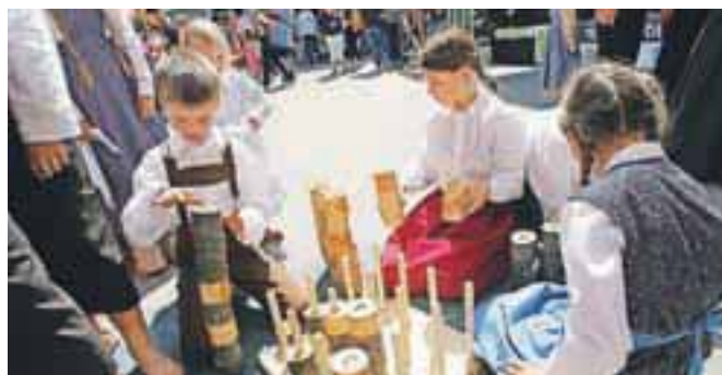
Otroci, oblečeni v oblačila iz preteklosti, ki prikazujejo otroške igre, kot so se jih igrali nekoč.

Tednu obrti in podjetništva je na Škofjeloškem od 2. do 8. junija sledil še teden podeželja, ki se je začel s pohodom po čebelarški poti, nadaljeval z več predavanji in delavnicami, v soboto, 8. julija, pa končal s tržnico kmetijskih pridelkov in izdelkov na Mestnem trgu v Škofji Loki. Mesto je tega dne gostilo tudi sejem unikatnih izdelkov. Podeželje je spet prišlo v mesto, enajstič po vrsti. Poleg stojnic z domačimi pridelki in izdelki so podeželski duh mesta dopolnili tudi številni slikoviti nastopi. Eden od dogodkov ob tednu podeželja je bilo tudi vodenje po tematski poti v Sušo. D. Ž.