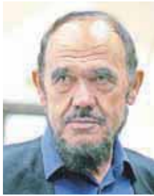
Miro Kačar bo postal častni občan.

Dogajanje ob občinskem prazniku bo vrhunec doseglo v nedeljo ob 20. uri s slavnostno akademijo v športni dvorani v Železnikih, na kateri bodo podelili osem občinskih pri-