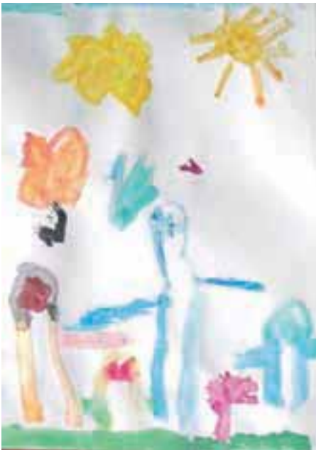
Risbica na temo pomladi. Otroško iskriava in doživeta.

Danes, na veliki petek, v vrtcu barvajo pirhe, čisto naravno, s čebulnimi olupki. Pečejo tudi ptičke iz testa. »Za materinski dan so otroci za darilo mamicam naslikali travnik. Za valentinovo smo vsi skupaj v vrtcu pekli vafle – srčke in povabili na obisk vrtec pri matični Osnovni šoli Simona Jenka Kranj. Jedli smo srčke, se družili, plesali ...« je strnila Valjavčeva. S. K.