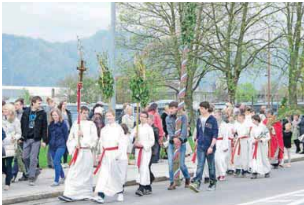
Cvetna nedelja na Primskovem

Na veliko noč bo v vseh župnijah v kranjski dekaniji napoved MISIJONA, ki bo prihodnje leto