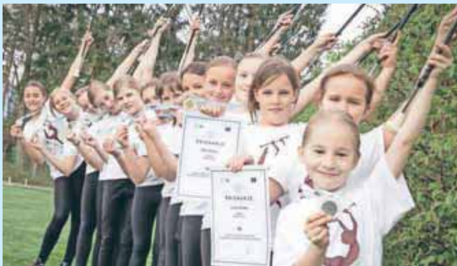
Mažoretni in twirling klub Kranj ima sedež v Domu krajanov na Primskovem.