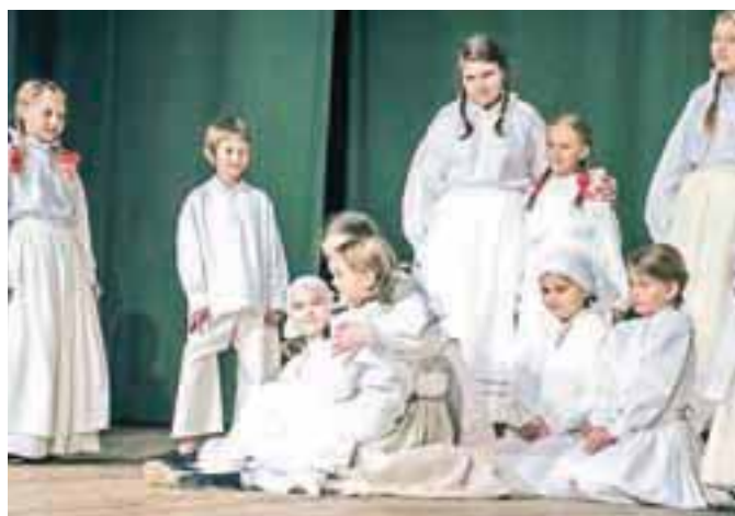
Z belokranjskim plesom so navdušili plesalci Otroške folklorne skupine Pastirček.