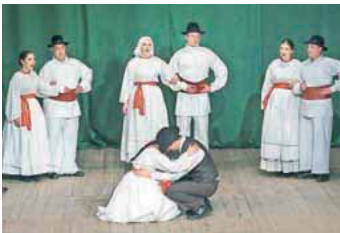
Življenjska ljubezenska zgodba, izpovedana skozi folklorni spektakel: AFS Ozara

Akademška folklorna skupina Ozara, ki šteje prek devetdeset aktivnih članov, je tako ponovno pripravila veličasten dogodek in pri svojih koreografijah ostala zvesta visokim standardom na področju slovenskega ljudskega, plesnega, pevskega in glasbenega izročila, pa tudi pri ohranjanju šeg in navad. Samo Lesjak