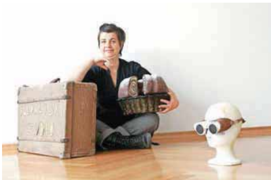
»V tem prostoru se dogaja gledališki studio z gledališko šolo, tu vadim, rojevam predstave. To je prostor Andreje Stare.«