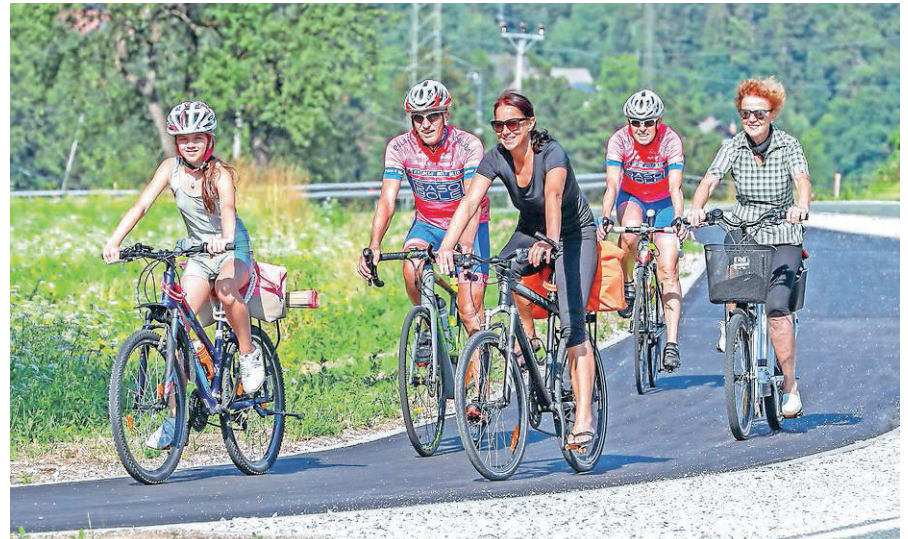
Prvi del kolesarske povezave Bled–Bohinj je skorajda končan.

Občini Bled in Bohinj sta zato projekt izgradnje kolesarske povezave kot regijski projekt prijavi na Dogovor za razvoj regije, tretja in najpomembnejša partnerica pri projektu pa je Direkcija za infrastrukturo, ki bo projekt tudi delno financirala. Februarja lani so člani Razvojnega sveta gorenjske regije in župani gorenjskih občin potrdili uvrstitev projekta Kolesarska povezava Bled–Bohinjska Bistrica v Dogovor za razvoj regij, kar pomeni, da kolesarsko povezavo do Bohinja gradijo s sredstvi evropskega Kohezijskega sklada, po planu najkasneje do leta 2023. Gradnja kolesarske povezave Bled–Bohinjska Bistrica poteka v več fazah. Prva faza vključuje območje od Mačkovca (oz. od priključka na bodočo južno razbremenilno cesto) skozi Bohinjsko Belo do Obrn, kjer so dela zdaj že pri koncu. Vrednost pogodbenih del znaša dobrih 250.000 evrov. V sklopu investicije je poleg izgradnje slabih šeststo metrov kolesarske poti še ureditev prehoda za kolesarje v Mačkovcu (za možno navezavo na kolesarsko pot ob Savi Bohinjki) in ustrezna prometna ureditev kolesarske povezave po obstoječi lokalni cesti skozi prometno manj obremenjeno Bohinjsko Belo do Obrn. Drugi in gradbeno najbolj zahteven odsek