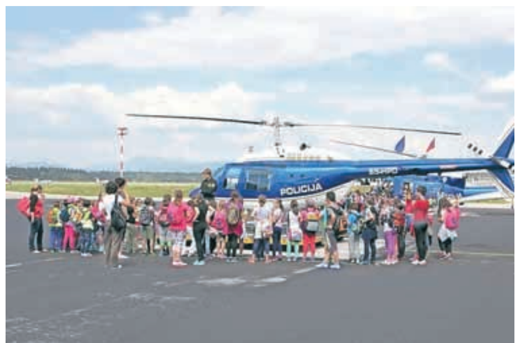
Helikopterje in ostalo opremo Letalske policijske enote na Brniku si je ogledalo kar 250 otrok.