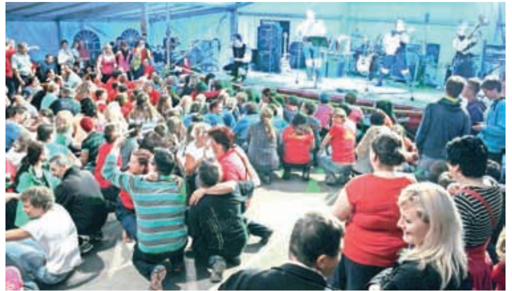
Koncert Modrijanov in poln prireditveni šotor »na placu«

nagovorili tudi predstavniki gasilske zveze Slovenije, Gasilske zveze Jesenice in Občine Jesenice.