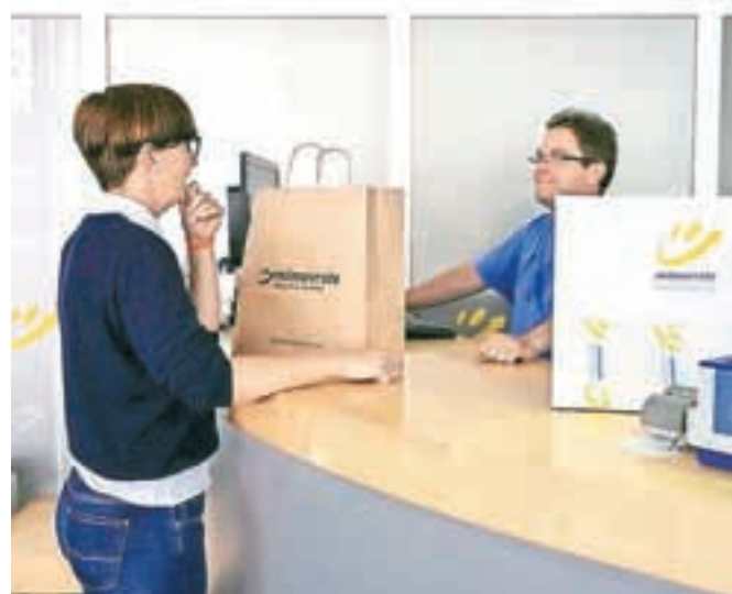
Na Jesenicah je poleg pisarn in klicnega centra tudi prevzemno mesto.