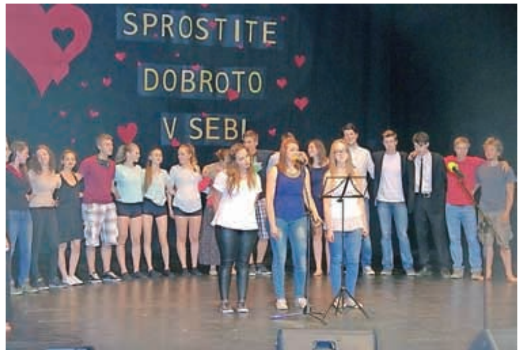
Dijaki Gimnazije Jesenice so zbirali denar za sošolce iz družin v socialni stiski.