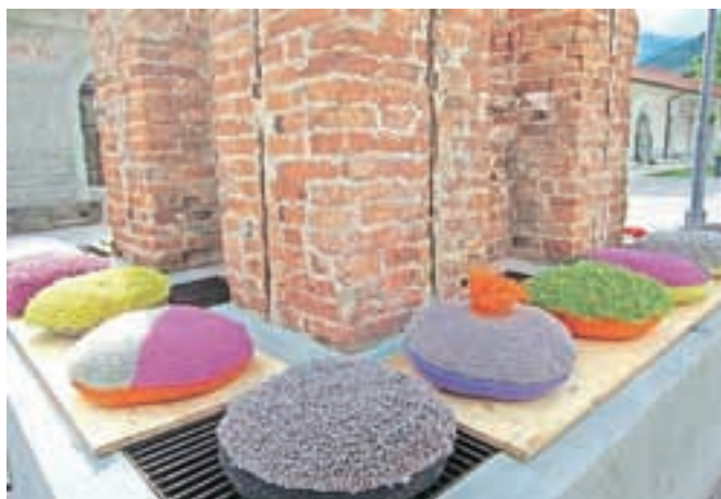
Nenavadna razstava ob plavžarskem dimniku na trgu na Stari Savi

projekcija fotografij od začetkov projekta Razkrite roke, mize so se šibile pod bosanskimi, kosovskimi in srbskimi dobrotami. Dogodek so pripravila dekleta iz zavoda Oloop, društva UP in Gornjesavskega muzeja Jesenice.