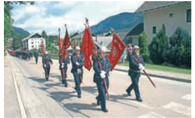
Gasilska parada hrušenskih gasilcev ter njihovih prijateljev iz Gorenjske in zamejstva