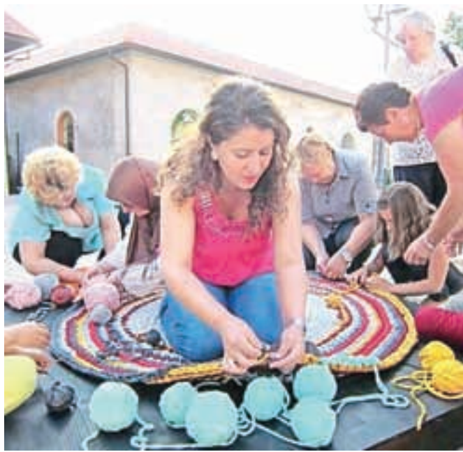
Pletenje skupnostne preproge