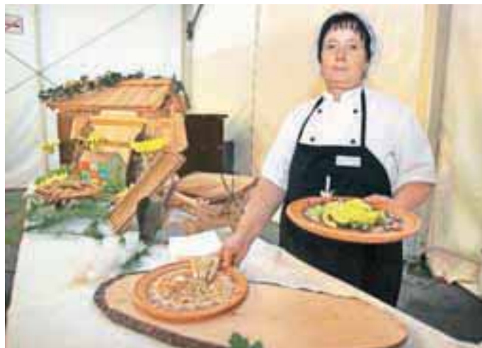
Pri Marjetki Ivanovič ste se lahko nagledali in naužili domačih dobrot ali pa vas je zamikal ričet s suhim mesom.