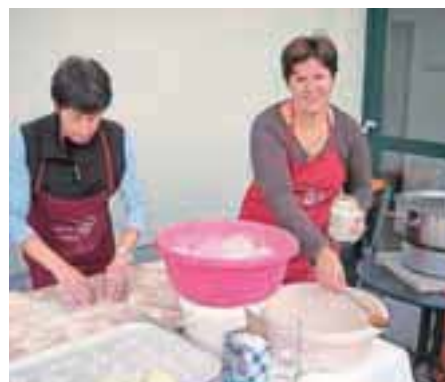
Članice turističnega društva Rateče - Planica so kuhale domače rateške krape.