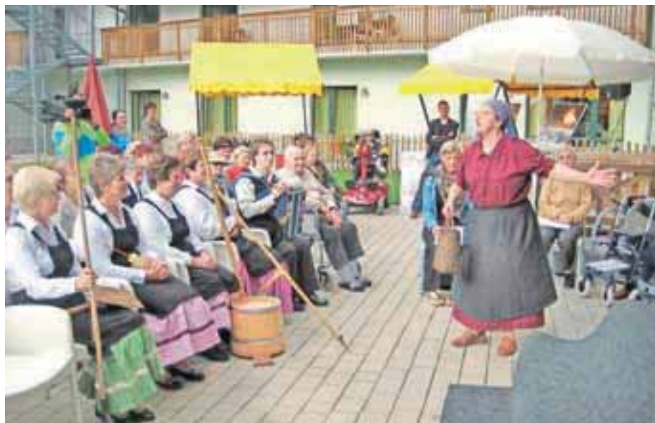
Udeleženci so z velikim veseljem prisluhnili nastopu v pristni zgornjesavski govorici.