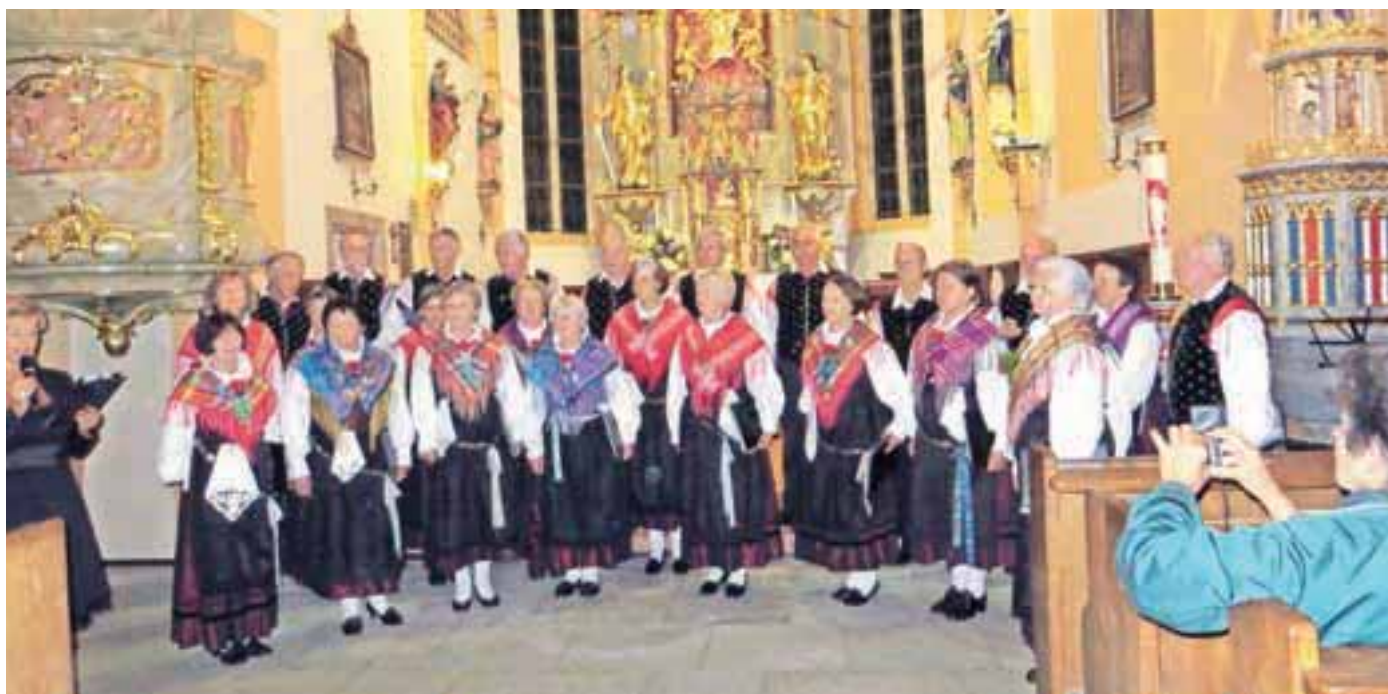
Škerlovi dnevi so bili tokrat v kranjskogorski cerkvi.