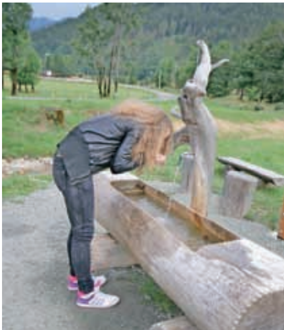
Žejni obiskovalci se radi ustavljajo ob pitniku jezerske slatine.