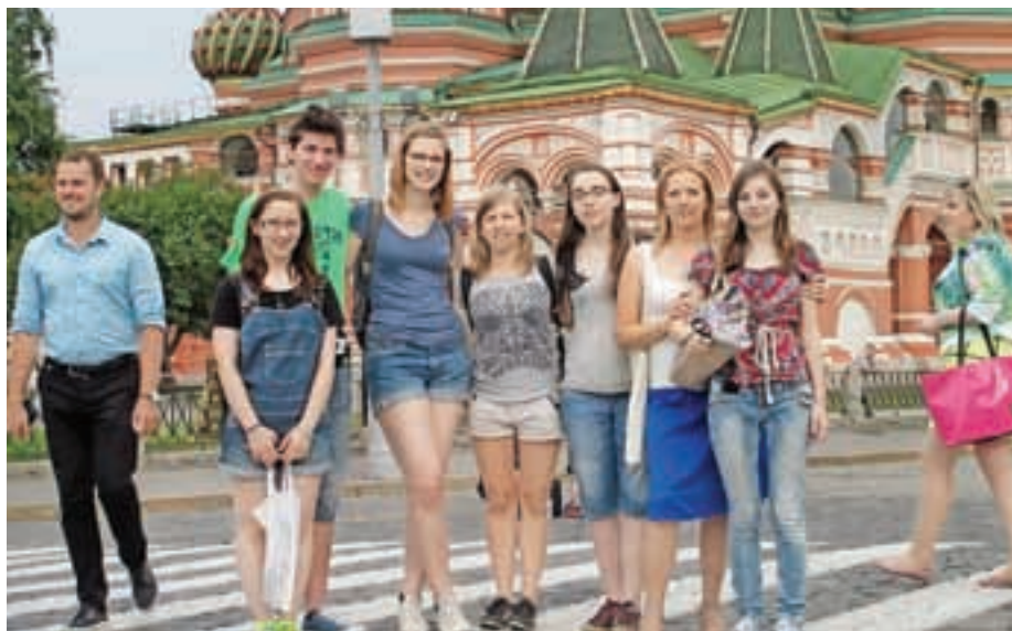
Udeleženci olimpijade v znanju ruskega jezika v Moskvi