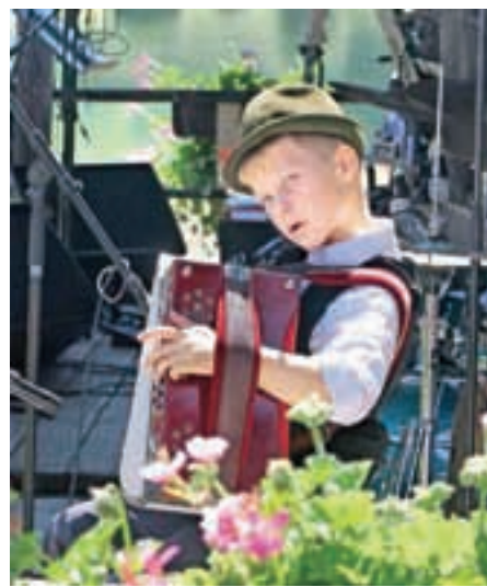
Dogajanje so popestrili nadarjeni mladi glasbeniki.