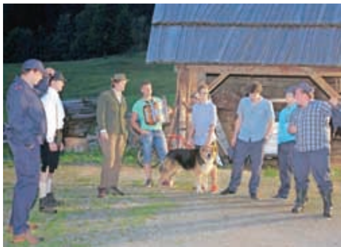
Posvet fantov pred odhodom na vasovanje