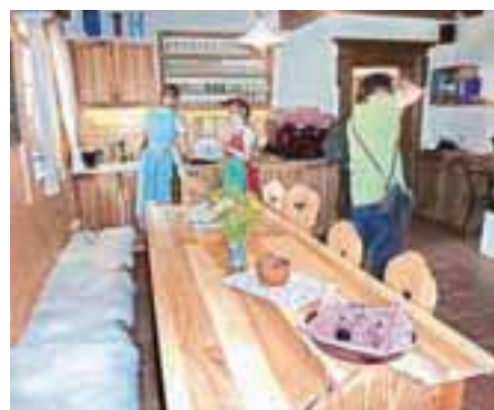
Detajl iz prijazne notranjosti