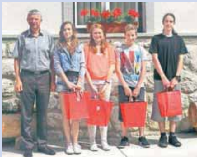
Župan z učenkami in učenci, ki so končali osnovno šolanje.