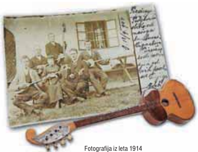
Fotografija iz leta 1914

Vencelj Preddvor d.o.o. Belska 15, Preddvor