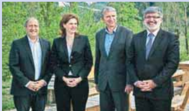
Predsednica vlade maja na Jezerskem