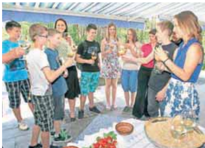
Na zdravje uspehu in prihodnosti