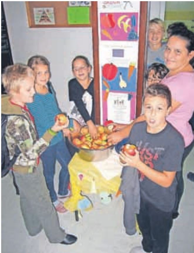
Skoraj vsi učenci so prišli po sadje, in sicer ekološka jabolka topaz in ekološke slive.