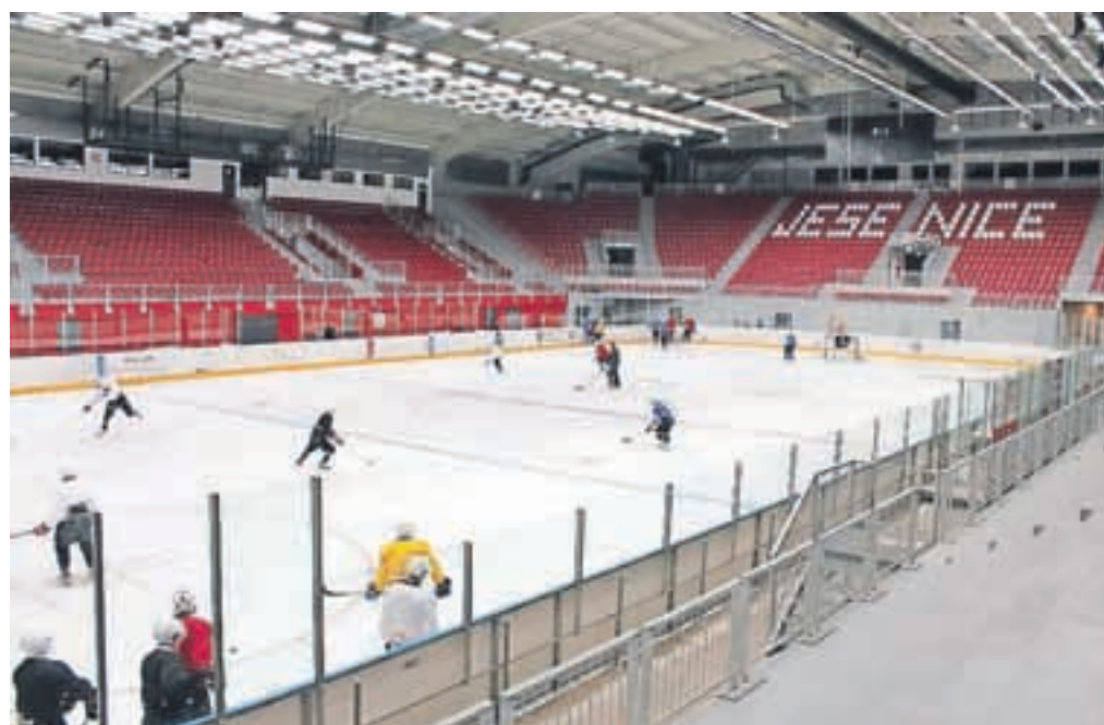
Dvorana Podmežakla je z ledeno ploskvijo spet dobila znano podobo, pri treningu smo ujeli ekipo Team Jesenice.

Jutri ob 18. uri Jeseničane čaka premierni nastop v INL ligi pred domačim občinstvom, z ekipo Ghardeina. Navijači, ki jim srce bije za igralce v rdečih dresih, znajo biti zelo kritični, a borbeno igro znajo še kako dobro prepoznati. Upajmo, da bodo tribune čim bolj polne. V nedeljo hokejiste čaka gostovanje v Zell am Seeju.