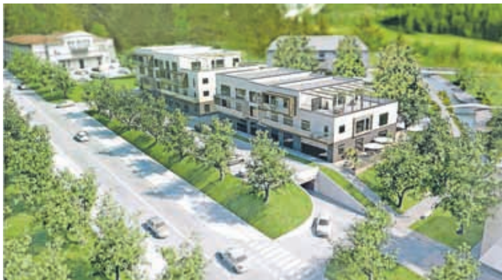
Računalniška vizualizacija, kako naj bi izgledala dva večstanovanjska objekta ob Cesti železarjev.