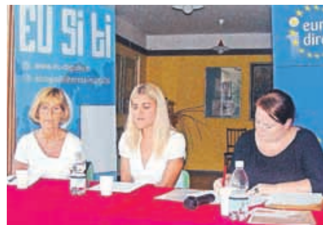
Tematski dan pri jeseniških upokojencih

Klemenc. Vodstvo krajevnosti je za vsakega izmed nagrajencev pripravilo manjša družinska presenečenja, prireditev pa se je zaključila s pogostitvijo in druženjem krajanov. Zaključek praznovanj praznika krajevnosti je bil v nedeljo na Pristavi v Javorniškem rovtu, kjer so pripravili družabno srečanje krajanov, zaval pa jih je Hajni Blagne.