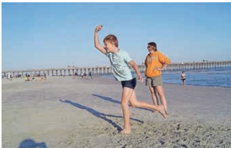
Amerika je lepa, a Jezersko je najlepše.

Prejšnji teden nam je narava ukradla pouk. Zaradi žleda so drevesa podirala daljnovode in padala na ceste, zato so bile številne ceste