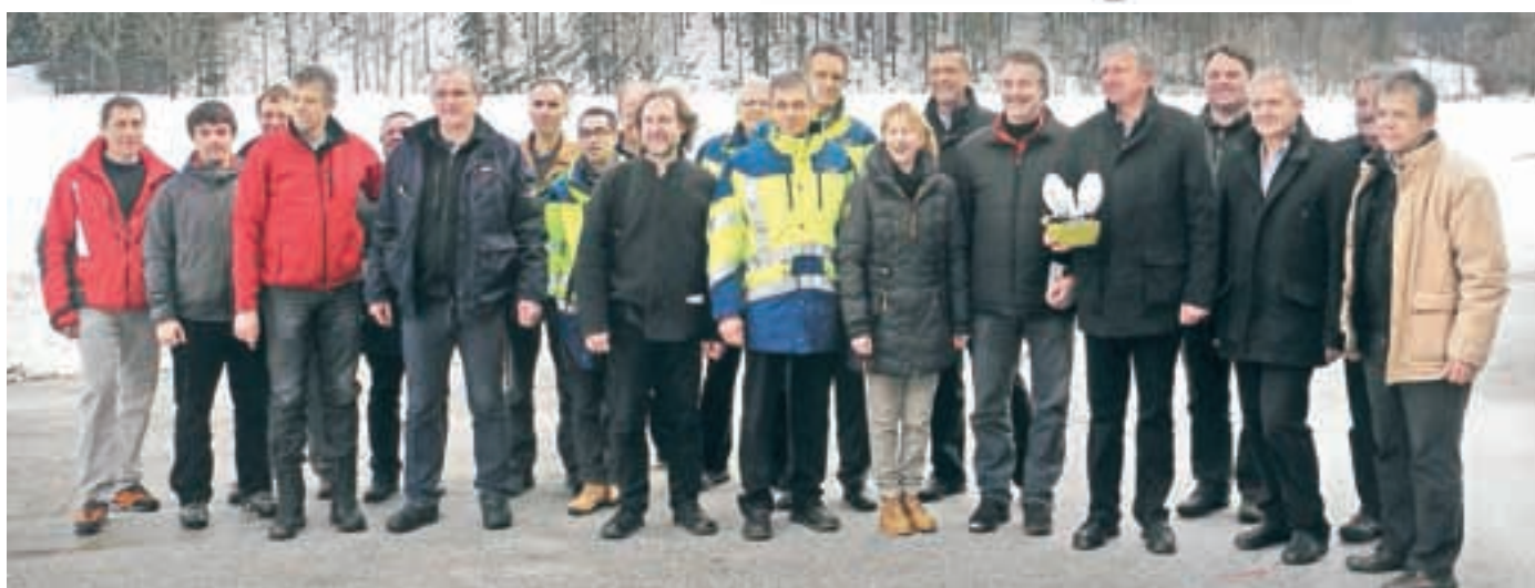
Srečanje sodelujočih na Jezerskem pri vzpostavitvi povezave med slovenskim in avstrijskim distribucijskim omrežjem.