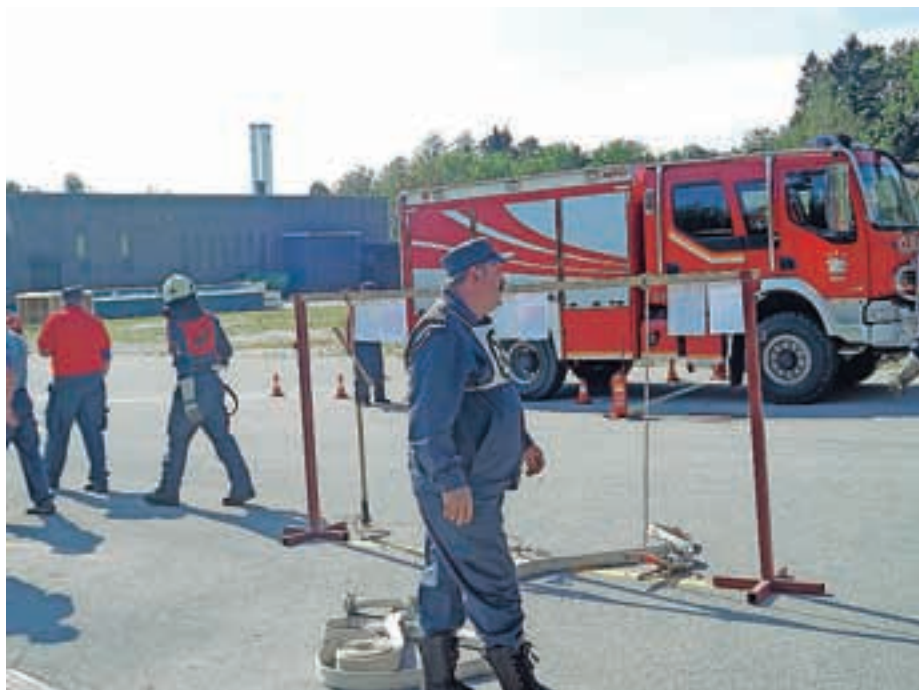
Prvi med gasilci v akciji