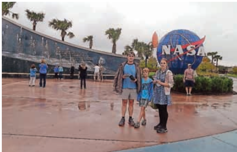
Prizor iz Amerike

zaprte. Ker so drevesa padla na električne kable, številne hiše niso imele elektrike. Mi je nismo imeli že od sobote, dobili pa smo jo šele naslednjo soboto popoldne. Zaradi žleda se je v Postojni podrlo 20 milijonov kubičnih metrov lesa. Po televiziji so rekli, da je Jezersko odrezano od sveta. Ko sem slišal, kako drevesa od mraza in ledu pokajo, sem se ustrašil. Pri tej katastrofi so pomagali gasilci, električarji, vojaki, gozdarji in delavci civilne zaščite. Ko je bil spet pouk, sem bil zelo vesel.