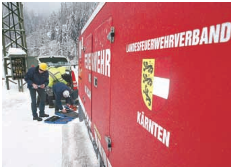
Priklop avstrijskega agregata na omrežje Elektro Gorenjska

Naravna katastrofa nas je znova opozorila, kako nujno je ustrezno vlagati v delovanje elektroenergetske infrastrukture in njeno kakovost. Tega se zelo zavedajo v Elektru Gorenjska, zato je gradnja podzemnega omrežja tudi njihov glavni strateški cilj. V zadnjem desetletju so v podjetju pristopili k sistematični in dosledni gradnji kabelsko nizko- in sredjenapetostnega omrežja. V tem trenutku je tako kot šestdeset odstotkov nizkonapetostnega omrežja in več kot petdeset odstotkov sredjenapetostnega omrežja v podzemni kabelski izvedbi. To jih uvršča na prvo mesto med distribucijskimi podjetji v Sloveniji glede višine odstotka nizko in sredjenapetostnega kabelskega omrežja in posledično tudi kakovosti omrežja, kar se je kot pozitivno pokazalo tudi v primeru nedavne vremenske katastrofe, saj je bila škoda na omrežju bistveno manjša kot v ostalih delih Slovenije.