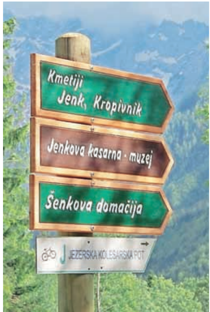
Novo turistične table

Poletne vikende so popestrili dogodki; etnografski, zeliščarski, gobarski in pravljичni vikend in glavna jezerska prireditev Ovčarski bal, ki je letos privabil rekordno množico gledalcev. Na delavnici predelave volne, ki je potekala