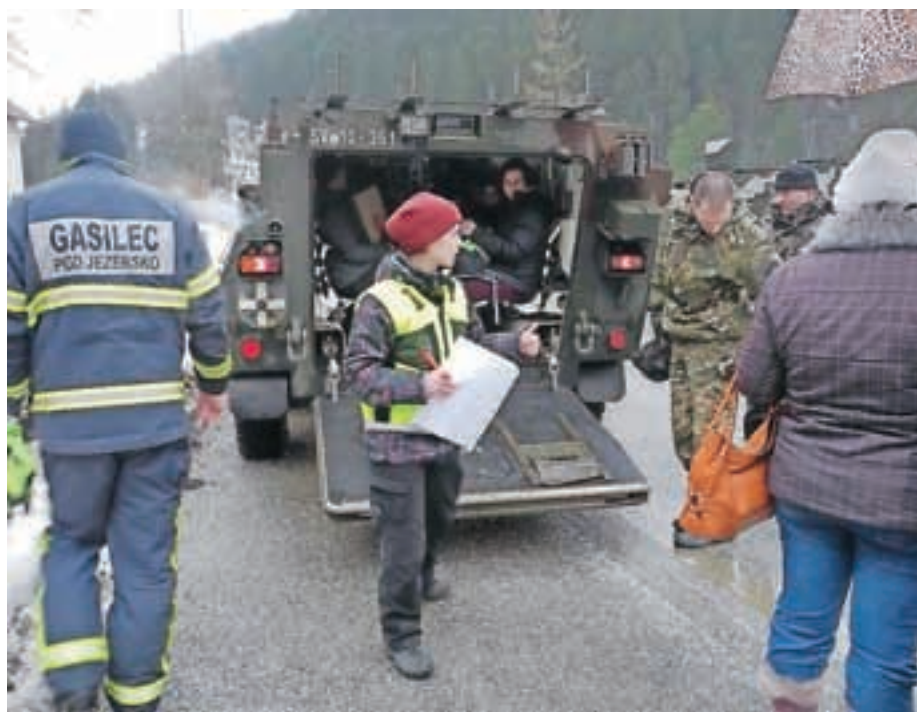
Jezersko so med februarso ujmo oskrbovali vojaški oklepniki.

V sredo, 5. februarja, smo v center štaba CZ