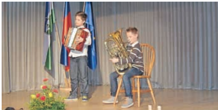
Mladi nastopajoči na občnem zboru upokojencev