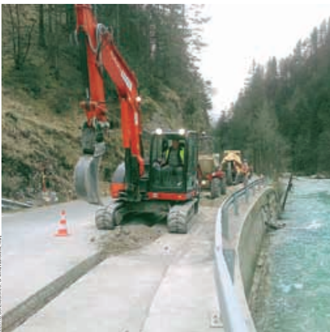
ELEKTROGORENJSKA d.o.o. | U. Minca/Vodovar 28. 12/2014

Največ okvar na omrežju je bilo predvsem v višje ležečih in težje dostopnih krajih, med katerimi je bilo prav v dolini Kokre najhuje, saj je podrtje drevje popolnoma uničilo osem kilometrov dolgo daljnovidno povezavo ter onemogočilo dostop do mesta okvar. Na pomoč so kmalu priskočili delavci Elektra Gorenjska, ki so navkljub nevarnostim na cesti tvegali in 2. februarja na Jezersko pripeljali velik agregat, ki je nato do 14. februarja oskrboval 311 odjemalcev na področju Jezerskega. Elektro Gorenjska je 4. in 5. februarja priklučil še dva manjša agregata (Zgornje Fužine, Kanonir), ki so ju prispevali sosedje iz Avstrije v okviru mednarodne pomoči. Na pobudo Elektra Gorenjska so kmalu stekli tudi pogovori s predstavniki podjetja Kelag iz Avstrije za vzpostavitev začasne povezave dveh elektroenergetskih omrežij, kar je bila želja Elektra Gorenjska že v preteklosti. Kolegi iz Avstrije so pokazali veliko mero solidarnosti in pripravljenosti na pomoč, tako je bila energetska povezava na Jezerskem vrhu med Avstrijo in Slovenijo vzpostavljena v dobrem tednu. O nadaljnjih načrtih in izrabi te povezave se bodo predstavniki obeh podjetij uskladjali na tehničnih sestankih, dejstvo pa je, da gre za prvo tovrstno obliko meddržavne energetske povezave v Sloveniji, ki