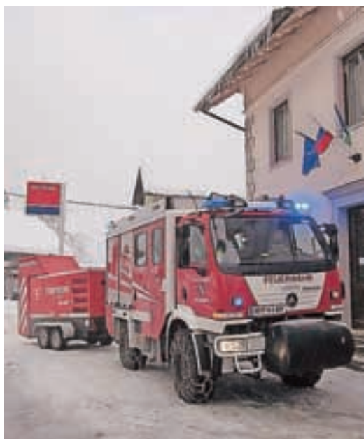
Elektriko je dolina dobivala iz agregatov.