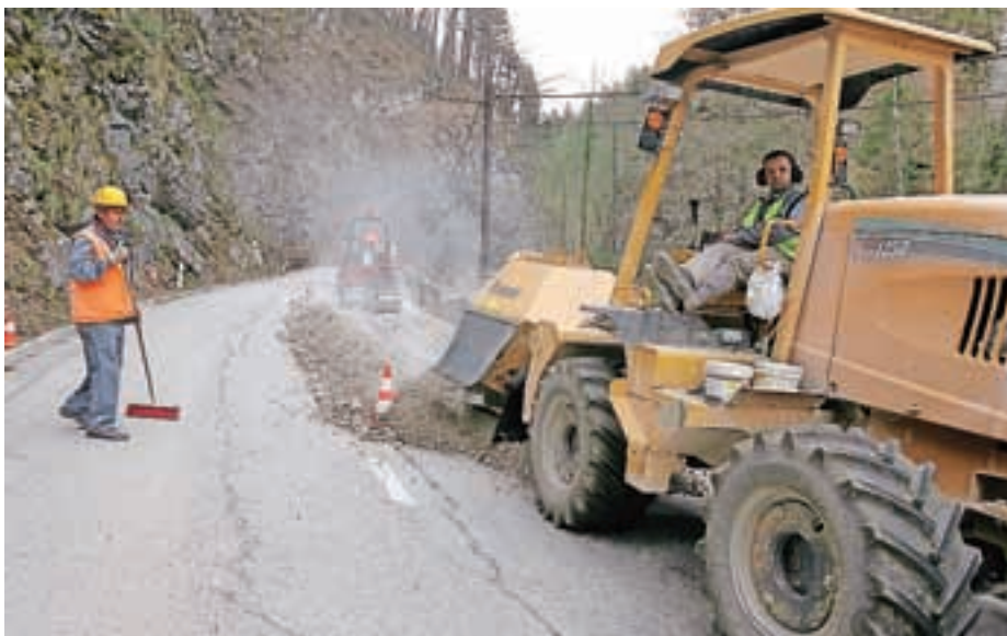
V dolini Kokre že polagajo kable v tla.

V zahvalo sta Elektro Gorenjska in Občina Jezersko pripravila manjše srečanje na Jezerskem, na katerem pa je med predstavniki podjetij Elektra Gorenjska in Kelag tekel konstruktiven pogovor o možni trajni rešitvi elektrifikacije, ki bi bila ustrezna za obojestransko pomoč.