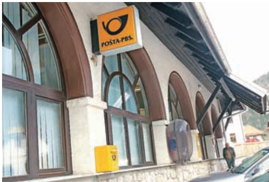
Danes še na pošto, junija že na pošto v trgovini.