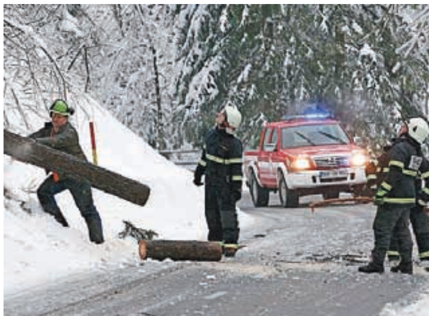
Eden od prizorov iz doline Kokre.

Preddvor napolnili predstavnik CZ Občine Jezerško zaradi organizacije in nadzora nad prevozi osnovnih potreb z vojaškimi oklepni vozili med Preddvorom in Jezerskim, skrbel je tudi za organizacijo prevoza oseb. Med 3. in 7. februarjem ni bilo pouka v podružnični šoli na Jezerskem, zaprt je bil tudi vrtec. V nedeljo, 9. februarja, se je cestna zapora regionalne ceste iz Tupalič premaknila na Povšno (Rekar) in na to lokacijo se je premaknil tudi »logistični center«. V nedeljo smo vzpostavili vozni red Jezerško–Preddvor (po sestanku občin Jezerško in Preddvor, Alpetourja, vojske in OŠ Preddvor). Ob 16. uri so osnovnošolce od 6. do 9. razreda prepeljali k družinam sošolcev v Preddvor. V ponedeljek, 10. februarja, sta se odprla šola in vrtec na Jezerskem, zagotovljen je bil tudi izreden vozni red