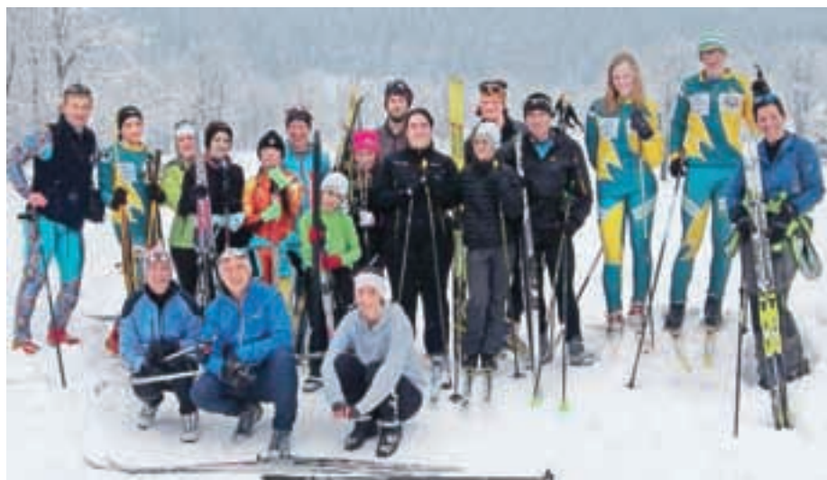
Spet je oživel tek na smučeh.