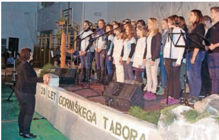
V bogatem kulturnem zboru so sodelovali tudi šolski pevski zbori.

»Planinstvo je najcenejša in najbolj dostopna športna dejavnost, ki pripomore k zdravju in sprostitvi v vseh življenjskih obdobjih. Poleg hoje je planinstvo varovanje okolja, kulturno poslanstvo, usposabljanje za varno hojo, prostovoljstvo in tudi del turistične dejavnosti. Živimo v okolju, kjer je tradicija planinstva doma, in prav je, da jo prek planinskih društev ohranjamo. Zato vabljeni, da se nam pridružite in uživajte v lepotah narave. Zadovoljstva se ne da meriti z rezultati in uspehi na visokih ravneh, ampak z vsakodnevni majhnimi koraki, ki so večkrat pomembnejši in vodijo k notranji sreči in miru. Kadar človek živi z naravo, lahko povsod najde lepoto.«