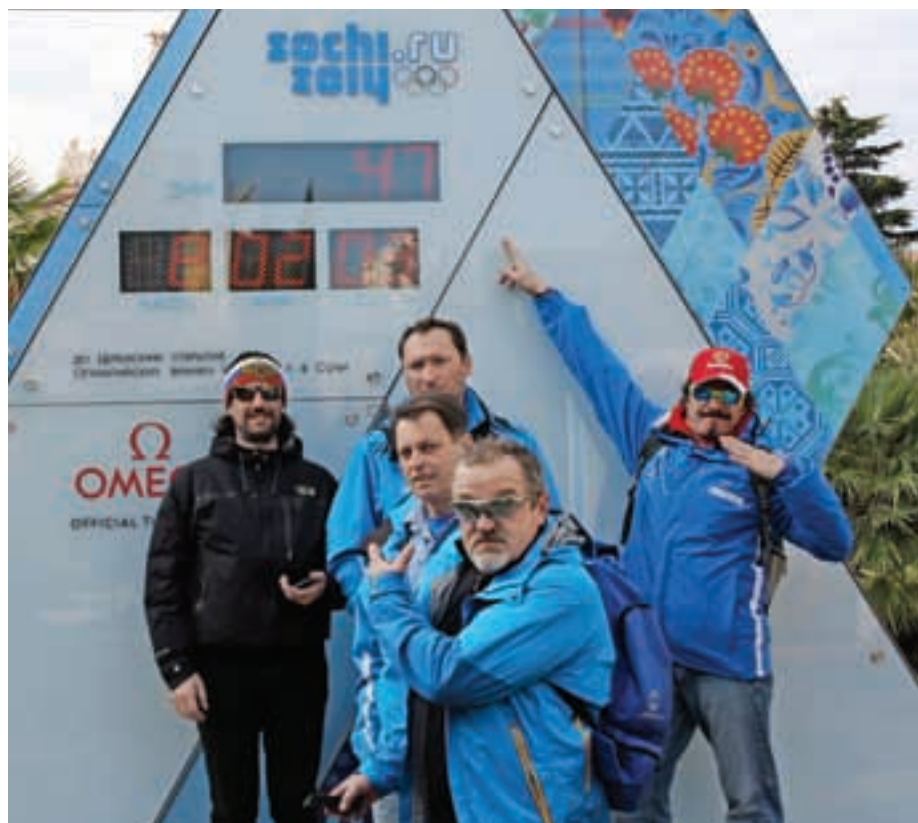
V Sočiju odštevajo dneve do začetka olimpijskih iger, tam pa je bila že decembra tudi ekipa planiških delavcev.

Takoj po novoletnih praznikih je na prizorišče olimpijskih iger v Rusijo odpotovala skupina planiških delavcev, ki na Krasni poljani skrbi, da bosta tamkajšnji skakalnici pripravljeni za letošnji največji zimski športni spektakel.