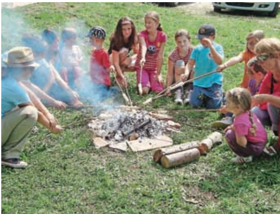
Igrajmo se v Rutah

»Lahko zelo pohvalim naš mladinski odsek. Organizacijo izletov izvajajo skupaj z mladinskima odsekoma Kranjska Gora in Dovje-Mojstrana. Letos smo imeli zadnjo soboto v avgustu znova tradicionalno prireditev Igrajmo se v Rutah. Zadnji dve leti je udeležba odlična. Lani se je skozi ves dan zvrstilo okoli šestdeset udeležencev – otrok, staršev in starih staršev. Prireditev pripravimo skupaj s Centrom za pomoč mladim iz Kranjske Gore. Zakaj smo se odločili za ta igralni dan? Ker igra pomeni način življenja, spoznavanje sveta, izražanje samega sebe, otroci se naučijo sodelovanja z vrstniki. Igrali so se z mivko, izdelovali ogrlice, pekli kruh, se preizkusili v hoji po vrvi in na hoduljah. Potekala je tudi poslikava obraza.«