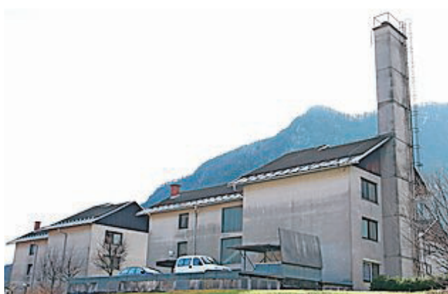
V Mojstrani se bodo ogrevali na lesne sekance.

Obnova starega sistema daljinskega ogrevanja v Mojstrani je eden prvih primerov pogodbene oskrbe s toploto iz obnovljivih virov energije (lesni sekanci) za skupino večstanovanjskih stavb v Sloveniji. Pozitiven pristop vseh sodelujočih – etažnih lastnikov, upravnika, investitorja in izvajalca – pa odličan primer dobre prakse.