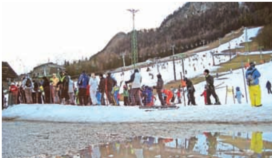
Smučarji že težko čakajo na pravo zimo.