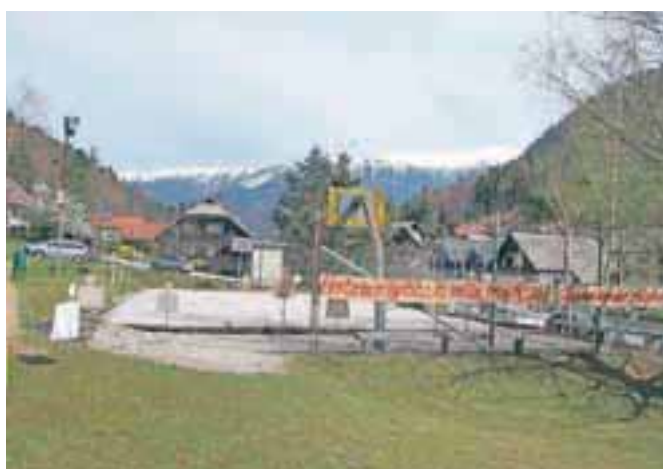
Krajanje želijo igrišče in vaško središče.

namenjen za prireditve in druženja krajanov. Ta stoji na zasebnem zemljišču, člani društva se odločno zavzemajo, da ga Občina odkupi. Predlagana cena je 170 tisoč evrov, Občina pa teh sredstev nima. Člani društva tudi po sestanku vztrajajo pri svoji zahtevi. Občina poleg omenjenega športnega igrišča gradi na svojem zemljišču otroško igrišče iz programa Lider. To bo pridobitev predvsem za otroke do osmega leta starosti. Na sestanku so opozorili, da je treba na igrišču ob cesti namestiti zaščitno ograjo ali narediti ustrezen nasip. Med problemi so izpostavili še meteorne vode, vendar bodo to na svojih zemljiščih krajanje morali rešiti sami. Člani KŠD Obranca so sedaj v uporabo dobili gasilsko orodišče, ki ga bo potrebno obnoviti. Tam je tudi volišče za naselje Kočna.