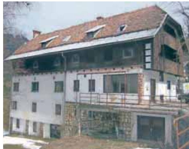
Zapuščeni Dom pod Golico sredi vasi danes

Druga svetovna vojna in prva povojna leta niso prizanesla niti Boštjanu Belcijanu niti hotelu. Mojster je bil kljub sodelovanju s partizani po vojni obsojen na zaplembo premoženja, ker je med vojno nadaljeval gradbeno dejavnost. Odvzem premoženja ga je zelo potrl. Od takrat se je preživljal kot nadzornik pri različnih gradnjah in z risanjem načrtov, posvetil pa se je tudi čebelarstvu. Strt in zagrenjen je umrl 24. avgusta 1970 na svojem domu v Gori pri Komendi.