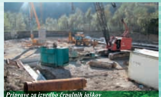
Priprave za izvedbo črpalnih jaškov

Kljub začetnim težavam s nivojem podtalnice in črpanjem ter z žlindro v obstoječih nasipih, ki so povzročile kar nekaj zamude pri gradnji centralne čistilne naprave, dela zdaj tako pri centralni čistilni napravi kot pri gradnji kanalizacije potekajo po zastavljenih načrtih, s tem da se skrajšuje doba poskusnega obratovanja čistilne naprave. Trenutno so tako izvedena gradbena dela na obeh sekundarnih usedalnikih in varovanje gradbene jame s pilotno steno za strojnico ter aeracijski bazen, izvajajo se črpalni jaški za znižanje podtalnice za potrebe izgradnje strojnice in aeracijskega bazena.