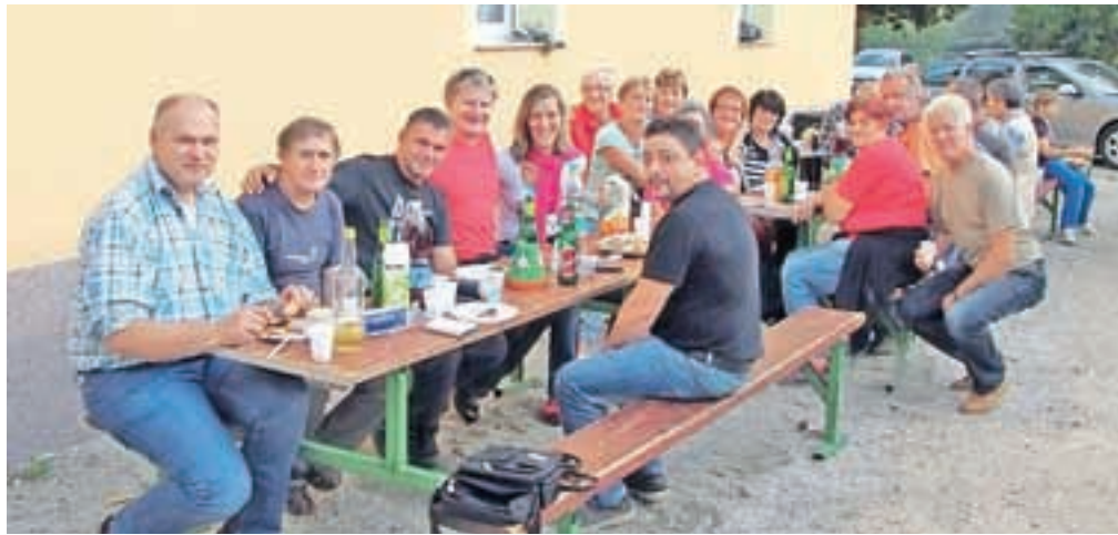
Ob zaključku prenove fasade so pripravili prijetno druženje.

V večstanovanjski stavbi Hrušica 70 je 22 stanovanj zagotovo lahko za vzor, kako premostiti včasih kar resne težave z ogrevanjem in urejenostjo bivalnega okolja. Leta 2012 so najprej pogumno izpeljali prvo zahtevnejšo investicijo. Med več možnostmi so se odločili za ogrevanje z zemeljskim plinom. Izvajalec jim je postavil najbolj sodobno kotlovnico, ki je bila prva takšna v občini Jesenice. Optimistična napoved s prihrankom