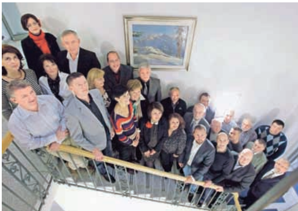
Novi jeseniški občinski svet