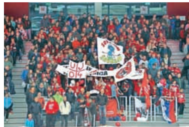
Navijaška skupina Ultras Jesenice je s transparenti, baloni in baklami obeležila 10 let delovanja, s transparentom pa so se zahvalili tudi ekipi HDD Jesenice.