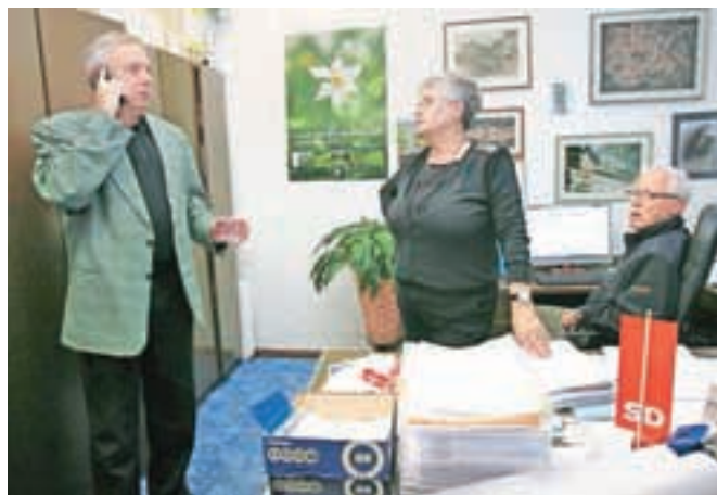
V napetem pričakovanju izidov