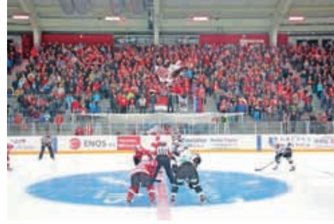
Več kot dva tisoč gledalcev je po treh letih zatišja v Športni dvorani Podmežakla znova do zadnjih minut trepetalo za rdeče ... / BESEDILO: ANDRAŽ SODJA