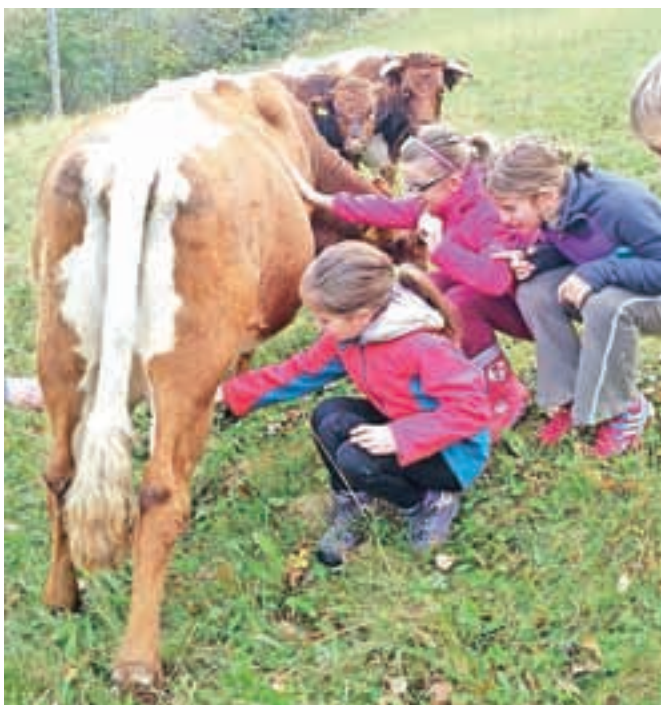
Najbolj prijazno kravo Murko otroci skušajo tudi pomolzti.