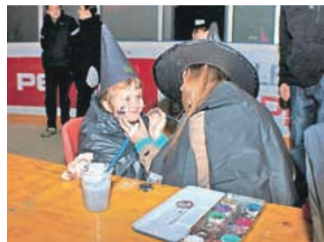
Delavnice barvanja obraza