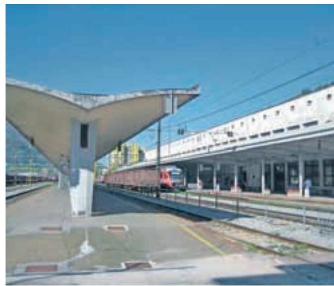
Železniška postaja z južne strani