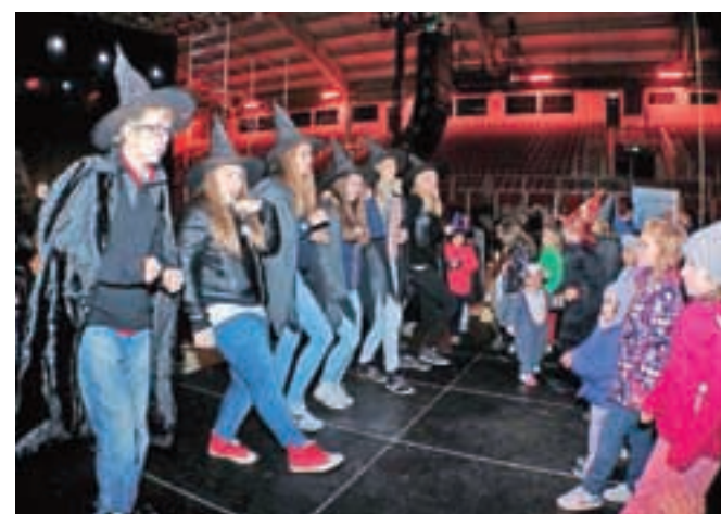
Skupinski ples z animatorkami, dijakinjami Srednje šole Jesenice