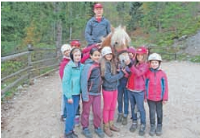
Otroci na kmetiji navežejo stik z domačimi živalmi, zlasti konji.