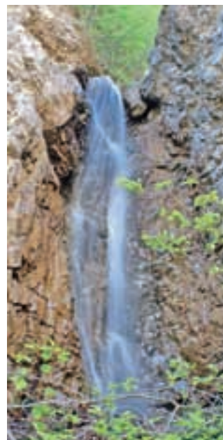
Drugi slap, mimo katerega je vodila pot, zaščiten z jeklenico, ki jo je odnesla zadnja povodenj.

steno levo od njega vklesane gladke stopnice, nekoč pa jih je varovala tudi jeklenica, od katere pa so ostali le še trije zarjaveli klini. Tako je pot naprej za nekoga brez plezalnih izkušenj zelo težka, še težje pa je nadaljevanje poti od tretjega slapu. Še pred prvim slapom se je treba prebijati preko polomljenega drevja, podorov in razrite struge, ki kaže bes narave v zadnjih letih. Oko večkratnega obiskovalca soteske te spremembe hitro opazi. Vsekakor soteske ne priporočamo za nedeljski izlet, za izkušenejšo planince pa lahko predstavlja pravi izziv. Izziv pa predstavlja tudi za prihodnost Jesenic, vsaj z razmislekom o ponovni turistični ureditvi soteske in njeni vrnitvi na nekdanja pota slave.