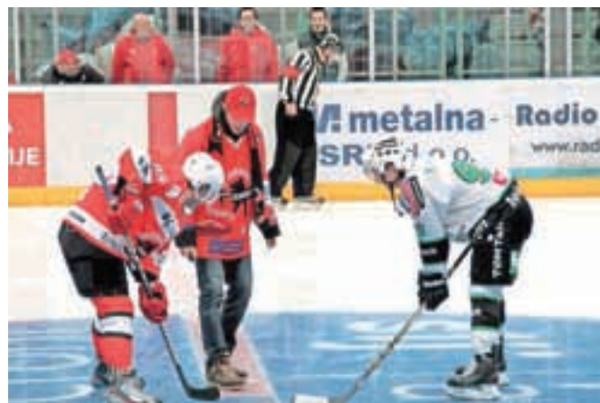
Prvi plošček na drugem letošnjem večnem derbiju med HDD SIJ Acroni Jesenice in Telemach Olimpijo je vrgel skakalni šampijon Peter Prevc.

Kljub porazu in dejstvu, da Telemach Olimpija na Jesenice ni prispela v postavi, s katero nastopajo v ligi EBEL, ljubitelji hokeja drugega letošnjega derbija niso zapustili razočarani.