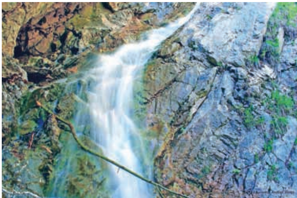
Prvi slap v soteski, pod njim je bil nekoč velik vodni zbiralnik.

Ob ogledu fotografij marsikateri Jeseničan, ko ga vprašajo, če ve, kje so bile fotografije posnete, le skomigne z rameni. Ko mu poveš, da so bile posnete v soteski le nekaj kilometrov stran, pa se presenečen začudi. Pred stoletjem bi vam prednik istega Jeseničana z roko pokazal smer do turističnega bisera – soteske in osmerice slapov potoka Dobršnik, ki vabijo z urejeno turistično potjo, od katere pa je danes ostala le še peščica zarjavelih klinov. Za zapuščenost soteske pa niso krivi zgolj ljudje, ki so jo zanemarili in nanjo pozabili v imenu razvoja drugih turističnih biserov nek-