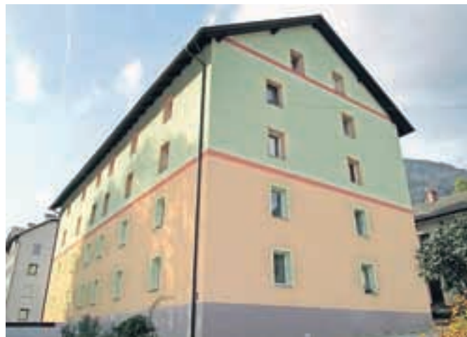
Stanovanci po prenovi prihranijo kar 45 odstotkov pri stroških ogrevanja.