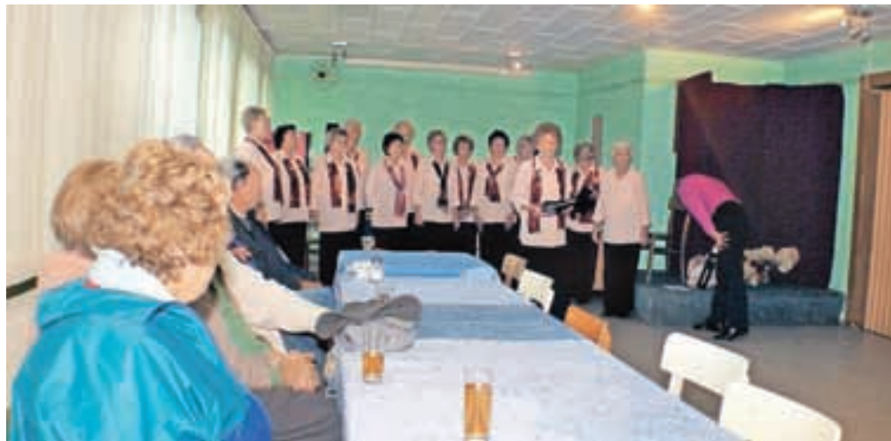
Pevke so navdušile z nastopom v sproščenem vzdušju.