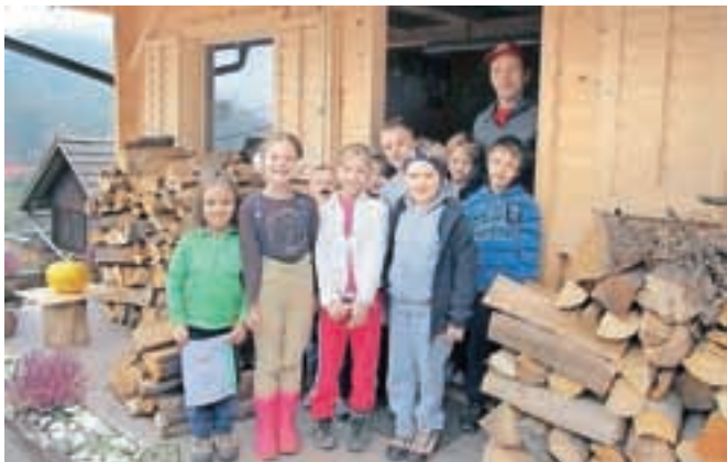
V Mihovi hiši se otroci pogrejejo in ustvarjajo.