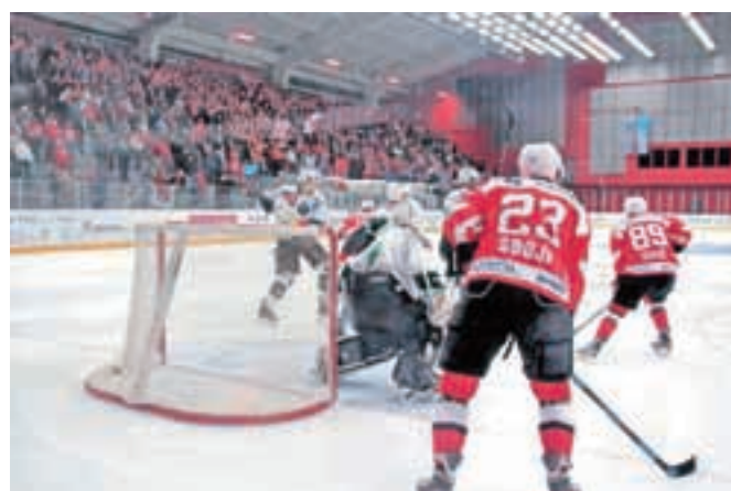
Kljub porazu s 4:2 so bili gledalci večinoma enotni, da so videli kvalitetno hokejsko tekmo in da to Jesenice potrebujejo.