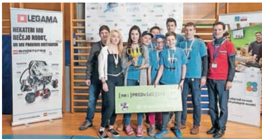
Kvalifikacije skupine A programa FLL v Predosljah