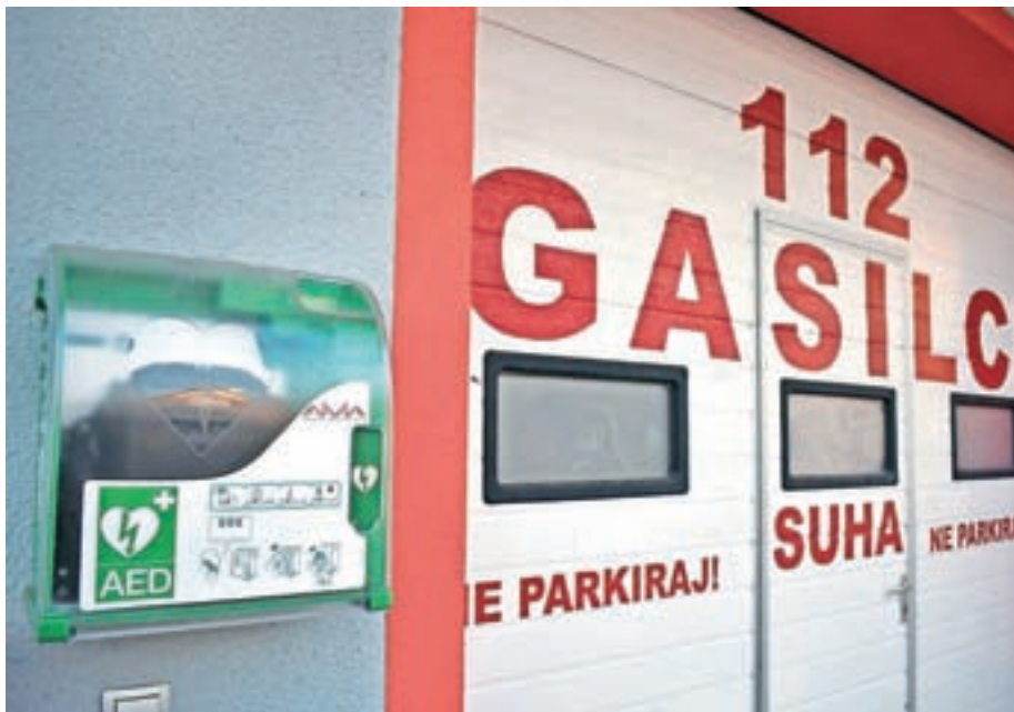
Novi defibrilator na gasilskem domu na Suhi

V mesecu decembru že tradicionalno obdarujemo vaščane Suhe in Predoselj, ki so starejši od osemdeset let. Naše sovaščane, ki jesen življenja preživljajo v različnih domovih za starejše, obdarujemo kar tam.