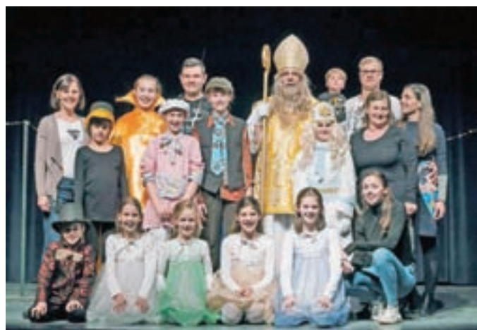
Deseti brat je polnil tribune v juniju in septembru.