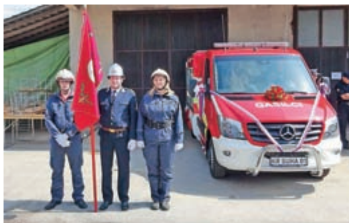
Prevzem novega gasilskega vozila