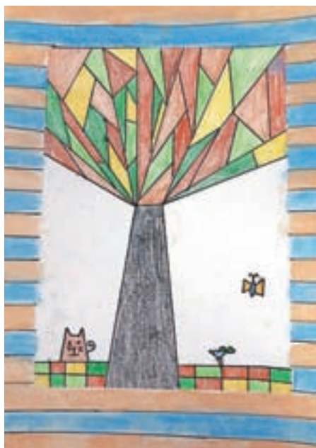
Tinkara Ovsenik, 3. a