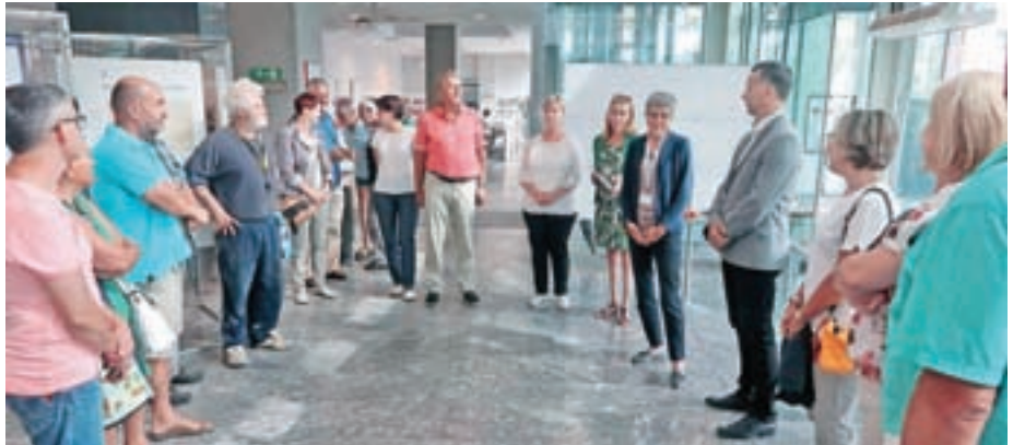
Predstavitve Suhe v Mestni knjižnici Kranj