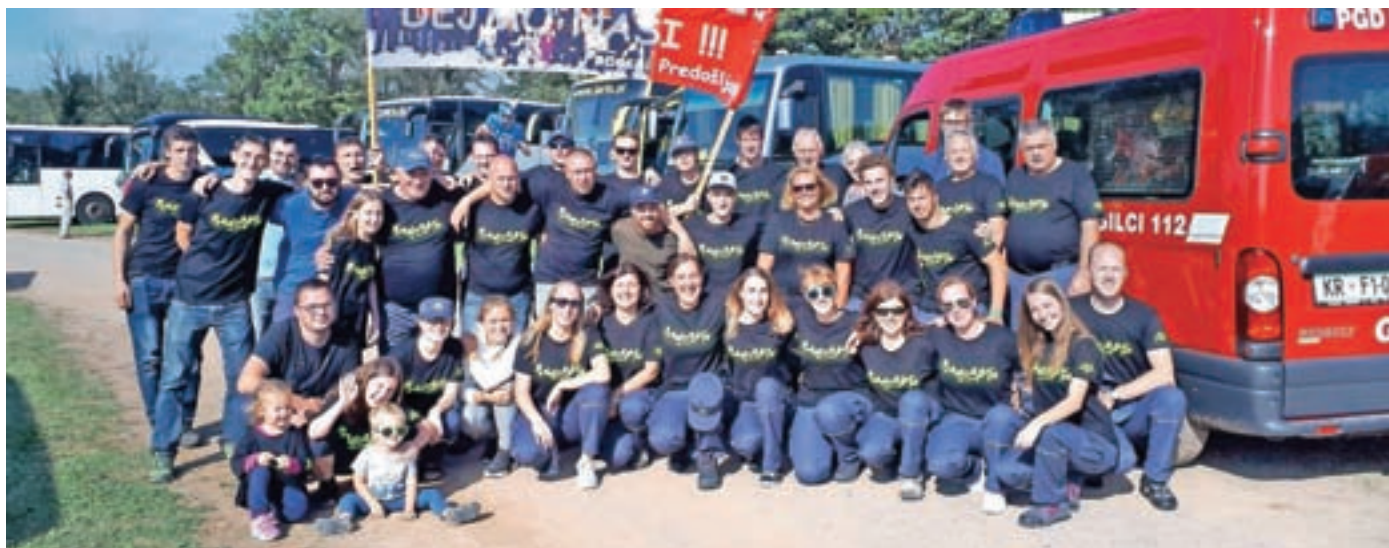
Udeleženci in navijači na državnem gasilskem tekmovanju

Gasilci iz Predoselj radi delajo, pomagajo in uspešno tekmujejo. S pomočjo krajanov, domačih in drugih podjetnikov ter vseh, ki podpirajo gasilstvo v vasi, jim je letos uspelo prenoviti orodišče.