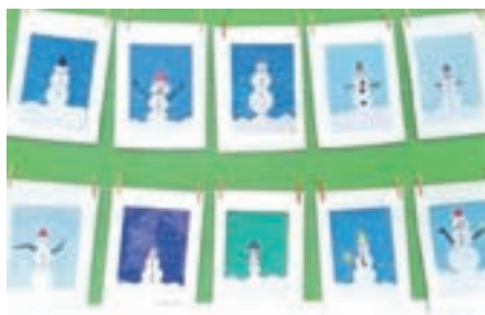
Snežake so oblikovali učenci drugega razreda.