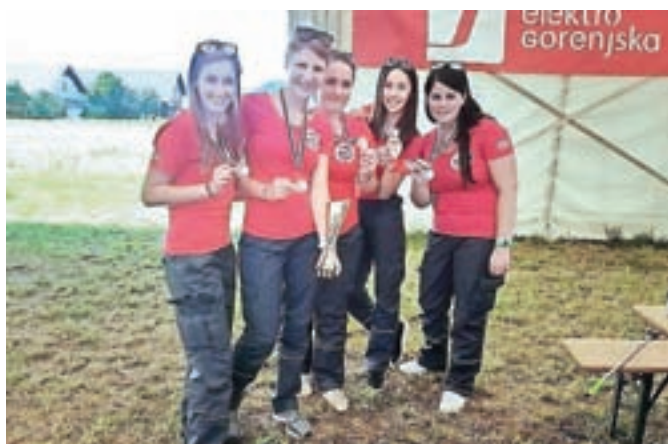
Ekipa članic je na srečanju članic GZ MO Kranj osvojila tretje mesto.