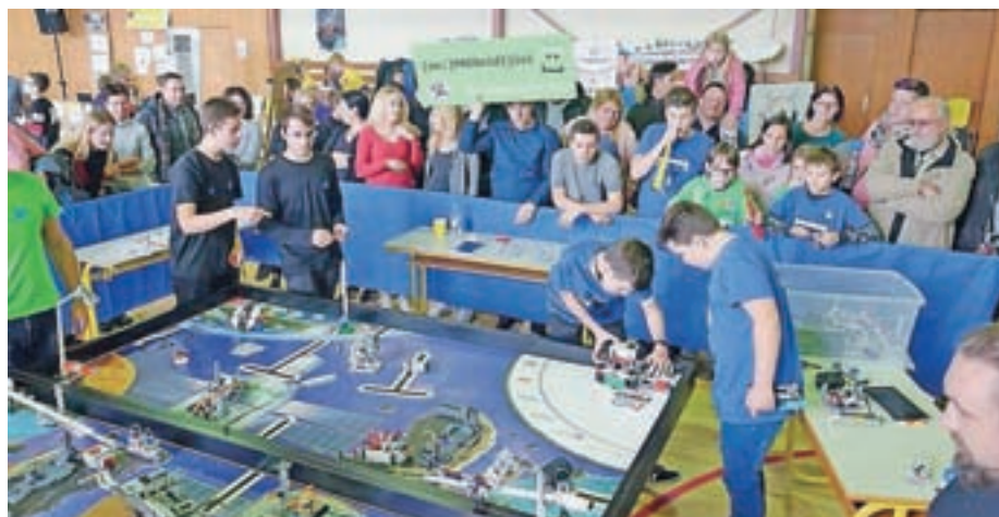
Odprto evropsko prvenstvo FLL v Estoniji