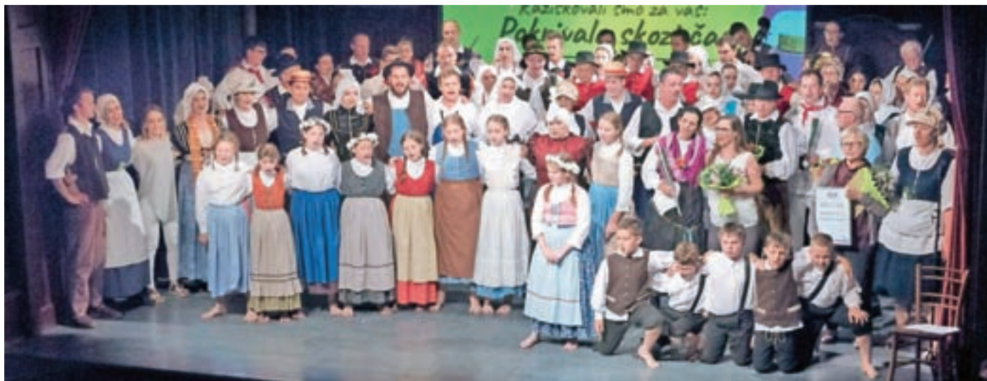
Folklorna skupina Iskraemeco ob praznovanju štiridesetletnice

Folklorna skupina Iskraemeco je letos praznovala štiridesetletnico delovanja. Jubilej smo proslavili prvo junijsko soboto.