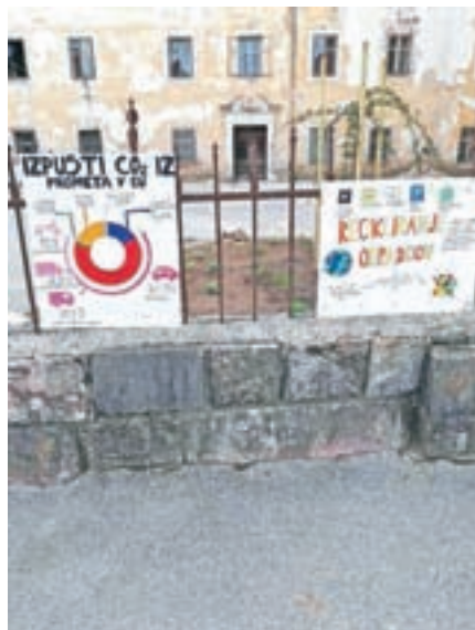
Opozorila otrok o trajnostni mobilnosti in ravnanju z odpadki

V soboto, 27. marca letos, smo učenci in učitelji sodelovali na čistilni akciji, ki jo je organizirala Občina Preddvor. Učenci posameznih oddelkov so se skupaj z dvema učiteljema odpravili na 19 tras v preddvorski občini, kjer smo v »mehurčkih« pobirali smeti. Bili smo pridni in zbrali veliko količino smeti ter tako prispevali svoj delež k čistemu in urejenemu okolju, v katerem živimo.