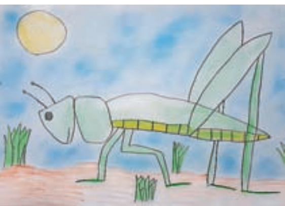
Neža Zorec, 2. a

Večina je bila mnenja, da moraš razmišljati s svojo glavo, zato je strah, da bi roboti nadomestili naše delo,