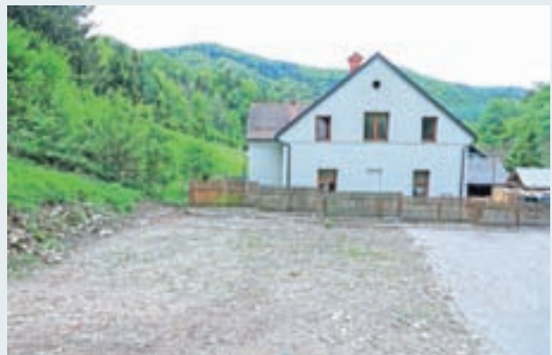
Pri podružnični šoli v Kokri bodo zgradili igrišče in parkirna mesta za potrebe šole.