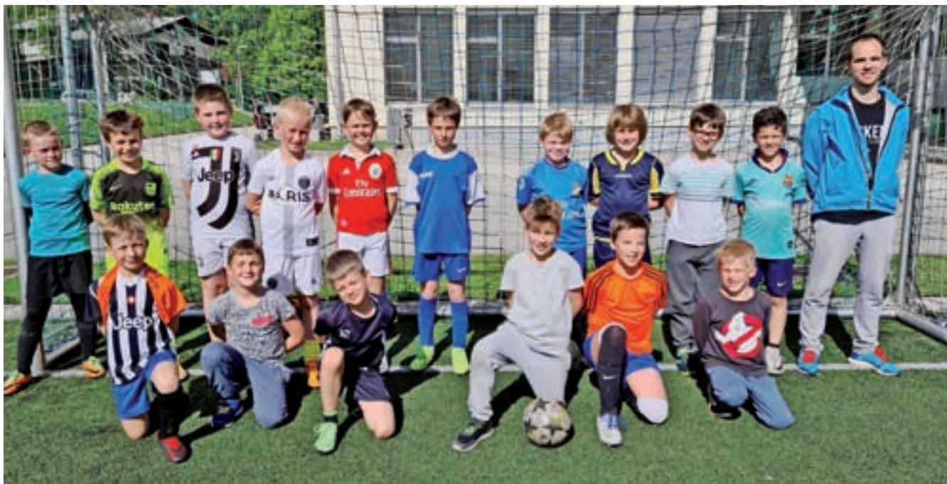
Mlajši cicibani U9 – za zdaj še na igrišču z umetno travo ob osnovni šoli

Medobčinska nogometna zveza Gorenjske Kranj je v četrtek, 13. maja, tudi uradno zaključila tekmovalno leto 2020/21. Zadnje prvenstvene tekme so bile tako odigrane lani sredi oktobra, morebitno nadaljevanje prvenstva v okrnjenem formatu pa bi bilo trenutno zelo težko izvedljivo.