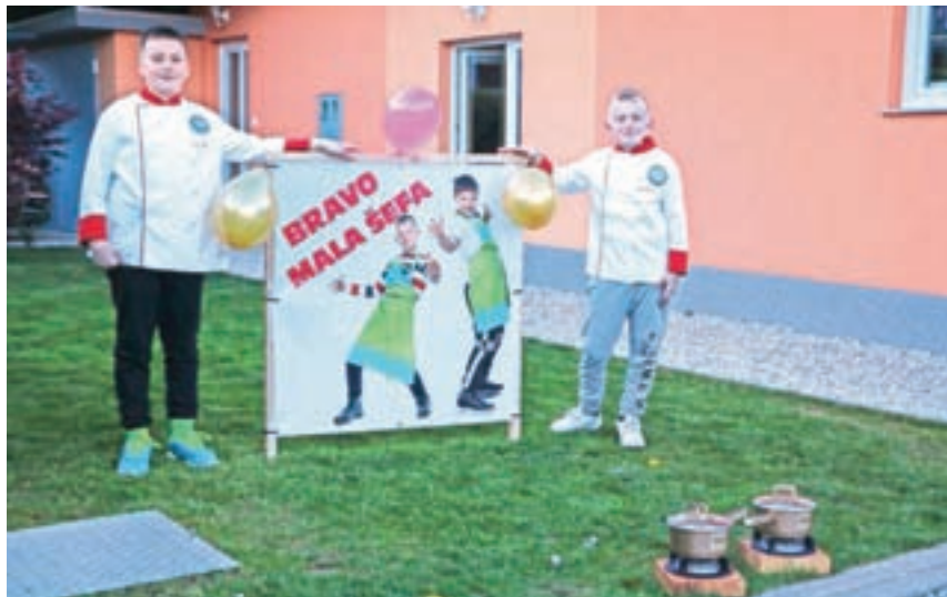
Zmagati v kulinarčni oddaji Mali šef Slovenije ni kar tako. Na dvorišču enega od tekmovalcev so domači fantoma postavili tudi plakat.

V zadnji oddaji naloga zagotovo ni bila enostavna: v sto minutah sta tekmovalna para morala dostaviti žiriji predjed, glavno jed in sladico. Navihana Bašljana sta bila na koncu s svojim bolj tradicionalnim menijem za zvezdico boljša in sta zmagala. Dobila sta pokal oddaje Mali šef Slovenije in svoji osnovni šoli tako zagotovila deset tisoč evrov denarne nagrade oziroma donacijo, ki jo podarja Mercator. Osvojena sredstva bodo v šoli prvi vrsti namenili za zunanjo učilnico.