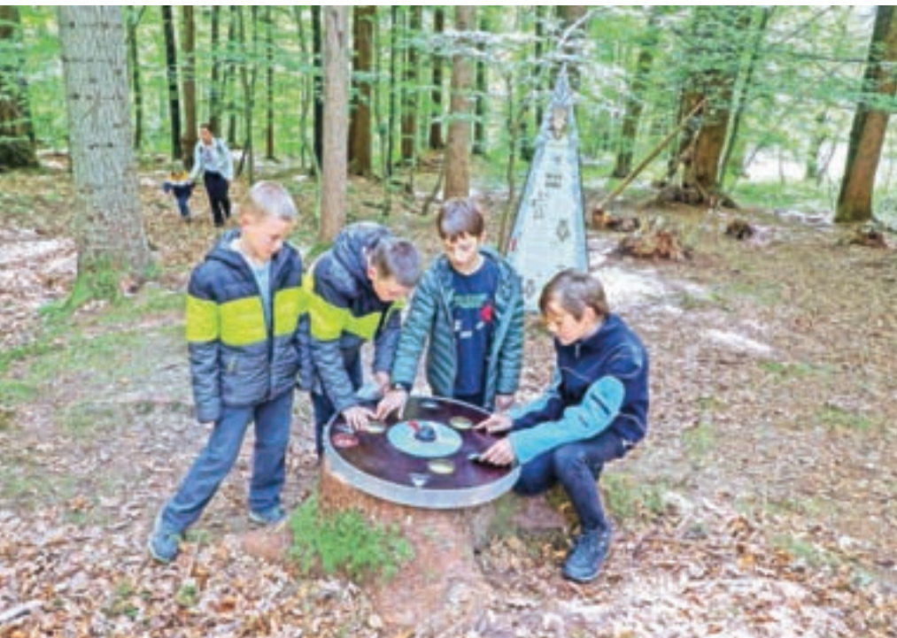
Prvič na tematski poti Skrivnost preddvorskih štorkelj / Foto: Tina Dokl

Vabljeni, da novo pot obiščete in se nanjo pogosto vračate; če boste s srcem na poti, boste gotovo vsakokrat doživeli kaj novega!