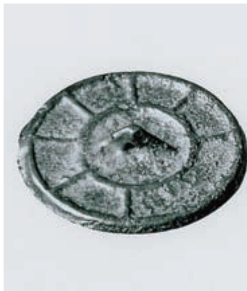
Kovinsko zrcalce hunskega porekla iz poznega 5. ali 6. stoletja