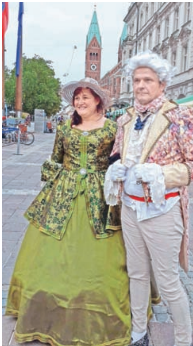
»Grof in grofica« v svoji uradni opravi

Slovenci smo narod, ki je lahko ponosen nase. Nismo bili le kmetje, z vsem spoštovanjem do tega stanu, saj tudi sama izviram iz njega. Imamo iznajditelje, pisatelje, pesnike, umetnike, bili pa smo tudi grofje in tega se nam ni treba sramovati. Po svetu to danes znajo ceniti. Naju zanima zlasti obdobje baroka. Nekateri nama očitajo, da so najine zgodbe kič, a v tujini plačujejo ljudje visoke zneske, da si lahko ogledajo kič, denimo v Franciji spalnico Marie Antoinette. Toda v tem obdobju je nastajala glasba, likovna umetnost, zakaj ne bi v Sloveniji s ponosom povedali in pokazali podo-be iz tistega časa. Mi pa imamo v mislih še iz socializma, da »grad gori, grof beži ...«, v zavesti imamo, da je treba biti priden, poslušen in pohleven. To ni res: Slovenci smo dobri na številnih področjih, imamo dobre študente, poglejte le dosežke v znanosti, v tujini se nekateri naši gospodarstveniki lahko mirno postavijo ob bok večjim korporacijam, imamo veliko dobrih ustvarjalcev. Vse to želiva ljudem sporočiti tudi skozi svoje zgodbe. Slovenija ima več kot tristo gradov in tisti, v katerih so muzeji, so dobro obiskani in vzdrževani, mnogi pa prazni in zapuščeni žalostno propadajo. Gradu moraš dati zgodbo. A naju ne zanimajo gradovi, kjer so