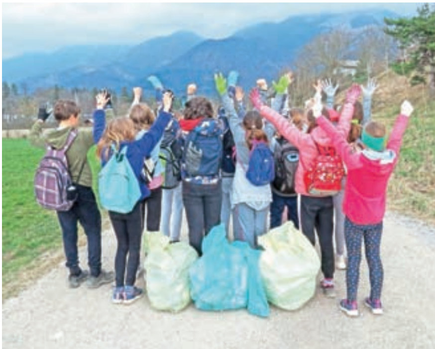
Navdušenje petošolcev po opravljeni očiščevalni akciji

V marcu so sodelujoči razredi na dan, ko je potekala očiščevalna akcija, iska-