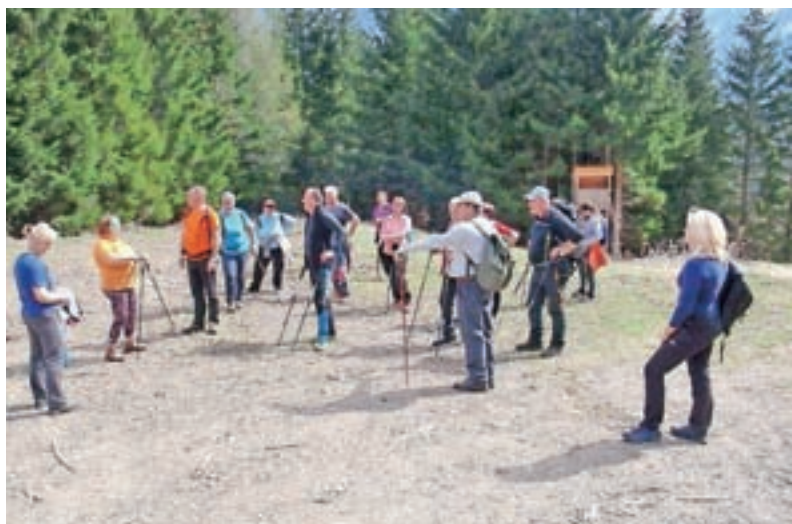
Obisk partizanske tehnike Jošt