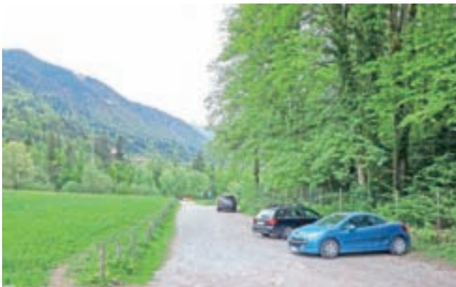
Zahodno obalo jezera Črnava bodo poleti začeli urejati.

Maja so v Preddvoru objavili javni razpis za izbiro izvajalca za urejanje zahodne obale jezera Črnava. Začeli naj bi ga poleti, končali pa do septembra. Uredili bodo poti, dostop do jezera z zahodne strani, postavili urbano opremo, pontonske ploščadi za dostop do vode, igrala za otroke in odrasle, tu bo mogoče dobiti tudi prigrizke in osvežilne napitke, na interaktivnih točkah pa bodo lahko obiskovalci dobili informacije o vodi, življenju v njej, ribah, kulinariki, na voljo bodo različna vodna doživetja, od ribolova, čolnarjenja, supanja do kopanja, na ploščadih bodo omogočili tudi izvedbo različnih prireditev. Gre za projekt, v katerem je v okviru LAS Gorenjska košarica Občina Preddvor pridobila sredstva Evropskega sklada za ribištvo in pomorstvo, ki jim omogoča za 220 tisoč evrov vreden projekt 85-odstotno sofinanciranje.