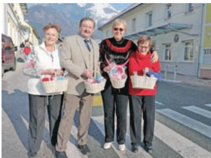
Gelike z županom in košaricami modrih in rožnatih copatk za preddvorske novorojenčke