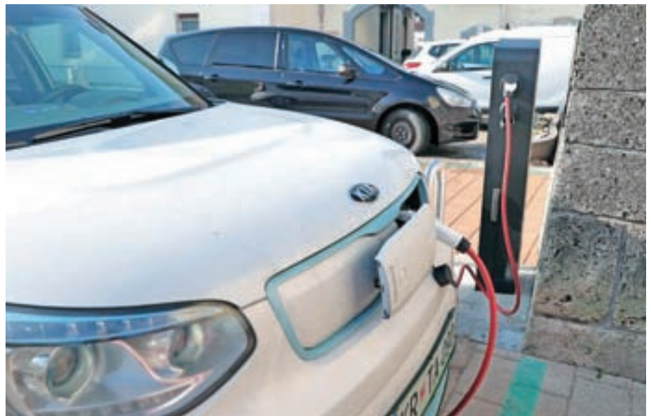
Nova električna polnilnica vozil v Preddvoru

Pri končni rabi energije v Sloveniji predstavlja delež prometa skoraj štirideset odstotkov celotne rabe. Večino te energije Slovenija uvozi, letni strošek posledično presega milijardo evrov. S postopno uvedbo e-mobilnosti, ki bi kot primarni energent izkoriščal lokalno proizvedeno električno energijo, bi ta denar lahko ostal v Sloveniji, hkrati pa bi pripomogli k učinkovitejši izrabi energije in tudi bistvenemu zmanjšanju izpustov CO 2 . Občina Preddvor spodbuja trajnostno mobilnost in optimizacijo motornega prometa, zato je uspešno kandidirala na javnem razpisu Eko sklada. S postavitvijo prve električne polnilnice je izpolnjen eden od številnih ukrepov trajnostne mobilnosti, zapisanih v celostni prometni strategiji. Denar za nakup in postavitev polnilne sofinancira tudi Eko sklad. S postavitvijo druge električne polnilnice (ena stoji že pri jezeru Črnava) in brezplačnim polnjenjem želijo potencialne uporabnike spodbuditi, da namenijo sredstva in prostor za polnjenje električnih vozil, ki bodo v kratkem številneje zaživela na slovenskih cestah.