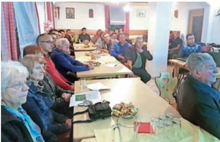
Veliko zanimanje krajanov Bašlja na predstavitvi projekta Slovanska vas