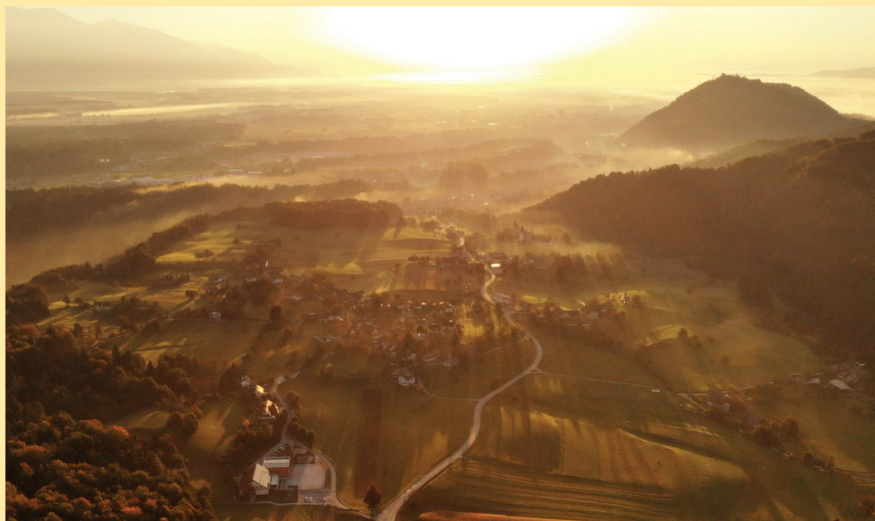
Pogled iz letala na Spodnjo Besnico proti Kranju

Komunala Kranj, delovna enota javne površine: Marjan Tušar, tel.: 04 28 11 375, mobilni tel.: 030 610 450, e-pošta: marjan.tusar@komunala-kranj.si .