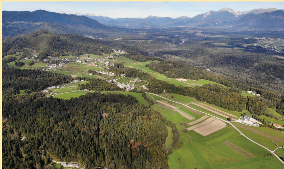
Pogled iz letala na Zgornjo Besnico

Predvsem predsednik Sveta KS Besnica se je v letošnjem letu ogromno ukvarjal s proble-