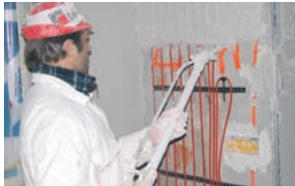
Ometavanje stenskega registra