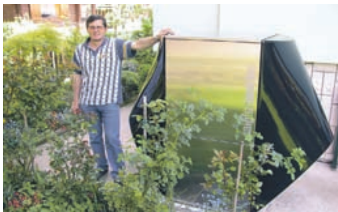
TČ zrak - voda Zvirče

Vrtnje v zid s stenskim ogrevanjem: za nekaj deset evrov kupimo napravo, ki zanesljivo odkrije cev pod ometom. Med cevmi je 6 cm razmika, tako da priprava kakršnega koli obešala