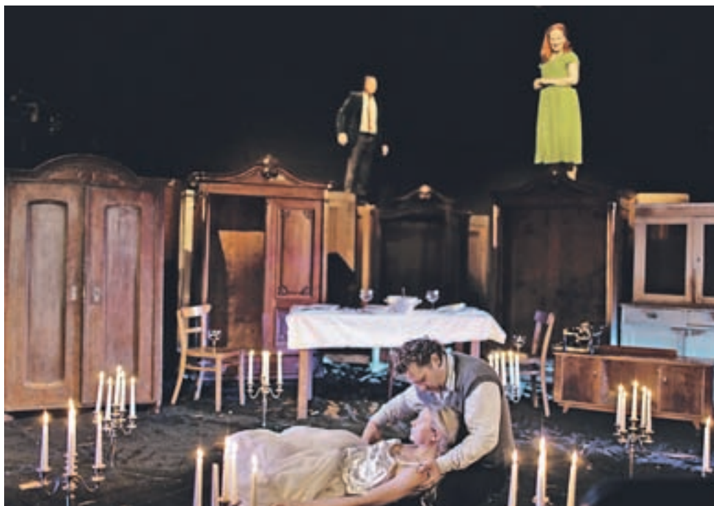
Utrinek iz predstave Steklena menažerija. Ja, dvorana kulturnega doma je te dni precej drugačna.