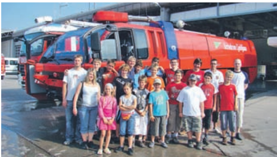
Na obisku pri gasilcih na letališču Jožeta Pučnika Ljubljana

Ob nešteto dejavnostih so bili spet uspešni na tekmovalnem področju. Konec avgusta so na tekmovanju za memorial Marjana Katrašnika dosegli tretje mesto. Septembra so se z dvema ekipama udeležili tekmovanja v spretnostni vožnji v Preddvoru, kjer so dosegli drugo in četrto mesto. Na tekmovanju članov za memorial Ernesta Lombarja ml. v Križah so člani A dosegli drugo mesto. Oktobra so se s tremi ekipami udeležili tekmovanja za memorial