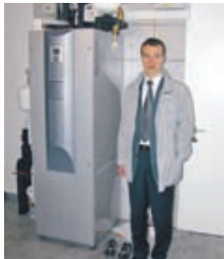
TČ na zemeljski kolektor Utik

Prihodnjic: Uporaba toplotne črpalke zrak-voda, s primeri iz prakse