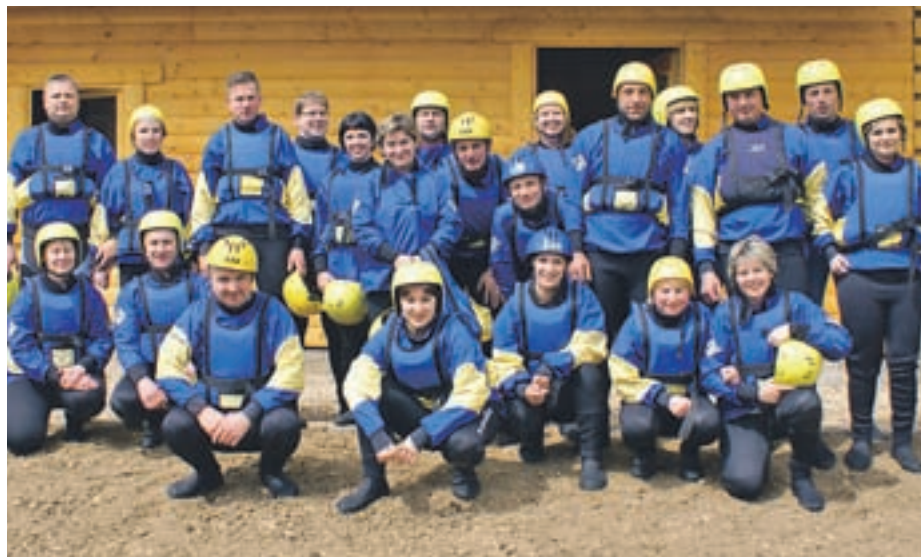
Ekipa, ki je šla na raftanje po Kolpi.

Letos je delo v Prostovoljnem gasilskem društvu (PGD) Suha potekalo po ustaljenem urniku. Redno smo opravljali vaje po točkovniku, se udeleževali raznih proslav in tekmovanj. Na tekmovanjih so sodelovale vse starostne skupine in dosegale dobre rezultate, pri čemer gre zahvala tudi mentorjem.