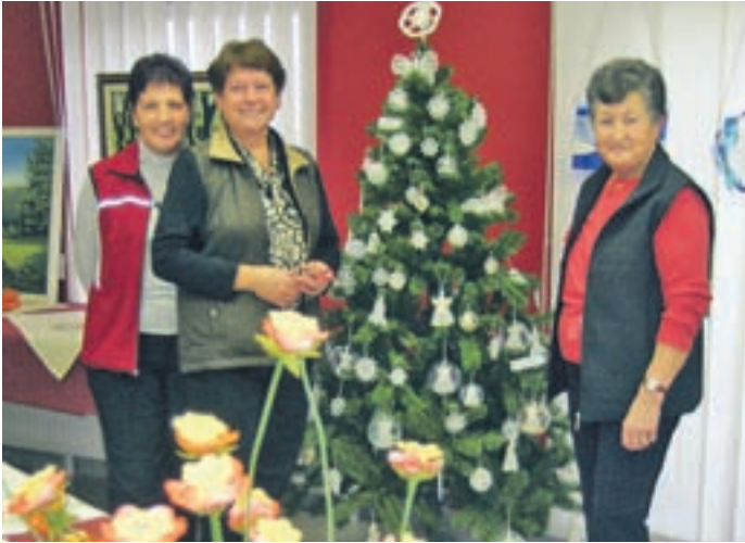
Sekcija ročnih del pri društvu upokojencev Predoslje je minuli vikend pripravila razstavo ročnih del v gasilskem domu v Britofu, ki je bila dobro obiskana.

Neverjetno, kako hitro teče čas, saj je že spet tukaj mesec najlepših praznikov, čas, ko bomo prestopili v leto 2010. Tudi v zadnji polovici tega leta upokojenke in upokojenci nismo mirovali.