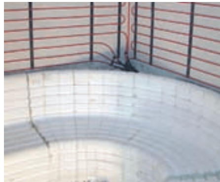
Savna - Vila Bled