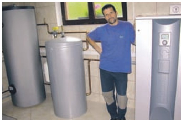
TČ na podtalnico v Sp. Senici