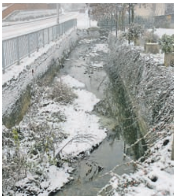
Zagotovljen je denar za sanacijo potoka Belca.

Za drugo leto so že rezervirana sredstva za preplastitev ceste skozi vas Suha, za asfaltiranje odseka ceste v vasi Predoslje v dolžini dve-