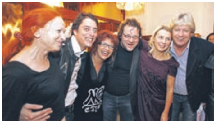
Ustvarjalna ekipa Steklene menažerije