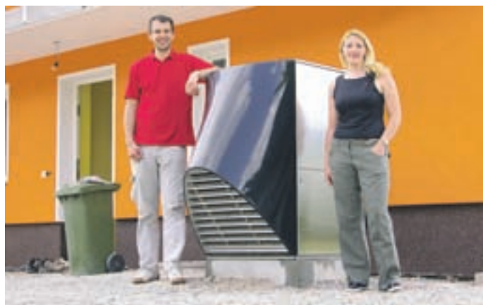
TČ zrak - voda Križce