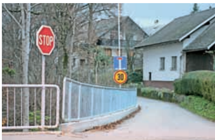
Nova zaščitna ograja

AMH AVTO MOTO HIŠA VOMBERGER Britof 180, KRANJ prodaja: 04/2342 600, servis: 04/2342 601