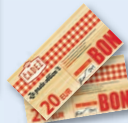
ali darilni bon mesarstva Čadež v vrednosti 20 EUR