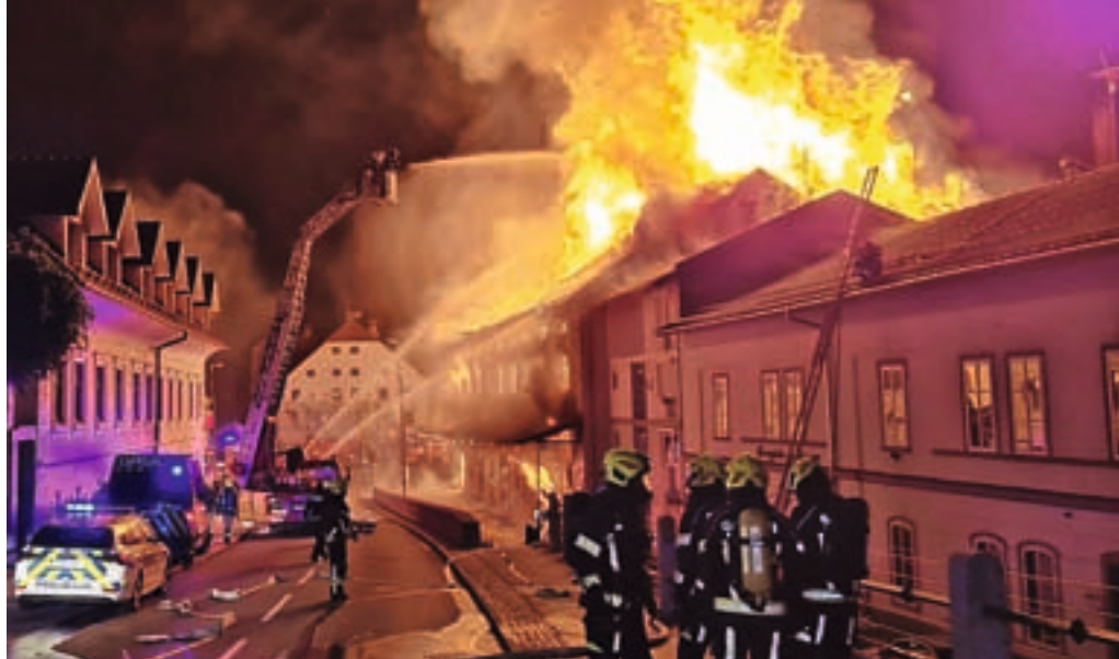
Nočno gašenje velikega požara v Majdičevem mlinu septembra 2022

Velika mera znanja, prostega časa in odreknanj je bila potrebna, da smo skupaj z gasilci iz mnogo društev obvladali požar na Potoški gori. In kot da že to ni bilo dovolj, smo bili na močni preizkušnji še ob gašenju požara na Krasu.