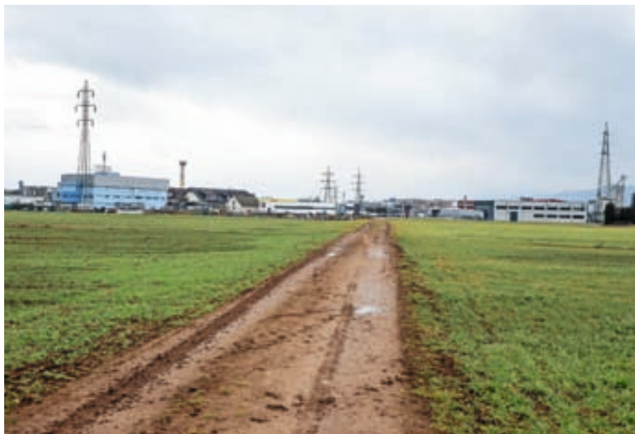
Prizadevanja za zeleno in kvalitetno ohranjanje okolja v KS Primskovo

Primskovo je na področju okolja in urejanja prostora pred številnimi izzivi. Na področju urejanja prostora so za Primskovo ključnega pomena nadaljnja prizadevanja za urejeno, zdravo in varno okolje ter zato vztrajanje pri: dolgoročni usmerjenosti in strokovnosti pri prostorskem načrtovanju našega mesta in krajevne skupnosti ter ohranitvi kritičnih zelenih površin v naši krajevni skupnosti in njihovi skrbni ureditvi za izboljšanje kakovosti življenja vseh krajanek in krajanov, kar je še zlasti pomembno za center našega kraja in krajevne skupnosti z domom krajanov, šolo in cerkvijo. Mestna občina Kranj je na podlagi predhodno izkazanega interesa in potreb krajevne skupnosti Primskovo po ohranitvi zadnje večje zelene površine ob domu krajanov s sprejetjem občinskega prostorskega načrta (OPN) v letu 2014 to območje opredelila kot zeleno parkovno površino – Park Primskovo ter hkrati sprejela tudi predlagano idejno zasnovo njene urbanistične ureditve s strani takratnega vodstva krajevne skupnosti. Pri tem gre za prepotrebno zeleno površino, ki jo središče Primskovega (in Dom krajanov) nujno potrebuje kot prostor srečevanja in druženja ljudi, z urejeno in prijetno zeleno oazo z odprtim otroškimi igriščem, klopmi, zunanjim prireditvenim prostorom, ki bi dopolnjeval zmogljivosti Doma krajanov, ob samem domu pa lahko tudi z urejeno mini tržnico za lokalne ponudnike.