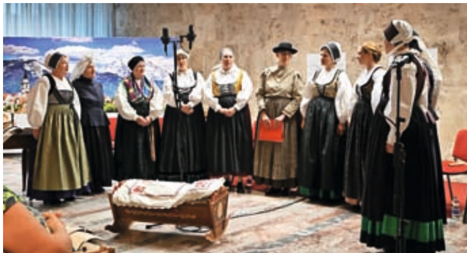
Na praznovanju tridesetletnice Bodečih než

Vsi pomembni dogodki so se pravzaprav strnili v en intenziven teden v že poletno vročem začetku junija. Tako smo v soboto, 4. junija, prepevale, plesale in pripovedovale na največji prireditvi, ki jo je kdaj koli priredila AFS Ozara – na koncertu ob 70-letnici delovanja v amfiteatru gradu Khislstein. Isti dan nas je naše občinstvo – med tem, ko smo mi vadili na s soncem obsijanem odru – lahko gledalo na komercialni televiziji v Kuhinji na kolesih. Večer 70-letnice ni bil zaznamovan le z uspešnim nastopom, pač pa je bil tudi poklon vsem našim nekdanjim in trenutnim članom,