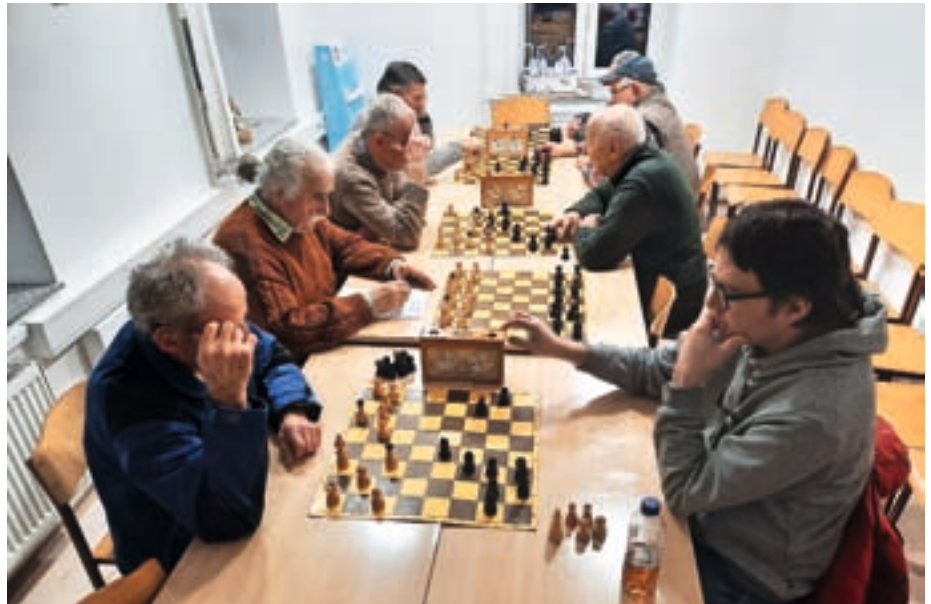
Igranje šaha ima številne koristne učinke.

V vseh kranjskih osnovnih šolah potekajo šahovski krožki, kjer šolarji lahko spoznavajo osnove šahovske igre oziroma svoje šahovsko znanje izpopolnjuje-