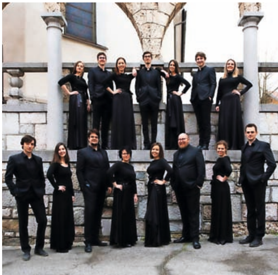
V mestnem jedru Kranja