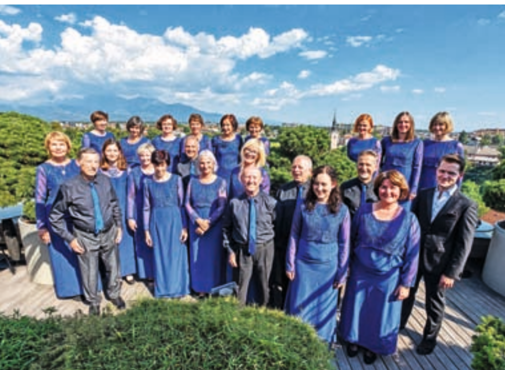
MePZ Musica viva

Nastop na regionalnih Sozvočenjih konec novembra v Škofji Loki nam je preprečila korona, ki je po pevskem koncu tedna v Mekinjah zredčila pev-