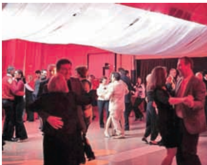
Šolska avla se je spremenila v gala plesišče, po katerem se je vrtelo okoli petintrideset parov.

Poleg dobre glasbe in prijetnega vzdušja je večer zaznamovala tudi odlična večerja. In čeprav je bilo plesalcev na prvem plesu nekoliko manj, kot so organizatorji pričakovali, so bili tisti, ki so na ples prišli, tako navdušeni, da so se na GŠSRM že odločili, da bo Maistrov pomladni ples v rdečem odslej tradicionalen.