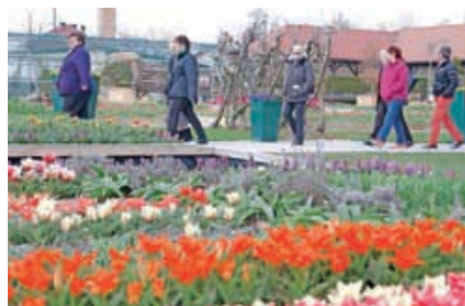
V Arboretumu bo tudi letos zacvetelo več kot dva milijona tulipanov in drugih spomladanskih cvetic.

V parku so se zadnje tedne intenzivno pripravljali na že 24. spomladansko razstavo, za katero so oktobra posadili