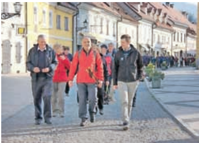
Maistrov pohod je pohodnike popeljal tudi po Šutni mimo Maistrove rojstne hiše.