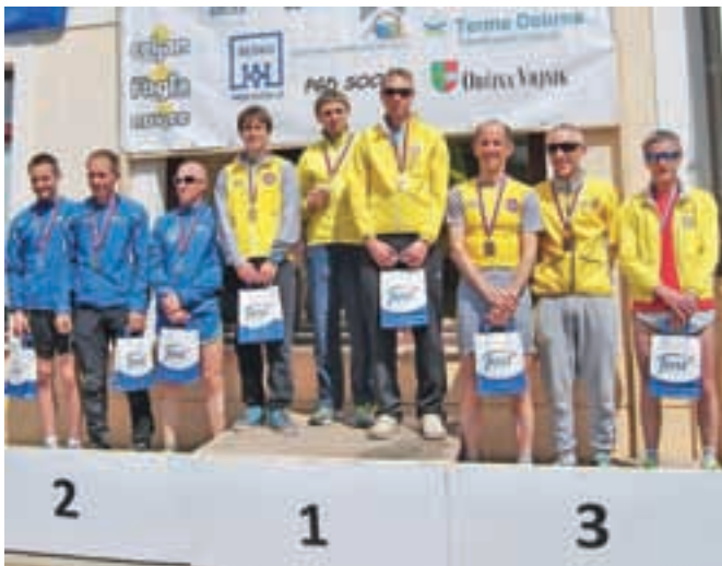
Članski ekipi KGT Papež na zmagovalnih stopničkah