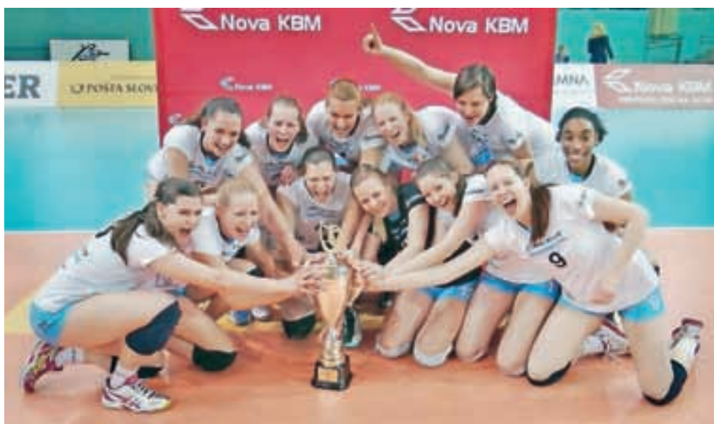
Odbojkarice Calcit Volleyballa so slovenske državne prvakinje.