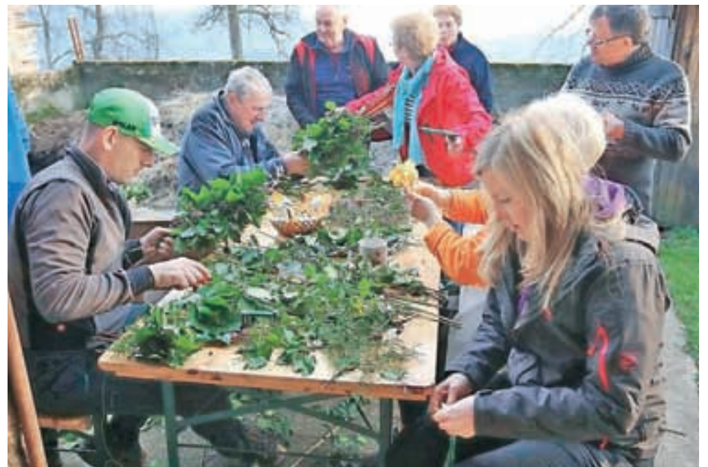
Brezjani se večkrat zberejo na Prelesnikovi domačiji; takole so nedavno izdelovali cvetnonedeljske butarice.

Vaščani so jih v nedeljo s ponosom ponesli k blagoslovu v mekinjsko cerkev, a za dolgo se niso razšli. Že naslednjo soboto so se nam-