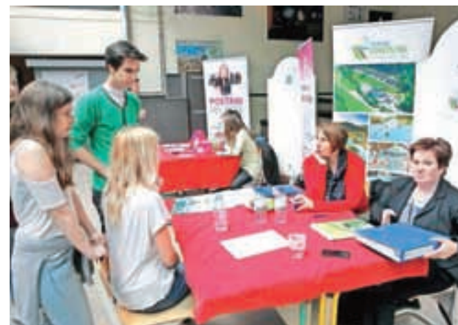
Dijakom so poklice, ki jih iščejo, ter možnosti štipendiranja in počitniškega dela predstavili tudi v Termah Snovik in Zarji Kovic.

Odziv podjetij in organizacij je bil skromnejši od pričakovanih, a led je prebit in mreža med dijaki in podjetji se že plete. Svoje dejavnosti, poklice in možnosti sodelovanja so predstavili Vrtec Antona Medveda Kamnik, Zavod za zaposlovanje RS, Zarja Kovic, Terme Snovik,