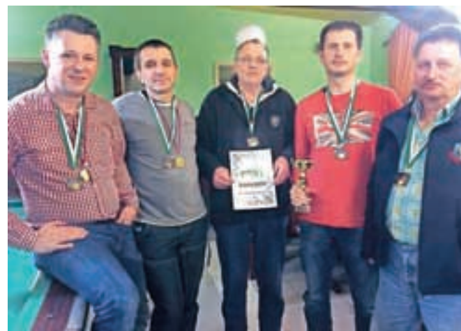
Šahisti Športnega društva Barob Šmarca so se takole razveselili priznanja za 3. mesto.