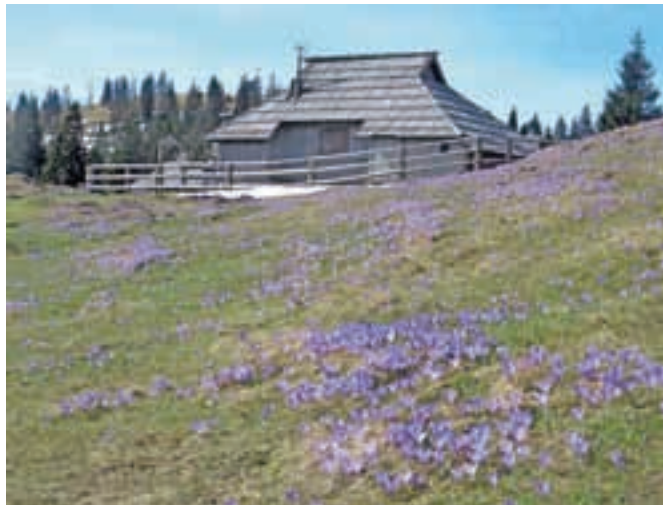
Na Dovji ravni je žafran cvetel že sredi aprila.