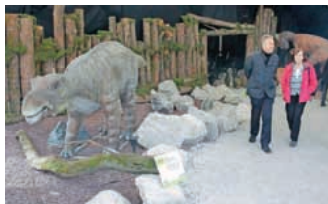
Predvsem najmlajši bodo letos znova lahko občudovali dinosavre, ki so prostor našli tudi pod streho.