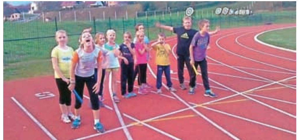
Mladi atleti na mekinjskem stadionu / FOTO: ATLETSKO DRUŠTVO KAMNIK

Jeseni 2013 je ustanovil Atletsko društvo Kamnik in bil eden od glavnih pobudnikov in pogajalcev s Fundacijo za šport, ki je sofinancirala obnovo tekaške steze v Mekinjah. Jeseni se je tako kot predsednik društva, trener in deklica za vse začel aktivno