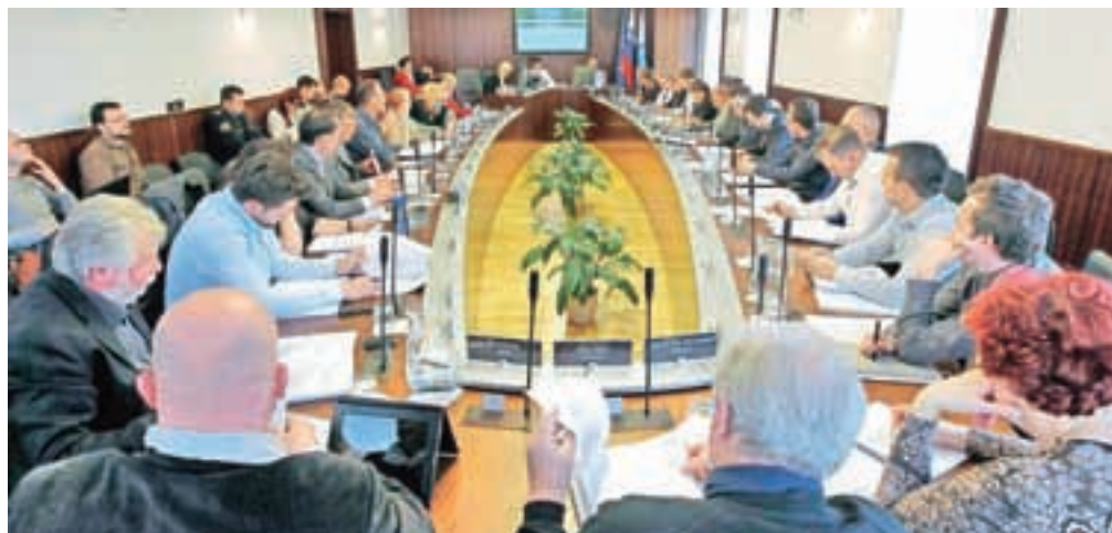
Občinski svetniki na svoji aprilski seji