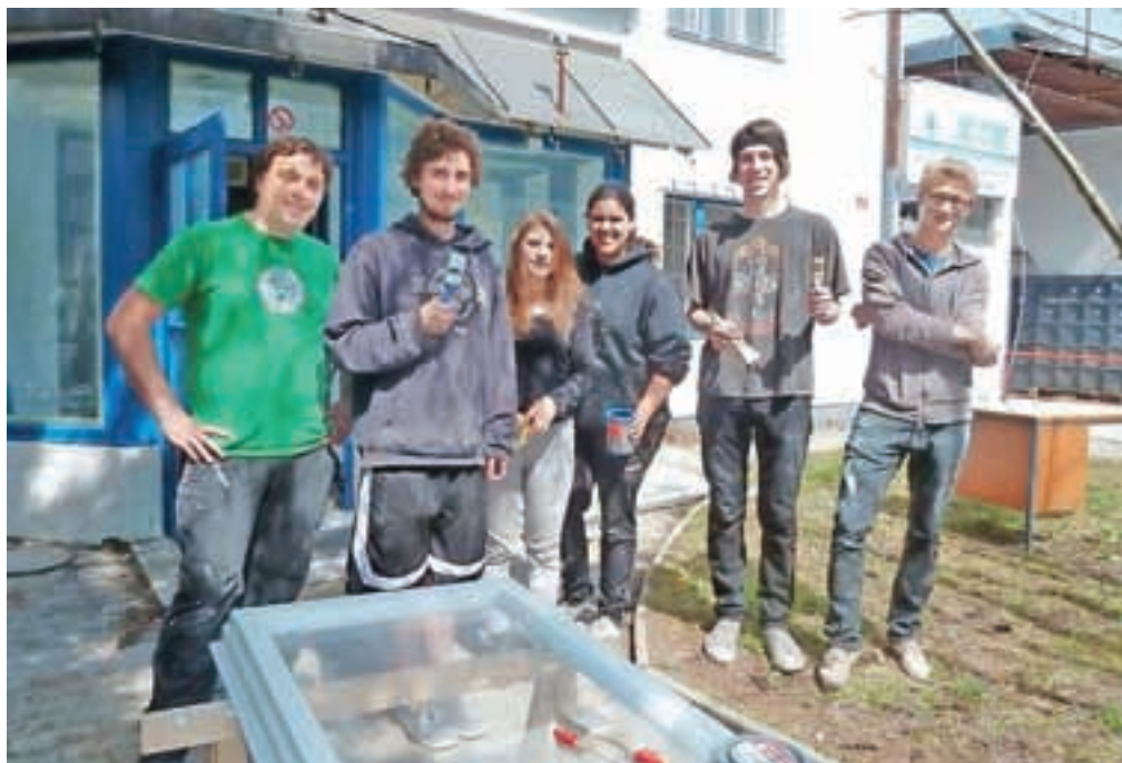
KIKšstarter je svoje mesto našel v vhodni stavbi nekdanjega KIK-a, za njeno prenavljanje pa so zaslužni številni mladi prostovoljci.

Kamnik – Stavba podjetja KIK ob vhodu na območje nekdanje smodnišnice, kjer je bila še nekaj let nazaj trgovina s pirotehničnimi izdelki, te dni dobiva novo podobo. Spretne roke pridnih prostovoljcev že mesec dni brusijo, barvajo, pleskajo, čistijo in pomivajo, predvsem pa razvijajo projekt, ki bo v prihodnjih mesecih z novo vsebino zapolnil kar 760 kvadratnih metrov veliko stavbo v dveh nadstropjih, ki jo je Mladinski center Kotlovnica najel od podjetja Iskra Mehanizmi. S tem bodo mladi uresničili projekt »coworkinga«, ki je v Sloveniji že dobro uveljavljen model, v Kamniku pa si ga prizadevajo vpeljati zadnja tri leta.