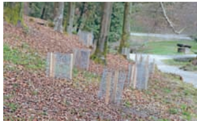
V sklopu sanacije zledoloma so v parku posadili že 1500 novih dreves.

dva milijona tulipanov, 200 tisoč narcis, 10 tisoč hijacint in mnogo drugih spomladanskih cvetic. Skupaj z vrtnarskim sejmom in sejmom vrtno opreme bo razstava na ogled od 25. aprila do 3. maja, za tem pa bodo veliko pozornosti deležni tudi rododendroni, ki so jih v parku prvič posadili pred petdesetimi leti. Obletnico bodo praznovali z zasaditvijo 250 novih