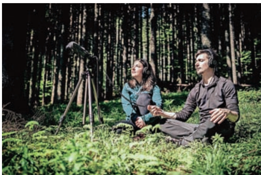
Poslušanje zvokov gozda

Velik del naše občine pokrivajo mogočni gozdovi. In prav ti so na naju v teh letih, odkar sva si na Jezerskem ustvarila dom, naredili še prav poseben vtis. Tako se je začelo večletno raziskovanje in kar naenkrat so se koščki sestavljanke začeli zlagati skupaj – nastal je koncept zelenih butičnih doživetij v gozdu, ki sva ga poimenovala Exploring Forest. Z njim želiva obogatiti ponudbo aktivnosti za vse, ki obiščejo našo prelepo dolino, in goste morda tudi tako spod-