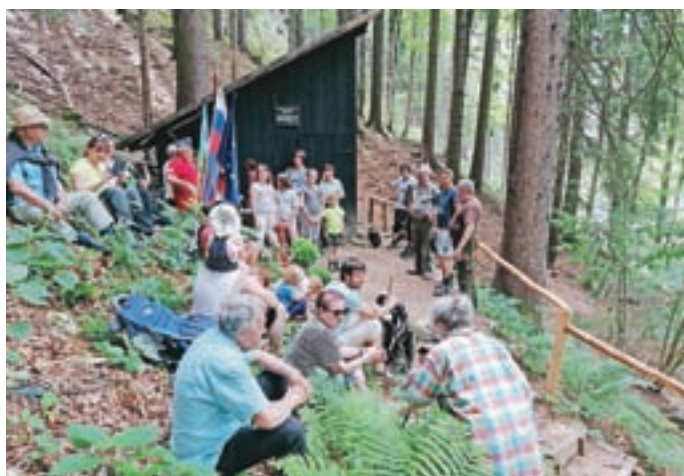
Pri bolnici je sledil tudi krajši kulturni program.

Da je bila pot do Krtine varna, smo skupaj s člani Krajevne organizacije ZB za ohranjanje vrednot NOB že 8. maja 2021 iz-