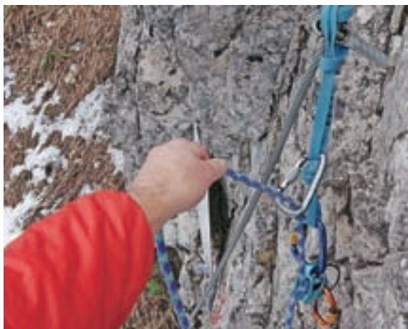
Varovanje drugega v navezi – dodatna varnost