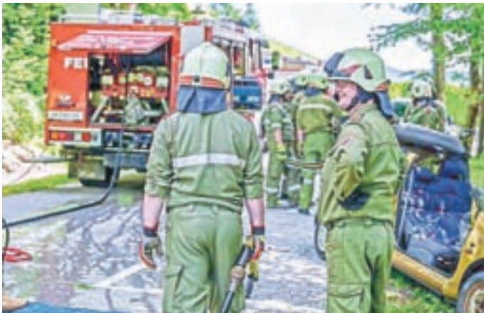
Posredovanje pri prometni nesreči PGD Železna Kapla