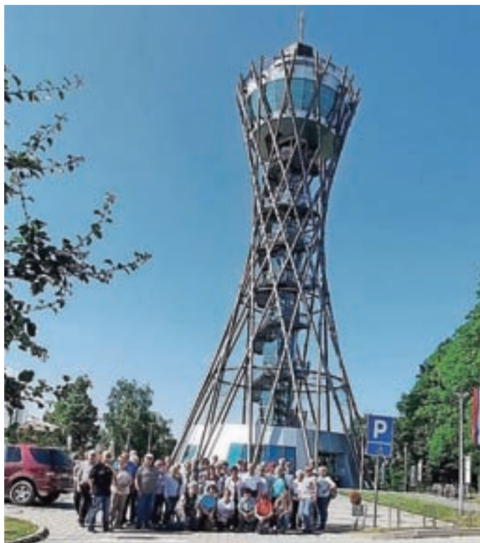
Vinarium pri Lendavi