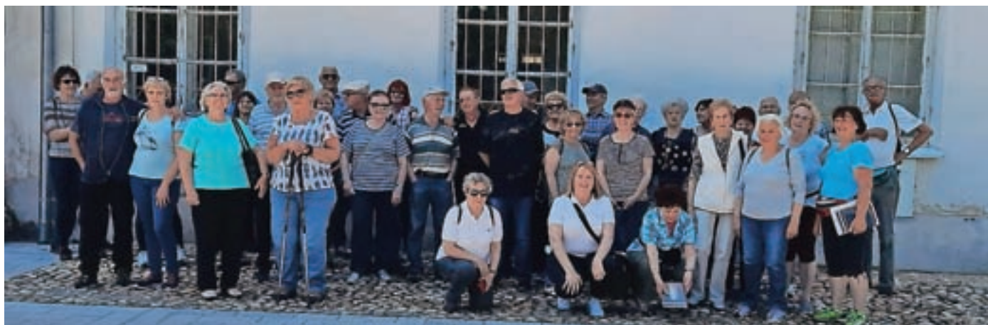
V Murski Soboti, kjer brez "gasilske" slike ni šlo