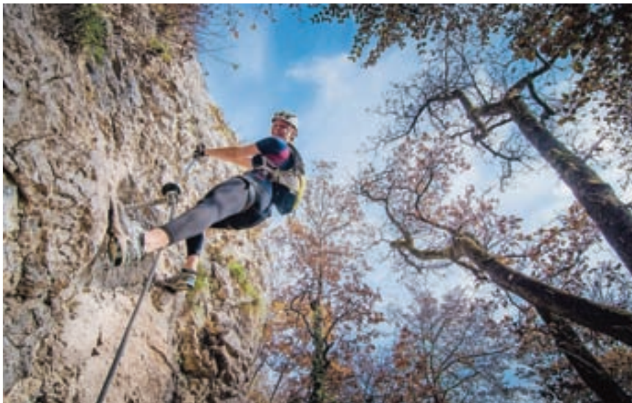
Športne ferate lahko predstavljajo zanimiv del turistične ponudbe.

Po lokacijah športnih ferat po Sloveniji hitro ugotovimo, da niso same sebi namen. Postale so zelo zanimiva turistična ponudba v Kranjski Gori, Bohinju, Mojstrani ... Kako je s tem na Jezerškem? Ponudbe za vodenje z domačim licenciranim gorskim vodnikom nima-