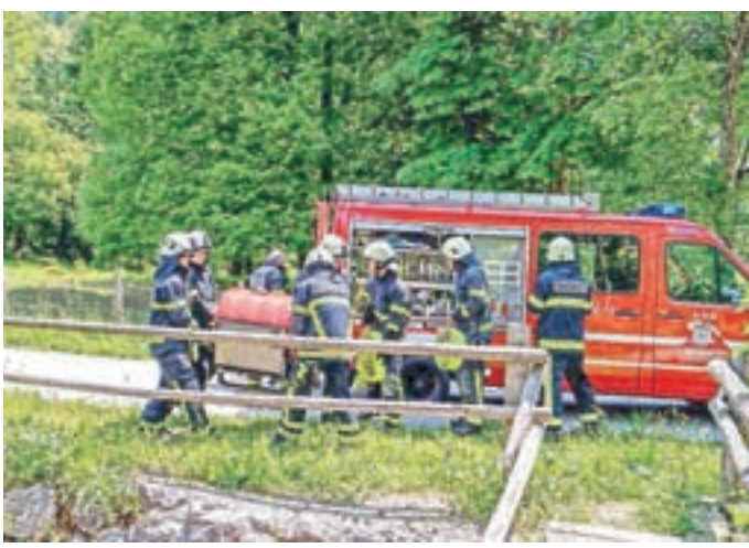
Prenos motorne brizgalne za zajem vode