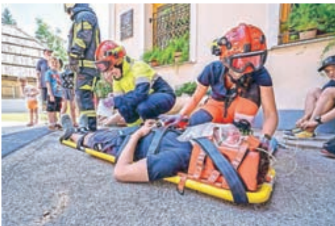
Trižno mesto in oskrba ponesrečencev