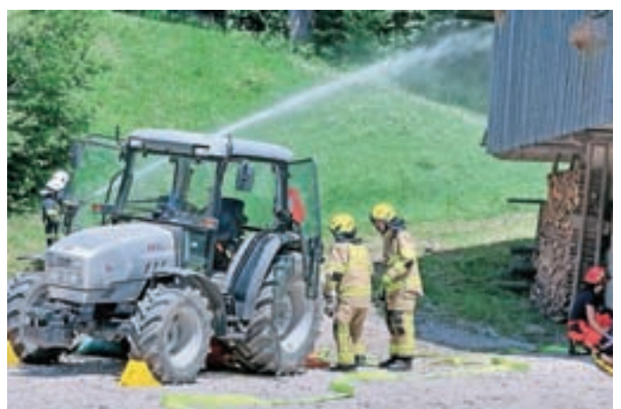
Posredovanje PGD Preddvor pri nesreči s traktorjem