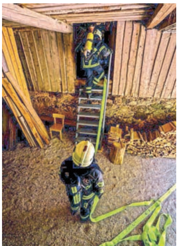
Preiskava prostorov PGD Jezersko