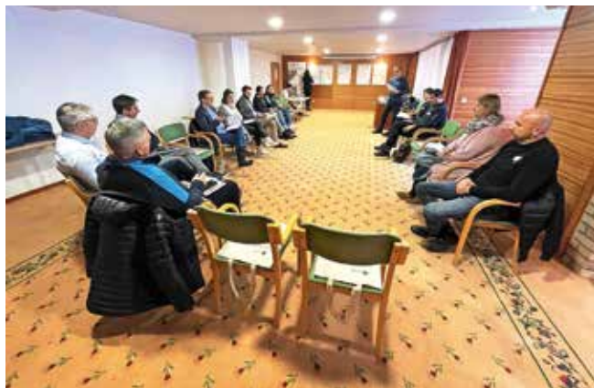
V Kranjski Gori so že izvedli prvo delavnico.

Udeleženci so poudarili močno povečane pritiske na okolje, predvsem v poletni sezoni. »Problematično je povečanje motornega prometa pa tudi neozaveščenost obiskovalcev o pomenu varovanja okolja in naravnih virov.« Zaradi odsotnosti sistemskega varovanja stavbne in ostale kulturne dediščine pa prihaja do neustreznih trajnih posegov v prostor.