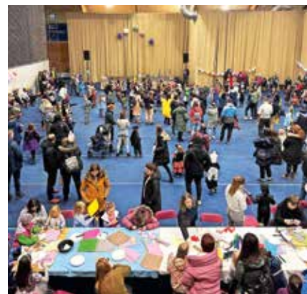
Veseli pust širokih ust v dvorani Vitranc