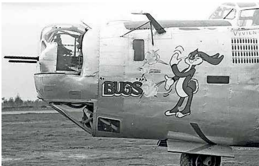
Letalo B-24G, ki je novembra 1944 strmoglavilo na območje Kotovega sedla. Ob 80. obletnici želijo v društvu pripraviti muzejsko razstavo in spominsko slovesnost v Tamarju.

V petek, 29. marca, ob 18. uri bodo v dvorani Ljudskega doma v Kranjski Gori organizirali javno predstavitev društva z namenom pridobitve članov in predstavitve njihove vizije delovanja.