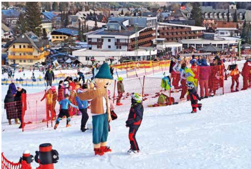
Za otroke je navijal in jih v cilju pozdravljaj tudi Kekec.