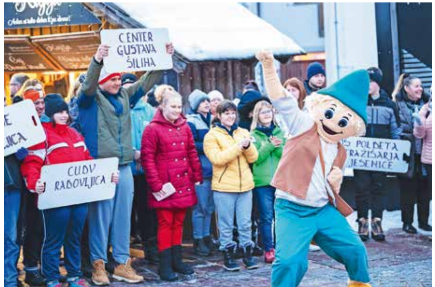
Kekec je poskrbel za zabavno vzdušje, saj je s svojimi vragolijami spravil v smeh tudi tiste, ki so svoje misli osredotočali na prihajajoče tekmovanje.