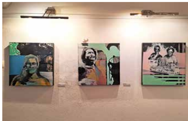
Kofetarice