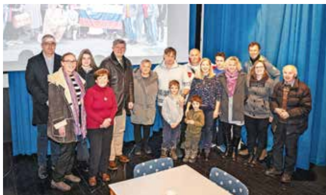
Spomine so obujali na Dovškem odru