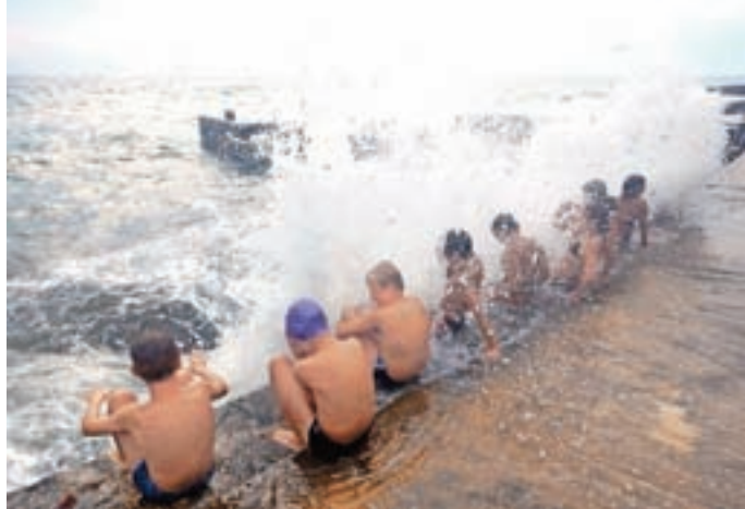
Šola v naravi

smo se igrali različne igre za razmišljanje in kako premagati strah pred nastopanjem.