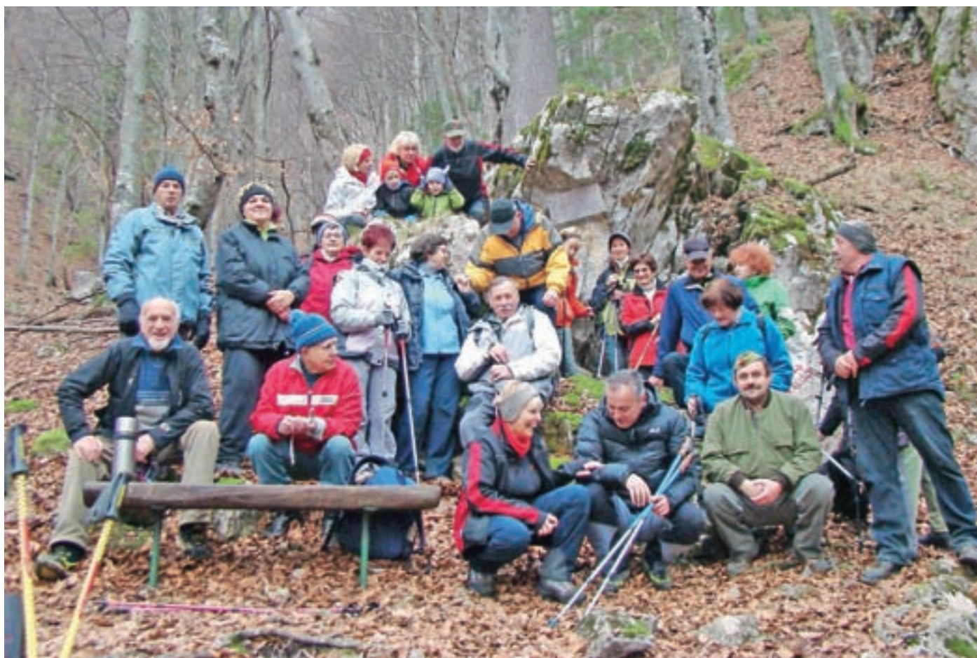
Pohodniki k partizanski bolnišnici Košuta

Pohod so sklenili v okrepevalnici Seljak v Preddvoru ob dobrotah domače gorenjske kuhinje.