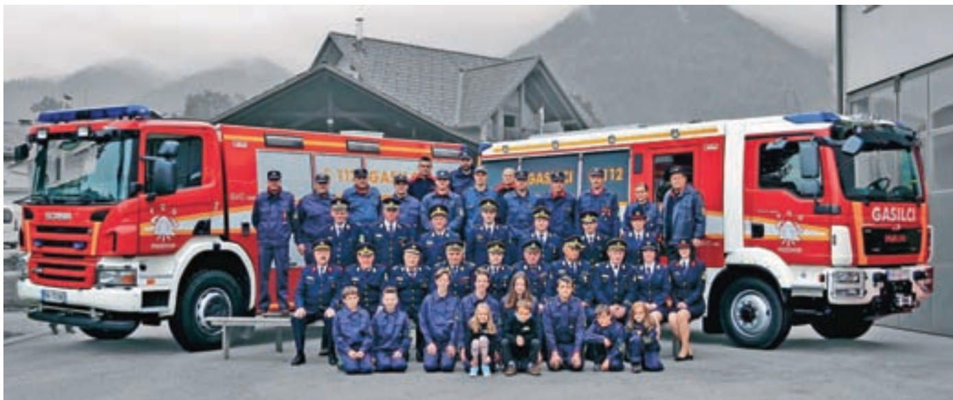
Preddvorski gasilci ob častiljivem jubileju

Leta 1896 je bila v Preddvoru osnovana požarna bramba. Visoki jubilej so preddvorski prostovoljni gasilci počastili s slavnostno akademijo.