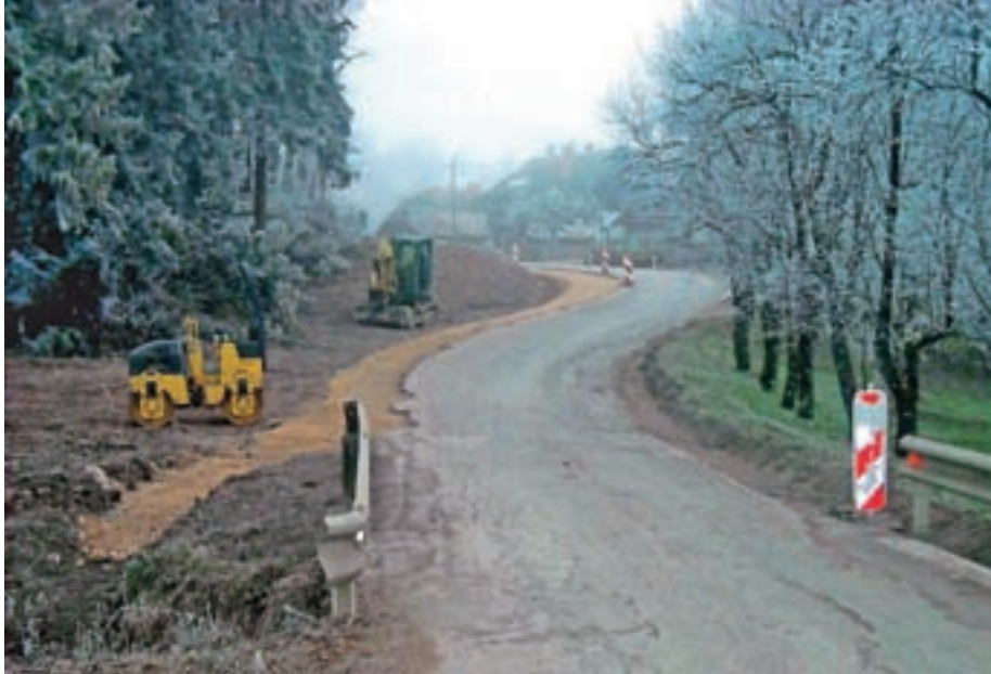
Še pomnite, kakšna je bila cesta proti Zgornji Beli?

Infrastrukturo smo obnavljali tudi v Kokri, saj je občina vložila 77.000 evrov v asfalt in ograje. V Hrašah so je z asfaltom preplastili cesto iz smeri Sp. Bela