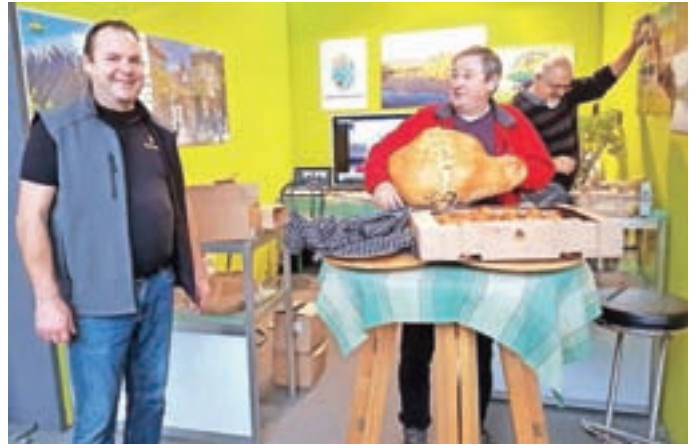
Velik uspeh je požela tudi preddvorska stojnica s kranjskimi klobasami in kuhano šunko.