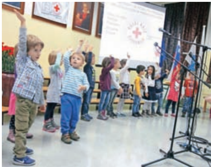
Prisrčen nastop otrok iz vrtca