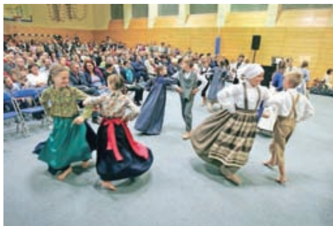
Takole pa zaplešejo današnji učenci.