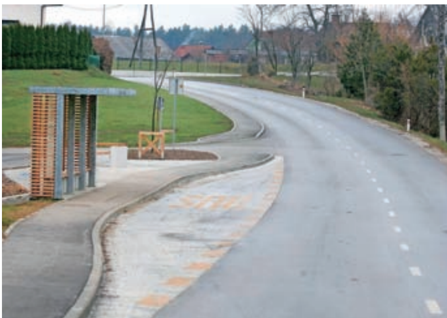
Unikatna avtobusna postaja na Zgornji Beli

do križišča v vrednosti 26.000 evrov. V Bašlju proti Vaškarju je bilo nujno potrebno zaradi meteorne vode sanirati del ceste z ureditvijo muld, kar je stalo dobrih 10.000 evrov, skoraj toliko tudi obnova ceste ter ograja na Možjanci. 62.000 evrov smo vložili v nov pločnik v središču Preddvora ter 128.000 v izde-