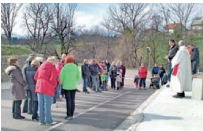
Blagoslov novosti v Bašlju