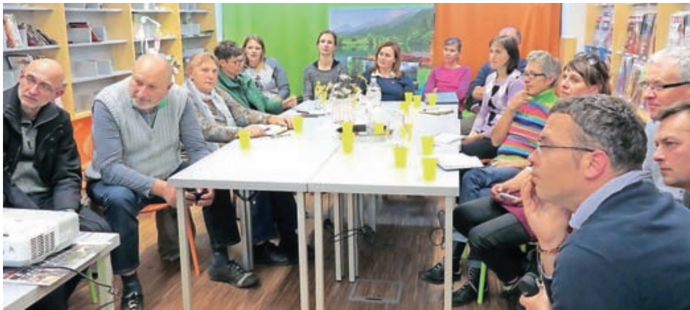
Dobro obiskana delavnica o trženju v turizmu

Ves advent je v TIC-u razstava adventnih venčkov in novoletne dekoracije, na voljo pa je tudi že koledar z gorenjskimi prireditvami, ki ga občine, združene v Regionalno destinacijsko organizacijo Gorenjske, izdamo skupaj za vse obiskovalce TIC-ev po gorenjskih krajih. Za nami je uspešno leto. Iskreno se zahvaljujemo vsem, ki ste letos sodelovali z nami in pripomogli k bogati ponudbi dogodkov našega Zavoda za turizem. Hvala tudi vam, ki nas obiskujete, nam s tem izkazuje podporo in dajete motivacijo za nadaljnje delo. Srečno in vse dobro v prihajajočem letu 2017 vam želi ekipa TIC-a Preddvor.