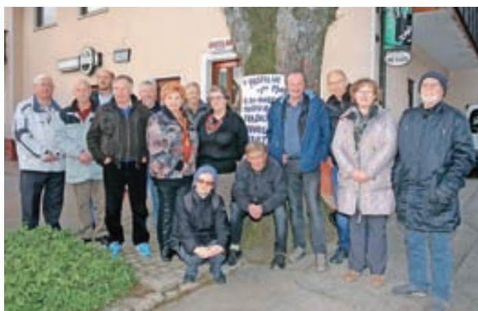
Samorastniki razstavljajo pri Majču.