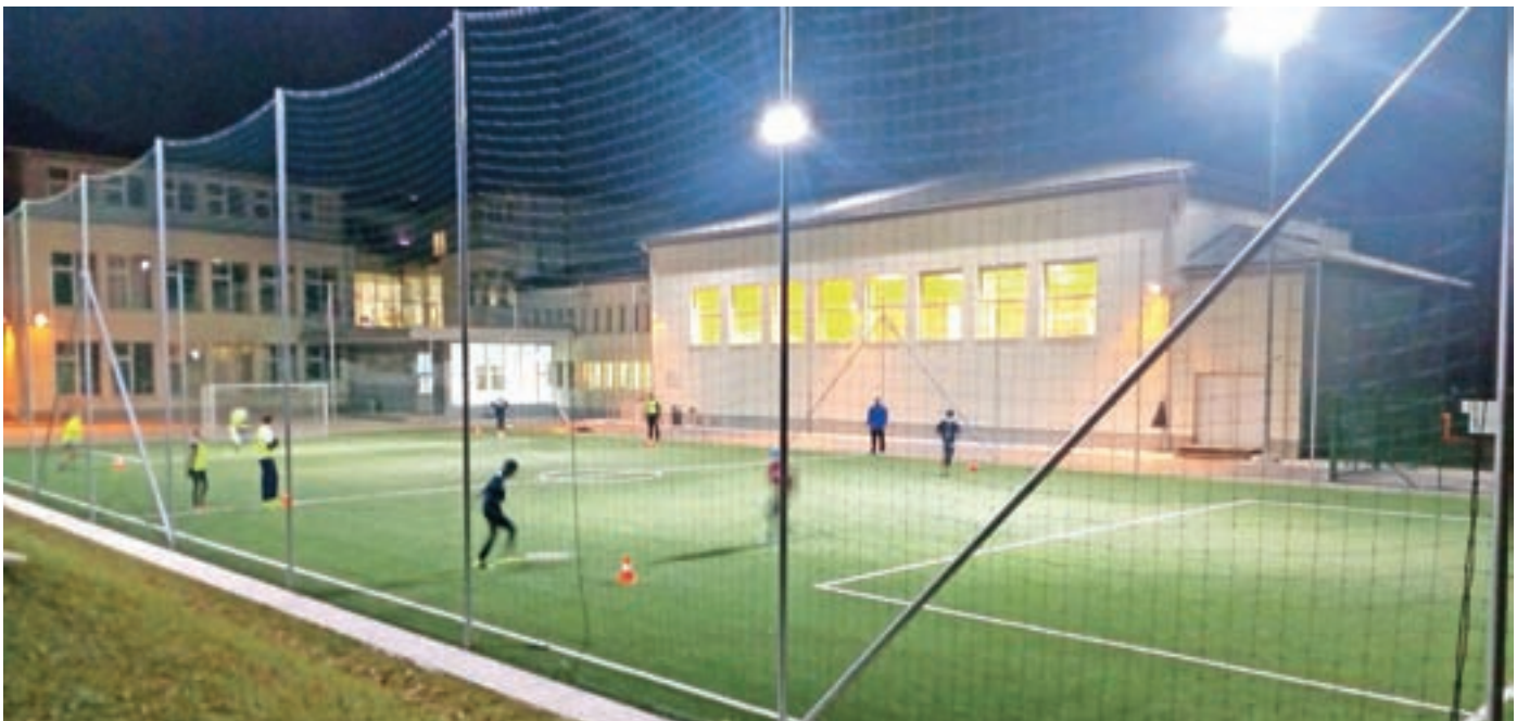
Nogometni treningi pod žarometi

Že vnaprej pa se zahvaljujemo za vso podporo in sodelovanje in vas vabimo, da pri predstavnikih društva brezplačno prevzamete tudi novi društveni koledar za leto 2017. Dodatne informacije pa lahko dobite na www.sd-preddvor.si ! V novo leto gremo spet polni delovnega optimizma in vsem skupaj želimo vesel božič ter srečno, zdravo ter športa polno novo leto 2017!