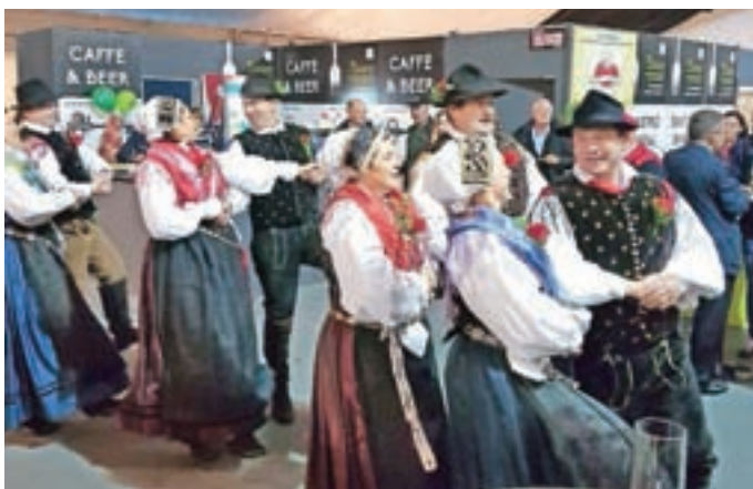
Folklorni nastop preddvorske "stare garde" je navdušil gostitelje v Vodnjanu.