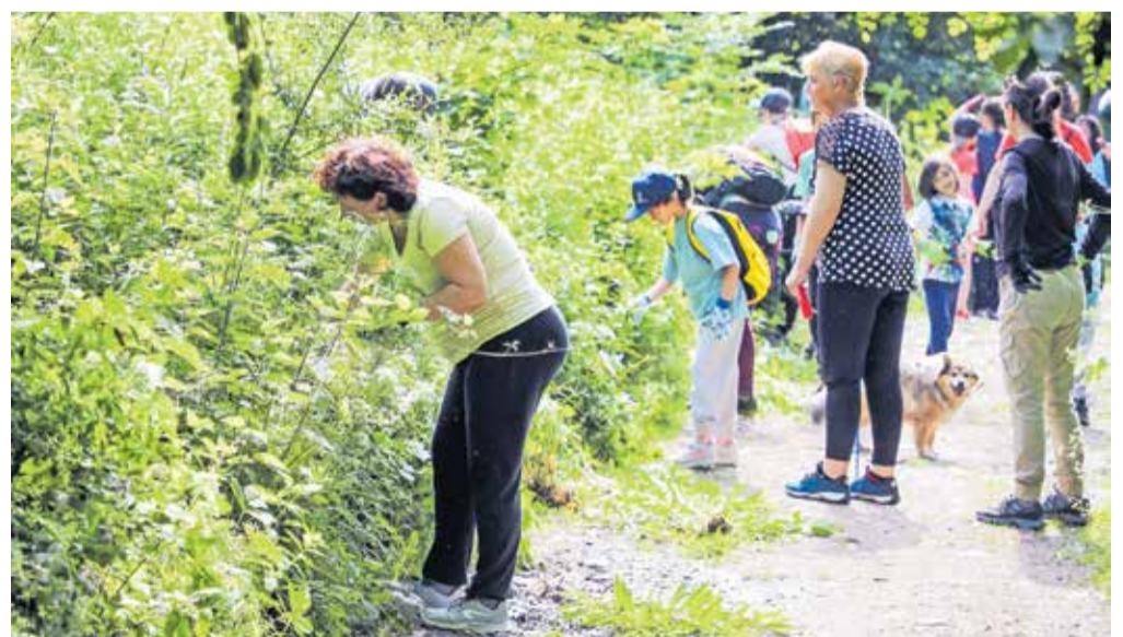
Eden od ciljev akcije je bil tudi ozaveščanje ljudi o pomembnosti odstranjevanja invazivk ter njihovih negativnih učinkih na okolje in človeka.