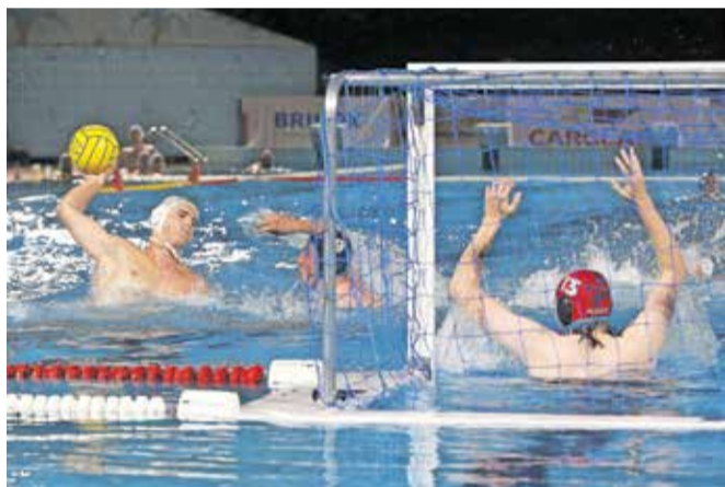
Naši vaterpolisti so v domačem bazenu dosegli dve zmagi in remi.