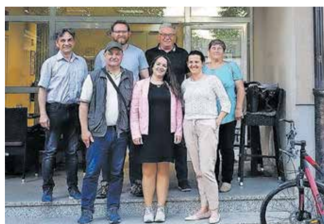
Srečanje s člani Sveta KS Kokrica

V okviru krajevnih praznikov je Mestna občina Kranj krajevnima skupnostima 24. junija predala avtomatska defibrilatorja. Na Planini bo nameščen na pročelju Dnevnega varstva starejših, v Bitnjah pri vhodu v vrtec Biba.