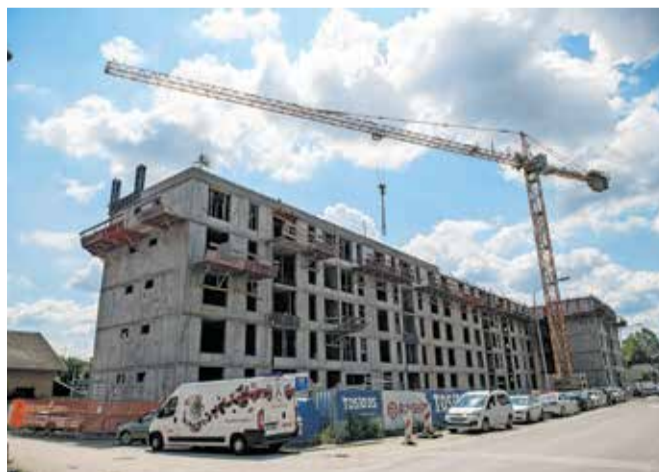
Kompleks D26 je sodobno zasnovan objekt, ki bo vključeval 66 stanovanj.