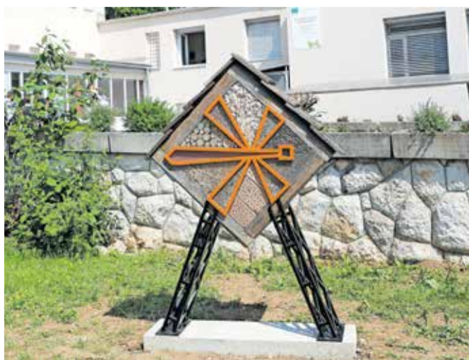
»Žužohotel« je šoli podarilo podjetje Flycom Technologies.

Kranj – Svoj hotel za žuželke imajo po novem pri Osnovni šoli Staneta Žagarja v Kranju. Ob svetovnem dnevu okolja ga je podarilo kranjsko podjetje Flycom Technologies v sodelovanju s Fundacijo Vincenca Drakslerja, saj so ga v njenem socialnem podjetju izdelali iz rabljene šolske opreme (stoli, mize) ter drugega materiala. Kot so poudarili v podjetju Flycom Technologies, je pobuda ob svetovnem dnevu okolja le eno od številnih prizadevanj, ki jih izvajajo za ustvarjanje bolj trajnostnega lokalnega okolja.