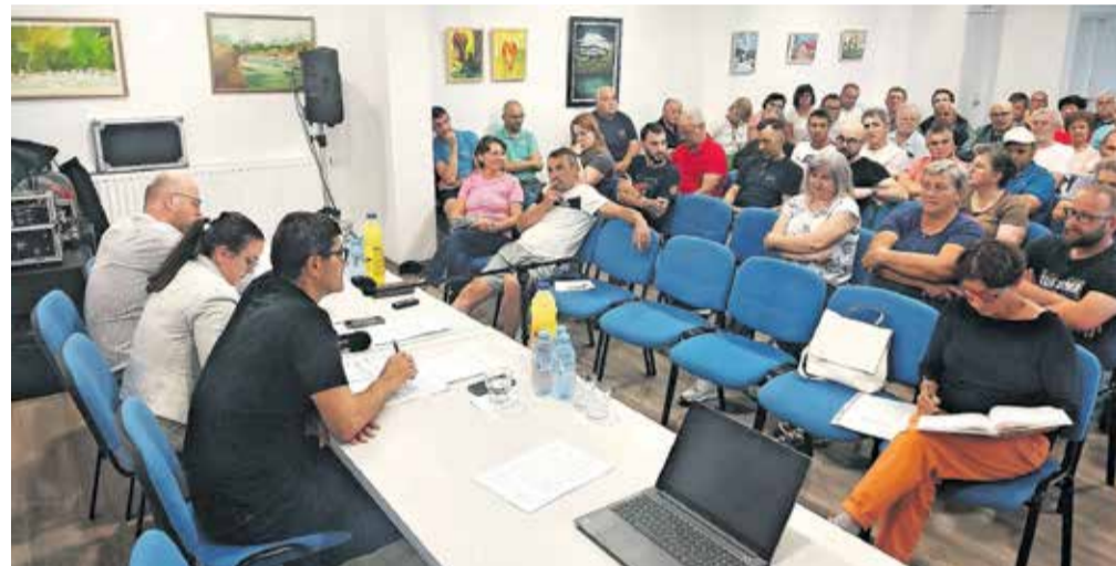
Srečanje s krajanji v Mavčičah

Na predlog Krajevne skupnosti Mavčiče je 13. junija potekal zbor občanov, ki se ga je udeležilo okoli 60 krajanov. Med drugim so poudarili problematiko vrta, saj bo v novem šolskem letu en oddelek prvega starostnega obdobja namesto v mansardi vrta Mavčiče organiziran v za to prilagojenih šolskih prostorih Osnovne šole Orehek. Občina si intenzivno prizadeva za dogovor za pridobitev celotne stavbe in odkup parcele od vrtcu za ureditev novih prostorov za vrtec. Še letos bo izvedena tudi energetska sanacija v vrednosti 250.450 evrov, v času katere bodo otroci obiskovali vrtec kot običajno. Veliko vprašanj krajanov se je nanašalo tudi na nadaljevanje rekonstrukcije ceste od Jame proti Bregu ob Savi, za katero občina še ni pridobila vseh zemljišč, ki so pogoj za nadaljevanje obnove. Na zboru je bila podana pobuda, da se vsem lastnikom ob predvideni obnovljeni cesti predstavi projekt ter tako prepriča v prodajo potrebnih zemljišč za nadaljevanje druge in tretje faze obnove ceste. Prav tako so se za predstavitev projekta la-