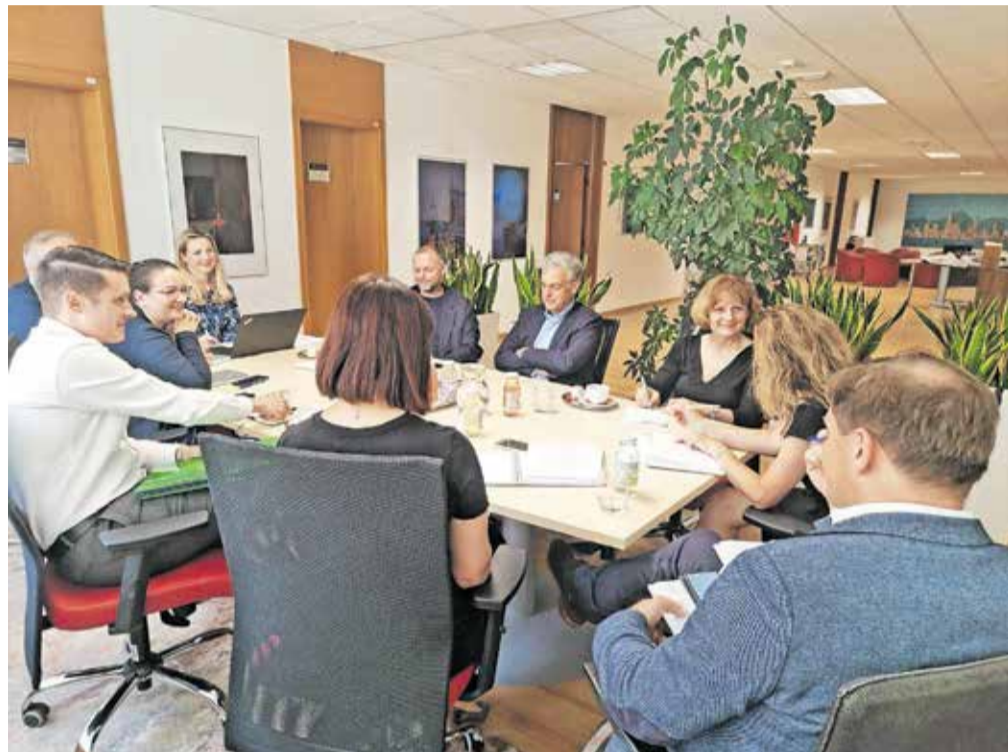
Z delovnega sestanka predstavnikov MOK in stanovanjskega sklada o soseki Ob Savi

MOK mora pred začetkom gradnje soseke Ob Savi zagotoviti komunalno in prometno infrastrukturo na