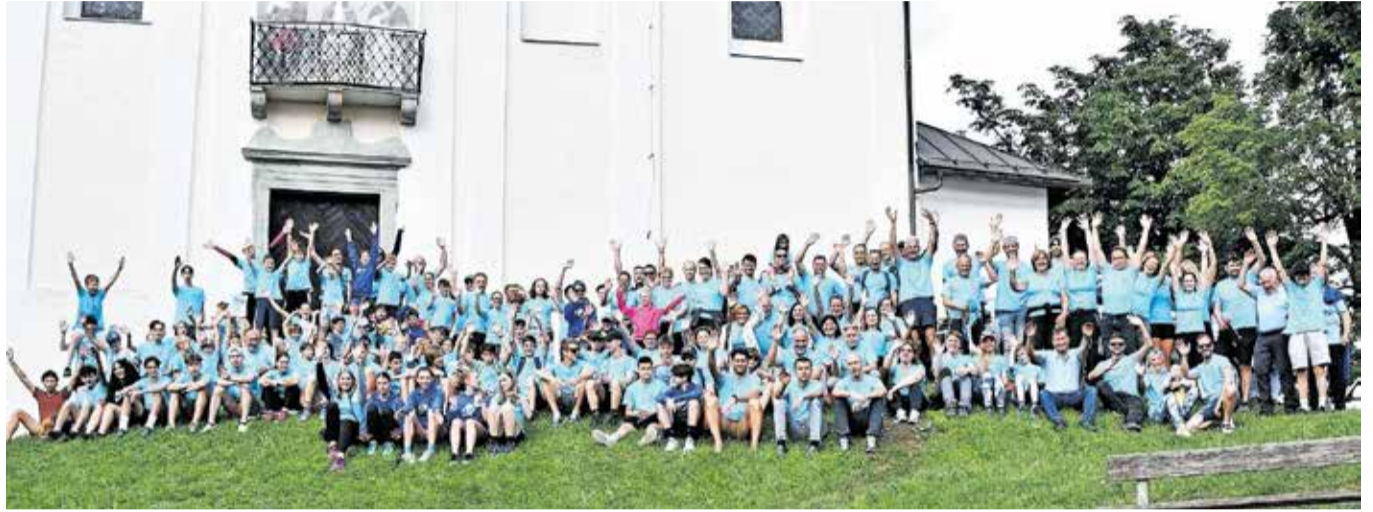
Triglavova modra družina je tudi letos poskrbela za odlične rezultate.