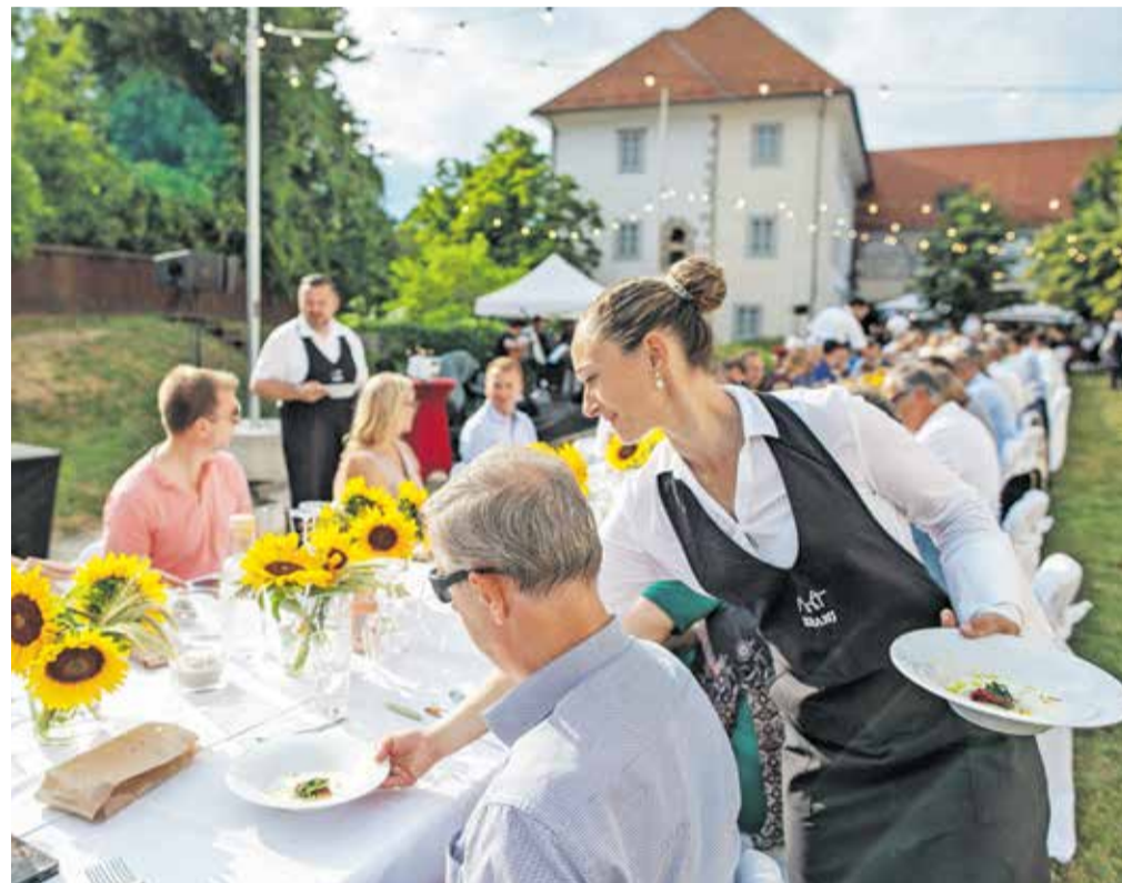
Kranjska dolga miza bo 7. septembra osredotočena na lokalne sestavine, ki bodo na večerji zasijale v vsej svoji lepoti. Na fotografiji je utrinek z lanskega dogodka.

Večerjo, ki se bo osredotočila na lokalne dobrote, pridelane v Kranju in okolici, bodo na vrtu Gradu Khislstein postregli v četrtek, 7. septembra, ob 17. uri. Podrobnosti o tem, kako rezervirati vstopnice, bodo že kmalu objavljene na spletni strani visitkranj.com . Poleg tega bo to poletje v Kranju zaznamovalo še nekaj gurmansko obarvanih datumov, kajti že kmalu, 28. in 29. julija, bo na Glavnem trgu gostovala Karavana okusov. Kot omenjeno, pa v gorenjsko metropolo letos pletiti prvič prihaja Odprta kuhna, ki bo Kranjčane in obiskovalce razveselila 26. avgusta.