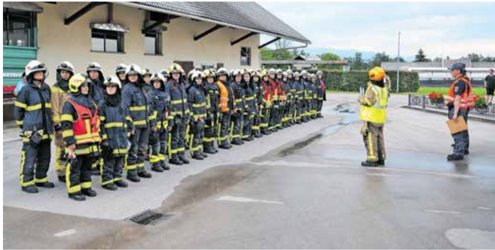
Na vaji je sodelovalo 43 gasilk iz sedmih prostovoljnih gasilskih društev.