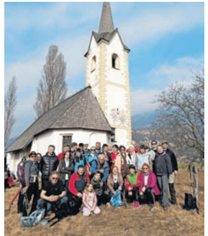
Pohodniki pred cerkvijo sv. Marka

Na koncu poti, pri cerkvi sv. Marka v Vrbi, se vsako leto srečajo s prijatelji pohodniki iz Podnarta, Dobrave, Kamne Gorice in Lancovega. »Malo poklepeta, si