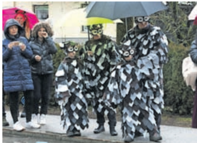
Sovja družina Urbas iz Podnarta je kostume za pustni sprevod izdelovala kar štiri dni.