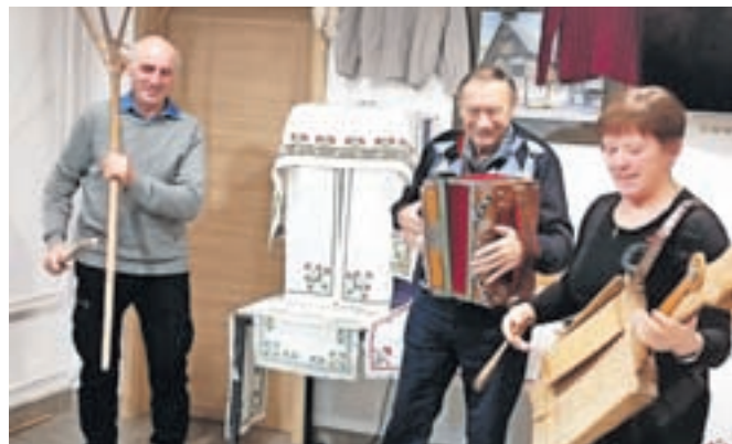
Prireditev ob slovenskem kulturnem prazniku so članice društva pripravile v domu ŠD Ljubno.