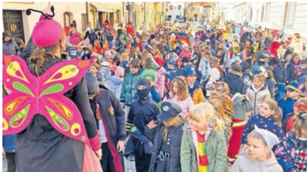
Torkovo pustno rajanje je privabilo številne najmlajše.

Prava pustna povorka pa je bila rezervirana za sobotno popoldne. Vse od Cankarjeve ulice po Gorenjski cesti do Linhartovega trga se je