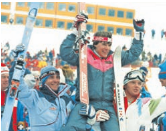
Frankova srebrna medalja je pri navijačih povzročila toliko veselja, kot bi bila zlata.

ši od bureka). Franka so v BiH vzeli za svojega in ga razglasili za častnega meščana glavnega mesta. Ob 40. obletnici zimskih olimpijskih iger v Sarajevu so po Franku poimenovali veleslalomsko progo na Bje-lašnici. Na slavnostni akademiji 8. februarja, ob obletnici odprtja, je bila v Sarajevu