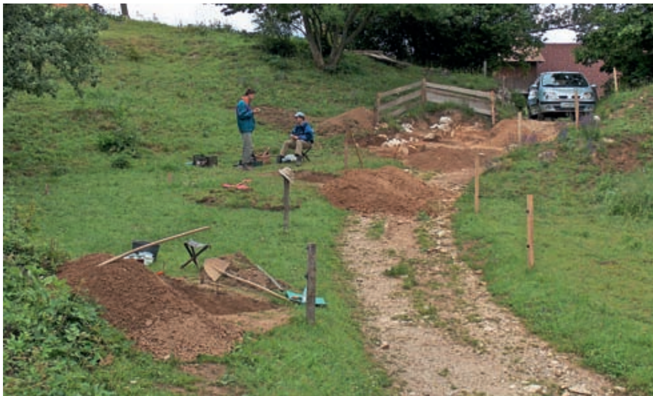
Pogled na izkopno polje na vrhu prelaza v Suhem Dolu nad Lučinami

Tudi na Loškem imamo najdišče iz obdobja paleolitika ali starejše kamene dobe. Odkrito je bilo pri arheoloških raziskavah v Suhem Dolu nad Lučinami.