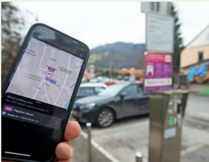
Parkirino plačujte z mobilno aplikacijo EasyPark.

V Ločanki omogočamo objave mnenj občinskih svetnikov. Objavljati jih bomo začeli v februarjski Ločanki, v vsaki številki bosta dve mnenji. Svetniška mnenja si bodo sledila po abecednem vrstnem redu avtorjev.