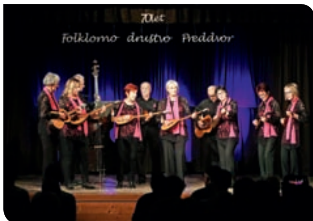
V sklopu lanskoletnega praznovanja 70-letnice organizirane folklorne dejavnosti v Preddvoru so člani FD Preddvor organizirali več dogodkov, zadnji pa je bil veliki koncert v Kulturnem domu v Preddvoru. V goste so slavljenici tokrat povabili skupino s fotografije, Veteransko tamburaško skupino Bisernica iz Reteč pri Škofji Loki. A. B.