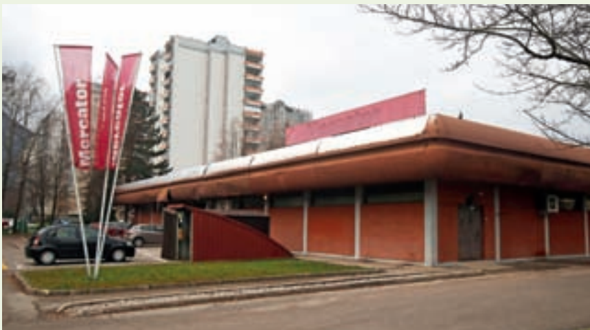
Nakupovalni center v Podlubniku zob časa že dobro načenja.

Na podeželju je treba prenoviti še kar nekaj cest, sanirati je treba nekaj plazov in usadov. Upam, da se bomo lahko lotili kanalizacije v Ševljah, to je precej odvisno tudi od državnega razpisa. Dokončali bomo relativno velik projekt na območju Knap in Bukovščice. Vsako leto se trudimo prenoviti komunalno infrastrukturo delov Podlubnika, Hafnerjevega in Frankovega naselja. Večja investicija nas konec tega oziroma začetek