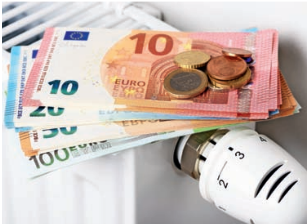
Z znižanjem temperature v prostoru za eno stopinjo Celzija lahko letno prihranimo do šest odstotkov.

Termostatski ventil je zelo pomemben del ogrevalnega sistema, s katerim izvajamo lokalno uravnavanje ogrevanja. »Omogoča nam prilag