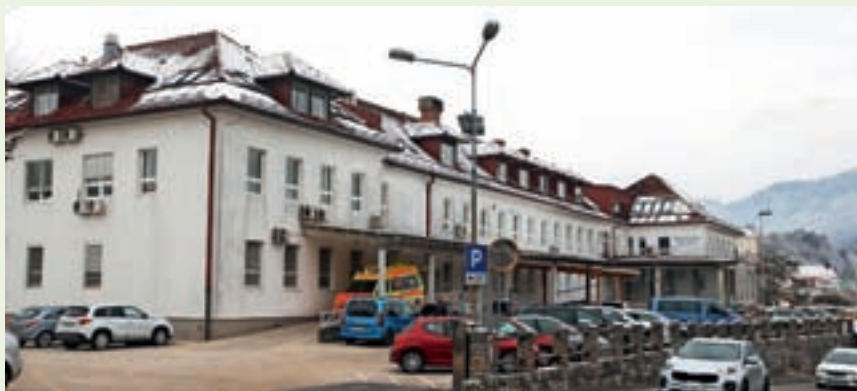
V Zdravstvenem domu Škofja Loka je januar prinesel nekaj novosti.

V Zdravstvenem domu Škofja Loka še poudarjajo, da bo od 1. marca to edi-