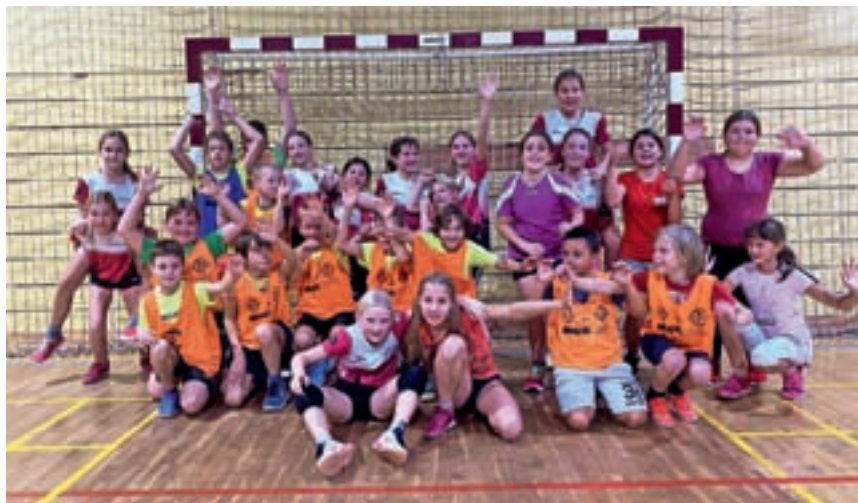
Več kot štirideset deklet v klubu tekmuje v treh kategorijah, in sicer mlajše deklice B, mlajše deklice C in starejše deklice A.

»Ocenjujemo, da je povečanje vpisa posledica dobrega dela kluba, nagovora športnih učiteljev in ravnateljev osnovnih šol v Škofji Loki in okolici in seveda dobrih pogojev za delo. Več kot štirideset deklet v našem klubu tekmuje v treh kategorijah, in sicer mlajše deklice B, mlajše deklice C in starejše deklice A. Hkrati imamo v klubu tudi mini rokomet, kjer deklice od prvega do tretjega razreda osnovne šole spoznavajo ta šport, predvsem pa je trening namenjen igri z žogo, gibalnim vajam in pridobivanju novih izkušenj in znanj. Sodelujejo na neuradnih tek-