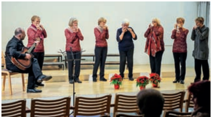
V goste so povabili tudi Loške orglice.

ružilo precej kakovostnih pevcev in pevk – tudi trije tenoristi in basist. »Starejši pevci smo namreč že zelo 'izpeti' pri visokih in nizkih tonih, zato so tenoristi in basisti vedno dobrodošli, iz enakega razloga so pri ženskah cenjene sopranistke, saj tudi sopran z leti ne dosega več tako čistih tonov. Zato smo veseli vsakega, ki v zbor prinese svežino in mladost.«