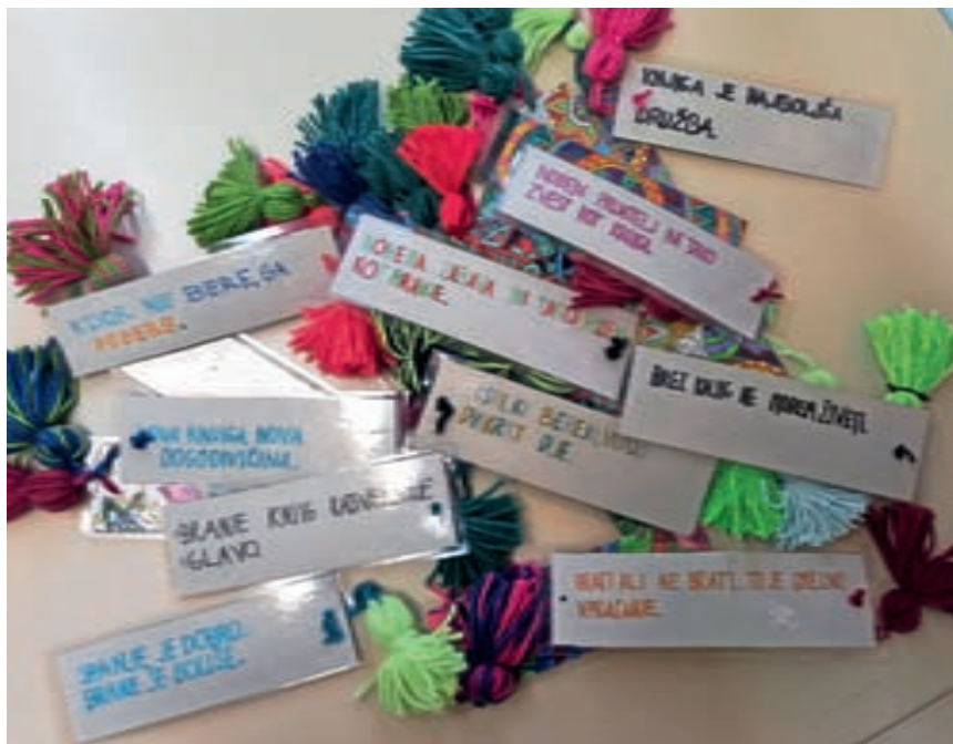
Na zadnjo stran kazalk so zapisali še zanimive misli o branju.