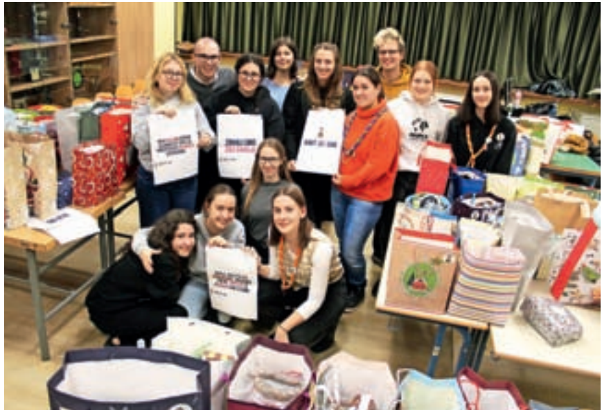
Društvo tabornikov Rod svobodnega Kamnitnika Škofja Loka in Klub škofjeloških študentov sta tudi konec preteklega leta uspešno izpeljala dobrodelno akcijo Škrat za en dan.