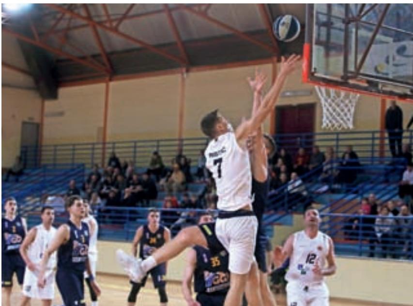
Loški košarkarji v tej sezoni lovijo obstanek med prvoligaši.