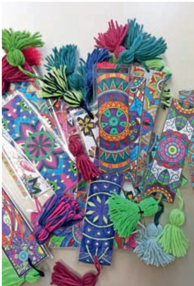
Knjižne kazalke so okrasili z mandalami in pisanimi cofki iz volne.