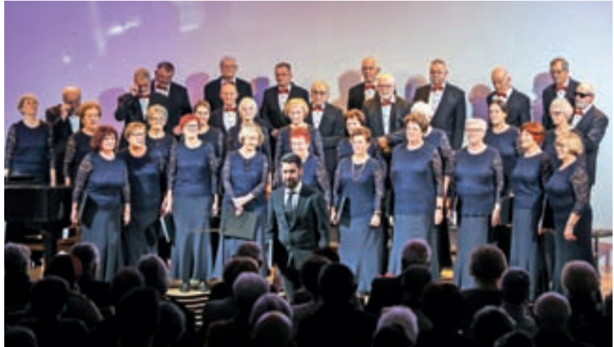
Prednovoletni koncert MePZ Vrelec

»Naš repertoar ni samo za ljubitelje umetniškega zborovskega pevtja, čeprav v zadnjem času večji podarek namenjamo tudi skladbam z višjo umetniško vrednostjo, ki pa so še vedno poslušljive. Z zborovodjem Dejanom Herakovičem namreč težimo k temu, da izvajamo pesmi, ki so nadgrajene z zahtevnejšo melodiko izvajanja,« je razložil Bizjak. Poleg izvajanja narodnih in ljudskih pesmi in napevov tako posegajo tudi po svetovni zborovski literaturi, med drugim so vključili Mozartovo sakralno skladbo Ave verum. »Z zahtevnejšimi skladbami nastopamo tudi na revijah upokojenskih pevskih zborov in na zadnjih dveh revijah smo se zelo dobro odrezali, saj smo osvojili prvo in drugo mesto, kar je zasluga izredno dobrega in strokovnega dela našega zborovodje. S temi uspehi je dobil še dodaten pogum, da z nami pripravlja tudi umetniško zahtevnejše zborovske skladbe.« Ob tem je Bizjak še poudaril, da se jim je v zadnjem letu prid-