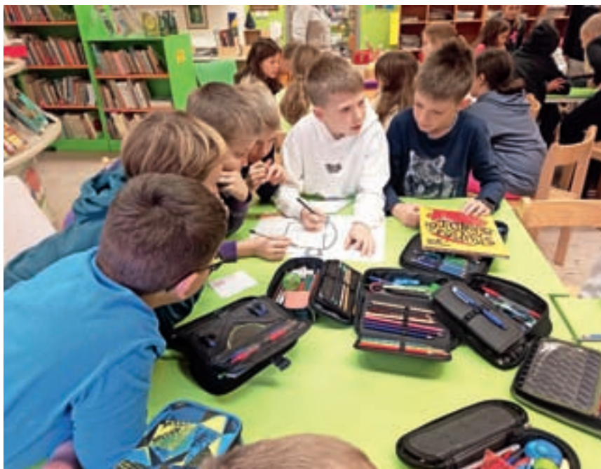
Učenci so narisali lonce, v katerih so »skuhali« pravljice.