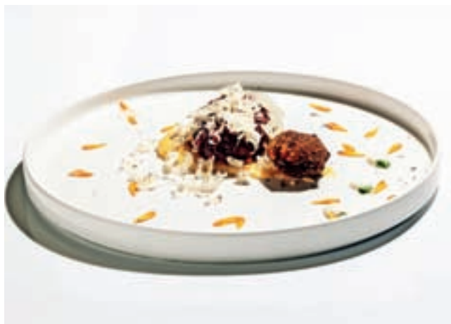
Festivalski krožnik gostilne in vinoteke Danilo

»Kulinarična ponudba na Škofjeloškem že od nekdaj velja za kakovostno, saj območje ponuja pester nabor naravnih živil, ki jih kuharski mojstri in mojstrice spretno vključujejo v slastne jedi s pridihom lokalne tradicije,« poudarjajo na Turizmu Škofja Loka in dodajajo, da kulinarični festival Okusi Škofjeloškega združuje enajst gostiln in turističnih kmetij, ki so se zavezale k skupni zgodbi povezovanja. »A ne le med seboj, temveč tudi z lokalnimi dobavitelji surovin, prav tako pa tudi pri dvigu prepoznavnosti tradicionalne lokalne kulinarike, postrežene na sodoben način.« Pestra ponudba lokalnih pridelkov in izdelkov je rezultat pridnega dela in ustvarjanja ljudi na podeželju, poudarjajo v Turizmu Škofja Loka. »Povezovanje gostinskih in lokalnih ponudnikov prinaša tudi korist za domače in tuje goste, ki na ta način lahko okušajo kulinarične dobrote škofjeloškega območja in tako še bolj začutijo kraje, kjer živimo in delamo.«