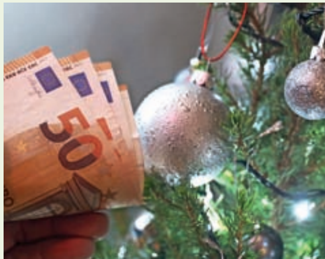
Oblikovali so poseben finančni sklad.

Kreditni za obratna sredstva so namenjeni financiranju tekočega poslovanja, prejmete pa jih lahko po obrestni meri 2,60 odstotka, nominalno, z rokom vračila do 36 mesecev. Kredite za investicije lahko prejmete po obrestni meri 6-mesečni euribor + 2,6 odstotka in z rokom vračila od 36 do 120 mesecev.