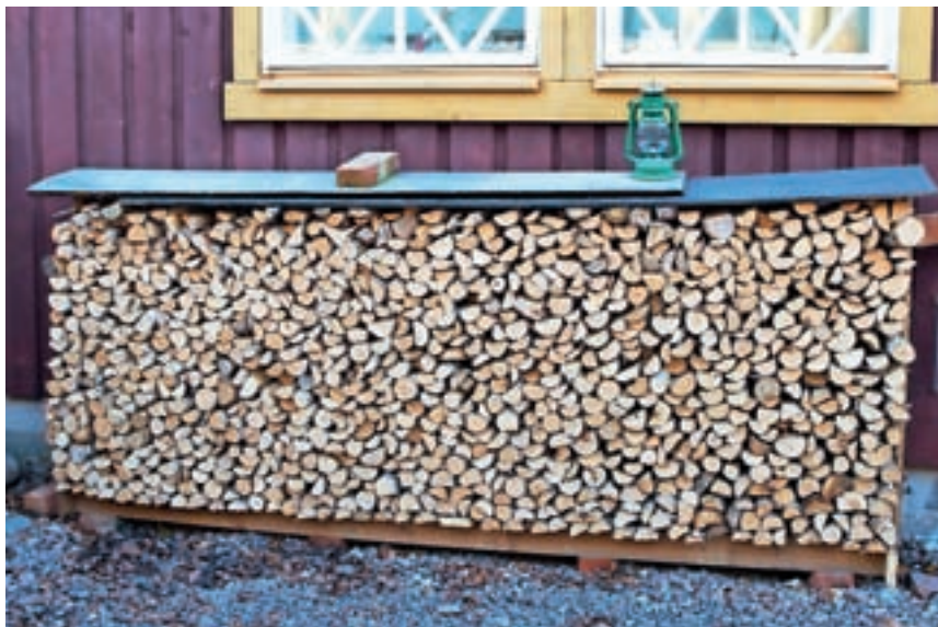
Drva naj bodo zložena z večjim razmikom.

Osnovni problem pri zgorevanju lesa je, da je v njem več kot polovica gorljivih sestavin hlapnih. V fazi sušenja iz lesa najprej izhlapi vlaga, v fazi segrevanja, torej kurjenja, pa hlapne gorljive sestavine, kot so ogljikovodiki in ogljikov monoksid, izhlapijo ne glede na to, ali so zagotovljeni pogoji za njihovo