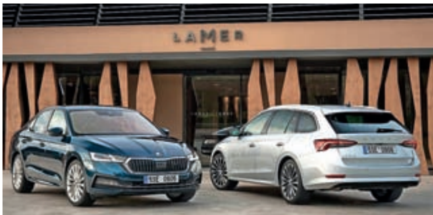
Škoda Octavia, najbolje prodajani avto v Sloveniji v letu 2022

Čeprav sta pandemija in pomanjkanje surovin med drugim zelo prizadela prav avtomobilsko industrijo, je ta iz nje izšla kot zmagovalec, saj je svoje dobičke lepo povečala. Znamka Volkswagen – osebna vozila je v sporočilu za javnost zapisala, da so v težavnih razmerah v prvih