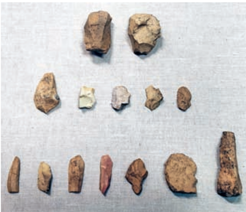
Izbor odkritih kamnitih orodij

Na svojih lovskih pohodih so se paleolitski lovci utaborili tudi na Loškem, in sicer na vrhu prelaza v Suhem Dolu nad Lučinami, natančneje