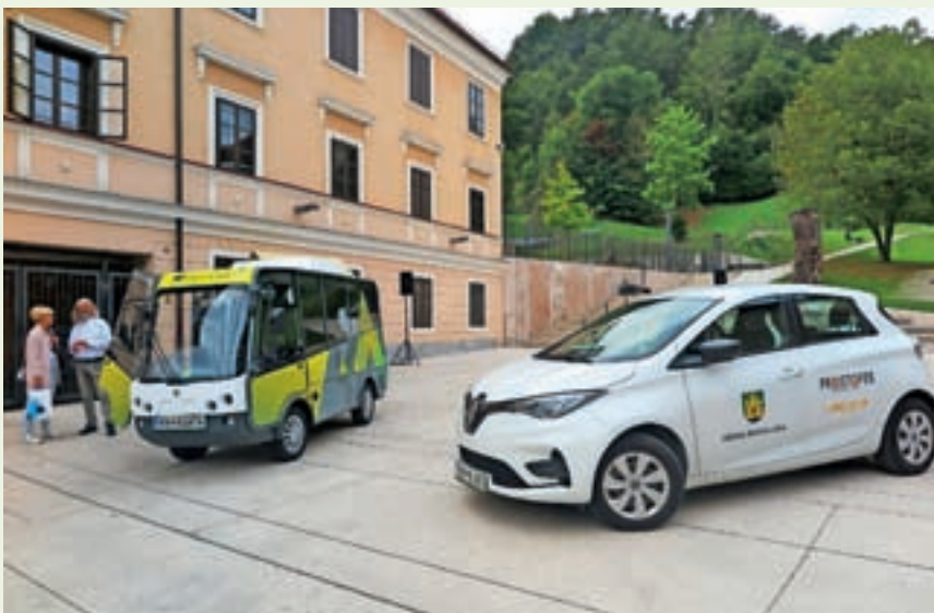
V Škofji Loki je za brezplačne prevoze starejših dobro poskrbljeno.