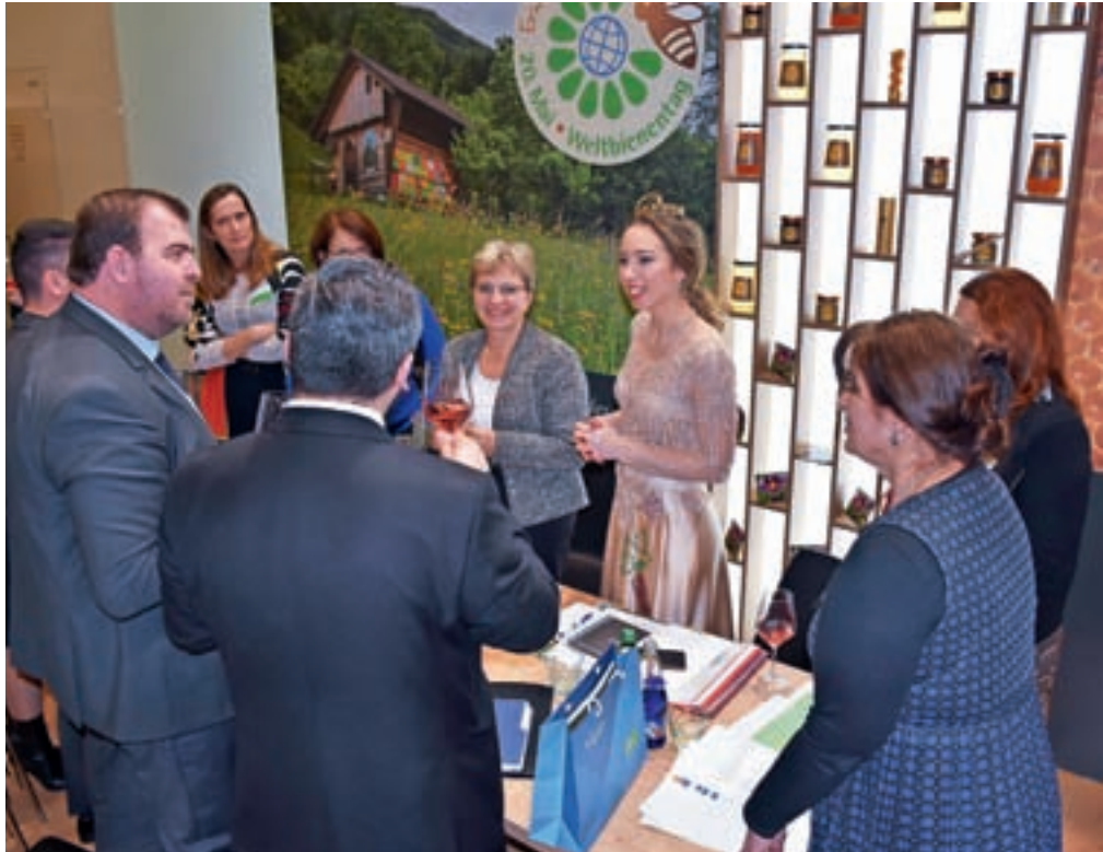
Januarja na mednarodnem sejmu Zeleni teden v Berlinu

Verjetno ne. Bi pa ob tem dodala, da projekt Vinska kraljica ni lepote izbor, čeprav mnogi mislijo, da je. Pokazati moraš precej znanja, potrebnih je kar nekaj priprav. Vprašanj namreč ne dobiš vnaprej, pač pa zgolj teme, potem pa se skušaš kar najbolje pripraviti. Sama sem v priprave vložila teden dni.