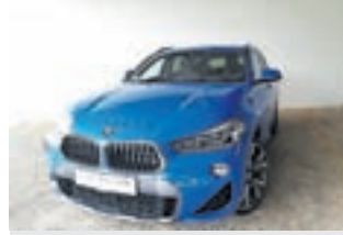
BMW X2 2.0 XDrive M paket , letnik 2018, 50.000km, 1. lastnik, avtomatski menjalnik cena: 31.990 EUR