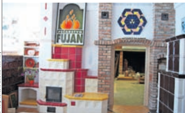
Pečarska in keramičarska delavnica praktičnega pouka

Zaradi upokojitve potrebujemo učitelja praktičnega pouka. Če vas veseli delo z mladimi in obvladate večino pečarstva in keramičarstva , vas vabimo k sodelovanju. Za izvajanje praktičnega pouka pečarstva in keramičarstva imamo na šoli odlične pogoje. Nastop dela je 1. marca 2023. Za podrobnejše informacije se obrnite na nada.smid@sckr.si ali 041 790 325. Vabljeni, da se pridružite učiteljskemu zboru gradbene stroke.