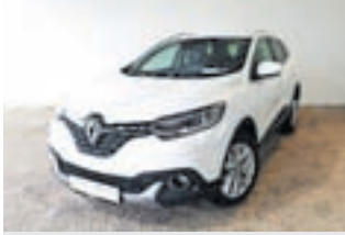
Renault Kadjar 1.6 4WD 130 KM, letnik 2015, 72.000 km, avt. klima, alu. platišča, xenon cena: 13.444 EUR