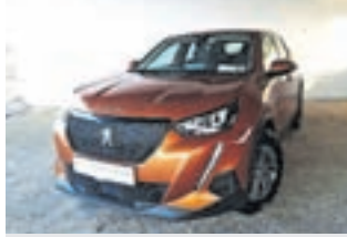
Peugeot 2008 1.2 PureTech 130 Active , letnik 2020, 29.000km, 1. lastnik, led žarometi cena: 20.330 EUR