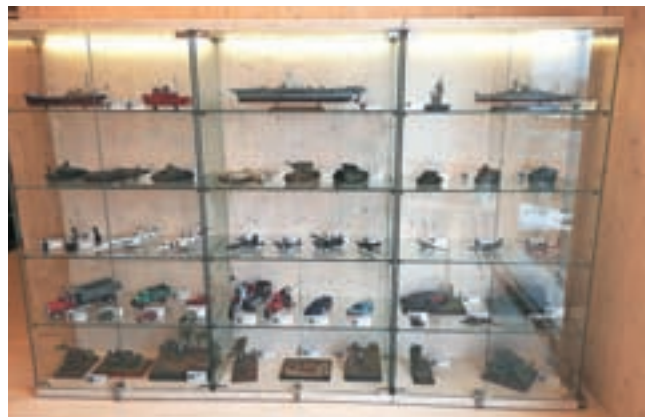
Razstava maket je v blejski knjižnici na ogled do konca februarja.

Gorenjski glas je najbolj bran regionalni časopis v Sloveniji.