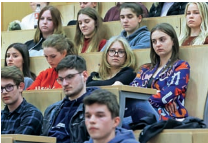
Danes in jutri v srednjih šolah in drugih izobraževalnih ustanovah potekajo informativni dnevi. Fotografija je simbolična.

Podrobnejša pojasnila o vpisu in druge informacije o šolanju bodo bodoči dijaki lahko dobili na informativnih dnevih, in sicer danes ob 9.