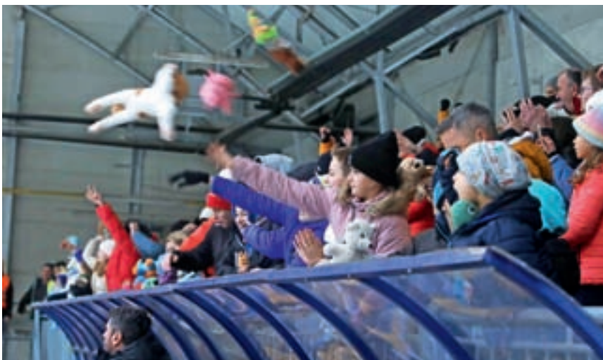
Navijači so na led vrgli več kot tristo plišastih igrač.

Domači igralci so navijače z golom razveselili na začetku druge tretjine in na led so z vseh koncev letele plišaste igrače. Končni rezultat tekme je bil 6 : 2 za Triglav.