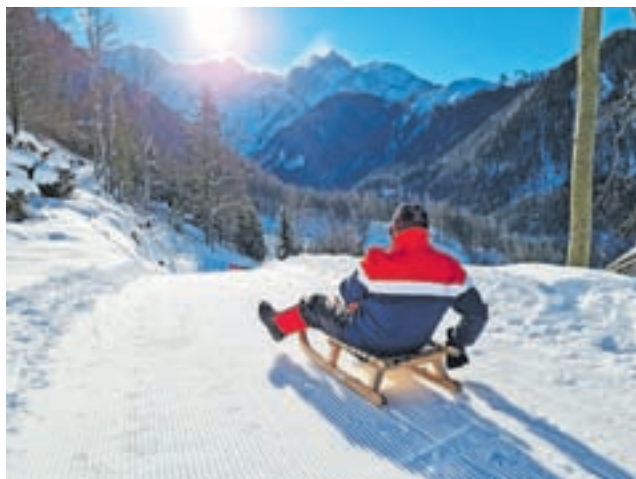
PARK JEZERSKO D.O.O., ZGORNJE JEZERSKO 57, ZGORNJE JEZERSKO