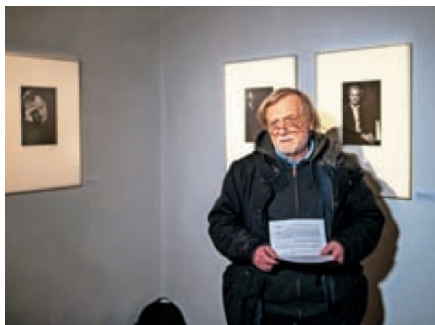
Fotograf Tone Stojko je predstavil portrete Prešernovih nagrajencev, ki jih fotografira že od leta 1996.