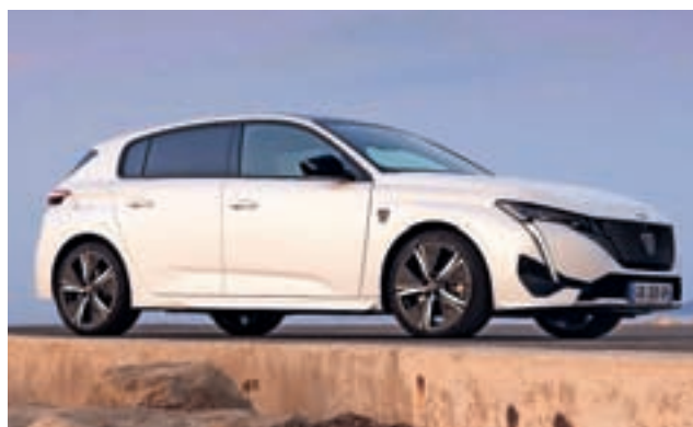
Peugeot 308 upraviči z vozno dinamiko, dobro opremo in kakovostno izdelavo.

T ako peugeot 308 kot drugouvrščena opel astra sta tehnološko skoraj identična avtomobila z enako paleto pogonskih sistemov. Oba poleg bencinskega in dizelskega motorja ponujata tudi priključno-hibridni pogon ter povsem električni pogon. Oblikovalcem in inženirjem je z različnim oblikovalskim pristopom uspelo iz enake osnove zgraditi dva različna avtomobila. Oba avtomobila sta v primerjavi z ostalimi tekmeci imela prednost zaradi pogonske raznolikosti, širokega cenovnega razpona (cenovne dostopnosti) in zelo dobrih voznih lastnosti (spomnimo, pri glasovanju za slovenski avto leta veliko vlogo igra tudi cenovna dostopnost in umeščenost vozila na slovenski trg). Peugeot 308 je prepričal tudi s svojo notranjostjo in dobro ergonomijo.