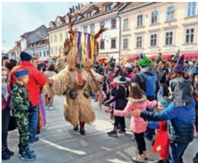
Lanska pustna sobota v Kranju. Kurenti in koranti, skupaj jih bo več kot sto, jo bodo popestrili tudi letos.

V ponedeljek, 20. februarja, ob 17. uri bo v dvorani Knjižnice Globus okrogla miza z naslovom Njihov dan ljubezni, ki jo ob mednarodnem dnevu boja proti otroškemu raku (15. februar) prireja Dijaška organizacija Slovenije v sodelovanju z Inštitutom zlata pentljica, otroci z rakom. Na dogodku se bodo predstavili otroci in mladostniki inštituta, prejemniki jabolka navdih, ki so v otroštvu zboleli za rakom. Spregovorili bodo o svoji bolezni ter tako ozaveščali svoje vrstnike in javnost, saj je v družbi še vedno veliko nejasnega in vprašanj, povezanih z rakom pri otrocih. A. Š.