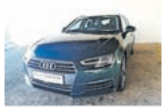
Audi A4 Avant 2.0 TDI Sport , letnik 2017, 170.000 km, virtualni števcvi, led žarometi cena: 17.999 EUR