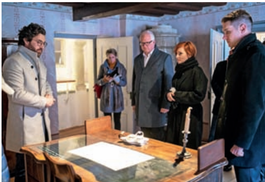
Na obisku v Prešernovem spominskem muzeju

Še isti dan so se letošnji nagrajenci, dobitnika Prešernove nagrade