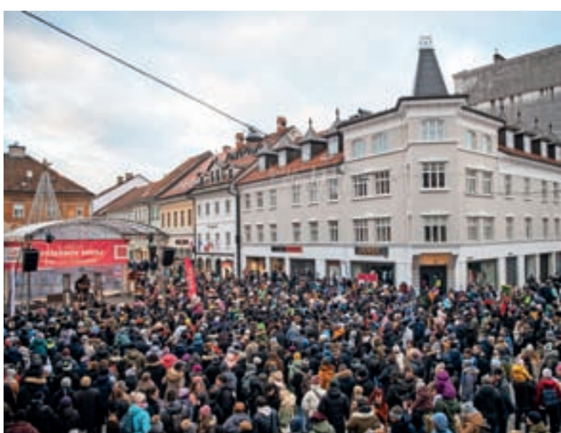
Prešernov smenj je obiskalo več kot 10.000 obiskovalcev.

Ena od gospa, ki smo jih srečali, je bila navdušena nad stojnicami, na katerih so svoje izdelke predstavljali številni ponudniki domače in umetnostne obrti. »Všeč mi je, kako ustvarjalni so ljudje, kar ne moreš verjeti, česa vse se lotijo delati iz raznoraznih materialov ...« Oče in hči Smenj obiščeta vsako leto: »Včasih smo zaradi hčerkinе šole hodili, da je bolje spoznala Prešernov čas, zdaj pa zato, ker smo se navadili na flancate. (smeh)« Da skočijo na kosilo domov in se potem vrnejo na prireditve, nam je povedala družina, ki živi v mestu. »Fina je ta energija, ki danes kroži po mestu, da ni samo gostinska in trgovska ponudba, ampak da tudi vse institucije pripravijo programe. Včasih težko izbereš, kam boš šel, kakšno stvar pač zamudiš, ampak zato je pa treba vsako leto priti,« so nam povedali, nato pa odhiteli na odprtje razstave v grad Khislstein, pogledat ponije na Pungert, kasneje pa še pozdravit človeško ribico v Rove. Mestna občina Kranj ter Zavod za turizem in kulturo Kranj sta sicer v sodelovanju z Gorenjskim muzejem, Prešerno-