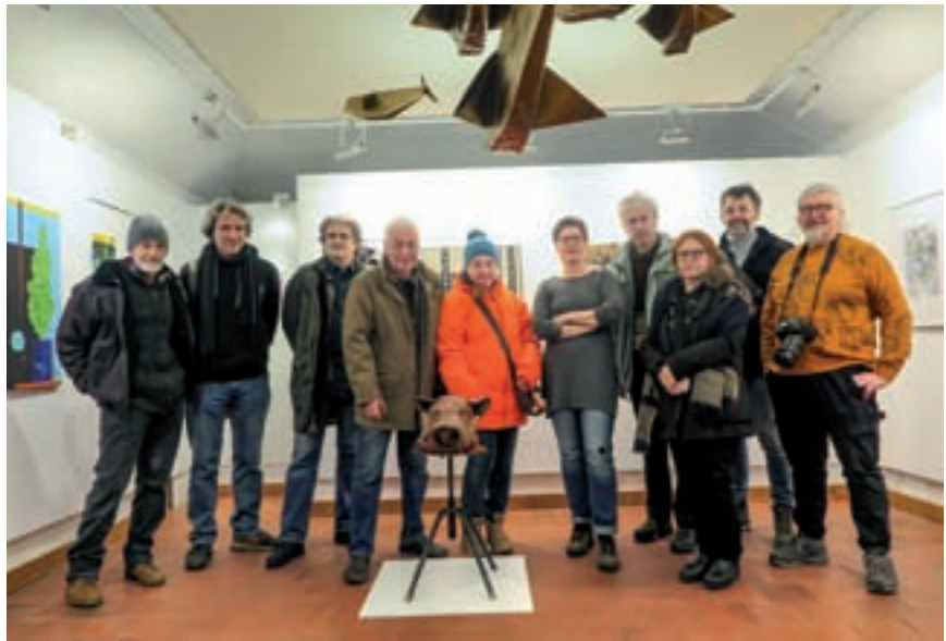
Večji del avtorjev, ki se predstavljajo na razstavi v čast pesniku

Na samem začetku je bil človek in njegove misli so letele po zraku kot sulice, kot lahko razberemo iz dela