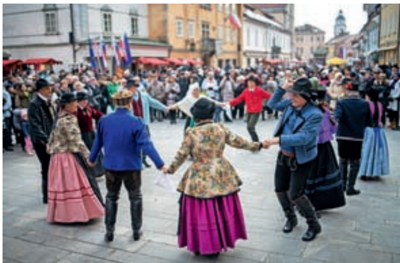
Navduševali so tudi številni plesalke in plesalci starih plesov.