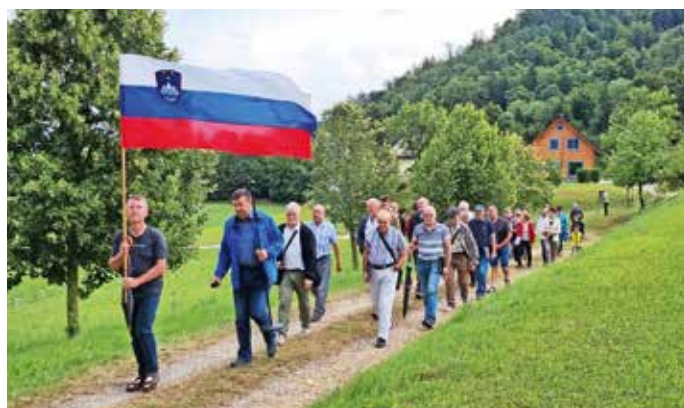
Pohod po Aleji Slovenija v počastitev dneva državnosti