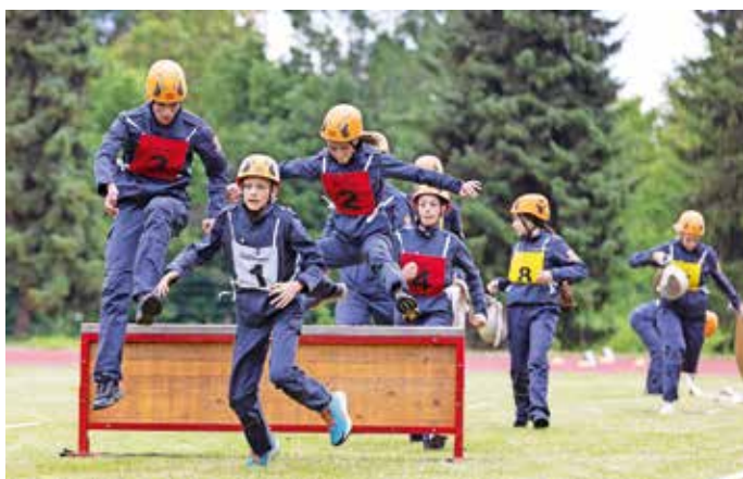
Mladinci so tekmovali v vaji z ovirami.

Gasilska zveza Medvode je 10. junija na atletski stezi Policijske akademije v Tacnu pripravila mladinsko tekmovanje v gasilskih športnih disciplinah. Več kot 160 tekmovalcev in tekmovalk se je pomerilo v štirih kategorijah. Gasilski pionirji in pionirke so tekmovali v vaji z vedrovko, štafeti na 400 metrov z ovirami in vaji razvrščanja, mladinci in mladinke pa v vaji z ovirami za mladince, štafeti na 400 metrov z ovirami in vaji razvrščanja. Sodniki so ocenjevali spretnost in natančnost pri izvajanju gasilskih veščin, hitrost ter sodelovanje ekip. Tekmovanja v Tacnu so se udeležile ekipe iz vseh medvoških gasilskih društev, manjkali so le mladi iz PGD Preska - Medvode. Tradicionalno so na tekmovanjih mladih gasilcev najboljše člani PGD Zbilje in letos je bilo podobno. Zmagali so v kategorijah pionirjev, pionirk in mladink, v kategoriji mladincev pa so jih premagali mladi iz PGD Smlednik. P. K.