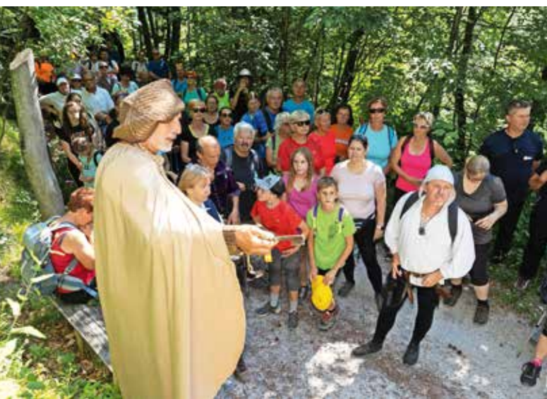
Na Gradišču so pohodniki spoznali lokacije in zanimivosti o izkopavanjih.

ter orožje in oklepe, in kulturno društvo Lonca iz Škofje Loke, ki je prikazalo nekaj srednjeveških plesov.