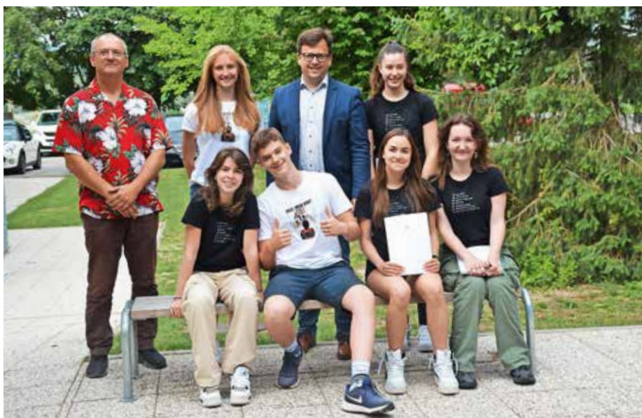
... in OŠ Simona Jenka Smlednik

kar učiti, a če se potrudiš, imaš motivacijo, se da,« je dejal. Pohvale si zasluži tudi za medvrstniško pomoč. »Imam sošolca, ki sem mu tudi jaz pomagal pri učenju in je zelo izboljšal ocene. Ponošen sem tudi na druge. Smo zelo odprt razred, si pomagamo. Posojamo si tudi zapiske. Zdi se mi, da je na naši šoli to kar praksa.« Odhaja na Gimnazijo Šentvid. Zanima ga naravoslovje.