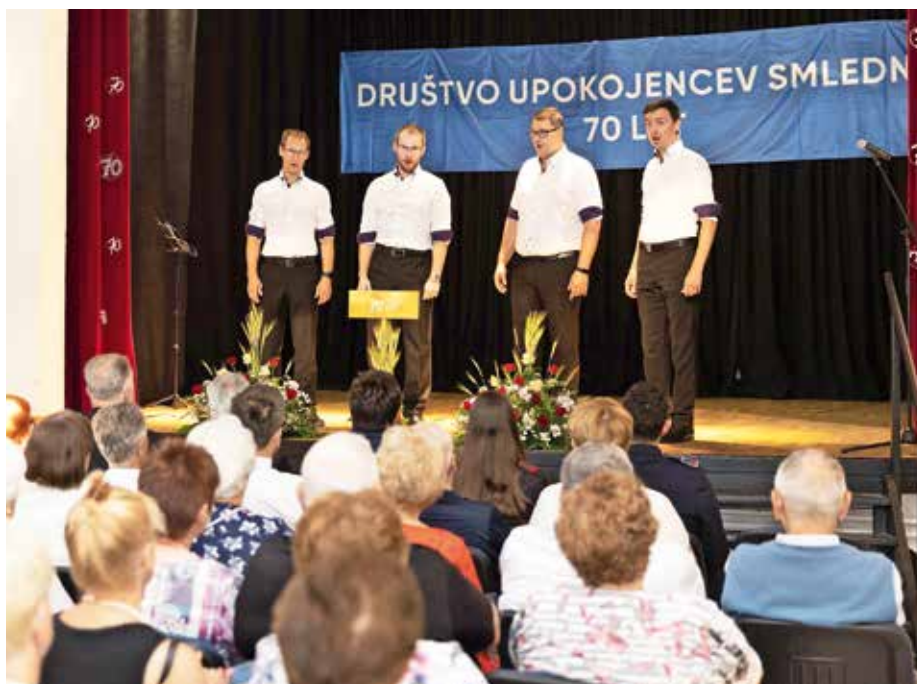
V kulturnem programu ob 70-letnici društva je teden dni po letnem koncertu nastopila tudi vokalna skupina Foné Megále.

Društvo si s svojo dejavnostjo prizadeva izboljšati gmotni položaj upokojencev, organizira in izvaja kulturne, rekreativne, zdravstvene in izobraževalne dejavnosti. Organizira srečanja, prireditve, izlete in seznanja upokojence s social-