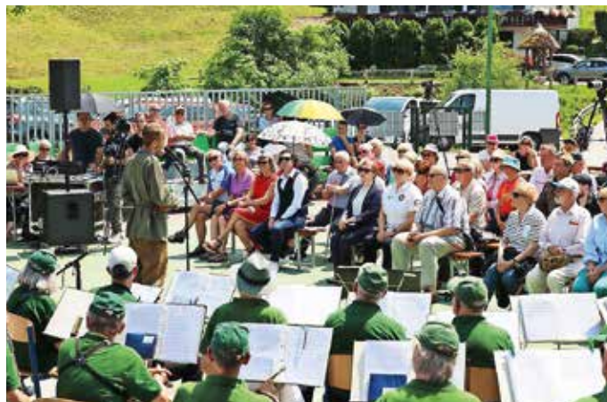
Utrinek s slovesnosti ob obletnici Dolomitske republike

ker se danes stvari, ki so se dogajale nam, sedaj pač dogajajo drugim, se nam bo zgodovina vrnila. Razmišljanje, da se take stvari dogajajo drugim, nam pa se ne morejo več zgoditi, je zelo kratkovidno. Zato ne pozabimo: vsaka nova vojna se začne, ko prva naslednja generacija izgubi zgodovinski spomin,« je poudaril.