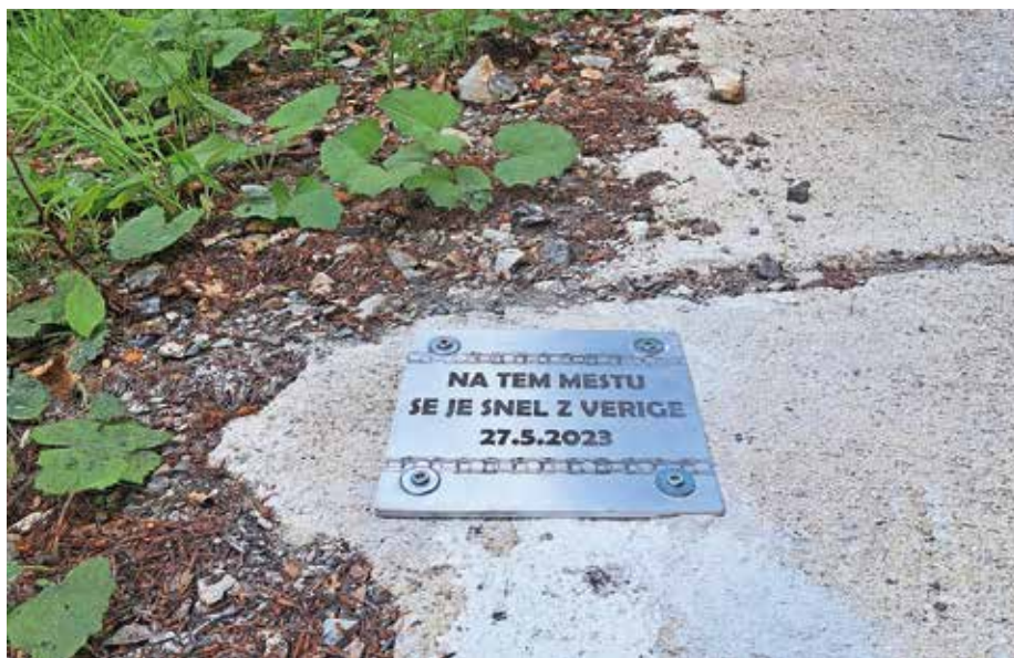
Ploščica označuje mesto, kjer se je Primožu Rogliču na poti k zmagi na kronometru iz Trbiža na Višarje in k skupni zmagi na Giru snela veriga.

S pritrditvijo se strinjajo tudi Italijani, saj bodo ploščico še dodatno označili, da bo bolj vidna.