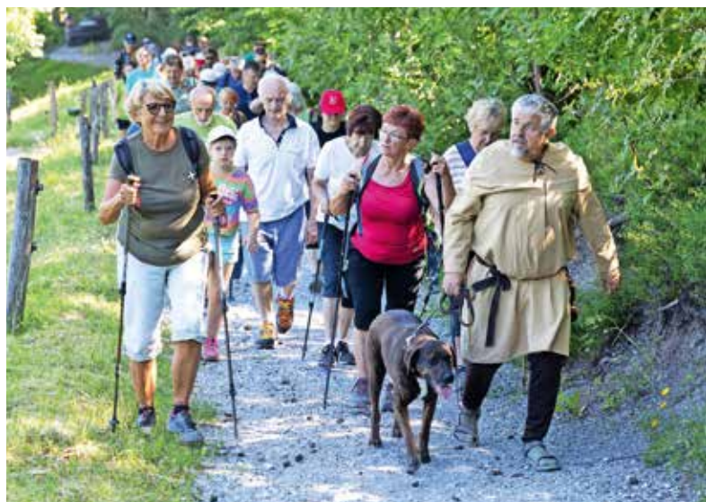
Pot je pohodnike z Marjete vodila proti Jeterbenku.

V dvajsetih letih se trasa pohoda ni spremenila. Prva skupina pohodnikov je pot začela pri Osnovni šoli Preska, dobre pol ure pozneje pa so se jim pri Galeriji pod kozolcem pod cerkvijo sv. Marjete v Žlebeh pridružili preostali. Od tam so skupaj odšli do cerkve, kjer so jih čakali njen ogled, okrepčilo in navodila za nadaljnjo pot. Odšli so do Gradišča in naprej okrog Jeterbenka do cerkve sv. Jakoba na Petelincu. Tam so letos okolico pripravili za prihajajočo obnovo cerkve. Pohodniki so si ogledali njeno notranjost in prisluhnili kratkemu nastopu Sorških orgličarjev. Sledil je hiter spust do Branovega in zaslužena malica ter druženje, ki so ga popestrili srednjeveški gostje. TD Žlebe - Marjeta je letos v svoje vrste povabilo viteze iz Žužemberka, ki so s seboj prinesli srednjeveške igre