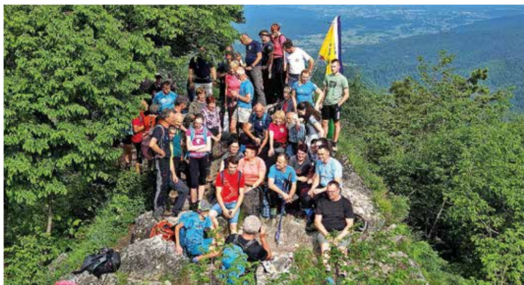
Planinci iz dveh sosednjih občin na Grmadi

PD Medvode in PD Blagajana sta 10. junija pozno popoldne pripravila sedaj že tradicionalno srečanje na vrhu Polhograjske Grmade ob obletnici postavitve orientacijske plošče. To je kažipot po sosednjih bližnjih in daljših vrhovih. Člani društev so prišli vsak s svoje strani. Tako je že vse od leta 2001, ko je bilo na tem razgledniku prvo uradno srečanje planincev občin Medvode in Polhov Gradec. Letos se jih je zbralo skoraj petdeset, med njimi župana obeh občin, ki sta zbrane tudi nagovorila. Srečanje so nato nadaljevali na kmetiji odprtih vrat na Gontah. M. B.