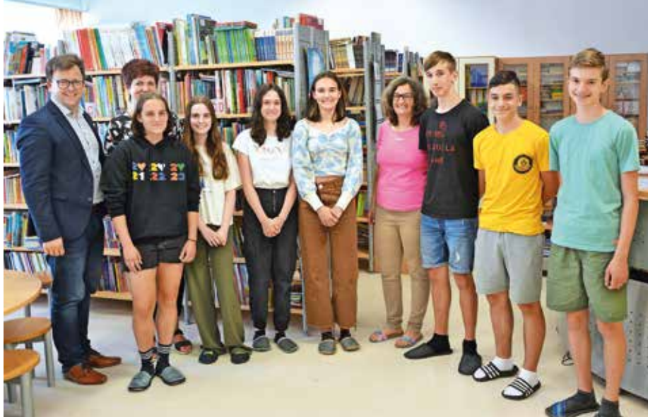
... OŠ Medvode