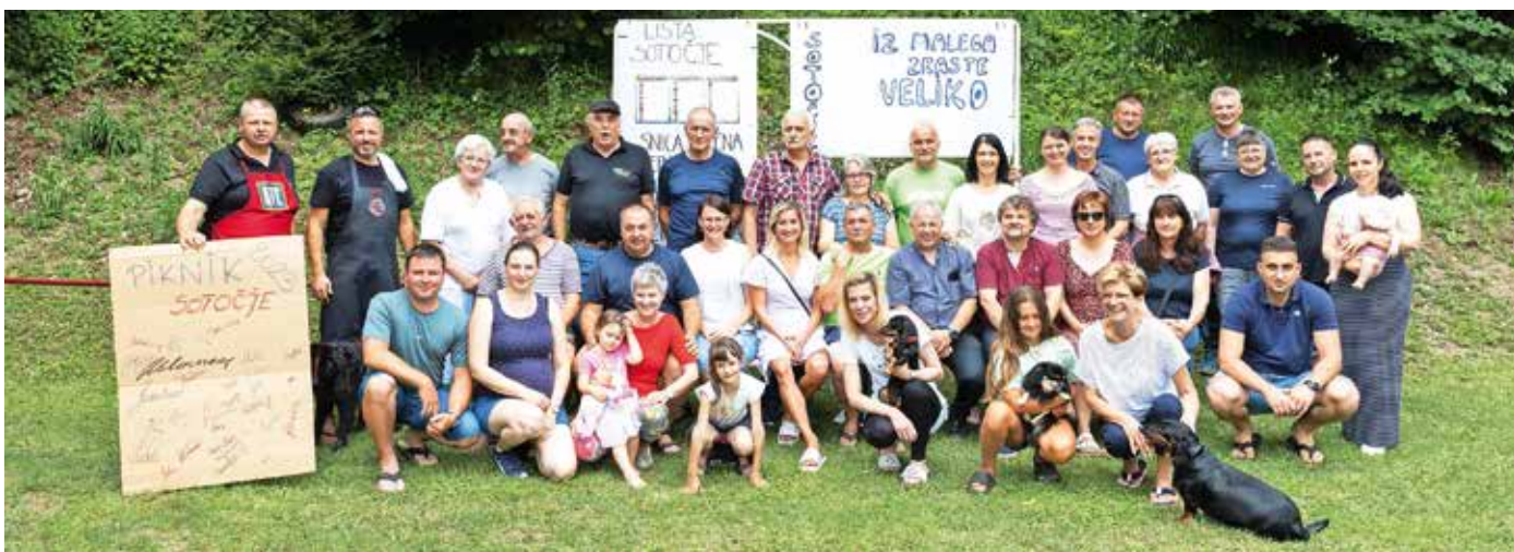
Kot vsako leto je Nestrankarska lista Sotočje na Zgornji Senici pripravila piknik, na katerega so povabili celoten občinski svet, prijatelje in podpornike. Vroče nedeljsko popoldne 2. julija je minilo v druženju brez bremena odločanja o pomembnih občinskih temah. P. K.