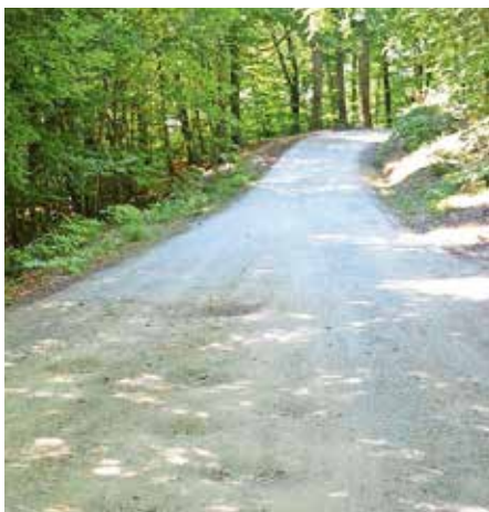
Asfaltirali bodo še dobrega pol kilometra ceste.

Gre za eno izmed prioritetenih investicij, ki jih je predlagala Krajevna skupnost Sora. »Na Občini Medvode si prizadevamo, da skladno s finančnimi zmožnostmi asfaltiramo čim več makadamskih cest na območju Polhograjcev, saj se s tem izboljša kvaliteta bivanja in hkrati znižajo stroški vzdrževanja cest. Na odseku Sora–Osolnik bo po zaključku del ostal le še en neasfaltiran odsek, ki ga bomo asfaltirali takoj, ko bodo zagoto-