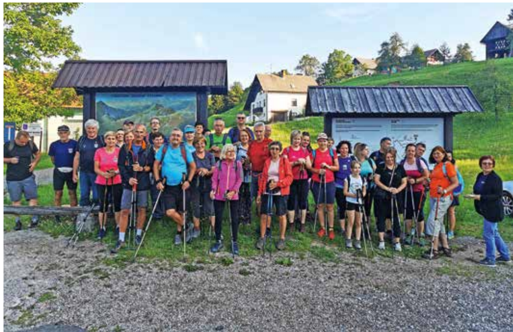
Lepo število pohodnikov se je na pot do rojstne hiše Jakoba Aljaža podalo s Topola.

Dogodek je potekal v organizaciji Javnega zavoda Sotočje. Z izvedbo in obiskom so zadovoljni. »Udeležba je bila dobra. S Topola in Hraše je startalo okrog petdeset pohodnikov, okrog deset se jih je priključilo še na Petelincu in v Žlebeh. To pomeni, da je bilo okrog 110 pohodnikov, kar je lepa številka. Vreme je bilo čudovito, proti koncu že skoraj prevroče. Tempo je bil takšen kot vsako leto, rav-