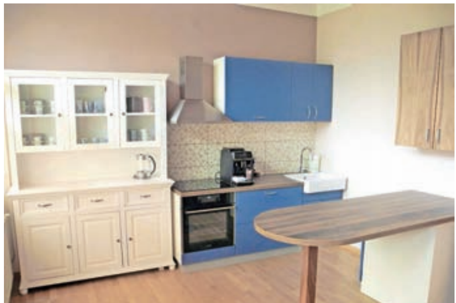
Uredili smo tudi kuhinjo

Prostori so na voljo vsem zainteresiranim društvom, interesnim skupinam, organizacijam in posameznikom za namene produktivnega druženja, razvijanja novih idej, medgeneracijskemu povezovanju v obliki izvajanja dogodkov, delavnic, izobraževanj, usposabljanj, predavanj, razstav, ipd. Sodobno opremljeni prostori zajemajo: osrednji prostor (mize, stoli, sedalne vreče, TV-projektor, računalniki, pisarniška oprema ...), kuhinjo, sanitarije, hodnik in pred-