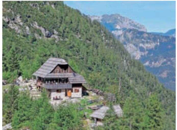
Češka kočica bo kulturni spomenik lokalnega pomena.

»Koča je ohranila izvorno obliko. Klet je zidana iz kamna, na vzhodni strani odprta, pritličje je stesano iz brun, ki so v vogalih vezana na lastovičji rep. Zahodna fasada je opažena, prav tako oba zatrep. Južno in vzhodno fasado oklepa gank, ki ima funkcijo zunanjega hodnika. Gank je s streho povezan z rezljanimi stebrički. Deli prvotnega ganka, ki ga je 1976 odtrgal plaz, so razstavljeni v Jenkovi kasarni. Novi gank je bil narejen kot kopija starega. Streha ima lomljeni strešini in je krita s pažnicami. Čopa sta izdelana v obliki polkroga. Okna so dvokrilna in razdeljena na tri polja, zastirajo jih lesene polknice. Vhodna vrata so preprosta, narejena iz lesenih plohov in z zapiralom na rigelj. V hiši je ohranjenih še nekaj pr-