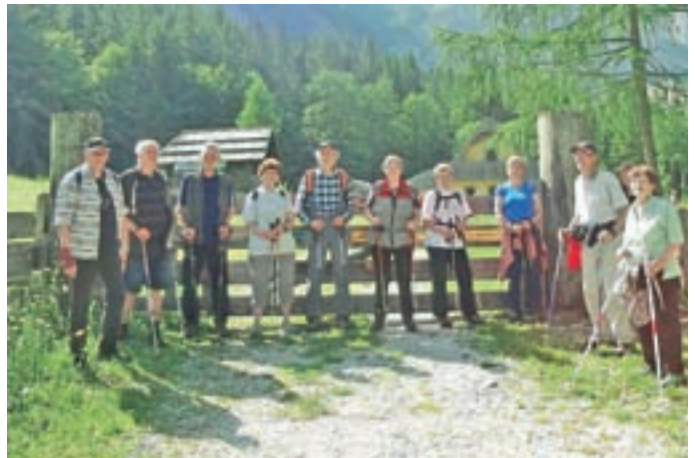
Udeležili smo se pohoda k Davu.