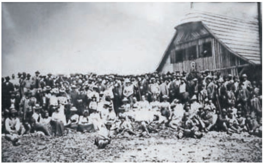
Z odprtja Češke koč

novno srečali in se povzpeli na Zgornje Ravni pod Grintovcem in Dolško Škrbino, na nadmorsko višino 1843 metrov, koder naj bi bila lokacija za novo Češko koč. Po gorski modrosti in izkušnjah in še vedno velikih količinah snega so se odločili, da zaradi varnosti pred plazovi določijo mesto postavitve dobrih dvesto metrov nižje, na 1600 metrih – in to je bila dokončna lokacija Češke koč.