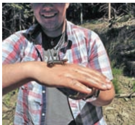
Bližnje srečanje naravoslovcev z živalmi

jim na kakršenkoli način pomagali na terenih in drugje. Med temi so bili tudi lovci. Franc Ekar iz Lovske družine Jezerško je udeležencem tabora, ki so bili nameščeni v centru GRS Virnikova karavla, predstavil delovanje lovske družine, jih popeljal po nekaterih lovnih površinah,