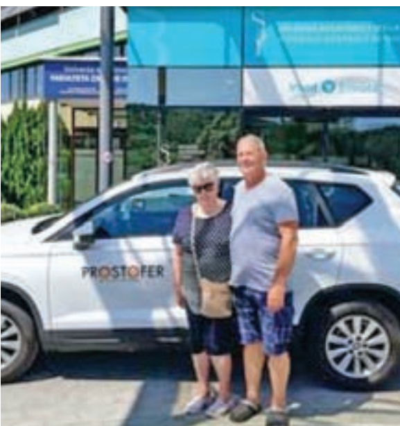
S srcem na poti, brezplačni prevozi za starejše