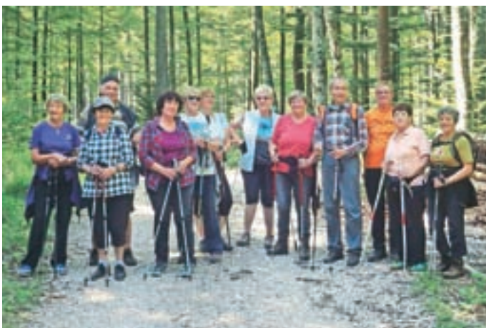
Skupinski posnetek z vrnitve s slapu Čedca