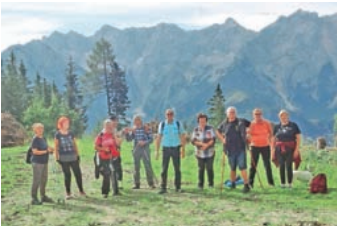
Vedri pohodniki na Ankovi planini