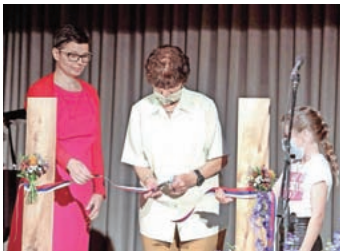
Simbolno odprtje novega medgeneracijskega centra