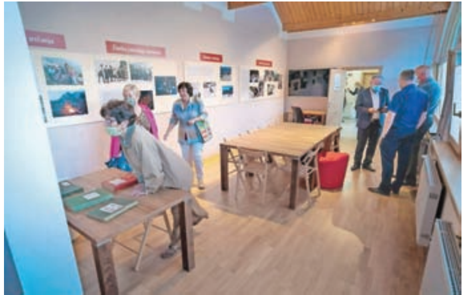
Prostori MGC Jezersko

V začetku septembra so bila končna vsa dela in dobavljena oprema za nove prostore medgeneracijskega centra (MGC), katerega odprtje je potekalo 11. septembra, istočasno s slovesnostjo ob počastitvi praznika Občine Jezersko.