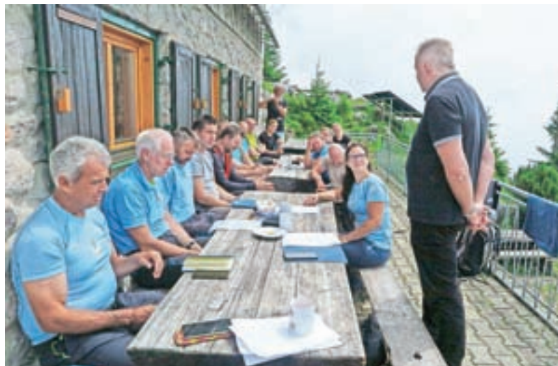
Minister je prisluhnil predlogom in podal tudi nekaj konkretnih rešitev.

Minister je predlogom pozorno prisluhnil in že podal nekaj konkretnih rešitev, ki naj bi pripeljale k temu, da se planinski turizem povzdigne na višjo raven. »Delo v planinstvu je deloma prostovoljno, deloma pa posel – in zdi se mi prav, da ima vse, česar se lotimo, neko dodano vrednost. Resda mora planinski turizem rasti na neki vzdržen, okolju prijazen in