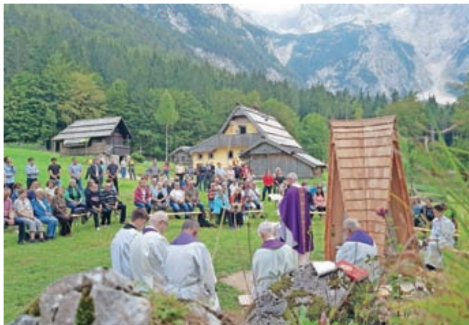
Z obletne maše in blagoslovitve kapelice

Spomnimo: Davo Karničar je 7. oktobra 2000 kot prvi na svetu smučal z najvišje gore sveta. Zatem je osvojil in smučal tudi z vrhov preostalih celin: Afrike (Kilimandžaro, 5895 m n. m., november 2001), Evrope (Elbrus, 5642 m n. m., maj