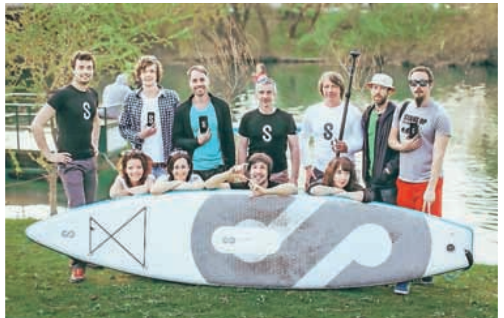
Ekipa SipaBoards, ki je v zgolj dveh tednih zbrala potrebnih 150 tisoč evrov za zagon proizvodnje prvega samonapihljivega supa na svetu.

Pretežno kamniška ekipa SipaBoards, ki sedaj sestavlja že petnajst sodelavcev, je v zadnjih mesecih trdega dela razvila prvi samonapihljivi sup z električnim pogonom, kar predstavlja novost na svetovnem tržišču. Prednost supa, ki je dobil ime po sipi, je v prvi vrsti v tem, da je primeren tako za začetnike in otroke kot tiste, ki še niso suvereni v stoječem veslanju. SipaBoards ima električno baterijo, katere moč sup najprej napihne, nato pa uporabniku olajša veslanje in mu omogoča do štiri ure vožnje. Skrit potisni motor na dnu supa pomaga tudi pri ohranjanju ravnotežja in smeri, vsi uporabniki pa si bodo lahko pomagali z motorjem, ki ga upravljajo z gumbom na veslu. Zložen