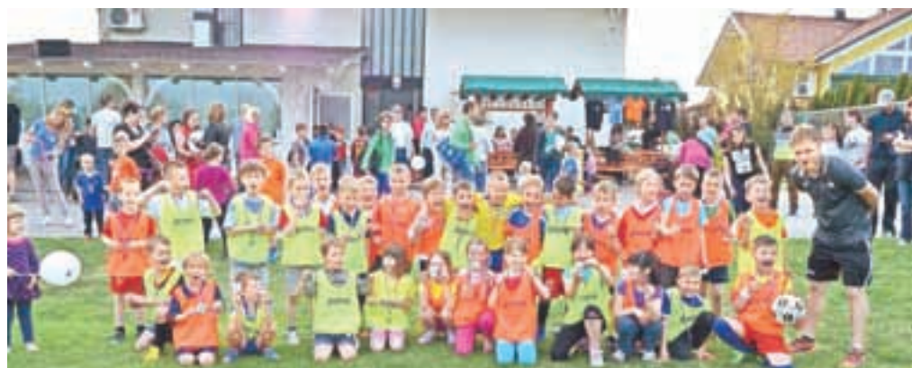
Mladi nogometaši na Igralnem dnevu NK Virtus

žogo velikanko oz. zorbing žogo, v kateri so se z užitkom kotalili in uživali kot hrčki v svojem kolescu. Za zaključek pa smo jim pripravili manjše presenečenje, saj je vsak udeleženec bil nagrajen s spominsko medaljo Igralni dan – Virtus 2015. Medaljo, s katere jih pozdravlja in bodri naš Levček, ki je klubski simbol ter krasni Virtusov grb. In še za konec, če je merilo veselje in nasmeh otrok, ki so prisostvovali, potem je Igralni dan – Virtus 2015 odlično uspel! Priredili smo jim lep dan in izkušnjo, ki jim bo ostala v spominu. Hvala vsem trenerjem in staršem, ki so pomagali, da so otroci ta dan uživali!