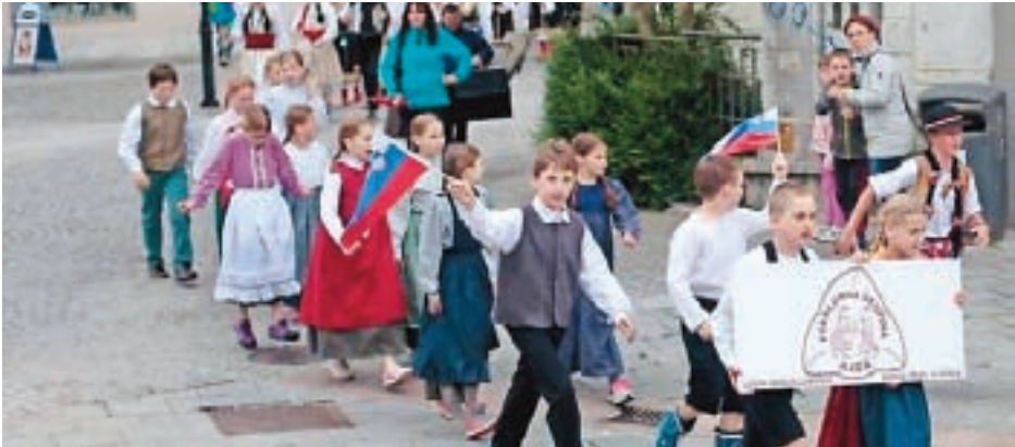
SREDNJA OTROŠKA FOLKLORNA SKUPINA - XIII. MEDNARODNI OTROŠKI FOLKLORNI FESTIVAL FOS (GRAD KHISELSTEIN KRANJ)

Kako naprej, kako dejavnosti posodabljati, jim dajati nove vsebine? Za praznovanje 110-letnice delovanja našega kulturnega društva se že pripravljamo, prav tako tudi na 20-letnico Mešanega pevskega zbora sv. Tilna. Skupaj z župnijo pa že v naslednji sezoni načrtujemo odprtje skupne knjižnice, kar bo le nadaljevanje naše bogate kulturne tradicije.