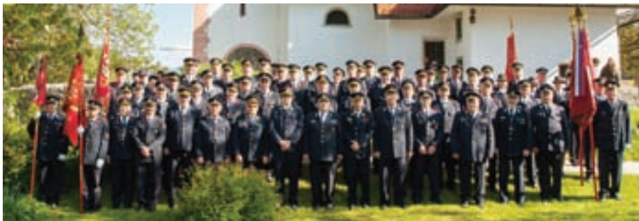
GASILCI NA FLORJANOVI MAŠI V SPODNJI BESNICI 8. MAJA 2016

Pred nami so novi izzivi. Letos in prihodnje leto zagotovo največji s finančnega vidika, saj želimo spremeniti žalostno podobo gasilskega doma. S prenovo ne bomo zgolj pripomogli k lepši podobi našega kraja, ampak tudi izboljšali pogoje za delo društva za prihodnje. NA POMOČ!