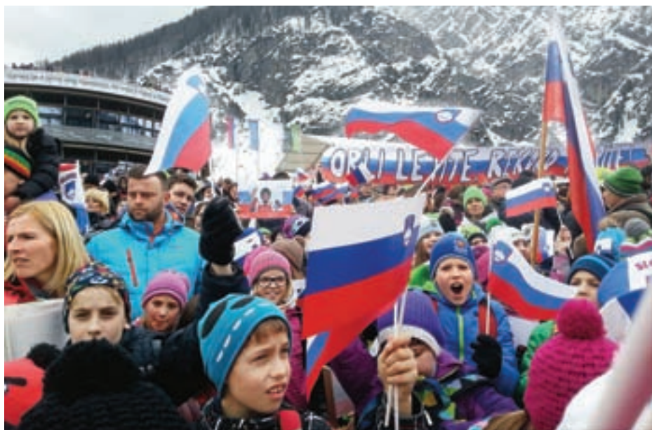
PLANICA 2016 – NAVIJAMO ZA NAŠE ORLE