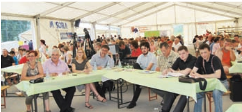
ČLANI STROKOVNE KOMISIJE IN KOMISIJE OBČINSTVA

nje od leta 1980 dalje, od leta 1981 poteka tekmovanje Zlata harmonika v Ljubecni pri Celju, od leta 1985 tekmovanje v Senožečah, od leta 1989 srečanje v Hinjah, od leta 1992 v Besnici pri Kranju, od leta 1992 tekmovanje v Ratežu, od leta 1994 na Babni gori, od leta 1998 srečanje v Brestanici pa tekmovanja harmonikarjev v Zamostecu, Osilnici, Kamniku ob Dnevh narodnih noš, v Senici pri Medvodah ... In še veliko je tekmovanj, kot je na primer Državno tekmovanje za nagrado Cyrilla Demiana. Skratka, tekmovanja in srečanja harmonikarjev v igranju na diatonično harmoniko so postala izredno razširjena in priljubljena glasbena prireditve ter najuspešnejši promotor tako glasbila kot narodno-zabavne glasbe. Žal malo manj ljudske glasbe, ki je, kot kažejo tekmovanja, predvsem za mlajše dokaj trd oreh, predvsem pri interpretaciji. Že več kot tri desetletja pa se nad igranjem na diatonično harmoniko navdušuje veliko število mladih.