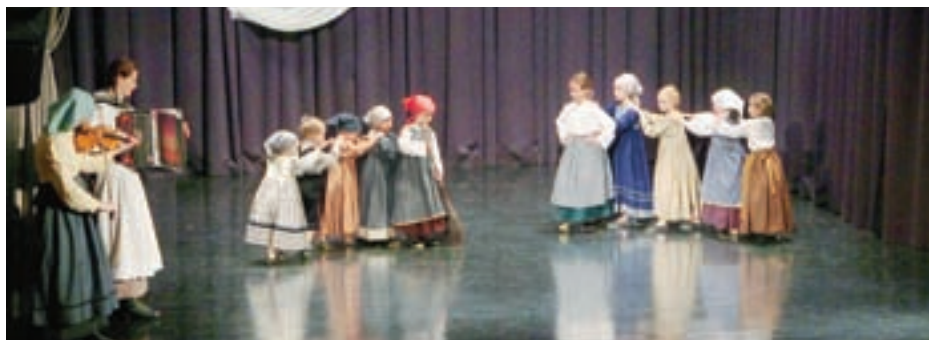
MLAJŠA OTROŠKA FOLKLORNA SKUPINA AJDA – OBMOČNO SREČANJE OTROŠKIH IN ODRASLIH FOLKLORNIH SKUPIN POLKA JE UKAZANA 2016 (KULTURNI CENTER TRŽIČ)

Vsako leto se odzovemo tudi vabilom Mestne občine Kranj k oživljanju starega mestnega jedra. Zato že nekaj let zapored na Maistrovem trgu organiziramo različne kulturne prireditve, kjer Kranjčanom in mimoidočim predstavljamo pestro in raznoliko kulturno dejavnost in tudi kulinariko – domače dobrote, ki jih pripravijo naše gospodinje. Poleg že znanih tradicionalnih prireditev kaže omeniti našo osrednjo kulturno prireditev Kresni večer s praznovanjem slovenske državnosti, ki je vedno na dan godovanja Janeza Krstnika – in tudi letos bo tako. Pri vsem tem ne gre prezreti odličnega sodelovanja s Podružnično šolo Besnica, svetom krajevne skupnosti, župnijo, turistič-