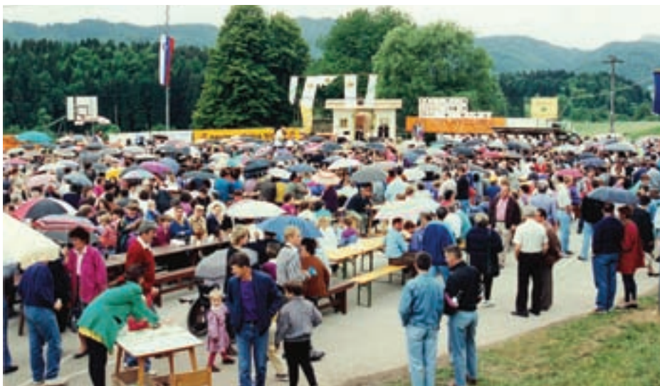
PIREDITEV JE PRVA LETA POTEKALA NA PROSTEM.

Začetki so bili skromni. Tekmovanje je potekalo na igrišču pred šolo v Besnici, oder je bil postavljen na kmečkem gumenem vozu »gumiradel«. Harmonikarji iz širšega območja Gorenjske so tekmovali v petih starostnih skupinah, preostali v skupini Gostje. Ocenjevali sta jih strokovna komi-