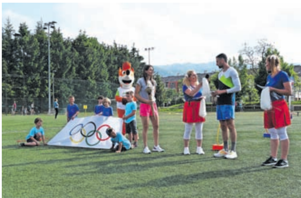
Otroke sta posebej navdušila dva vrhunska športnika, ki sta se jim pridružila, oba nosilca olimpijskih kolajn: plavalka Sara Isaković in biatlonec Jakov Fak.