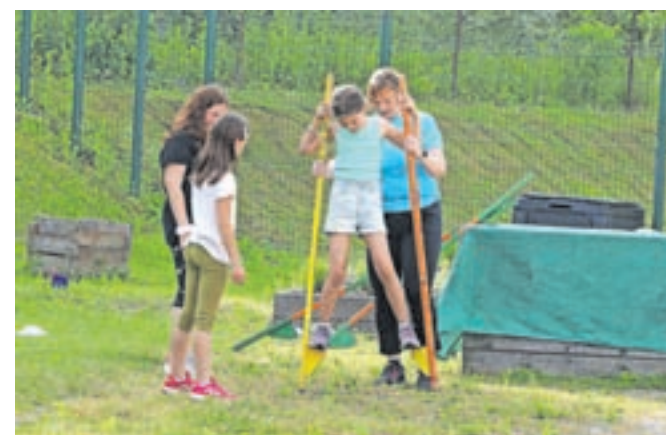
Hoja s hoduljami se je izkazala za precejšen zalogaj, vendar je ob pomoči učiteljic uspelo vsakemu.