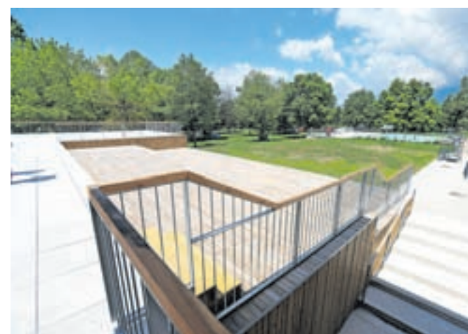
Na mestu nekdanjega vhoda v kopališče je zdaj nova restavracija s teraso.

nega kluba Radovljica Aleš Klement in upravnica kopališča, prav tako nekdanja plavalka Polona Rob. Bobinac je napovedal, da si bo OKS, ki je tudi združenje