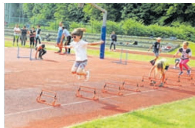
Otroci so izredno uživali v športnih aktivnostih in izrazili, da bi si tovrstnih dogodkov želeli še več.