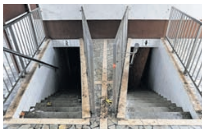
Zanemarjeno zaprto javno stranišče na radovljiški avtobusni postaji bodo zdaj vendarle prenovili.

Kot pojasnjujejo na občinski upravi, so potrebna soglasja za gradnjo že pridobili, zaključuje se izdelava projektna dokumentacije. Nove javne sanitarije naj bi začeli