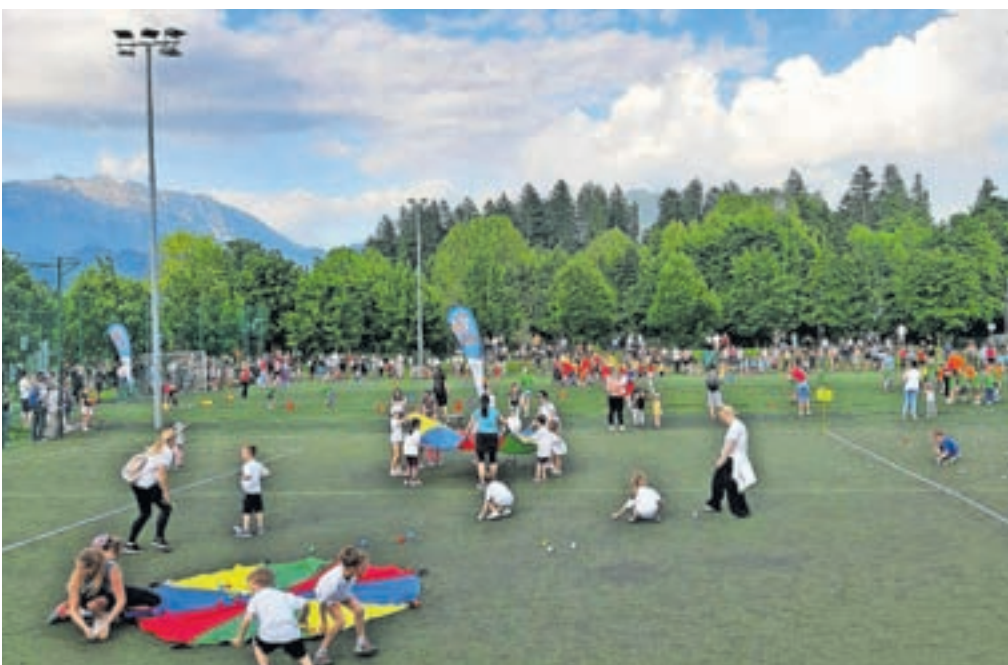
Približno 180 otrok je sodelovalo v različnih športnih panogah, prilagojenih njihovi starosti in sposobnostim.