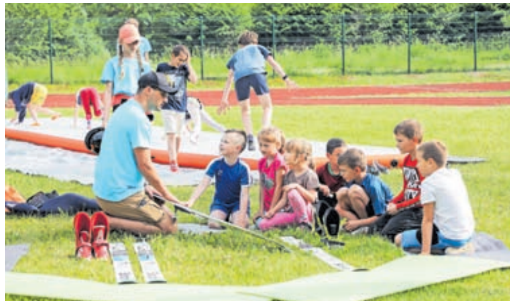
Smučarski skoki so poželi veliko zanimanja, sploh pri najmlajših.

sproščanje, učenje prve pomoči in drugo. Pri sami organizaciji dejavnosti so veliko vlogo igrali tudi zunanji izvajalci, zaradi katerih je šola lahko ponudila tako pester nabor. Sodelovali so: Atletski klub Radovljica, Skakalni klub Triglav Kranj,