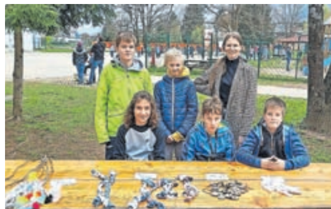
Izdelke, ki so nastali v okviru podjetniškega krožka, so prodajali na nedavni šolski dobrodelni prireditvi Radovljica otrokom.