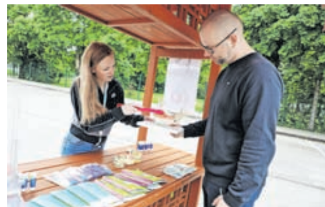
Letos so posebno pozornost posvetili tudi skrbi za ustno zdravje.

Obiskovalce so seznanili z različnimi temami s področja ohranjanja zdravja, npr. s pomenom zaščite kože pred soncem, kar so predstavile dijakinje Srednje šole Jesenice. Študentje so skupaj z referenčnimi sestrami pripravili stojnico na temo visok krvni tlak, predstavilo se je Združenje bolnikov po možganski kapi, Klub Bled. Pozornost so posvetili tudi skrbi za ustno zdravje ter promociji programa Svit za preprečevanje in zgodnje