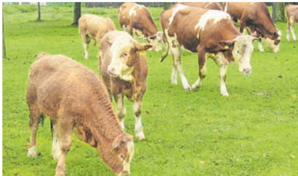
Po podatkih iz zbirnih vlog je v radovljjski občini lani redilo živino samo še 207 kmetij. Slika je simbolična.

Radovljica – »Spremembe nas silijo k nenehnemu prilagajanju. Tudi v kmetijstvu nam ne prizanašajo – od podnebnih in tržnih do ekonomskih. Na Občini Radovljica bi kmetijam radi pomagali pri prilagajanju na te spremembe,« so v vabilo na delavnice zapisali v Ragorju – Razvojni agenciji Zgornje Gorenjske, ki v skladu s predlani sprejetim razvojnim programom Občine Radovljica do leta 2030 v sodelovanju z občino, kmetijsko-gozdarsko zbornico in drugimi deležniki pripravljata strategijo razvoja kmetijstva v občini. V njej bodo prikazali sedanje stanje kmetijstva v občini, opredelili izzive, s katerimi se bodo v prihodnosti morale spoprijeti kmetije, in določili ukrepe in aktivnosti, ki bodo prispevali k ohranjanju in razvoju kmetijstva. Da bi bila strategija čim bolj realna in da bi pomagala reševati težave kmetov, so ob koncu maja na treh lokacijah v občini – v Radovljici, na Brezjah in na Lancovem – pripravili delavnice, na katere so povabili kmete. Na delavnicah so jim najprej predstavili podatke o stanju kmetijstva v občini, rezultate ankete med kmeti in novoustanovljeno lokalno akcijsko skupino BOJA – Zgor-