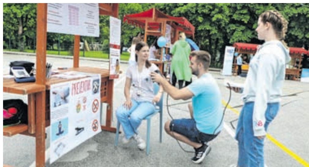
Študentje so skupaj z referenčnimi sestrami pripravili stojnico na temo visok krvni tlak.

kaže notranjost človekovega črevesa. Predstavili so tudi nove preventivne programe, ki jih bodo od jeseni izvajali pod novim imenom Center za krepitev zdravja.