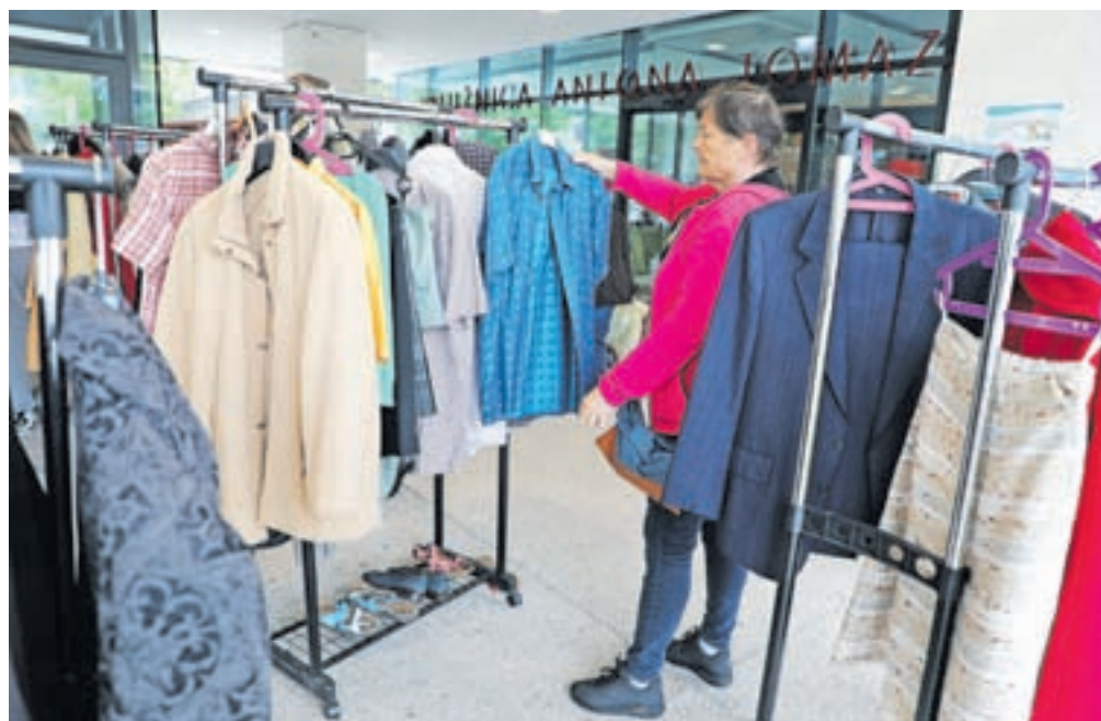
Pestra ponudba lepo ohranjenih oblačil na spomladanski izmenjevalnici, ki so jo tokrat pripravili pred vhodom v radovljiško knjižnico.

Tudi tokrat je bila izmenjevalnica odlično organizirana. Vsi, ki so prinesli oblačila, so jih ob prihodu oddali