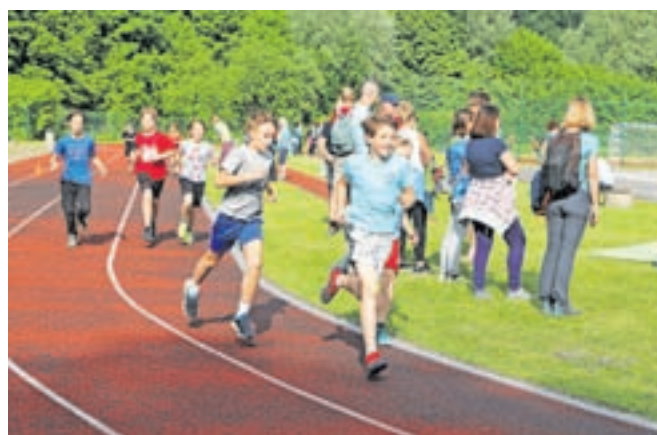
Tek za nekatere velja za pravo muko, ampak tega ni bilo mogoče opaziti v športnem parku ob šoli.