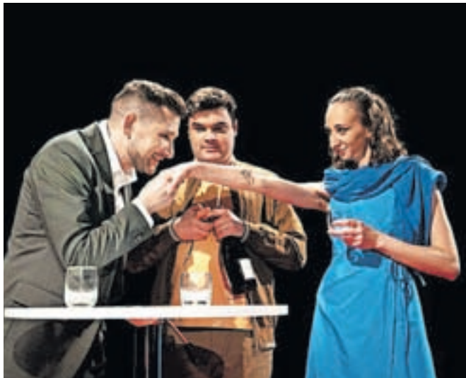
V predstavi Seksualna perverzija iz Šentjakobskega gledališča Ljubljana