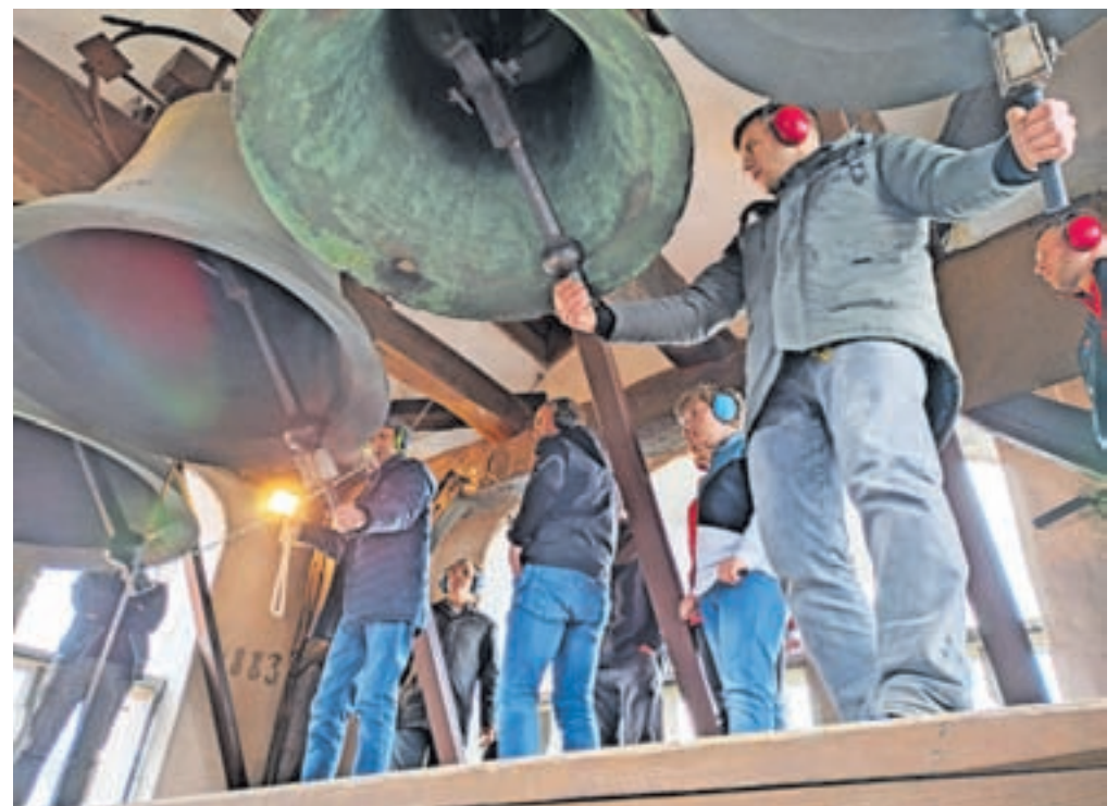
Pitrkovalci so igrali na štiri bronaste zvonove v leškem zvoniku.

Na zvonovih so tudi reliefne podobe svetniških zavetnikov in napisi. Najstarejši od zvonov je srednjemali, ki ga je leta 1758 v Kranju ulil zvonolivar Iohan Christian Rieser, preostale štiri je leta 1997 ulila livarna Perner v nemškem mestu Passau.