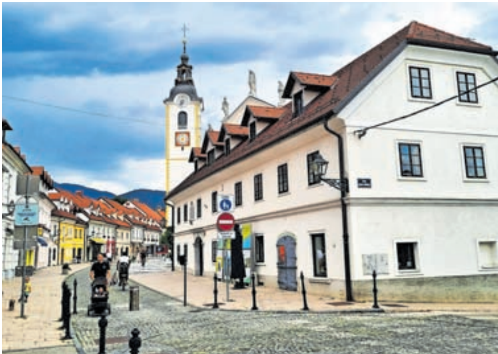
Obisk turistične destinacije Kamnik je bil v poletnem trimesečju letošnjega leta za dobrih 23 odstotkov manjši kot v enakem obdobju lani. / FOTO: ALENKA BRUN

Tudi podatki za prvih osem mesecev nakazujejo na upad turistov. Kamnik je namreč v prvih osmih mesecih tega leta obiskalo 23.462 turistov (lani v istem obdobju 28.743), od tega 6177 domačih (lani 10.580) in 17.285 tujih turistov (lani 18.163). Po številu prihodov je bilo največ turistov iz Hrvaške, Nemčije, Češke, Italije, Francije, Nizozemske, Belgije, Madžarske, Avstrije, Poljske, Bolgarije in Izraela. Podatki kažejo, da je v prvih osmih mesecih pri kamniških namestitvenikih prenočilo skupaj 57.638 turistov (lani 72.234), od tega 13.607 domačih (lani 27.192) in 44.031 tujih turistov (lani 45.042). Na Kamniškem najpogosteje prespijo turisti iz Češke, Nemčije, Hrvaške, Italije, Nizozemske, Francije, Madžarske, Izraela, Bel-