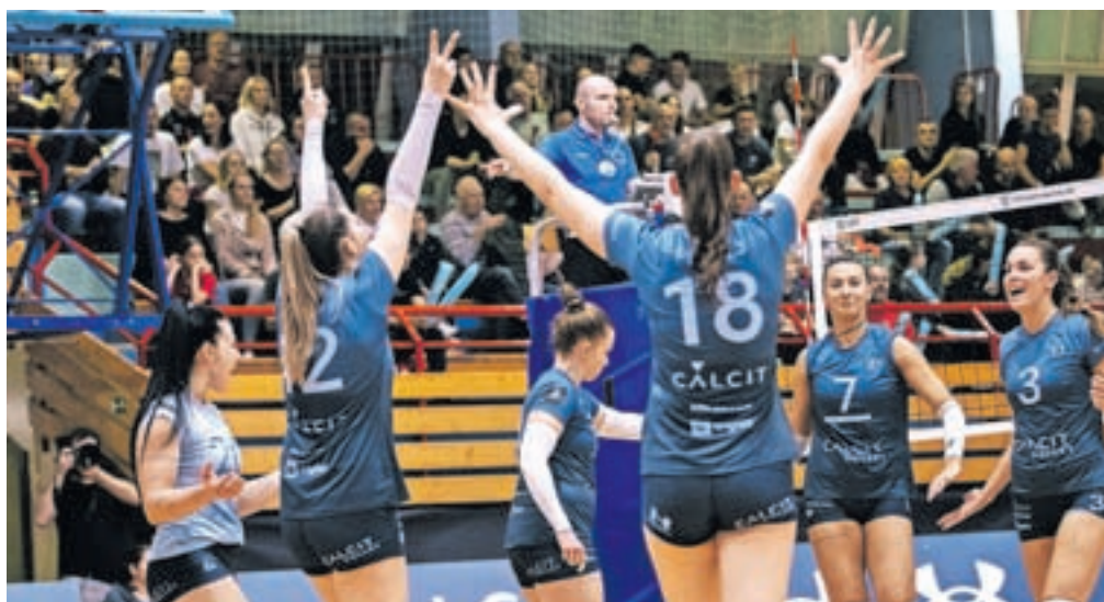
Odbojkarice Calcita Volleyja