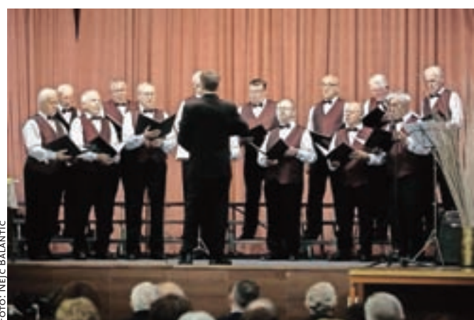
Štideset let nastopanja: Moški pevski zbor DU Trzič