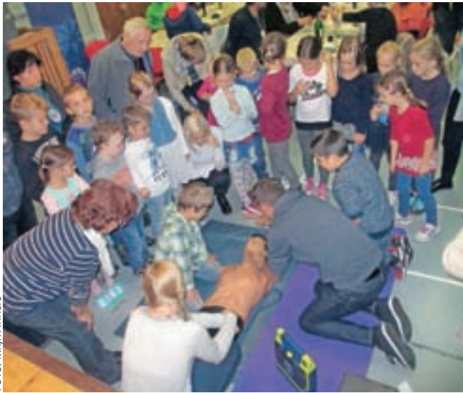
Udeleženci delavnice oživljanja ponesrečenca oz. bolnika