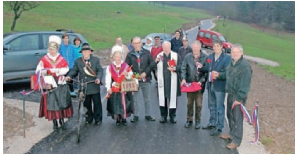
Slavnostni trak na cesti Kovor–Brdo je prerezalo tudi nekaj lastnikov zemljišč, ki so odstopili del zemlje za ureditev cestišča.