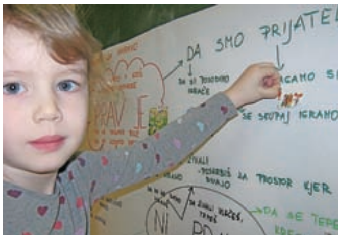
Svoje znanje in izkušnje smo v skupini Gosenice strnili v otroški plakat, ki smo ga poslali na društvo Jasa v Ljubljani.