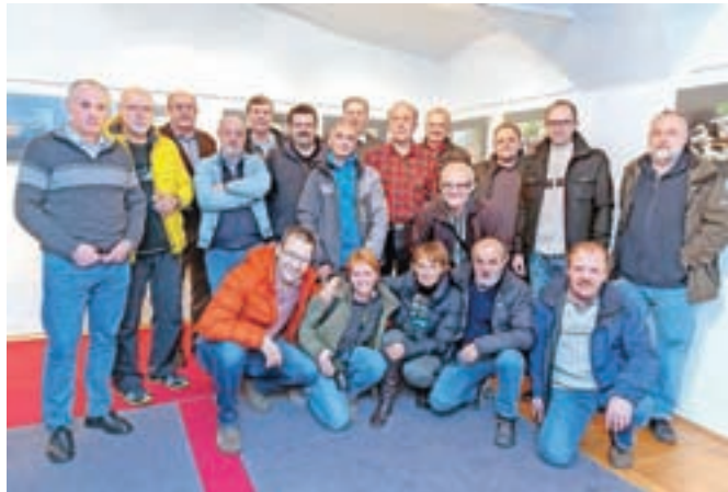
Članice in člani Foto kluba Tržič se v Atriju predstavljajo s podobami domačega kraja.

lov Tržiški utrinki. Serija petindvajsetih izbranih fotografij predstavlja ujete podobe realnosti vsakdanjega življenja, predmestnega in mestnega sveta, ki jih pogosto spregledamo, kasneje pa se mnogokrat izkaže, da se novoodkrite situacije s svojo presenetljivostjo predstavijo kot izjemni posnetki. V objektiv ujete trenutki izpričujejo, da člani, vsak na svoj način, ostajajo zvesti načelom lepote vizualne podobe, dovršeni fotografski tehniki in izostrenemu občutku za čas in prostor.