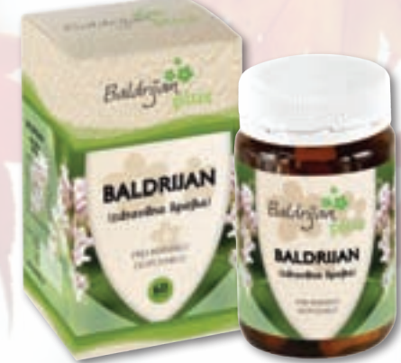
60 kapsul • 18,30 €