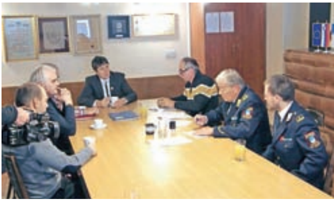
Pogodbo so podpisali v občinskih prostorih.