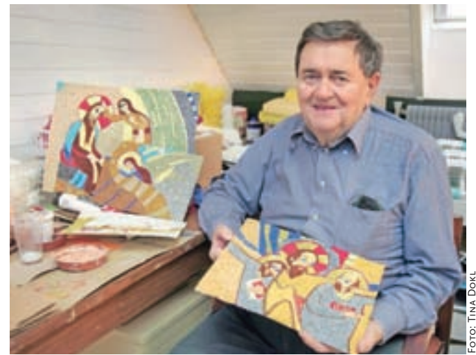
Franc Oman ustvarja mozaike po motivih Marka Rupnika.