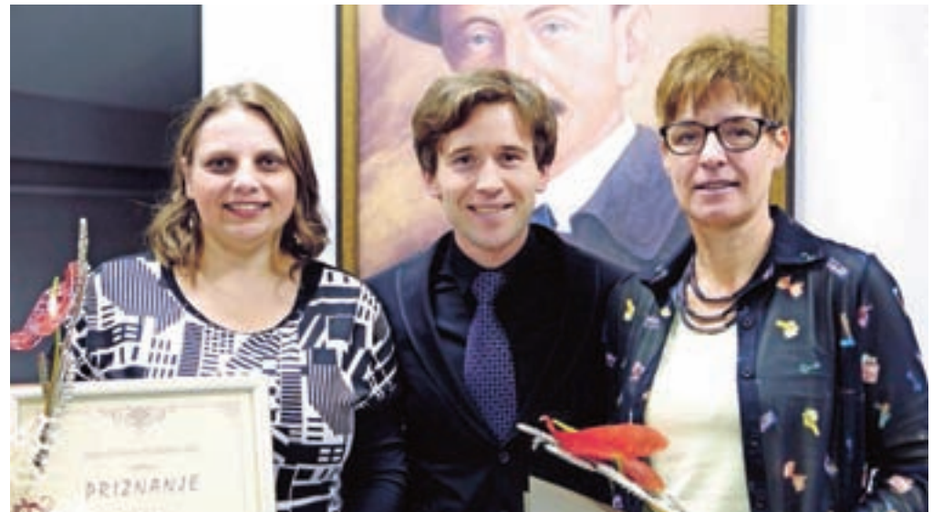
Letošnji prejemniki Kurnikovih priznanj in plaket

Bronasto plaketo za dolgoletno vsestransko delo na področju tržiške ljubiteljske kulture je prejela Helena