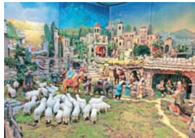
Tekčeve jaslice v živo v galeriji družine Ribnikar. V jaslicah so nekatere figure gibljive.