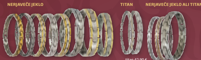
nerjaveče jeklo 33,50 € nerjaveče jeklo + pozlata 36,60 € titan 42,90 € titan + pozlata 46,20 €