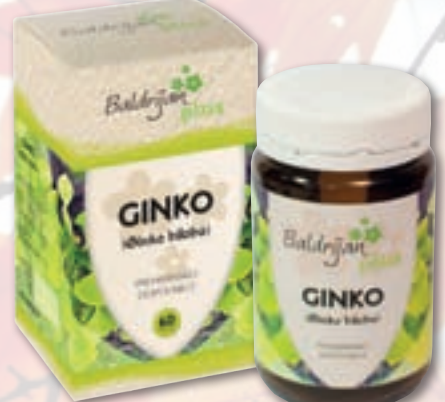
60 kapsul • 16,90 €