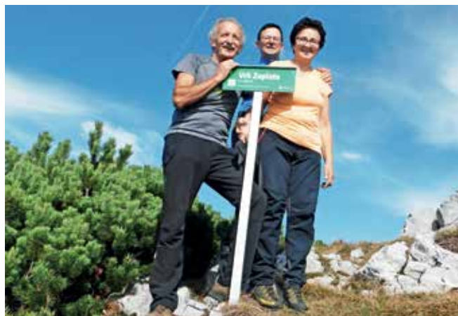
Postavitev tabel