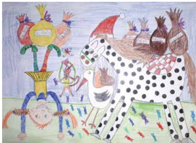
Manca Jovanovič, 5. b