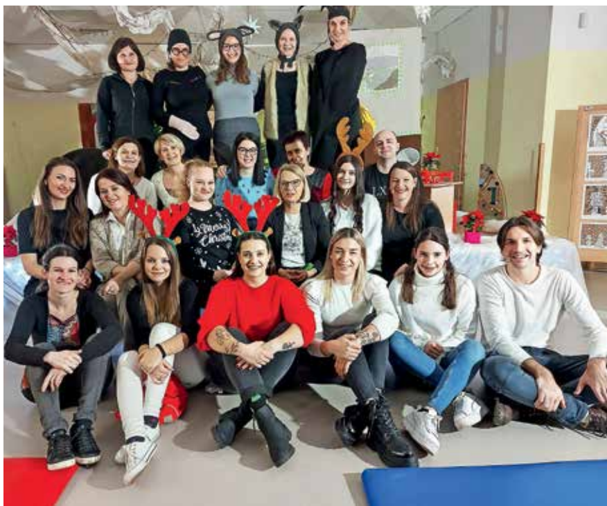
Skupinska fotografija ustvarjalcev glasbene pravljice

V novem letu vam želimo mnogo drobnih pozornosti, toplih objemov, zašepetanih zahval in otroških poljubov. Naj bo prihajajoče leto čarobno, kot so čarobni otroci. Kolektivi vrtcev Storžek, Čriček, Palček in Bibe