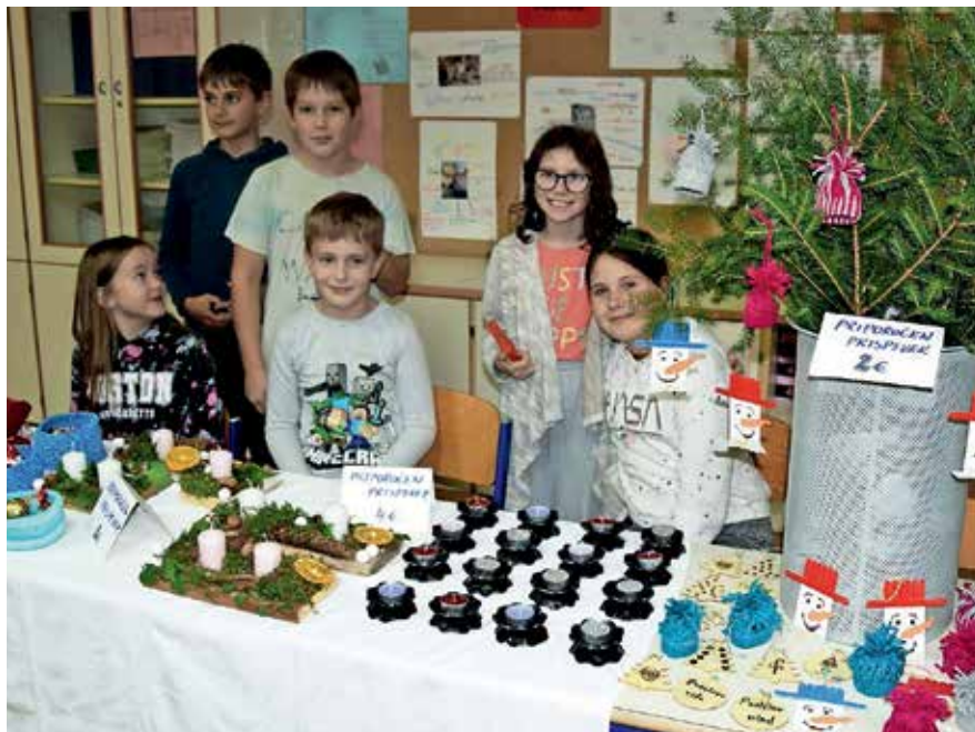
Vzdušje na božično-novoletni tržnici je bilo odlično.

Vsem sodelujočim se iskreno zahvaljujemo za trud, obiskovalcem pa