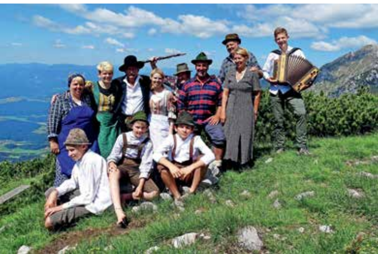
Nastop na vrhu Zaplate