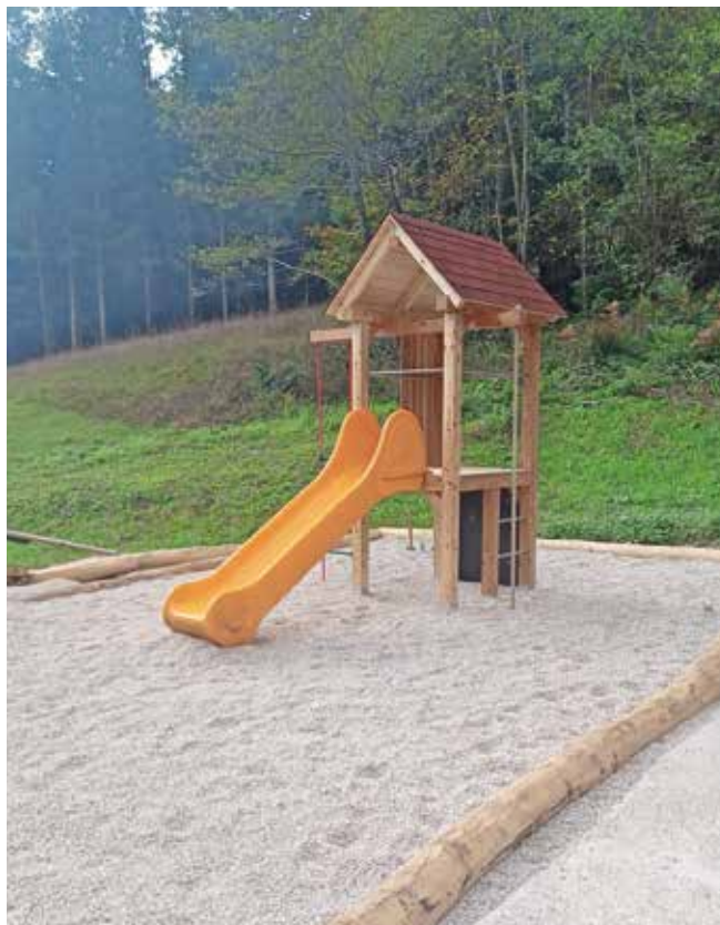
Nova igrala

Rdeči križ Bašelj je preživel še eno uspešno leto in zahvala za to gre Turističnemu društvu Bašelj, ki vedno aktivno in finančno podpira naše akcije, našim prostovoljcem in vsem vam, ki redno plačujete članarino in donacije za našo vas. Letošnje pomembnejše dejavnosti so bile udeležba in pomoč pri dveh krvodajalskih akcijah, priprava srečanja za krajanke, starejše od 80 let, pomoč v domu za starejše, organizacija konca tedna za mlade, obdarovanje starejših krajanov, priprava tečaja prve pomoči in uporabe defibrilatorja, vzdrževanje defibrilatorja. Ob vstopu v novo leto pa vam želimo obilo zdravja in sreče, kadar pa ne gre vse po načrtih, vedite, da nikdar niste sami, in se obrnite na nas. Skupaj bomo našli rešitev. Aleksandra Zibelnik Badii