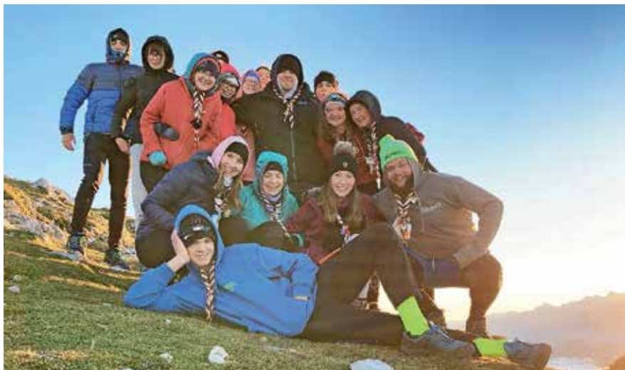
Ob sončnem vzhodu ... / Foto: arhiv Viharnih kavk

Kot uradni državni nosilci smo decembra z Dunaja prinesli luč miru iz