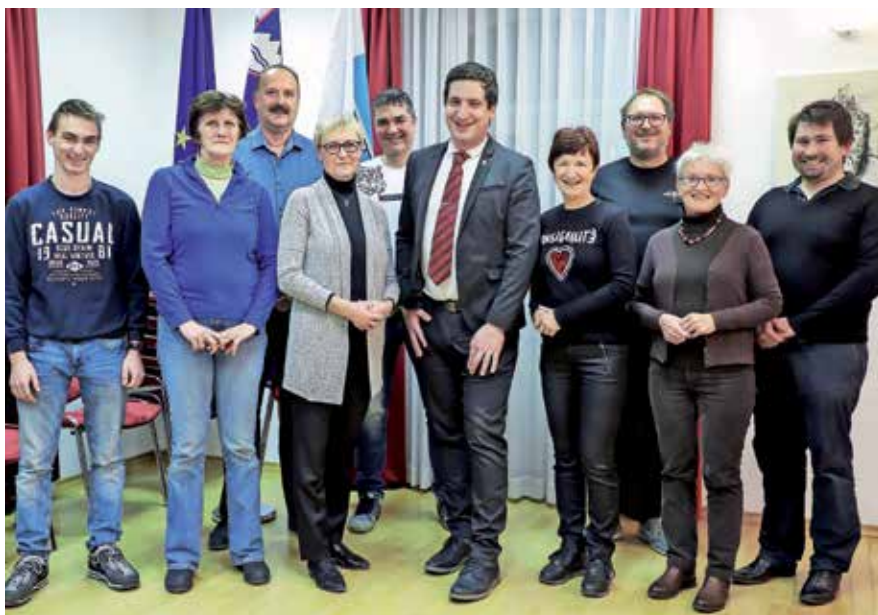
Prisotni na prvi, ustanovni seji