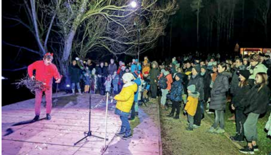
Peklenšček pripoveduje zgodbo o Hudičevem borštu.

Sicer tradicionalni potop božičnega drevesca v jezero Črnava v Preddvoru so letos pripravili malo drugače. Niso ga potopili na jezersko dno, temveč je ob soju bakel zažarelo v lučke odeto drevesce na jezerski gladini – o čemer pripoveduje tudi naslovna fotografija-