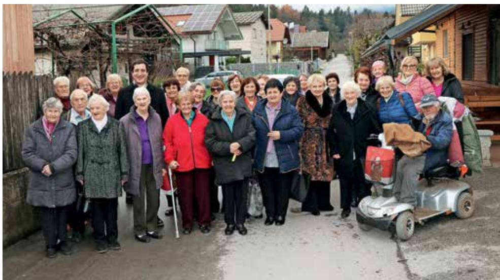
Srečanje preddvorskih občanov, ki so stari devetdeset let in več, je minilo v prijetnem vzdušju. Na skupinski fotografiji so se jim pridružili župan, pevke in nekaj spremljevalcev.