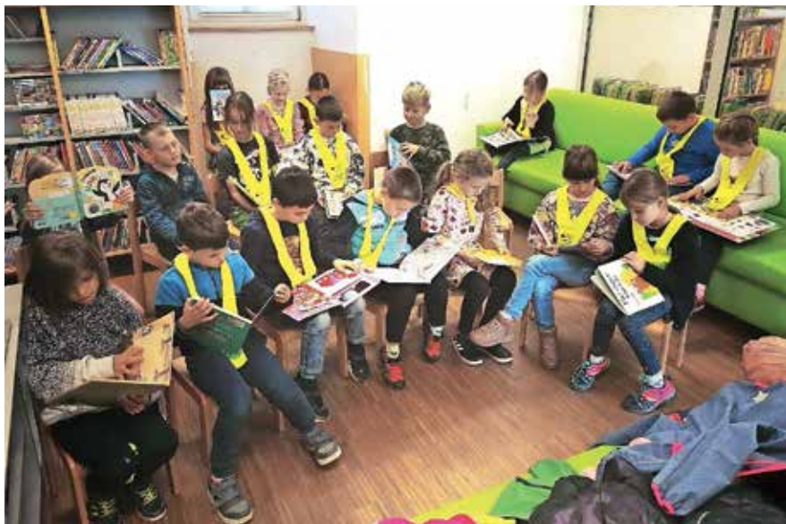
2. b Osnovne šole Matije Valjavca Preddvor na obisku knjižnice

V jesenskih mesecih so se tako v prostorih Krajevne knjižnice Preddvor začele nekatere pri uporabnikih zelo priljubljene aktivnosti. Od 8. oktobra dalje so vsako soboto ob 10. uri na sporedu pravljíčne urice, ki jim sledi ustvarjalna delavnica. Še posebno živahno je bilo v sredini oktobra, ko so nas obiskali animatorji iz Centra za trajnostni razvoj podeželja Kranj. Otroci in starši so izvedeli marsikaj novega in koristnega o začimbah in zeliščih, preizkušali zeliščne bom-