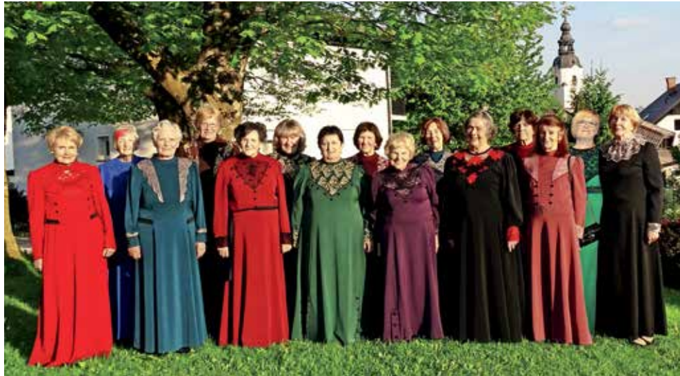
ŽPZ Josipine Turnograjske DU Preddvor

Ime nosimo po naši domačinki Josipini Urbančič Turnograjski, ki se je rodila leta 1833 na gradu Turn. Bila je prva slovenska pesnica, pisateljica in skladateljica. To ime smo si nadele ob deseti obletnici delovanja zbora.