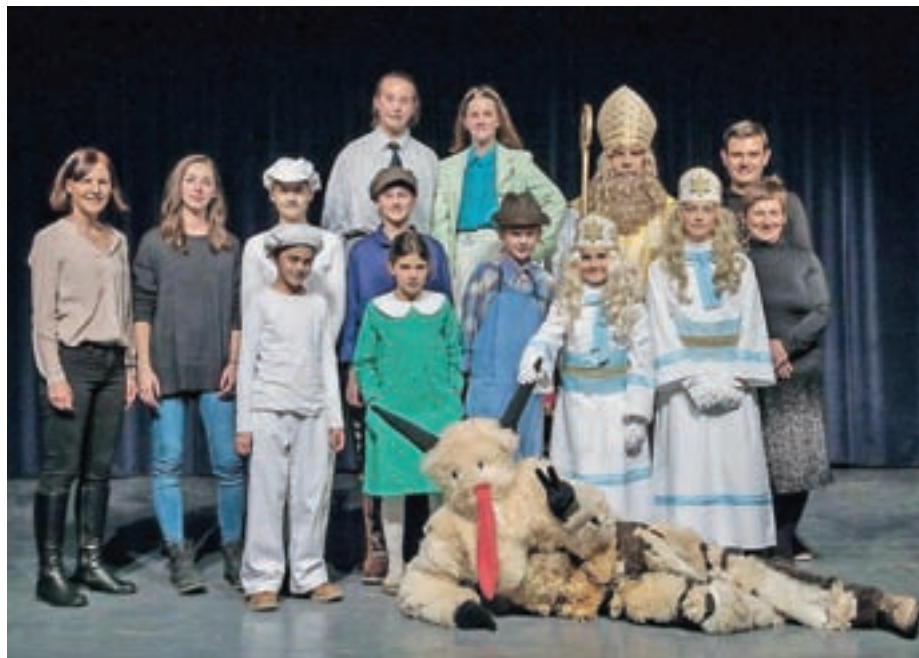
Miklavž in otroška predstava