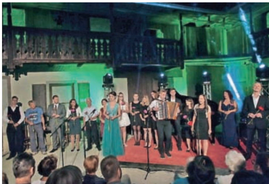
Poletni koncert Pa se sliš'

Največji kulturni dogodek letošnjega leta je bil poletni koncert Pa se sliš'. Že nekaj let je zorela ideja, da bi v čudovitem ambientu župnijskega posestva pod zvezdnatim nebom predstavili naše znane krajane. Tiste, ki živijo z glasbo in za glasbo, ter tiste, ki jim je glasba velik hobi. Ideja je dozorela in v toplem avgu-