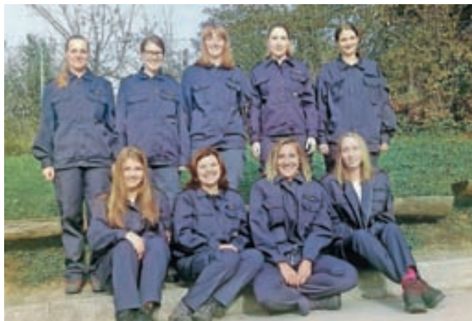
Na državno tekmovanje so se uvrstile članice A...

Ob nešteto dejavnostih v domačem kraju so bili gasilci PGD Predoslje uspešni tudi na tekmovanjih.