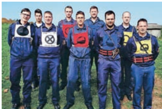
... in člani A.

Mesec oktober so člani Prostovoljnega gasilskega društva Predoslje (PGD) posvetili požarni preventivi in obveščanju krajanov o nevarnostih požara. Poleg vseh dejavnosti, ki jih opravljajo v vasi Predoslje, so namenili posebno pozornost pregledu hidrantnega omrežja, očistili dostope do vodnih virov ter v sodelovanju z Gasilsko reševalno službo Kranj organizirali pregled gasilnikov za gospodinjstva. Pripravili so tudi dan odprtih vrat, kjer so si lahko vsi krajanje ogledali prikaz uporabe gasilnika, gasilski dom in prenovljeno orodnišče.