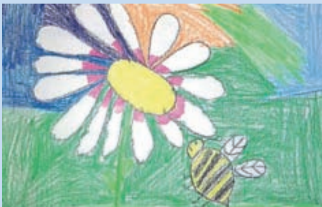
Tinkara Jezeršek, 1. r.

Naša šola se je v letošnjem šolskem letu prijavila v projekt »šolska shema« Evropske unije. Cilji šolske sheme so: povečanje uživanja zelenjave, sadja in mleka ter mlečnih izdelkov, povečanje porabe sadja in zelenjave lokalnih pridelovalcev ter ozaveščenost o kmetijstvu in prehrani. V osnovni šoli imamo učenci poleg šolske malice na voljo še brezplačen dodaten obrok sadja in zelenjave oziroma mleka in mlečnih izdelkov. Z izvajanjem šolske sheme smo začeli v sredo, 4. oktobra. Dodaten obrok sadja in zelenjave bomo imeli na voljo enkrat na teden ob sredah, razdeljevanje mleka in mlečnih izdelkov pa bo potekalo enkrat na 14 dni ob ponedeljkih. To bo označeno tudi na jedilniku. Dodatni obroki nam bodo na voljo od šolske malice naprej v jedilnici; lahko jih bomo vzeli tudi v času rekreativnih odmorov in jih pojedli v jedilnici. Zdi se mi pomembno, kakšno hrano jemo. Pomembno je, da pojedemo dovolj sadja, zelenjave in tudi mleka in mlečnih izdelkov, seveda od lokalnih pridelovalcev. Upam, da bomo s projektom šolske sheme nadaljevali še v prihodnjih letih. Jejmo zdravo in spoštujmo hrano! Ema Rozman