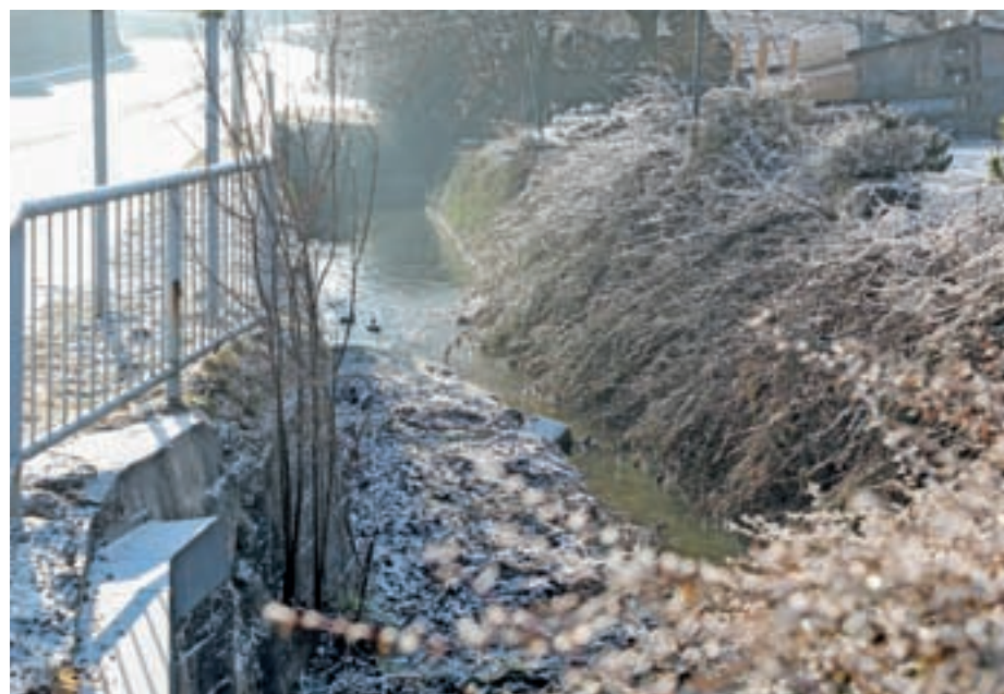
V letu 2016 je bila pretočnost potoka Belca praktično 100-odstotna vse leto, letos pa je bila struga v delu Predoselj suha približno četrtino leta.

Z zagotavljanjem dobre pretočnosti se lahko v veliki meri izognemo presuševanju struge. S planirano izgradnjo kanalizacijskega omrežja se bomo znebili nemalokrat neznosnega vonja po fekalijah, ki so žal še vedno prisotne in smo za njihov izpust v prvi vrsti krivi sami. Vse krajanje naprošamo, da sami naredijo, kar je v njihovi moči, za dobrobit potoka, predvsem pa v sušnih obdobjih ne izrabljajo potoka za lastno korist, vsaj v tolikšni meri, da zagotovimo normalno pretočnost skozi obe vasi Suha in Predoslje. KS Predoslje