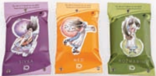
Almir in Gabrijela Sefič: naravna mila

in tudi odmrta koža se ne nabira na petah. Pletem jih vsaj že 15 let, ker jih sama tudi rada nosim.« Pod znamko Lisica & Volk ustvarja Anja Pitamic, po poklicu grafična oblikovalka, po srcu ljubiteljica narave. »Tako nastaja lesen nakit, ki ga navdihuje lepota narave. Navdih za živalske in rastlinske motive je slovenska avtohtona flora in favna, tudi ljudski motivi in simbolika najdejo mesto na izdelki,« je povedala. In ravno čudovit alpski svet Zgornjesavske doline je bil navdih za izdelke, ki so prejeli certifikat kakovosti: Triglavska roža, Planika, Gorenjski nagelj in broška ruševac. »Vsak izdelek je ustvarjen z ljubeznijo, pozornostjo do detajlov, z naravnimi materiali in skrbjo za naše okolje.«