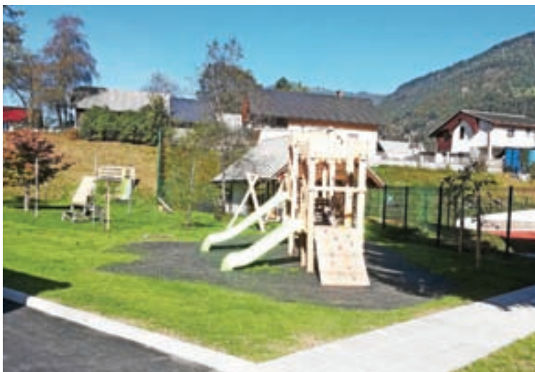
Igrala so iz ekoloških materialov