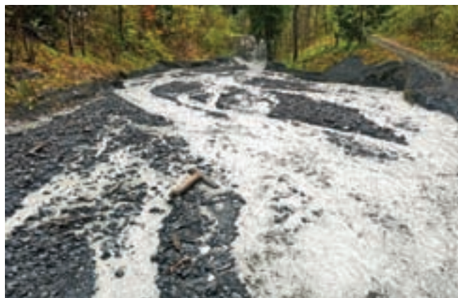
Odvažali so naplavine in očistili zaplavni pregradi v Suheljnu nad Podkorenem, ki sta bili kritično polni.

Štab CZ Občine Kranjska Gora in gasilci GZ Kranjska Gora so bili znova v polni pripravljenosti ob napovedanem obilnem deževju in vetru v četrtek, 2. novembra. »Že v popoldanskih urah smo s pomočjo gradbene mehanizacije podjetja Ažman odvažali naplavine in očistili tudi zaplavni pregradi v Suheljnu nad Podkorenem, ki sta bili kritično polni. Na Borovški cesti v Kranjski Gori je voda ogrožala hišo. S pomočjo mehanizacije Komunale Kranjska Gora smo preusmerili hudourniško strugo, gasilci so s protiplo-