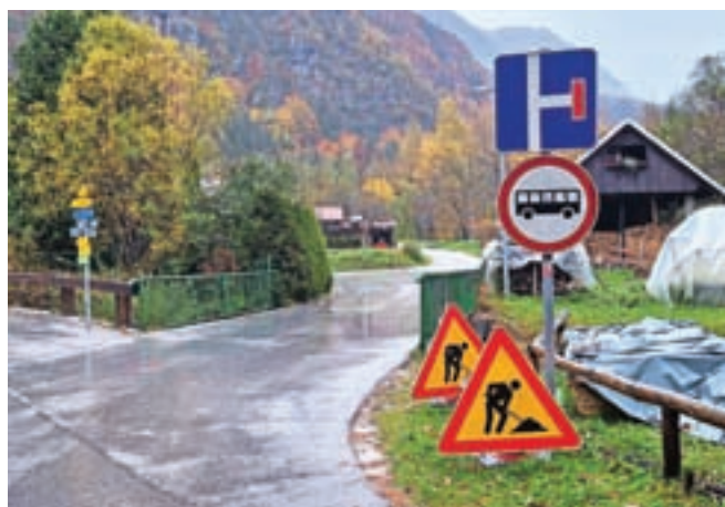
Most Korzika v Gozdu - Martuljku čistijo, izdelali bodo tudi opaže za robni venec.