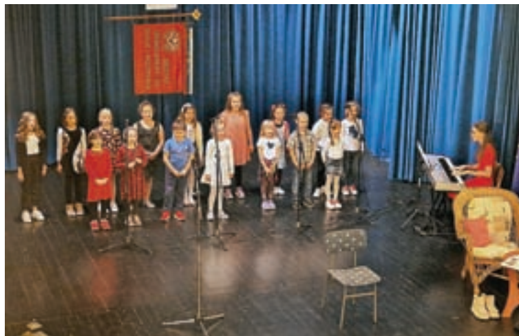
Otroški pevski zbor Osnovne šole 16. decembra Mojstrana