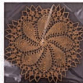
Jožica Kupljenik: pleteni prtički