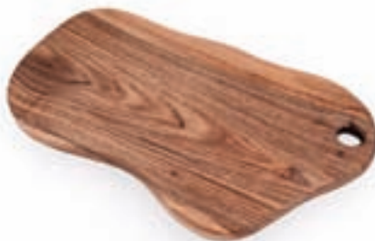
Tania in Klemen Košir: lesena deska