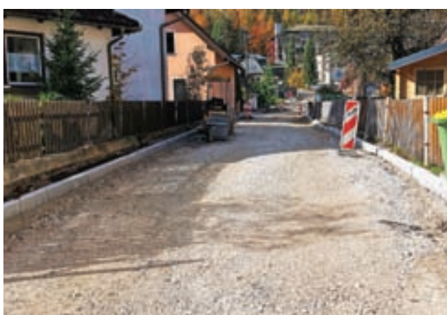
Na Vitranški ulici v Kranjski Gori so zaključili obnovo vodovoda in že polagajo robnike ter pripravljajo podlago za asfalt.