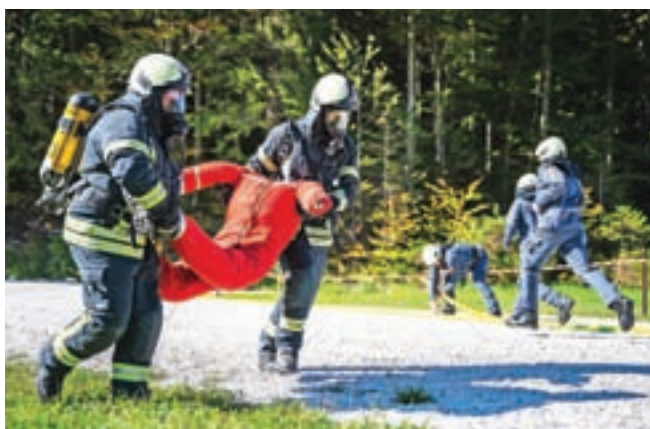
Tekmovalne taktične vaje so se udeležili člani iz vseh prostovoljnih gasilskih društev GZ Kranjska Gora.