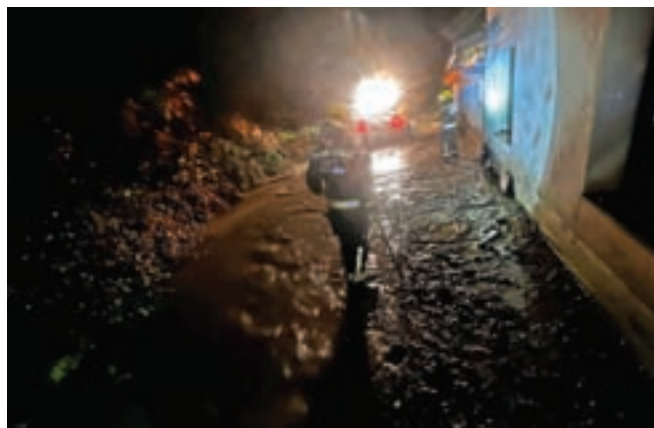
V Kranjski Gori je voda ogrožala hišo.

plavnimi vrečami dodatno zaščitili ta stanovanjski objekt. Občinski štab CZ in gasilci GZ Kranjska Gora so bili na intervencijah s četrтка popoldne na petek vse do štirih zjutraj.« Za konec tedna so bile napovedane vnovične obilnejše padavine, upamo le, da niso povzročile dodatne škode (redakcija Zgornjesavca smo zaključili v petek dopoldne). Omejen je bil tudi cestni promet Hrušica–Mojstrana, kjer je upravljavec državne ceste postavil signalizacijo in omejil hitrost. Lavtižar je opozoril, da na tem območju ob vsakem večjem deževju plazi, in pozval k trajni sanaciji plazov. Konec tedna je bil zaradi plazov na avstrijski strani zaprt tudi prelaz Korensko sedlo.