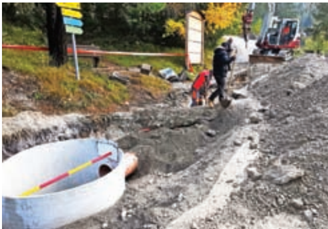
V Naselju Ivana Krivca v Jasni občina ureja meteorno kanalizacijo.

Pregledali smo nekaj aktualnih investicij po občini Kranjska Gora v tem času.