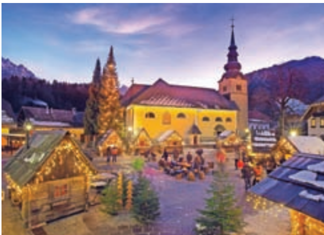
Kmalu znova praznična Alpska vasica