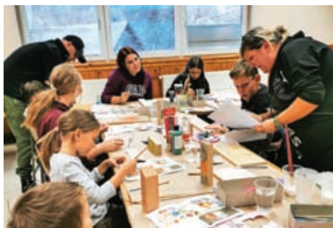
Z ustvarjalnico nazaj k naravi