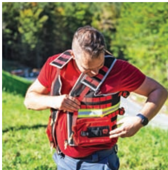
Brezrokavniki imajo veliko žepkov za opremo prve pomoči.

Prvi posredovalci so z novimi brezrokavniki tudi bolj prepoznavni, je prepričan Cuznar, ki je ob tem opozoril tudi na defibrilatorje, ki so nameščeni po občini in so v primeru zastoja srca za hitro pomoč dosegljivi 24 ur na dan. S tem poziva prav vsakogar, naj pomaga sočloveku, ko je to potrebno. »Najslabše je, če nič ne naredite.«