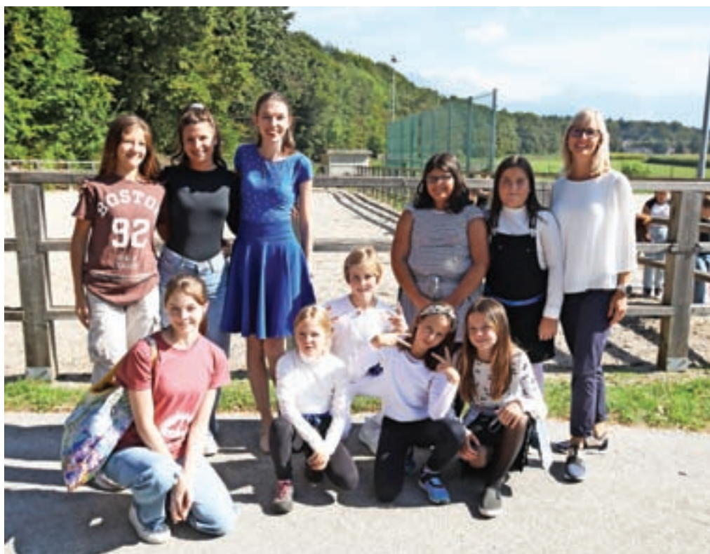
Učenci Osnovne šole 16. decembra Mojstrana na srečanju Unesco šol v Naklem