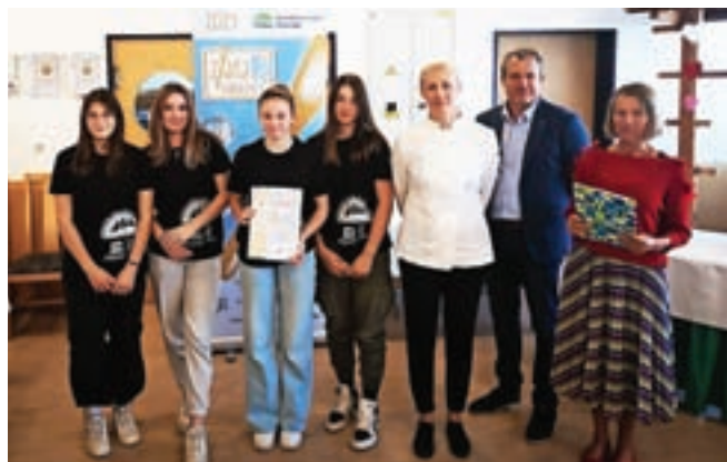
Prikuhale so si zlato priznanje.

Kot je pozval poveljnik CZ Občine Kranjska Gora: »Občanom priporočam, da ob napovedanih ujmah pravočasno samozaščitno ravnajo in s tem razbremenijo tudi intervencijske službe. To pomeni, da očistijo okolico svojih hiš, manjše vodne prepuste, še posebno jeseni, ko je veliko listja, da voda lahko odteče.«