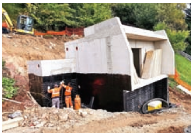
Na vodohranu Srednji Vrh izvajajo hidroizolacijo in zasip objekta.