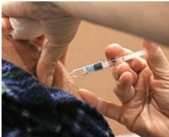
Naročanje na cepljenje proti covidu-19 in sezonski gripi v Zdravstvenem domu Jesenice ni potrebno.

V novembru so termini za cepljenje proti sezonski gripi in covidu-19 tudi v Zdravstvenem domu (ZD) Jesenice. Proti covidu-19 imajo na voljo cepivo Comirnaty OMICRON XBB.1.5. Če želite zaščito s katerim od drugih vrst cepiv proti covidu-19, jim to pravočasno sporočite, da bodo lahko poskrbeli za dobavo. V ZD Jesenice bodo cepili v četrtek, 9. novembra, 16. novembra in 23. novembra, vsakič od 14. do 18. ure. S seboj prinesite cepilni kartonček, zdravstveno kartico in osebni dokument. Naročanje na cepljenje proti covidu-19 in sezonski gripi v ZD Jesenice ni potrebno. Otroci med 12. in 15. letom starosti se cepljenja udeležijo v spremstvu staršev. Cepljenje otrok proti covidu-19 med 6. mesecem in 12. letom starosti poteka na Pediatrični kliniki Ljubljana, naročanje poteka vsak ponedeljek dopoldan na številko 01/522-46-28. Za nepokretne je še vedno možno cepljenje s strani Patronažne službe (dogovor z osebnim zdravnikom).