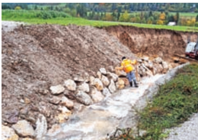
Urejajo strugo Dovškega potoka.