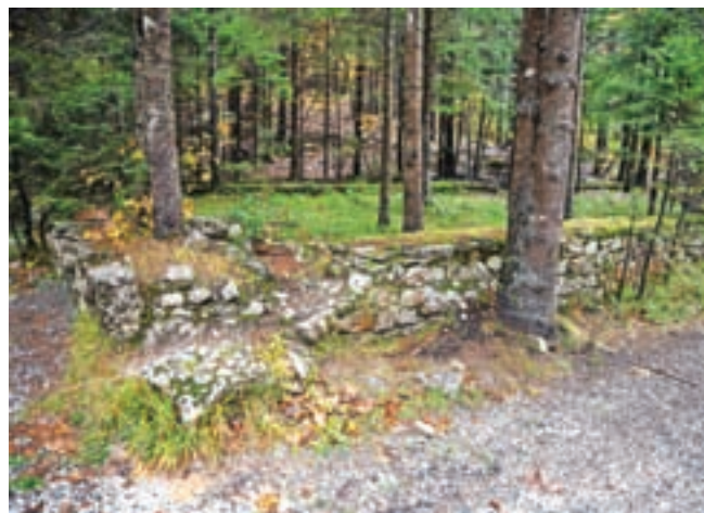
Taborišče ruskih vojnih ujetnikov, ki so med prvo svetovno vojno gradili cesto čez Vršič, in spodnja nakladalna postaja tovarne žičnice sta bila na levem bregu potoka Pišnica, severno od planine Mali Tamar.

V občini Kranjska Gora so začeli evidentiranje in pripravo predloga označevanja kulturnih spomenikov lokalnega pomena, po pooblastilu županje evidentiranje od 23. oktobra do 30. novembra 2023 izvaja fotograf Nik Bertoncelj. Podlaga za to je Pravilnik o označevanju kulturnih spomenikov, objavljen v Uradnem listu RS (št. 94/2021), ki določa način označevanja nepremičnih kulturnih spomenikov in objektov, v katerih so shranjeni premični kulturni spomeniki. Spomeniki lokalnega pomena, ki niso označeni v skladu s Pravilnikom o označevanju nepremičnih kulturnih spomenikov (Uradni list RS, št. 57/11), se morajo označiti do konca leta 2024 in se financirajo iz proračuna občine, ki je posamezno razglasitev sprejela. S. K.