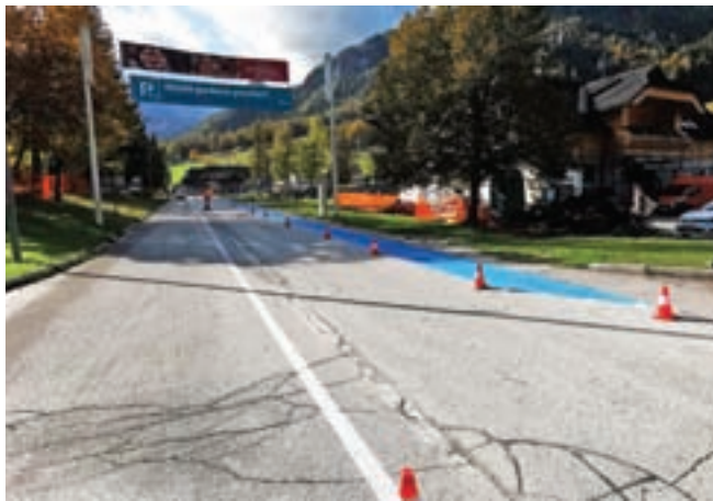
Končan je hodnik za pešce mimo Policijske postaje v Kranjski Gori, v tem delu bo dodan še napis Cona 30.