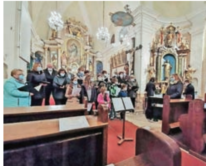
Koncert sta oblikovala Cerkevni mešani pevski zbor Sveti Mihael in Otroški pevski zbor Mladi upi.

"Začutili smo, da smo sicer maloštevilne gledalce nav-