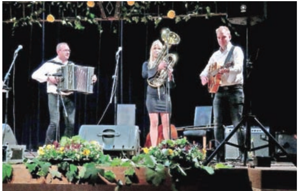
Navdušil je tudi Trio Denisa Novata.

Hišni ansambel Avsenik je znova dokazal, da gre za uveljavljen ansambel z dol-