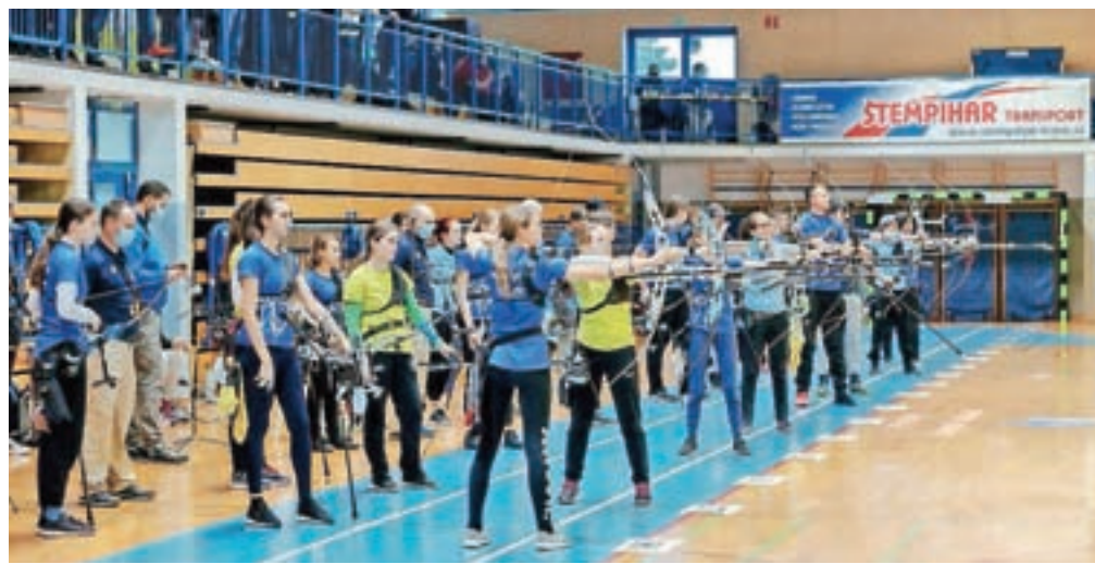
Lokostrelci so se pomerili v Šenčurju.

Šenčur – Lokostrelski klub Šenčur je v sodelovanju z Lokostrelsko zvezo Slovenije konec novembra organiziral državno prvenstvo v dvoranskem tarčnem lokostrelstvu, ki je štel tudi za svetovno dvoransko serijo (IWS). Kljub omejitvam zaradi epidemije se je tekmovanja v športni dvorani v Šenčurju udeležilo 181 tekmovalcev. "Domačih tekmovalcev je letos deset, kar je nekaj manj kot prejšnja leta, ko je na domačih tekmah sodelovalo tudi dvajset ali trideset naših članov. Poleg tega, da se kakšen od članov kluba tekmovanju odreče zaradi organizacijskega dela, je največji razlog za manjšo domačo udeležbo epidemija, zaradi katere opažamo upad zanimanja predvsem