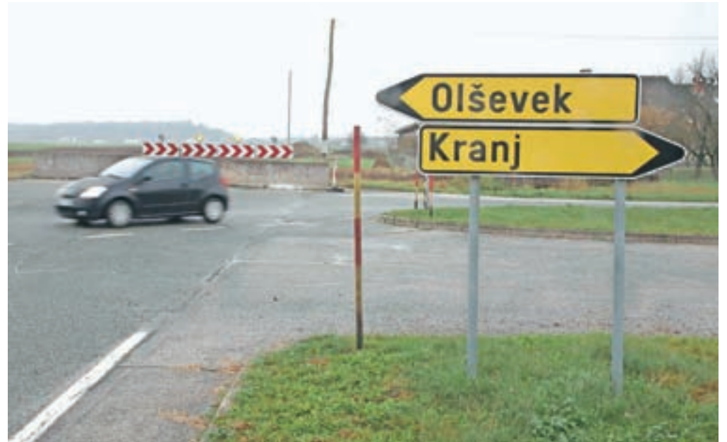
Nedokončan odsek bodo začeli graditi v prihodnjem letu.

Investicija, ki jo v celoti financira država, je ocenjena na 5,3 milijona evrov. Gradnja se bo začela predvidoma takoj po končanem postopku za izbiro izvajalca del, predvidoma spomladi prihodnje leto. Čeprav gre za državno investicijo, pa so bili v postopke ves čas vključeni tudi predstavniki lokalne skupnosti, na čelu z Občino Šenčur. »Z župani okoliških občin smo se trudili, da bi pridobili čim več manjkajočih soglasij lastnikov zemljišč, in si ves čas prizadevali za čimprejšnji začetek projekta,« je pove-