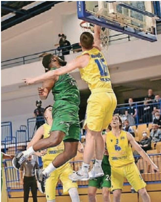
Članska ekipa (v rumenih dresih) nastopa odlično.

"V zahvalo smo se odločili, da vsem občanom omogočimo ogled košarkarske tekme prve slovenske lige, s kuponom za brezplačni ogled tekme (ob izpolnjevanju pogoja PCT), ki ga najdete na tej strani," še doda-