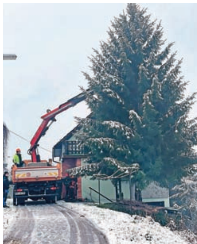
Podiranje smreke na Prebačevem