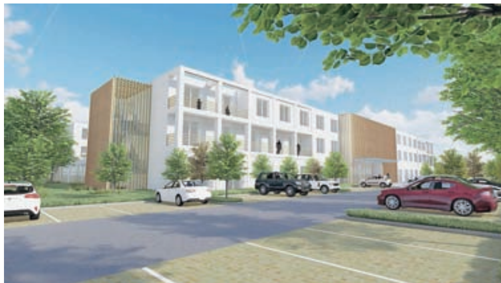
V Šenčurju bodo zgradili sodoben dom starostnikov.