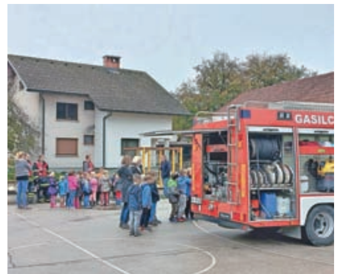
Gasilci na obisku

Učenci so si v mehurčkih po skupinah lahko ogledovali različne postaje, ki so jih zanje pripravili gasilci: prikaz gasilske opreme in tehnike, ki služi za gašenje požarov, pri poplavih in reševanju po potresu; na ogled so bili tudi gasilski avtomobili.