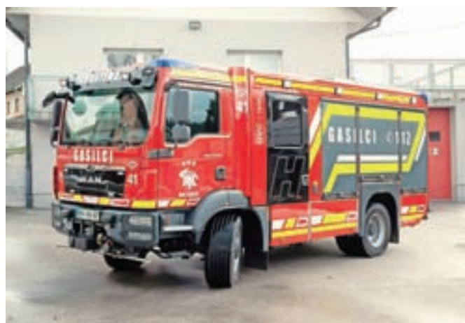
Novo gasilsko vozilo

Vaško gasilskega doma Hotemaže organizirani dve javni predstavitvi projekta nakupa GVC 16/25, ki pa sta bili sorazmerno slabo obiskani. To je botrovalo odločitvi, da se člani komisije poslužijo obveščanja »od vrat do vrat«. Več kot tri mesece so potekali delovni obiski gospodinjstev v Hotemažah, kjer je bil vaščanom podrobno predstavljen namen