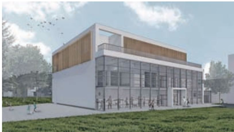
Zunanost, vhod / Projekcija: MOK