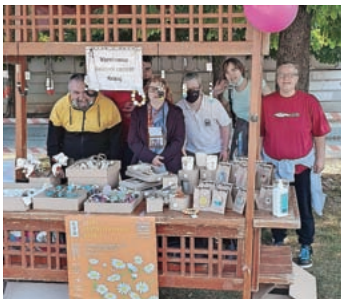
Na stojnici so se predstavili tudi uporabniki Varstveno-delovnega centra Kranj.

Pred dvema letoma so na občini pred športno dvorano na Planini na predlog ravnatelja in Zavoda za šport Kranj na delu parkirišča uvedli kratkotrajno obiskovalcem športne dvorane, šole in vrtca.