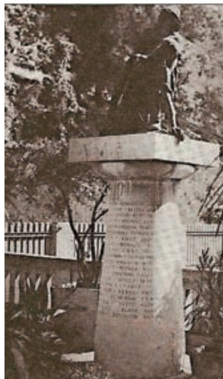
Spomenik padlim delavcem je bil pred tovarno Inteks do leta 2003.