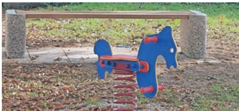
Novo igralo za otroke in klopi za starše