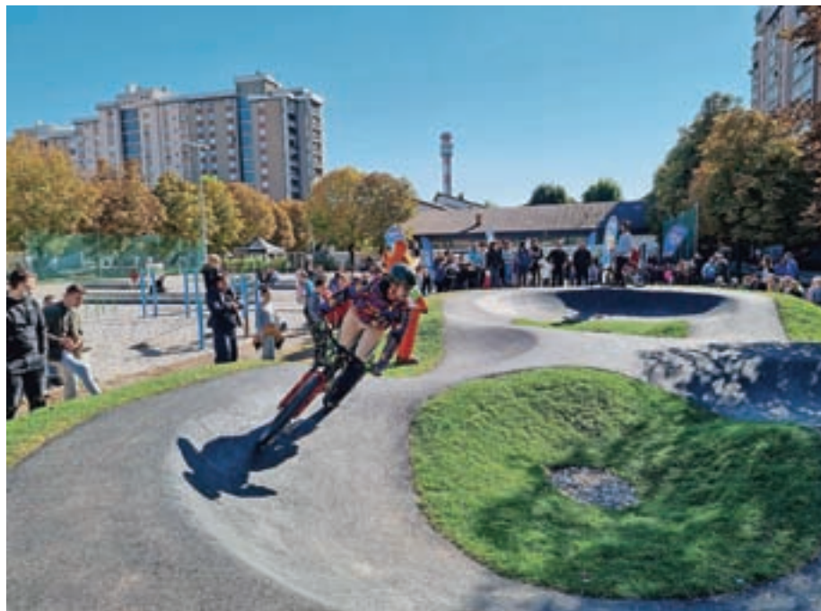
Grbinasti poligoni so v zadnjem obdobju postali zelo priljubljena športna igrišča.

»Grbinasti poligoni so danes zelo atraktivna in priljubljena športna igrišča. Namenjena so tako otrokom in mladim kot odraslim, za rekreacijo ali tekmova-