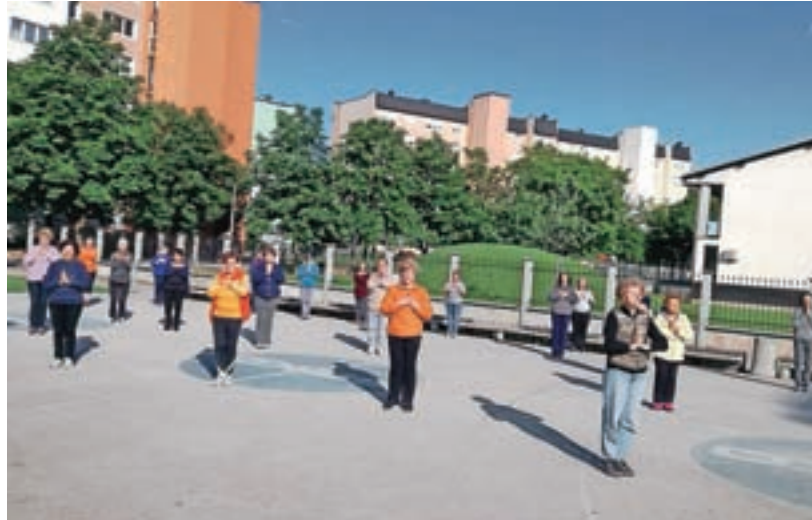
Jutranjo telovadbo zaključijo s t. i. pozdravom soncu.

Društvo Šola zdravja združuje ljudi z namenom izvajanja jutranje vadbe na prostem v vseh letnih časih. Z redno vadbo 1000 gibov krepijo telo in duha, širijo krog znancev, pridobivajo nove prijatelje in se v okviru društva vključujejo v lokalne dogodke. Vadba poteka tudi na igrišču med vrtčevskima enotama Mojca in Najdihojca na Planini, in sicer vsak dan ob 7.30, razen ob nedeljah in praznikih. Izvaja se pol ure na prostem in je namenjen tako starejšim kot mlajšim. »Vadba vključuje vaje za raztegovanje mišic, od prstov na nogah do prstov na rokah, s čimer razgibamo celo telo. Obenem pripomore k fizičnemu in psihičnemu zdravju posameznika in socializaciji, ki je pomemben dejavnik za kakovost življenja. Večinoma se jih udeležujejo starejši, vsak pa lahko telovadi po svojih sposobnostih. Vaje niso težke in so primerne za vsakogar. Trenutno skrbimo tudi za upoštevanje vseh zaščitnih ukrepov, od varnostne razdalje do nošenja mask,« je pojasnila ena izmed vaditeljic Beba Noe in dodala: »Udeležba na vadbi je sicer brezplačna, če pa se posameznik želi včlaniti v društvo, je članarina dvajset