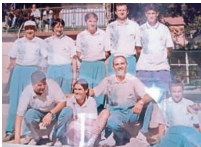
Ekipa Balinarskega kluba Huje je leta 1995 osvojila slovenski pokal Republike Slovenije.

Ob obnovi otroškega igrišča na Hujah je bila zgrajena tudi balinarska steza, ki je takoj postala priljubljena pri stanovalcih Novega doma. Ti so 18. junija leta 1972 ustanovili Balinarski klub Huje. Trinajst let zatem so zaradi sprememb tekmo-