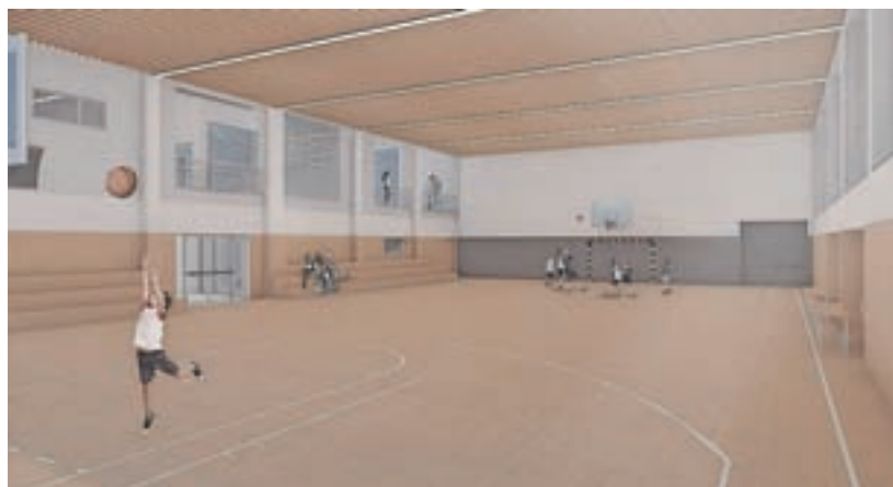
Telovadnica

Kot so še povedali na MOK, je cilj, da se novi prostori predajo v uporabo na začetku šolskega leta 2022/2023. Z dozidavo skoraj ničenergijskega prizidka in zunanjega igrišča ob šoli bodo pokrite potrebe po vpisu otrok v šolo in izvajanju pouka po normativih, so zagotovili na MOK. Poleg tega bodo omogočili športno aktivnost mladih v okolišju, ki ga pokriva OŠ Staneta Žagarja, to je soseska Planina in posredno del nerevitaliziranega območja starega Kranja in Savske ceste.