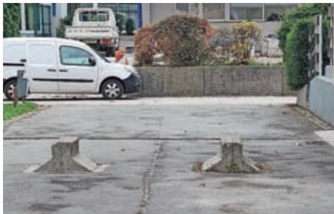
V načrtu je, da bo Komunala Kranj betonski oviri zamenjala z odsevnimi količki.