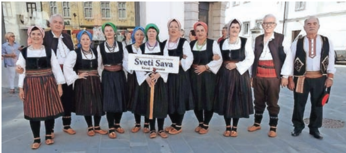
Folklorna sekcija društva je nastopila na prireditvi Pozdrav poletju 2021 v Kranju.

Srbsko kulturno-prosvetno društvo Sveti Sava Kranj je lani zaznamovalo trideset let delovanja. Je najstarejše srbsko društvo v Sloveniji.