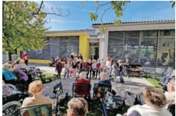
Nastop učencev pred Domom upokojencev Kranj ob mednarodnem dnevu starejših

Najmlajši učenci so s pesmijo in plesom razveselili oskrbovance v Domu upokojencev Kranj ob mednarodnem dnevu starejših. »Čeprav so morali učenci zaradi omejitev program predstaviti pred domom, so bili starostniki navdušeni. Učenci pa so bili na drugi strani nadvse veseli, da so jim polepšali dan. Pomembno je medgeneracijsko sodelovanje, ki ga gojimo že vrsto let,« je poudarila ravnateljica in pojasnila, da udeležba učencev na šolskih tekmovanjih, ki so se doslej izvajala, ni bila tako številna kot v preteklih letih. Nekatera tekmovanja so tudi prestavljena. Šola je vključena v projekt Erasmus+ in kot koordinatorji projekta Cultural festivals (Kulturni festivali) sodelujejo z Grčijo, Madžarsko in Romu-