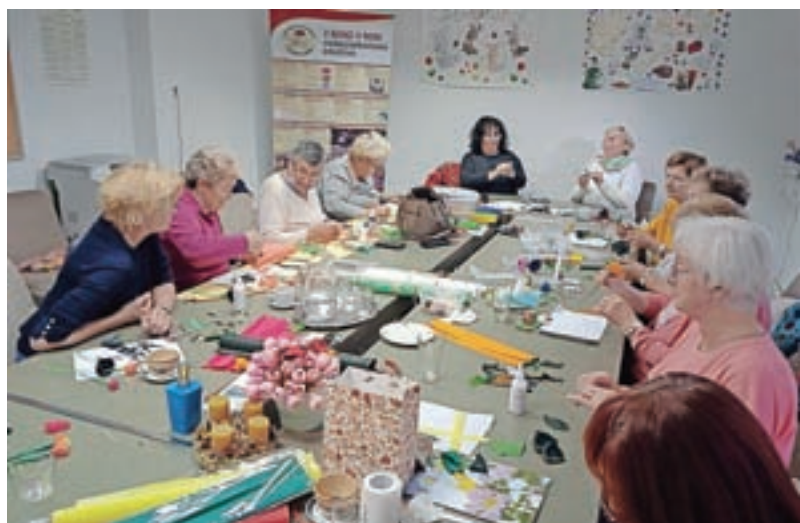
Jeseni so znova lahko organizirali delavnice, na katerih tudi dobre volje ni manjkalo.

V septembru so po skoraj enoletnem premoru začeli pripravljati tombolo, ki jo izvajajo v Medgeneracijskem centru (MC) Kranj. »Tombola je za vse prebivalce Kranja, ne samo za naše člane. Žal je zaradi pogoja PCT število mest omejeno, zato so potrebne predhodne prijave. Vsak mesec poskrbimo za veliko dobre volje in skupaj z MC Kranj tudi za praktične nagra-