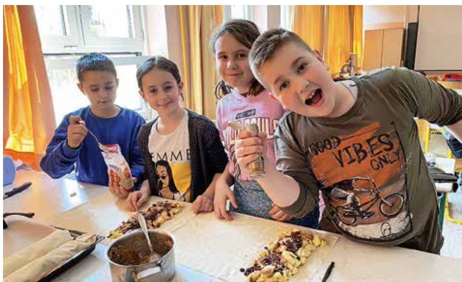
Bilo je tudi zabavno

Na koncu smo se z vsem tem še posladkamo in pomijemo posodo, saj smo v gospodinjski učilnici na naši šoli. Malo pa odnesemo tudi modelarjem, ki so v sosednji učilnici.