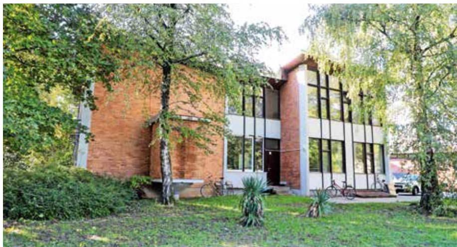
V nekdanji trgovski šoli, iz katere se seli Kovačnica, bodo uredili učilnice za OŠ Jakoba Aljaža.

Na Mestni občini Kranj načrtujejo, da bodo nekdanjo trgovsko šolo obnovili, v njej pa uredili osem učilnic in razdelilnico hrane za potrebe Osnovne šole Jakoba Aljaža. S tem bodo v precejšnji meri rešili težavo velikega pomanjka-