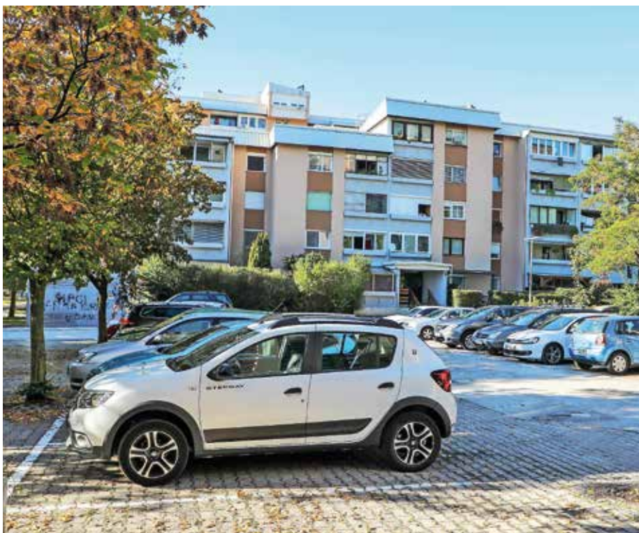
Dodatna parkirna mesta na Planini / Foto: Tina Dokl

»V našem blokovskem naselju, ki je umeščeno pod območje krajevne skupnosti Huje, je bila v prejšnjem stoletju postavljena tržnica. Takrat zaradi naraščajoče potrebe po tovrstni ponudbi, saj se je v sosesko v tistem času začelo