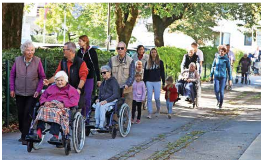
Sprehod za spomin je povezal več generacij, od najmlajših do starejših.

Svetovni dan Alzheimerjeve bolezni (21. september) je Ljudska univerza Kranj (LUK) v sodelovanju z Domom upokoencev (DU) Kranj tudi letos zaznamovala s pridružitvijo mednarodni akciji Sprehod za spomin, s katerim so izkazali podporo bolnikom in njihovim svojcem. Prirejajo ga od leta 2017, pri izvedbi letošnjega pa so se LUK in DU Kranj pridružile še druge demenci prijazne točke v kranjski občini: Mestna občina Kranj, kranjski enoti Centra za socialno delo Gorenjska in Nacionalnega inštituta za javno zdravje, Gorenjske lekarne in Mestna knjižnica Kranj. Udeleženci so se kot običajno sprehodili od medgeneracijskega centra do DU Kranj, kjer so se jim pridružili tudi stanovalci, s katerimi so se skupaj sprehodili okoli doma. Dogodek je privabil številne udeležence, od najmlajših do starejših. »Zdi se nam pomembno, da ljudi in svojce bolnikov ozaveščamo o Alzheimerjevi bolezni, da je potem manj sti-