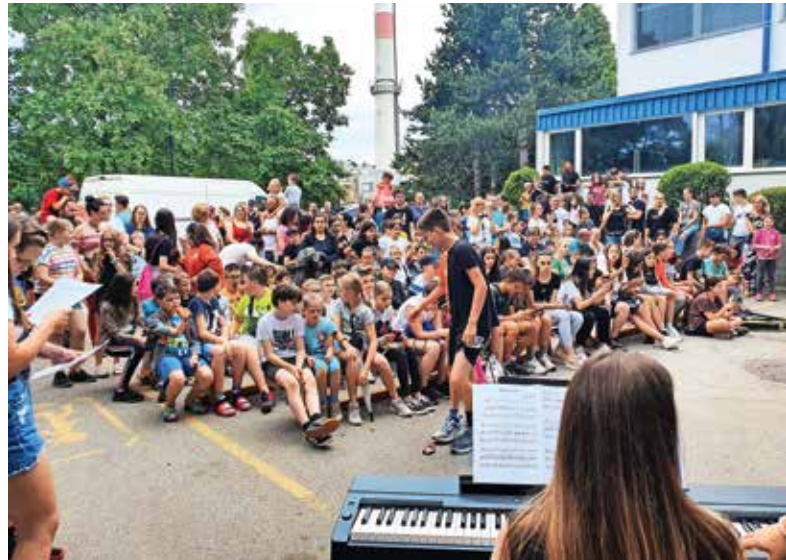
Živahen utrip na Aljažkovem dnevu tudi s številnimi nastopi

Prireditev je tudi letos zelo lepo uspela, za prihodnje leto pa upajmo, da se znova vrne točka Aljažkov talent – in mladi imajo številne talente –, ki je letos ni bilo.