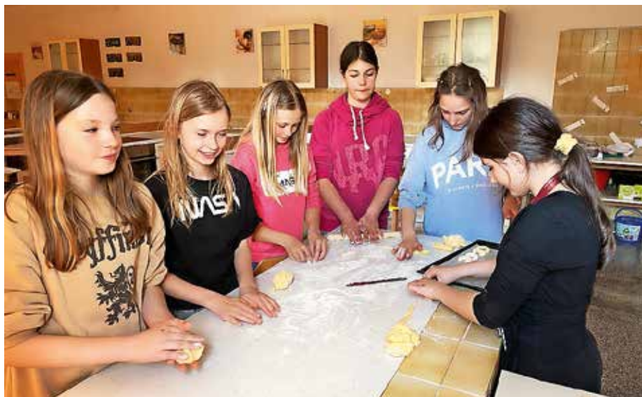
Kuharski krožek na OŠ Staneta Žagarja