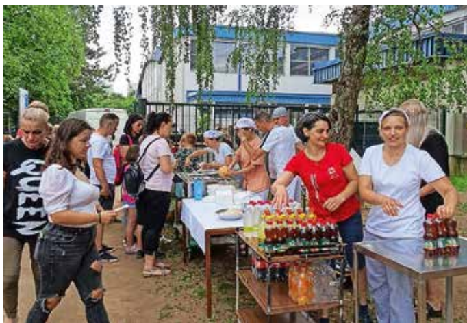
Dobrote iz Aljažkove kuhinje

Tudi tokrat pa je imela prireditev dobrodelni namen. Vsa sredstva, ki so jih zbrali na ta dan s srečelovom, bazarjem in iz prodaje okusnih dobrot iz šolske kuhinje, so namenili ureditvi prijetnih koticov za sproščanje na šoli.