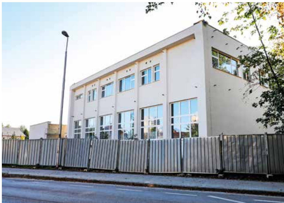
Novi prizidek k Osnovni šoli Staneta Žagarja naj bi v uporabo predali do konca oktobra.

Kot smo že poročali, bodo v novem skoraj ničenergijskem prizidku k OŠ Staneta Žagarja telovadnica, šest učilnic in večnamenski prostor. Prizidek bo z obstoječim šolskim poslopjem povezan s hodnikom, v njem pa bo tudi dvigalo, ki bo omogočilo dostop tudi gibalno oviranim. Objekt bo namenjen izvedbi športne vzgoje in razrednemu pouku, v popoldanskem času pa izvenšolskim dejavnostim, rekreacijskim vadbam in prireditvam. Ker je novi prizidek zrasel na mestu nekdanjega zunanjšega športnega igrišča, so tega prestavili na lokacijo starega montažnega prizidka k šoli,