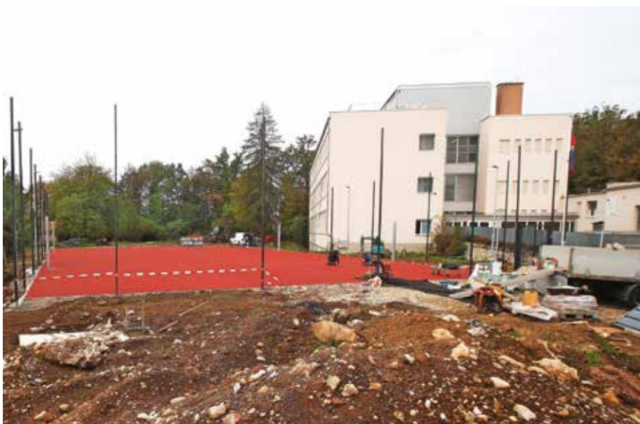
Na mestu nekdanjega montažnega prizidka že urejajo novo zunanje igrišče.

Vrednost investicije je ocenjena na 3,15 milijona evrov, od tega Republika Slovenija in Evropska unija iz Evropskega sklada za regionalni razvoj sofinancirata skupno 1,44 milijona evrov, preostali del pa bo zagotovila Mestna občina Kranj.