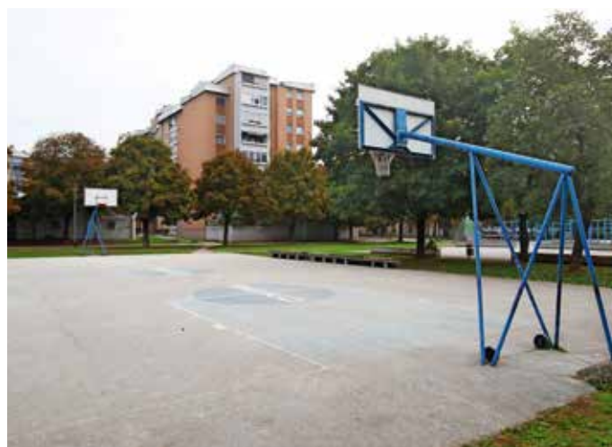
Športno igrišče na Planini / Foto: Gorazd Kavčič

Na glasovanju je sicer bilo 86 projektov predlogov za 26 krajevnih skupnosti. V vsaki krajevni skupnosti bodo izvedli izglasovan projekt (ali več projektov) v skupni vrednosti do 24 tisoč evrov (z DDV), ki izpolnjuje tudi dodatne pogoje. Ti so, da