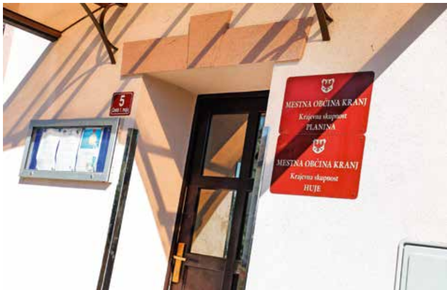
Krajevni skupnosti Planina in Huje že zdaj delujeta v istih prostorih.

Mestni svetniki so soglasje k razpisu posvetovalnega referenduma sprejeli že maja letos. Predlagala sta ga sveta krajevnih skupnosti Planina in Huje, ki menita, da je zaradi uresničevanja skupnih interesov in ciljev smiselno in rentabilno pristopiti k združitvi krajevnih skupnosti. Krajevni skupnosti sicer že zdaj delujeta v istih prostorih, skupaj praznujeta krajevni praznik, med