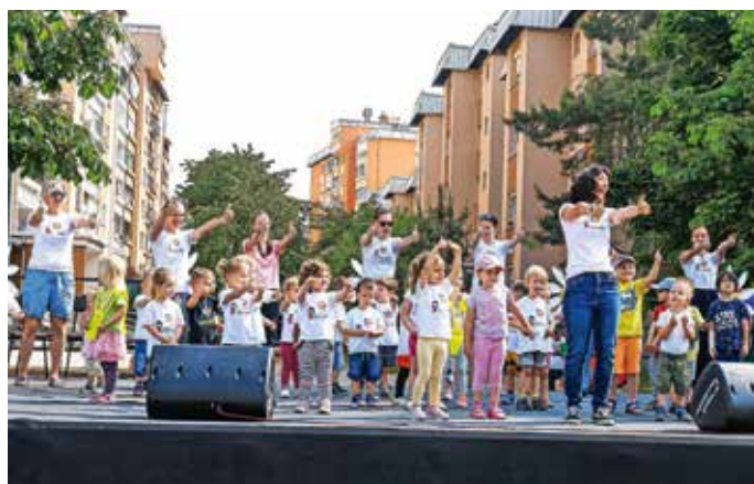
Na Paradi učenja na Planini v Kranju so nastopili tudi najmlajši.

Tedni vseživljenjskega učenja (TVU) so letos spomladi potekali že 27. leto zapored ob podpori ministrstva za izobraževanje, znanost in šport. So najvidnejša promocijska kampanja na področju izobraževanja in učenja v Sloveniji. Projekt usklajuje