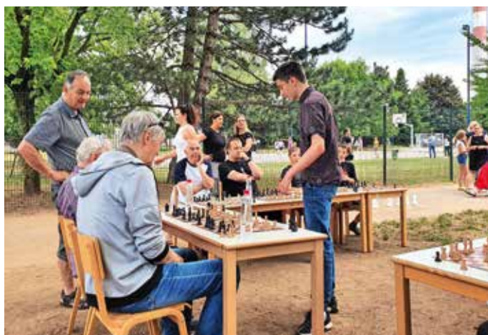
Šahovski izziv za stare in mlade