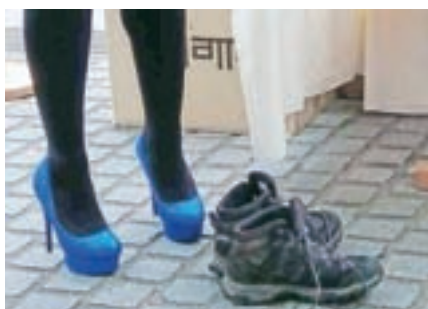
Izbira na izmenjevalnici je zelo pestra.