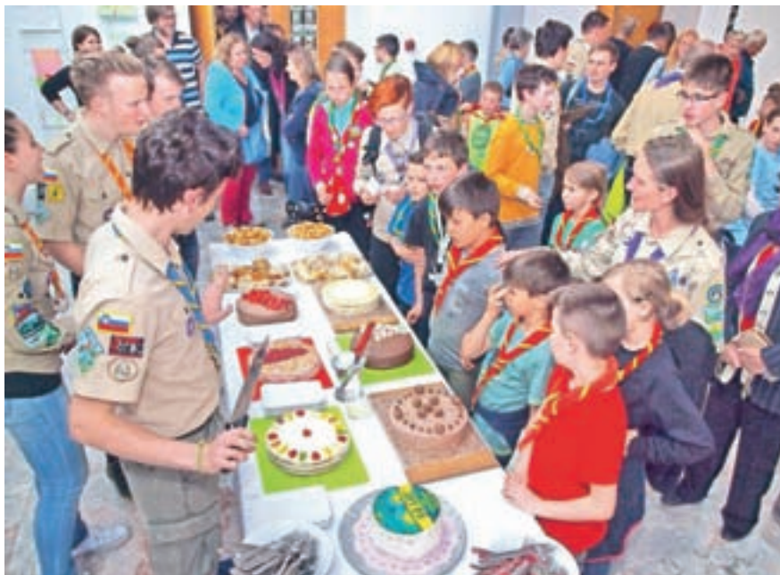
S prireditve ob 65-letnici delovanja društva v Sokolskem domu