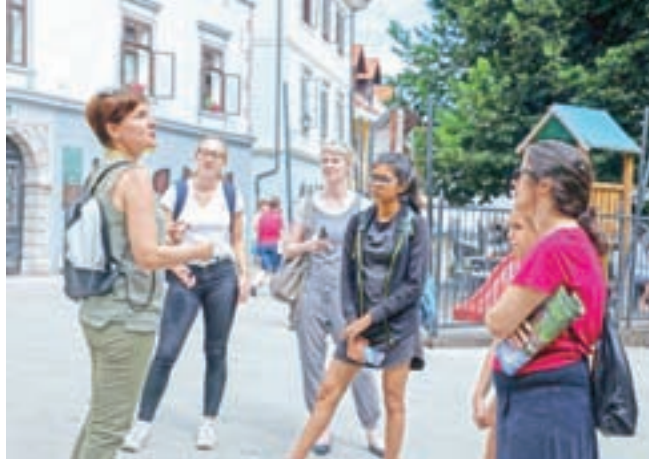
Turisti med odkrivanjem skrivnosti tisočletnega mesta (fotografija je simbolična).