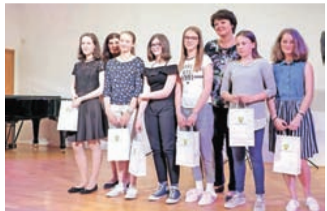
Nagrajene mlade raziskovalke