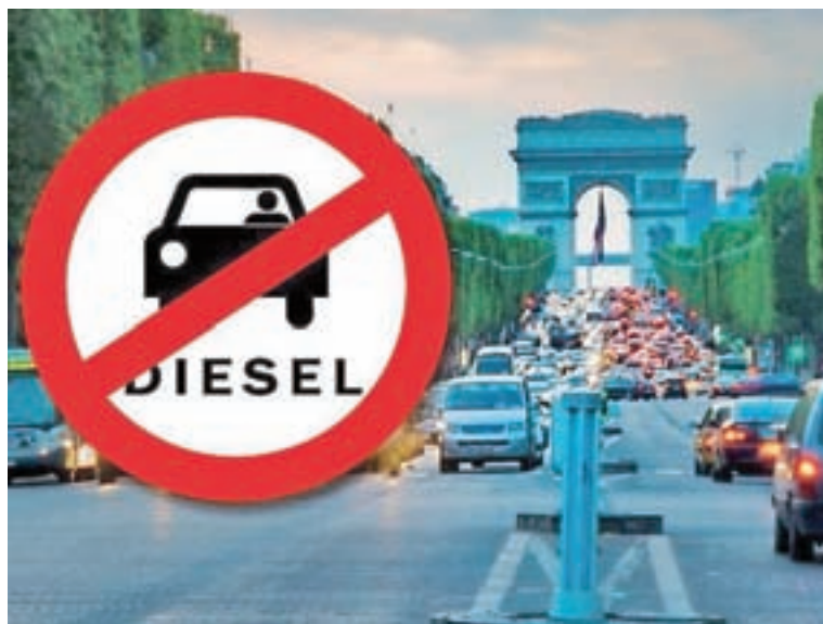
Prepoved vožnje z »dizli« – glavni problem so stari avtomobili.

Pa se "dizlu" dela krivica? Vsekakor, pravijo zagovorniki, saj so "dizli" danes bistveno čistejši. Medtem ko nekateri proizvajalci "dizle" postopoma opuščajo (Nissan na primer napoveduje ukinitve prodaje "dizlov" na evropskem trgu do leta 2025, Toyota je že z uvedbo priusa leta 1997 naredila prvi korak k cilju ukinitanja dizelskih motorjev, danes pa "dizla" v osebnih avtomobilih nimajo več), pa tradicionalni zagovorniki "dizlov", kot je Volkswagen, tem napoveduje manj črno prihodnost. Novi dizelski motorji, ki prihajajo na trg, so izjemno varčni in imajo bistveno manjše emisije, celo manjše kot primerljivi bencinski. Z meritvami so že dokazali, da so dizelski motorji čistejši od bencinskih. "Dizli" morajo biti že nekaj časa opremljeni s filtrom trdih delcev, medtem ko bencinske motorje to še čaka. Pravzaprav lahko zapišemo, da sta tako bencinski kot dizelski motor danes že zelo čista in da se "dizlu" neupravičeno dela krivica. Vsaj v teoriji je danes dizelski motor že čistejši od bencinskega. Pozabljamo, da na izpuste močno vplivajo tudi starost in stanje avtomobila, način vožnje, prtljažniki ipd.