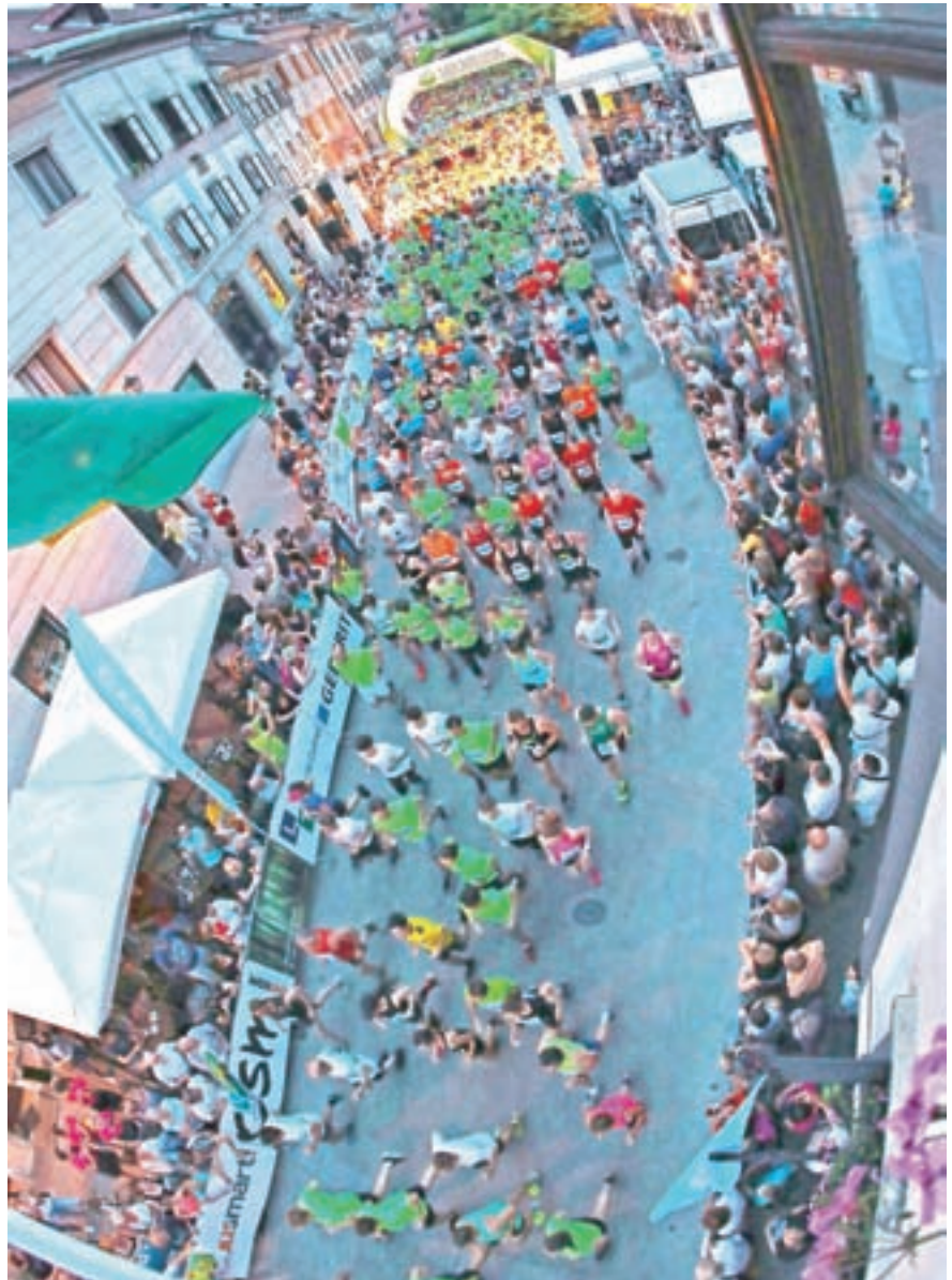
Vrhunec je bil nočni tek na deset kilometrov. Mestni trg so preplavili tekači.

Po popoldanskem teku osnovnošolcev je sledil večerni vrhunec: nočni tek na deset kilometrov, na katerem je nastopilo skoraj 1300 tekačic in te-