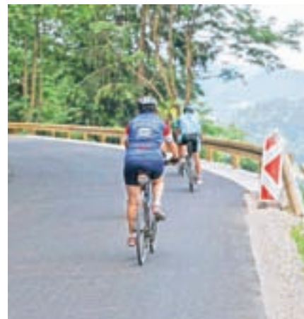
Vojaška cesta je med Pahucem in Nacetom po obnovi ena najlepših hribovskih panoramskih cest v državi.

Etapno so v treh letih rekonstruirali petstometrski odsek Pahuc–ovinek (vrednost je znašala 50 tisočakov), sanirali tri plazove (vrednost 1162 tisoč evrov), razširili ovinke, uredili odvodnjavanje in dogradili mulde, asfaltirali območja plazov, uredili križišča in priključke, položili asfaltne zaplate, postavili zaščitne ograje (v skupni vrednosti 60 tisočakov). Za sanacijo najobsežnejšega od treh plazov so z ministrstva za okolje in prostor dobili 70 tisoč evrov nepovratnih sredstev.