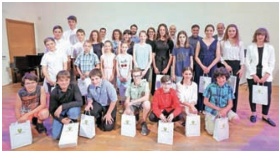
Najboljši na glasbenih tekmovanjih

Štirideset učenk in učencev je prejelo zlata priznanja, na županovem sprejemu so se zahvalili tudi dvajsetim njihovim mentorjem. Prva tri mesta na državnih tekmovanjih je doseglo devet učenk in učencev, pri tem so imeli pomoč treh mentorjev, priznanja pa je prejelo tudi šest raziskovalcev z dve-