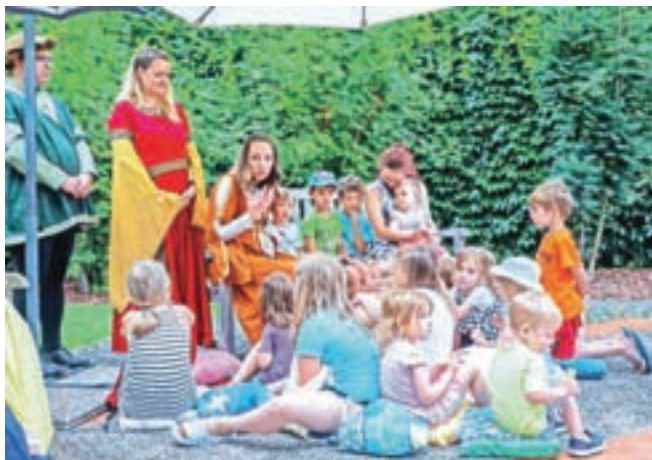
V vrtu občine so otroci lahko prisluhnili pravljicam.

valce festivala. Loško preteklost pa so obudili tudi skozi prikaze starih obrti, kulinariko ter staro glasbo, plesne in legende. Živahno sejmsko dogajanje so pričarali prodajalci na stojnicah s ponudbo izdelkov domače in umetnostne obrti. Obiskovalcem so ponudili tudi jedi s poudarkom na loški kulinarčni dediščini, med drugim je bilo pri stojnici Prosvetnega društva Sotočje mogoče poskusiti loško medlo. Vrt Občine Škofja Loka so zaposleni iz Vrtca Škofja Loka spremenili v pravljичni kotiček, kjer so otroci lahko prisluhnili zanimivim pravljicam, plesno dediščino minulih stoletij pa so s svojimi nastopi oživili člani Kulturnega društva Lonca. Spoznati je bilo mogoče viteški red Jurija in Volka Engelberta Turjaškega iz Žužemberškega gradu, ki deluje pod okriljem Turističnega društva Suha krajina iz Žužemberka, iz pobratenega mesta Tabor pa so letos na Historialu gostili novo skupino Aurum, ki je prikazala mečevanje in vihtenje zastav ter se obiskovalcem predstavila tudi v viteškem taboru na travniku pod Loškim gradom. Cankarjev trg so zavzeli rokodelci iz vse Slovenije. Predstavili so se namreč člani Konzorcija rokodelskih centrov Slovenije prek prikaza svojih znanj in izdelkov. Spoznati je bilo mogoče tudi tradicionalne rokodelske veščine s po-