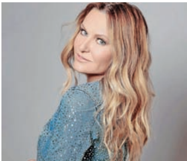
Nuša Derenda

Na Soriški planini bodo tretjo soboto v juliju v okviru Poletne noči na Soriški planini na odru pod zvezdami oživili zlate čase Slovenske popevke.