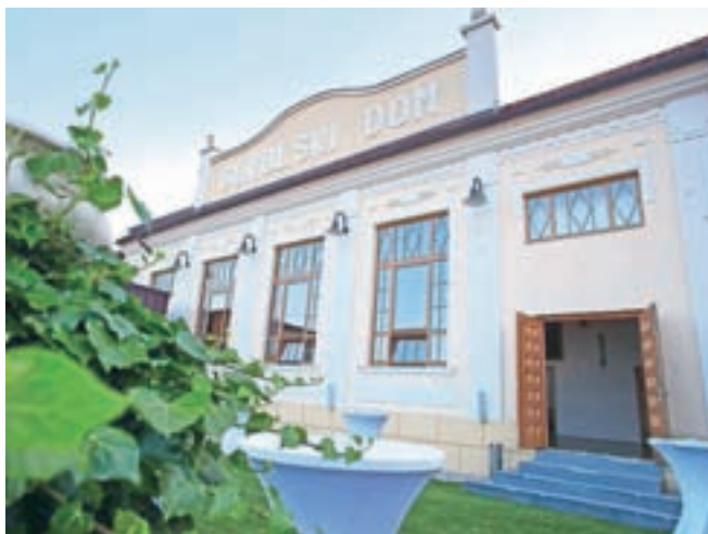
Letos mineva sto let od začetka gradnje Sokolskega doma.

Začetki Sokolskega doma, kot že njegovo ime pove, so povezani s sokolstvom in segajo v leto 1906, ko so ustanovili telovadno društvo Sokol. Leta 1919 so člani sprejeli sklep o gradnji nove dvorane, ki so jo slovesno odprli leta 1922. Tako so si zagotovili prostor za športno udejstvovanje, v njej pa so se odvijala tudi predavanja, gledališke predstave, izposoja knjig ter vaje trobentačev, orkestra ter pevskega in tamburaškega zbora. Med drugo svetovno vojno je okupacijska oblast razpustila sokolske organizacije in tako je zamrlo tudi živahno dogajanje v Sokolskem domu. Znova so ga oživili po vojni, ko so se sokolske organizacije