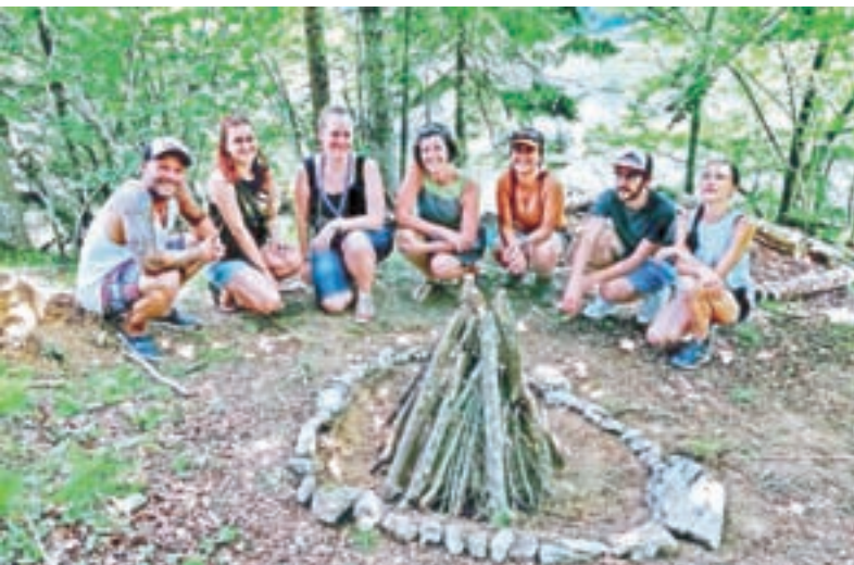
Sestanek mentorjev v Kočevski Reki