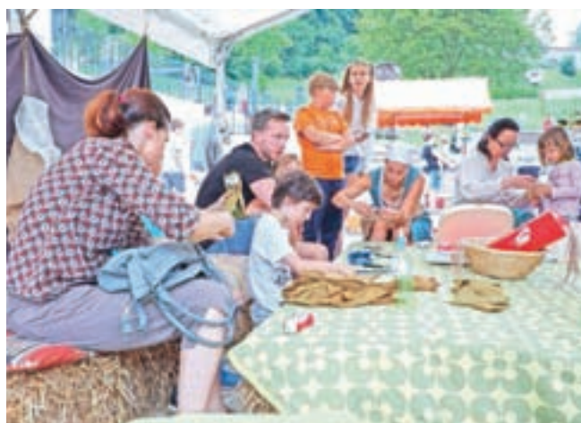
Prizorišče na Trgu pod gradom je bilo namenjeno otrokom.

udarkom na izdelavi lokov in puščic. Pestro dogajanje so škofjeloške ustvarjalke iz Kreativnega centra Kreativnice pričarale tudi na Spodnjem trgu. Med drugim so si obiskovalci lahko ustvarili svojo unikatno bombažno vrečko ter si ogledali barvanje volne z rastlinami in predenje volne na kolovrat ter ročno polstenje klobukov. Pripravili so še pisan nabor spremljevalnih dogodkov. Med drugim so omogočili prost vstop v galerije, po ugodnejši ceni si je bilo mogoče ogledati zbirke v Loškem muzeju, ves dan je bila za obiskovalce odprta Špitalska cerkev, kjer so se učenke Glasbene šole Škofja Loka predstavile tudi s koncertom baročnih sonat za flavto. Pripravili so dve brezplačni vodenji, po Spodnjem trgu in po Romualdovi poti. Na vodenem interaktivnem ogledu Romualdove poti je bilo mogoče spoznati pasijonsko zgodbo in odkrivati zgodovinske zaklade Škofje Loke, obenem pa doživeti sodobno izkušnjo Škofjeloškega pasijona ob živi pripovedi patra Romualda. S svojimi nastopi je obiskovalce na različnih lokacijah v mestnem središču navduševal še violinski duo Terrafolk, dogajanje pa je v večernih urah s svojim nastopom zaokrožil orkester ljudskih ruskih inštrumentov Nekrasov.