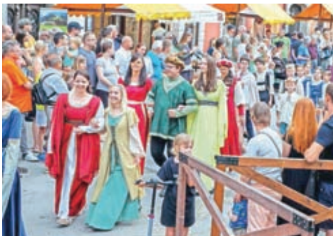
Meščani v historičnih oblačilih so se v sprevodu sprehodili skozi mesto.

valce festivala. Loško preteklost pa so obudili tudi skozi prikaze starih obrti, kulinariko ter staro glasbo, plesne in legende. Živahno sejmsko dogajanje so pričarali prodajalci na stojnicah s ponudbo izdelkov domače in umetnostne obrti. Obiskovalcem so ponudili tudi jedi s poudarkom na loški kulinarčni dediščini, med drugim je bilo pri stojnici Prosvetnega društva Sotočje mogoče poskusiti loško medlo. Vrt Občine Škofja Loka so zaposleni iz Vrtca Škofja Loka spremenili v pravljичni kotiček, kjer so otroci lahko prisluhnili zanimivim pravljicam, plesno dediščino minulih stoletij pa so s svojimi nastopi oživili člani Kulturnega društva Lonca. Spoznati je bilo mogoče viteški red Jurija in Volka Engelberta Turjaškega iz Žužemberškega gradu, ki deluje pod okriljem Turističnega društva Suha krajina iz Žužemberka, iz pobratenega mesta Tabor pa so letos na Historialu gostili novo skupino Aurum, ki je prikazala mečevanje in vihtenje zastav ter se obiskovalcem predstavila tudi v viteškem taboru na travniku pod Loškim gradom. Cankarjev trg so zavzeli rokodelci iz vse Slovenije. Predstavili so se namreč člani Konzorcija rokodelskih centrov Slovenije prek prikaza svojih znanj in izdelkov. Spoznati je bilo mogoče tudi tradicionalne rokodelske veščine s po-