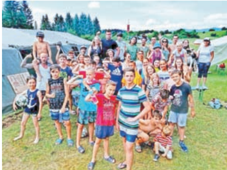
Na taboru se letos družijo petdeset mladih.

Od 26. julija do 31. avgusta bo MDC Blok odprt le za učno pomoč in individualno svetovanje po vnaprej dogovorjenem urniku.