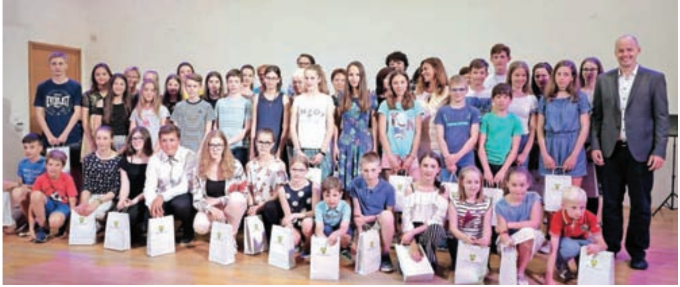
Dobitniki zlatih priznanj na tekmovanjih iz znanja