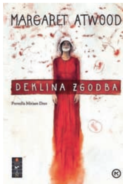
Naslovna stran ponovne izdaje romana Deklina Zgodba , Margaret Atwood (Mladinska knjiga, 2017)

Na vprašanje, kako tako naročilo vključuje v kontekst svojega avtorskega slikarstva, s katerim je v zadnjih