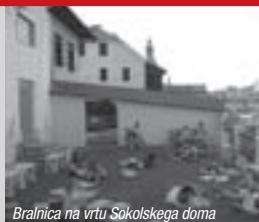
Bralnica na vrtu Sokolskega doma