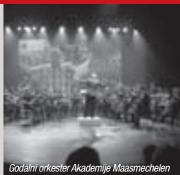
Godalni orkester Akademije Maasmechelen

Od 19. 6. do 28. 8. Bralnica na vrtu Sokolskega doma (od torika do nedelje, od 17.00 do 20.00)