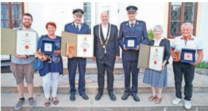
Letošnji občinski nagrajenci

Kar enaintrideset prostovoljk in prostovoljcev dostavi glasilo vsem 2300 članom na dom. Prostovoljstvo se izraža tudi v finančni obliki, saj člani prispevajo za tisk glasila.