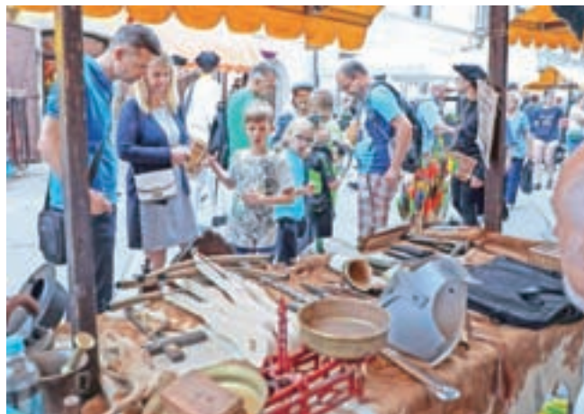
Sejem je bil tudi letos živ.