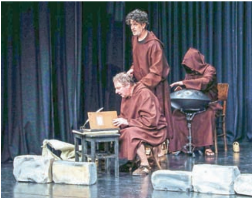
Osrednji dogodek je letos predstavljala dramska igra Romuald – loški kapucin.

vih uprizoritev, ki so se v obliki procesije na veliki petek odvijale vsako leto po mestnem jedru, je še kar nekaj nerešenih ugank. Letos igralcem vreme ni bilo naklonjeno, zato so vse tri uprizoritve pripravili na Loškem odru, čeprav je bilo sprva predvideno, da bosta dve ponovitvi na glavnem odru na Mestnem trgu. Dež je ponagajal tudi mladim gledališčnikom iz škofjeloških osnovnih šol, ki so pripravili gledališke predstave na Trgu pod gradom. Omenjeni trg je bil sicer tudi letos namenjen otroškemu programu. Otroci so lahko prisluhnili starim loškim pripovedkam in ustvarjali v rokodelskih delavnicah. Med drugim so izdelovali kapucinarčke – figurice kapucinarjev iz filca, papirja in stiroporja ter preprosta oblačila s kapuco.