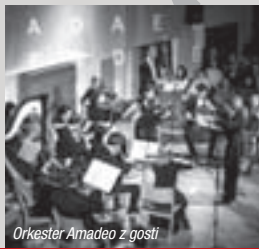
Orkester Amadeo z gosti